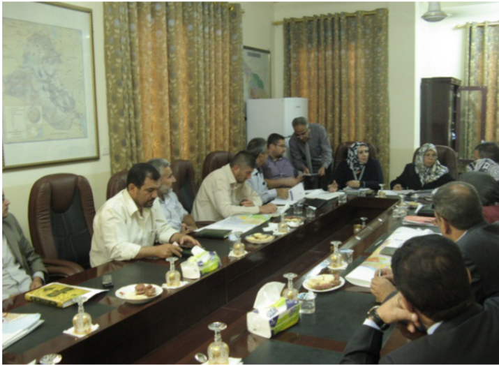
اعضاء مجلس قضاء المسيب ينتظرون النقاش على اعتراضات مثلي ناحية سدة الهندية

قائممقام الخالص يطلب زيارة خاصة للاستراحة والاستجمام: بعد عرض البدائل التصميمية لمدينة الخالص بشكل خاص على القائممقام طلب امهاله عدداً من الأيام قبل أن يقرر آياً من البدائل يختار لاعتماده في اعمال المرحلة النهائية . وقبل اتخاذ القرار المناسب بذلك ، طلب القائممقام وأعرب بشكل غير رسمي عن رغبته في زيارة مدينة السلممانية واعتبار ان الاجتماع والدراسات تتم في ذلك الصيف لمدة 4 أيام وأن يتم حجز غرف للخبراء والمستشارين في فنادق المدينة مع الحماية المرافقة له واعتبار ان الاجتماع والدراسات تتم في السلممانية . أخرجنا ذلك الطلب وبعد التناور مع شركائنا ، اتفقنا وان لم يكن أمراً تعاقدياً ، على تلبية الطلب كحظر فاهر . على أن لا تكون مسؤولين عن الحماية وأسلحتها عند الدخول الى منطقة كردستان . فوجئنا في نفس الوقت بالآخبار المحلية من صدور أمر رسمي من رئيس الجمهورية بالغاء القبض وتوقيف القائممقام الخالص لأسباب لا نعرفها . إلا اننا فوجئنا أكثر عند علمنا بأن أمر الرئيس له شأن آخر في تلك المنطقة ( لا تؤخذ بنظر الاعتبار كامور جديّة ) وان محافظ ديالى قد أمر باستمرار المشروع والغاء موضوع الإيفاد الى السلممانية. هكذا كانت بعض ظروف العملية تستمر في المشاريع أحياناً في تلك السنوات الصعبة .