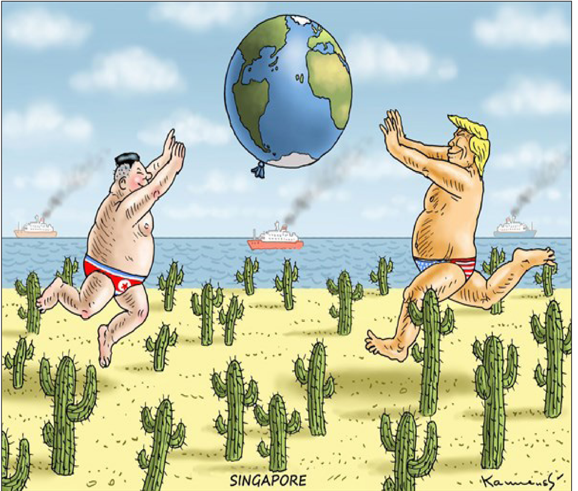
عن موقع «كارتون سياسي»