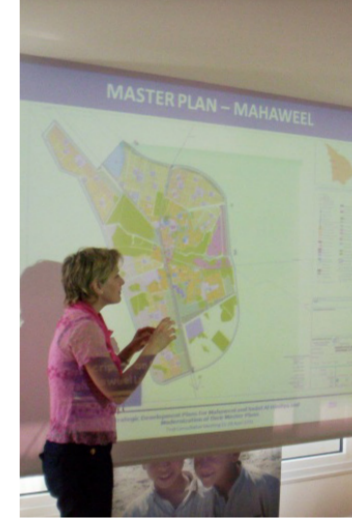
احدى خبيرات SGI

الافتتاح على أعمال أوسع بدأت محافظات العراق تعمل على تنفيذ مشاريعها بموجب برنامج تنمية الاقاليم الذي انطلق اواخر عام 2005 بقرار من الامانة العامة لمجلس الوزراء وهو البرنامج الذي يخصص بموجبه جزء من واردات النفط الى المحافظات في ضوء نفوس المحافظة وضوابط تنمية اخرى . والتي تخول مجالس المحافظات بالتعاقد مع الاستشاريين أو الممولين لتنفيذ مشاريع المحافظة . ولذا بدأت بعض الدوائر التخطيطية في المحافظات الاتصال بنا كاستشاريين طالبين الاشتراك في مناقصات وضع التصميم الأساسية لمدن في محافظاتهم . تبينت الأراء في مكتبنا حول كفاءة وامكانية المحافظات فنياً من توجبه أعمال المشاريع والعقود مقارنة مع مستويات العمل في التخطيط العمراني في وزارة البلديات... وهل لدى مهندسي المحافظات خبرة تخطيطية للتعاون معنا لجاز اعمالهم ؟