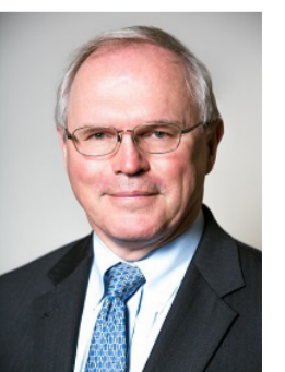
كريستوفر هيل مساعد وزير الخارجية الأميركية السابق لشرق آسيا

بدا أن القمة الرمزية في سنغافورة بين الرئيس الأميركي دونالد ترامب والزعيم الكوري الشمالي كيم جونج أون معلقة بحيط واهية، ما تزال المحادثات جارية لكن الكوريين الشماليين عبروا عن أفكار أخرى. وذلك بسبب تصريحات إدارة ترامب التي تشير إلى أنه من المتوقع أن تصبح كوريا الشمالية خالية من الأسلحة النووية مقابل وعد الولايات المتحدة بتخفيف العقوبات.