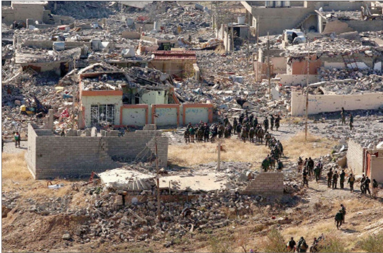
نازحون ايزيديون عائدون الى مناطقهم في سنجار