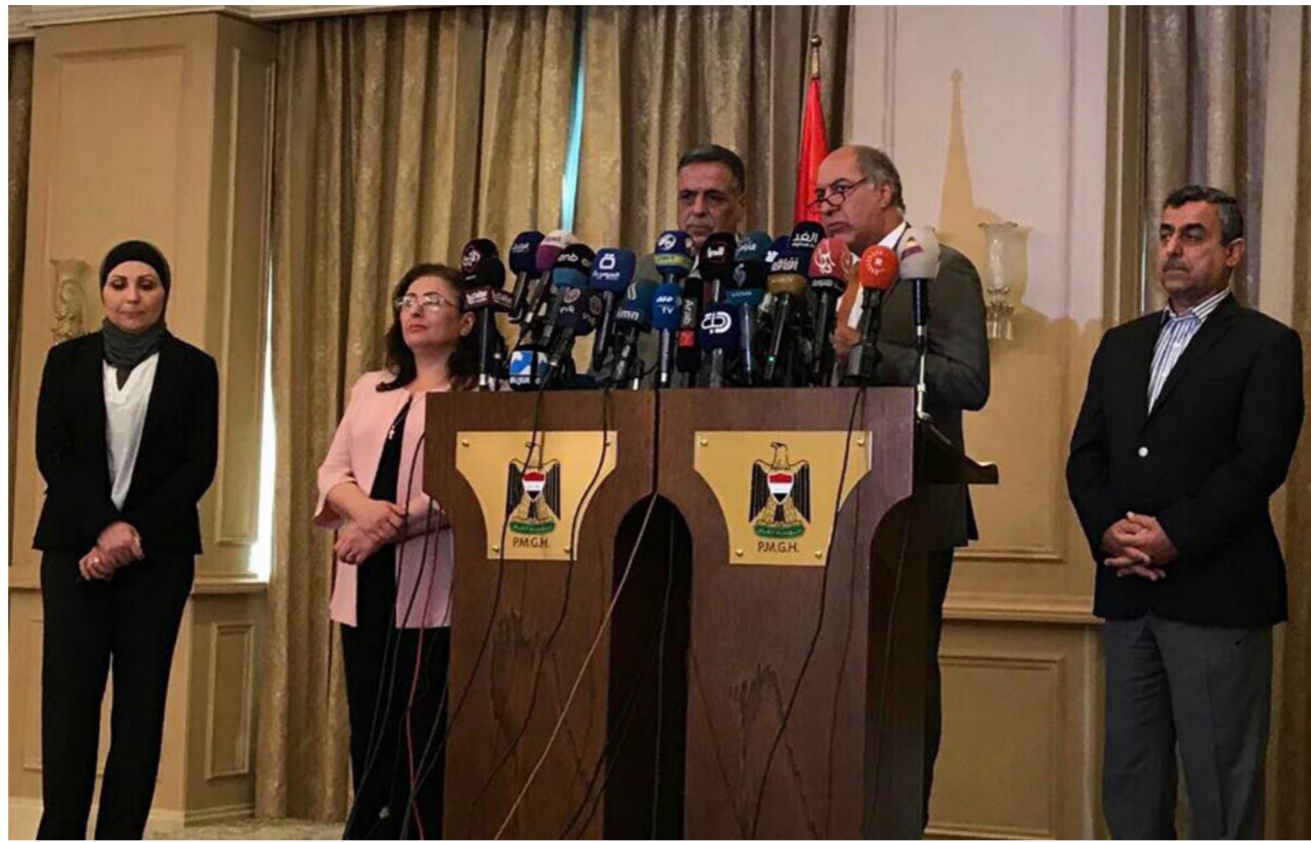
وزير الكهرباء في مؤتمر صحفي