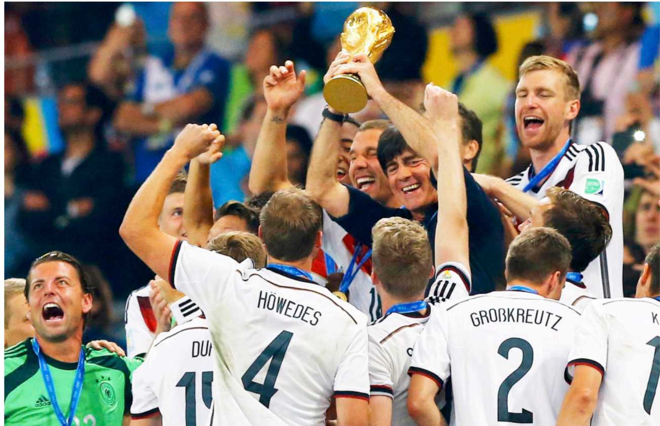
لاعبو ألمانيا ولوف يحملون كأس العالم 2014

ومنذ قدوم لوف إلى المنتخب الألماني. أصبح منتخب ألمانيا. يتمتع بصدرات عالية وأداء منضبط وفتي جميل. على أرضية الملعب. ما ساعده على حصد لقب مونديال 2014. على