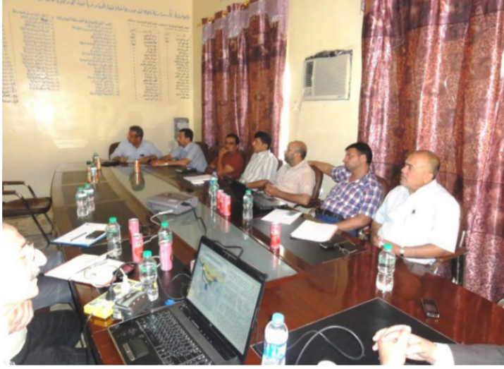
اعضاء بلدية مدينة واسط في اجتماع لشرح تفاصيل توسيع المدينة

التصميم الأساس لسكان المدينة لمدة شهرين بموجب القانون حيث يقدم المواطنون في كل مدينة ما يعترضون عليه من مقترحات تصميمية . جمع المقترحات وتقوم بتعديل التصميم ان كانت المقترحات ايجابية وبعدما يطبع التقرير النهائي للتصميم الأساس والخارطة النهائية كيما يصادق عليها مجلس المدينة والمحافظ والوزير . لقد كانت حقا عمليات مكثفة وعديدة ان مدى سنوات إلا انها زادتنا خبرة اجزا خلال هذه السنوات التصميم الأساس للمدن المتعاقدة عليها وقدمت خرائطها النهائية ولم يصادق عليها نهائياً لأن فترة الشهرين المختصة للاعلان غير داخله ضمن المدة التعاقدية . لذا تتم المصادقة على قبول الدراسات والمقترحات بشكل خارطة التصميم لفائدة المدينة بوجوده في مجلس قضاء الحامول رفض تصديق التصميم المالم تتم الموافقة على ادخال الحمية ضمن تخطيط المدينة . تكونت لدينا قباعة بأن هذا الطلب قد يكون مدفوعاً باتجاه فائدة شخصية . ولا توجد حاجة أو ضرورة الحمية الطبيعية داخل التصميم الأساس للمدينة . أصر هذا المواطن وعطل المصادقة على التصميم لأشهر حتى تدخل وزير البلديات وحسم الموضوع باهمال طلب المواطن.