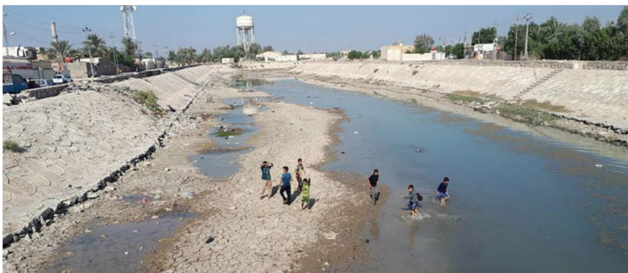
جانب من نهر دجلة على الأراضي العراقية

الأزمة، برغم أن تركيا بدأت ببناء السد منذ عدة سنوات، من دون اتخاذ التدابير اللازمة لمواجهة ذلك. في حين ذهب آخرون الى اطلاق حملة دعوا خلالها إلى مقاطعة البضائع التركية والأيرانية التي تغزو الأسواق المحلية في العراق. مطلقين هاشتاغ "خلوها تخيس" العراق عطشان، دجلة يحتضر الماء مقابل الاستيراد، ومن جانبه، قال وزير الموارد المائية حسن الجنابي في مؤتمر صحفي إن "الضغوط المفتوحة بين العراق وتركيا كفيلة بحل قضية أزمة المياه وإيجاد حلول لها، كاشفا عن زيارتين قريبتين إلى كل من تركيا وإيران إلى الأمانة، داعيا المواطنين إلى زيادة خزن المياه داخل منازلهم لمواجهة الأزمة". وفي الموصل قال مصدر في مديرية الماء هناك أمس الأحد، بأن نهر دجلة بدأ بالجفاف بشكل ملحوظ، مشيراً إلى حاجة المحافظة لخزّن أبار ارتوازية، وقال المصدر إن "استمرار تركيا في تخزين مياه النهر في سدها لمدة 72 ساعة سيتسبب بأزمة مياه".