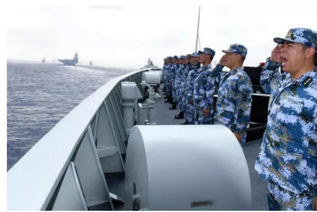
قوات بحرية تابعة للجيش الصيني

الأميركي جيمس ماتيس بكين بـ "ترهيب" الدول المجاورة. من خلال نشرها منظومات دفاعية متطورة في جزر اصطناعية في بحر الصين الجنوبي المتنازع عليه. محذرا من أن واشنطن "ستتفاس بقوة" إن اقتضت الحاجة. لكن بكين دافعت عن "حق سيادي وقانوني في نشر جيشها وأسالتها" في أرأض تعتبر أنها تابعة لها.