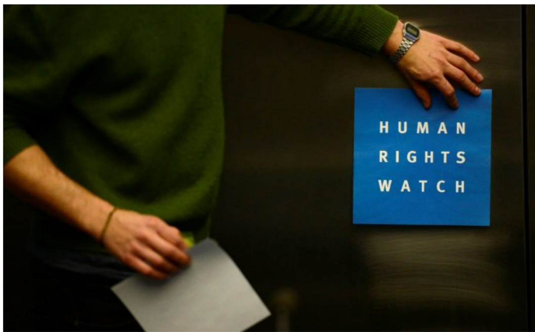
تضارب المواقف بين الحكومات الأوروبية ومنظمات مدنية بشأن عائلات داعش

ويابغت إعلان أردوغان تقديم موعد الانتخابات، التي كانت