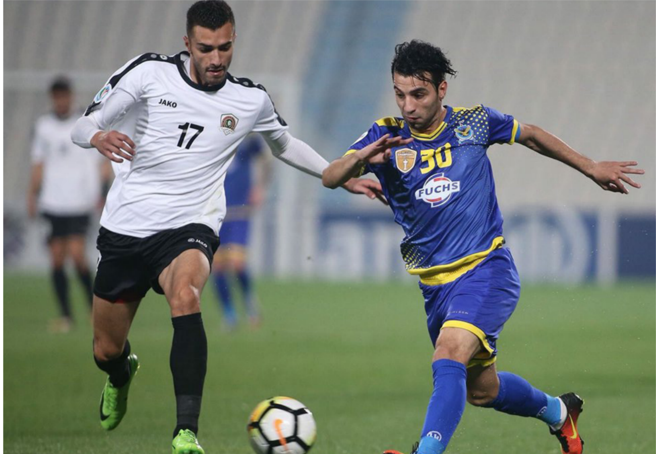
الجوية في مباراة سابقة ضمن بطولة كأس الاتحاد الآسيوي

في الثانية الميناء مع الديوانية. فسي ملعب جنح النخلة. بالمدينة الرياضية في البصرة. ويلتقي في الثالثة الزوراء مع البحري في ملعب الشعب.