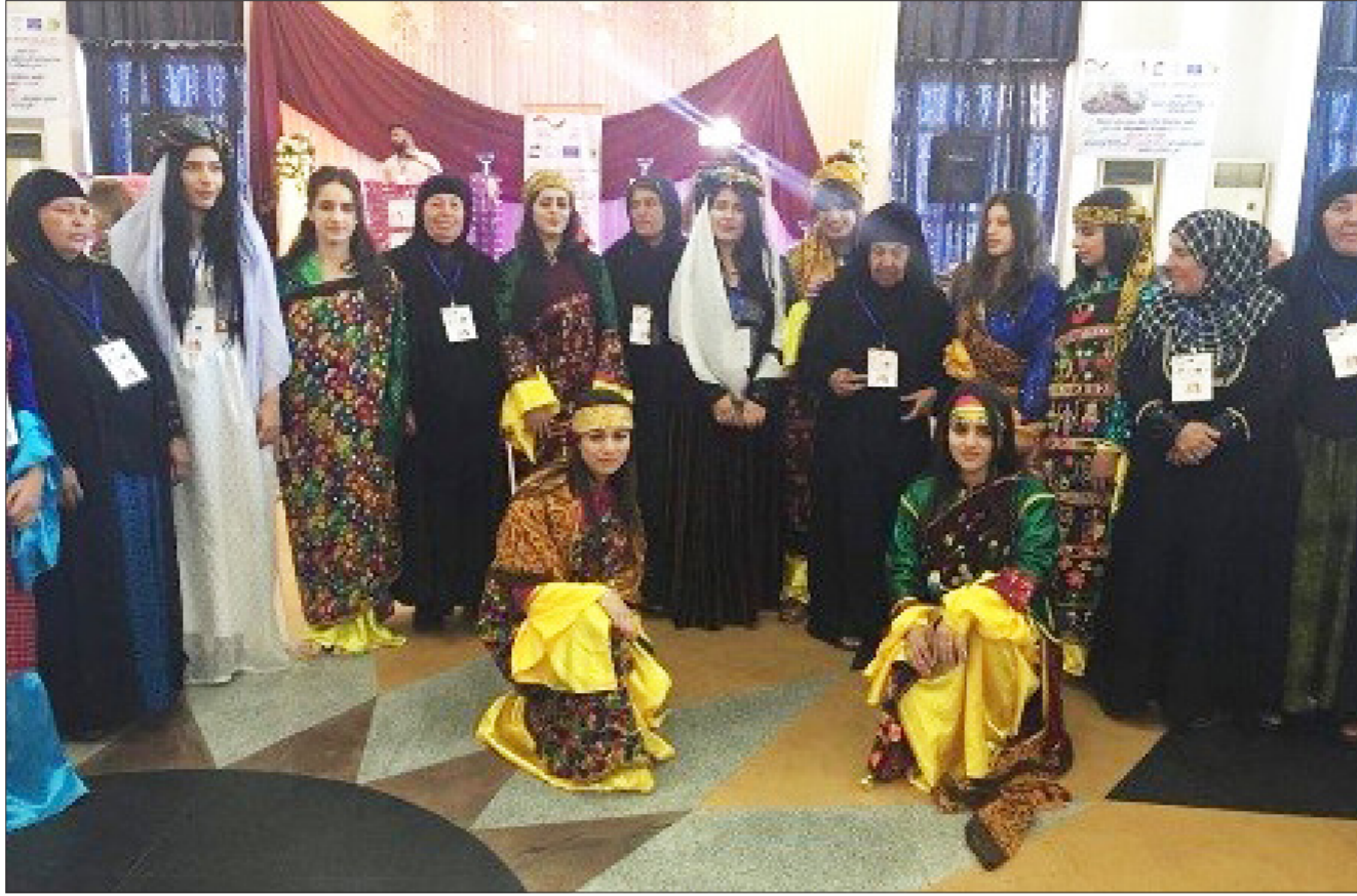
المشاركين في المهرجان