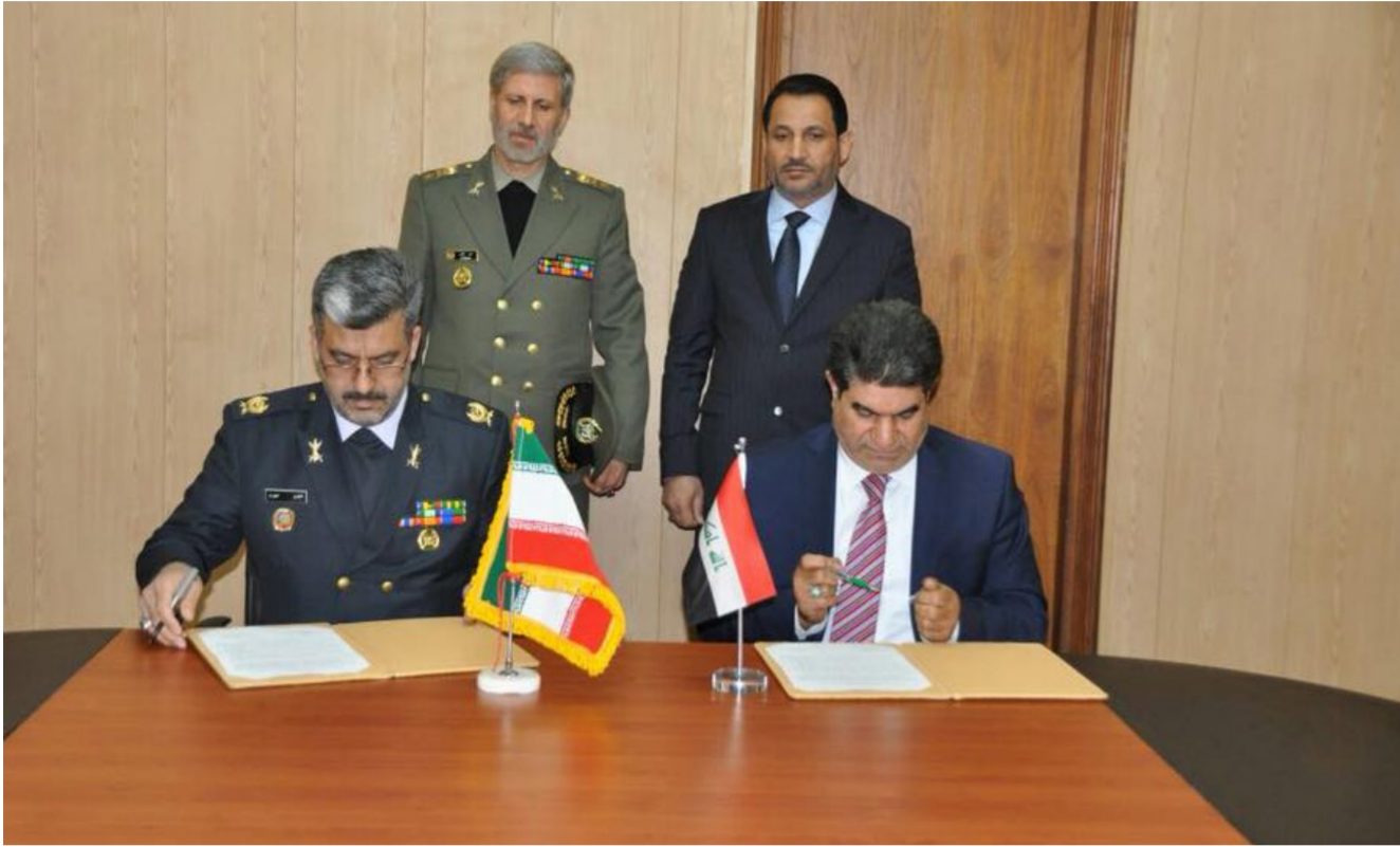
جانب من توقيع الاتفاقية

وتوسيعها ومشروع الدفع الإلكتروني المسبق وتوسيع شبكة الاتصالات والتحضيرات الأمنية للزيارة الأربعة وضرورة تشكيل لجان فنية من كلا الجانبين وتقديم التوصيات لتنفيذ هذه المشاريع. من جانبه أكد الوفد الإيراني رغبة بلاده في التعاون الدائم مع وزارة الاتصالات العراقية المشتركة بما لديهم من خبرات المشتركة في مجال الأرقام الصناعية والتطبيقات الإلكترونية وتطوير واقع الاتصالات في كلا البلدين .