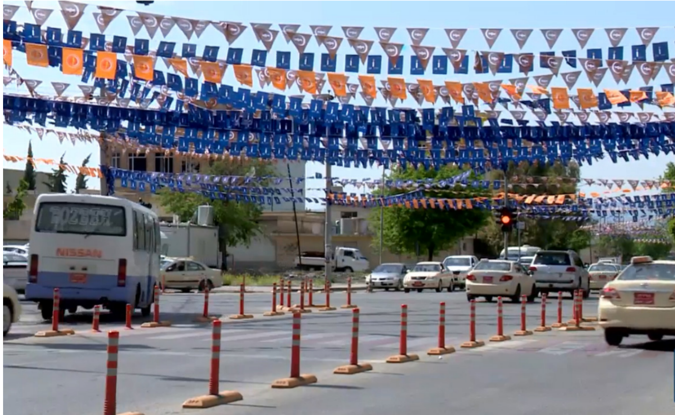
جانب من الدعايات الانتخابية في إقليم كردستان

60 بالمئة من الكرد مستعدون للمشاركة في الانتخابات المقرر اجراؤها في 12 من ايار المقبل، لاختيار نواب المرحلة المقبلة على مستوى العراق