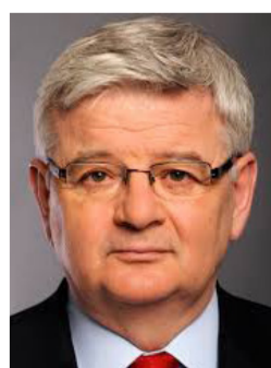
يوشكا فيشر وزير الخارجية الألماني السابق ونائب المستشار من عام 1998 إلى عام 2005