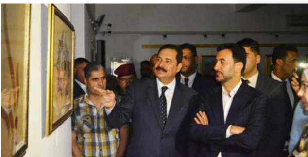
جانب من جولة الوزير

وافتح الملاعب. واطراف الوزير ان الوزارة هي الراعي الأول للشباب والرياضة في العراق وهذه الشريحة التي تشكل اغلب النسبة السكانية للعراق