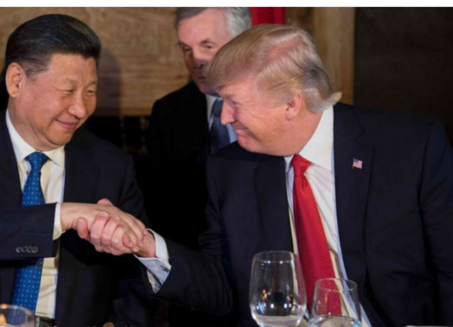
الرئيس الأمريكي ونظيره الصيني

ضرورة تجنب حرب تجارية بأي ثمن. وأعلنت الصين نهاية الأسبوع الماضي، خلال اجتماع المؤسستين