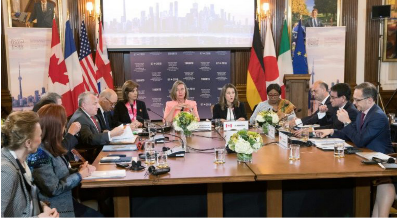
جانب من اجتماعات مجموعة السبع في تورونتو

ولحماية الاتفاق، يطالب ترامب فرنسا وبريطانيا والمانيا، الدول الموقعة للاتفاق الذي اعتبر تاريخيا حينذاك لكنه يرى أنه متساهل. باقتراح حلول لتسديد. ووجه عدد من وزراء الخارجية وعلى رأسهم الفرنسي جان ايف لودريان وامام وزير الخارجية الأميركي بالوكالة جون ساليفمان «دعوة قوية جدا» الى واشنطن «حتى لا تتخلى عن الاتفاق» لأن ذلك «يمكن ان يمنح الإيرانيين ذريعة لانسحاب قد تكون عواقبه كارثية». لكن المسؤول الأميركي الكبير قال «حققنا تقدما كبيرا» في الانسحاب الأخيرة مع الأوروبيين «لكن لم ننجز الأمر بعد». وشكلت هذه المسألة الموضوع الرئيسي لزيارة ماكرون امس الاثنين الى العراق والى واشنطن حيث سيطلب من دونالد ترامب الانبعاث على الاتفاق الإيراني «طالما انه ليس هناك من خيار أفضل للنووي».