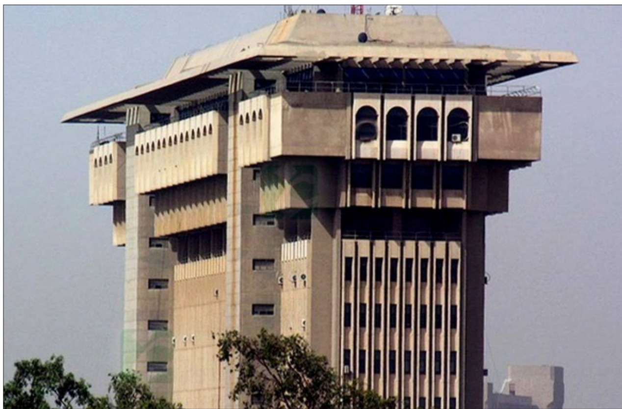
مبنى وزارة الداخلية "ارشيف"

بغداد - الصباح الجديد: أعلنت مفتشية وزارة الداخلية، أمس الاثنين، أن مكاتبها في عموم المحافظات باستثناء بغداد تمكنت خلال الفصل الأول من العام الحالي 2018 من ضبط 574 حالة فساد اداري ومالي في دوائر ومفاصل الوزارة، وذكر تقرير صادر عن مديرية تفتيش المحافظات في مفتشية الداخلية تلقت "الصباح الجديد" نسخة منه، ان "مكاتبها تمكنت خلال الأشهر الثلاثة الأولى من العام الجاري 2018 من اكتشاف 514 حالة فساد اداري و 60 حالة فساد مالي". وأضاف أن "مكتب تفتيش محافظة البصرة تمكن من اكتشاف 51 حالة فساد اداري و 8 حالات فساد مالي". وتابع ان "مكتب تفتيش محافظة ميسان تمكن من اكتشاف 29 حالة فساد اداري، ومكتب تفتيش محافظة ذي قار تمكن من اكتشاف 34 حالة فساد اداري و 5 حالات فساد مالي". واستطرد ان "مكتب تفتيش