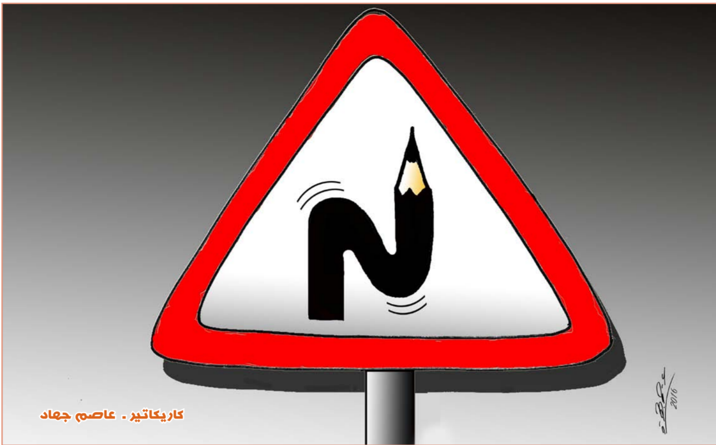
كاريكاتير - عاصم جهاد