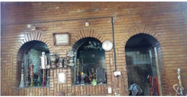
أحد المقاهي البغدادية

رمزا تراثياً، والتي تحولت من مطبوعة إلى مقهى بداية القرن الماضي، وبسبب موقعها فقد كانت ملتقى الأدباء والساسة. وعودة إلى منطقة الميدان ومقهى (سبع) التي كانت تنظم حفلات فنية بمشاركة فنانين وفنانات، اما مقهى (ام كلثوم) في بداية شارع الرشيد فكانت ومازالت إلى اليوم تمثل طابعا متميزا بين المقاهي البغدادية، فهذه المقهى تستضيف منذوقسي اغاني السيدة ام كلثوم التي تصحب اغانيها في أرجاء المقهى. وختل صورها عرض الجدران. وكذلك مقهى (عزاوي) في الباب المعظم التي كانت عنواناً لأغنية شهيرة (باكهوتك عزايي بيها المدلل