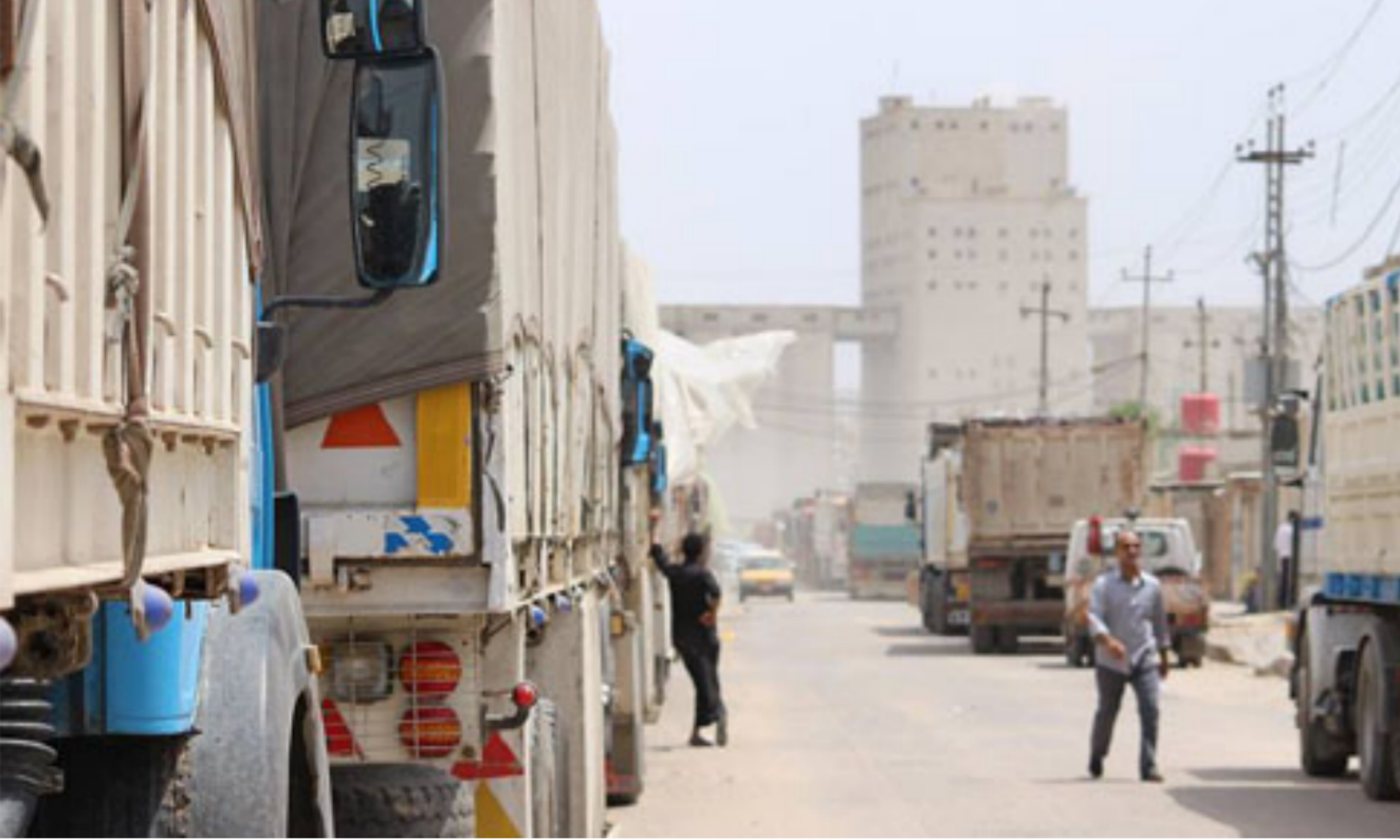
تسليم محاصيل الحبوب للموسم الحالي