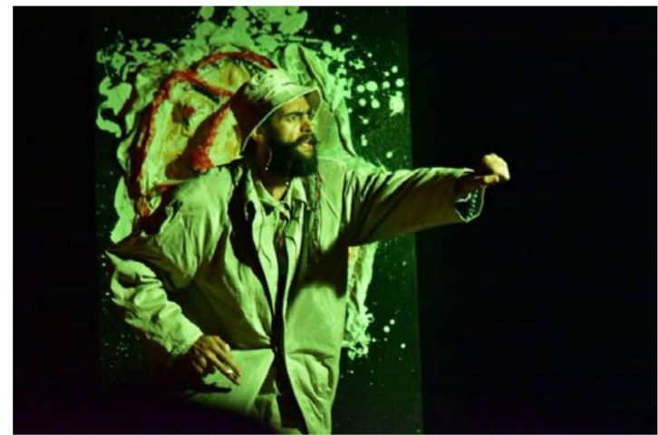
مسرحية الحارس - معهد الفنون الجميلة

العروض المسرحية كانت: مسرحية (الآنسة جوليا) للكاتب العالمي