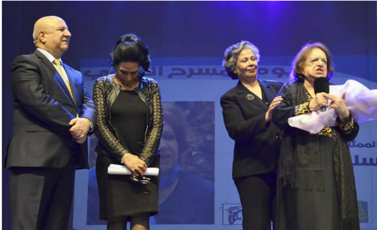
جانبا من فعاليات الحفل