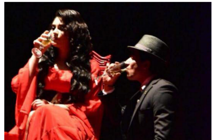
مسرحية الآنسة جوليا - معهد الفنون الجميلة