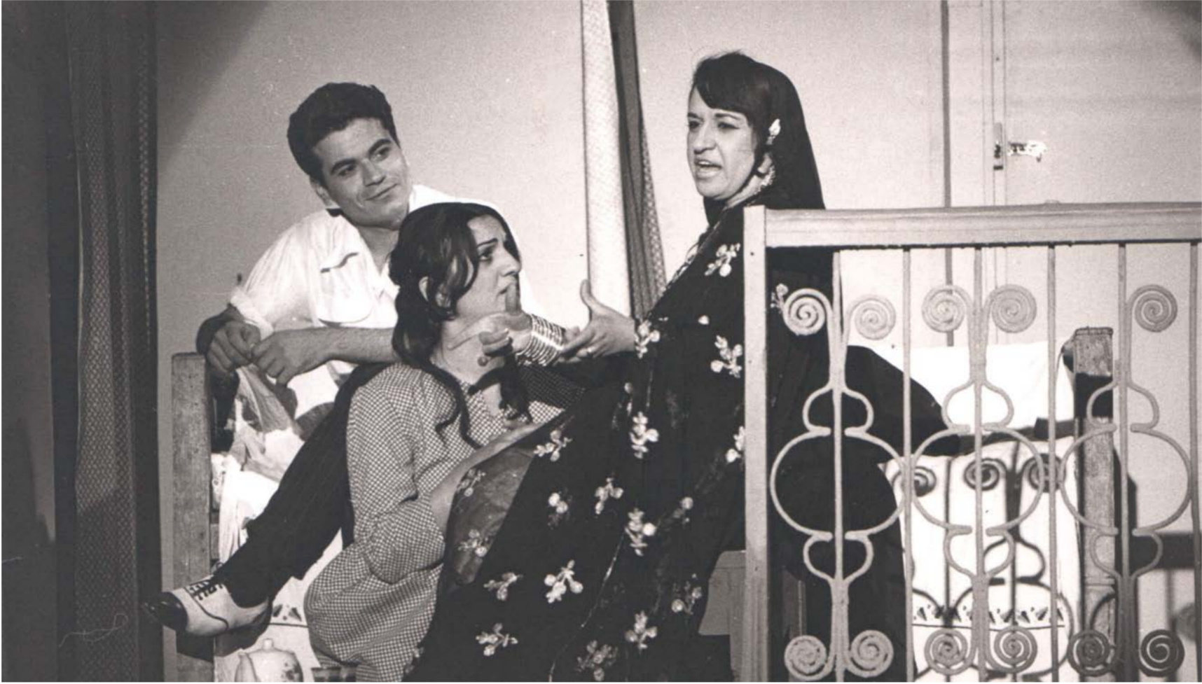
مشهد من مسرحية "النخلة والجيران"

النخلة والجيران. رواية ألقها الكاتب العراقي غائب طعمة فرمان، ووقع اختيارها كواحدة من ضمن أفضل مائة رواية عربية. أعدت الرواية مسرحياً وقدمتها فرقة المسرح الفني الحديث، وكانت في مقدمة المسرحيات العراقية التي نالت إعجاب واستحسان الجمهور. بُنيت أحداث رواية «النخلة والجيران» للروائي العراقي غائب طعمة فرمان على خلفية آثار الحرب العالمية الثانية في العراق. إذ صيغ نظام الحياة اليومية لشخصياتها في ضوء تداعيات تلك الحرب في بغداد، فظهرت منزعجة الإرادة، ومجزّدة عن أي فعل إيجابي. وما لبثت أن مضت في حال يكتنفها اليأس إلى نهايات مقفلة أتت بها إما إلى الموت أو القتل أو الغياب. وبذلك تكون الرواية قد طرحت قضية التاريخ الراكدة للامة حيث يتلاشى الأمل بالتغيير، فكل شيء في تراجع مطرد. إذ تستسلم معظم الشخصيات ليأس عام يخيّم عليها من كل جانب. وتدوي النخلة الوحيدة، وتباع الدار، ويهدم الإسطول، وتكاد الحواري الطينية الضيقة تخلو من الحركة، وتبدو المشاركة الاجتماعية مشلولة، بل معطلة، فقد انسدّت الأفاق أمام شخصيات مهمّشة جرى تقييد إرادتها من طرف غامض. وأصبحت طي النسيان فشرعت في الاقتصاص من بعضها بالطبع والقتل والخداع. وكتب عنها الابدع الكبير يوسف