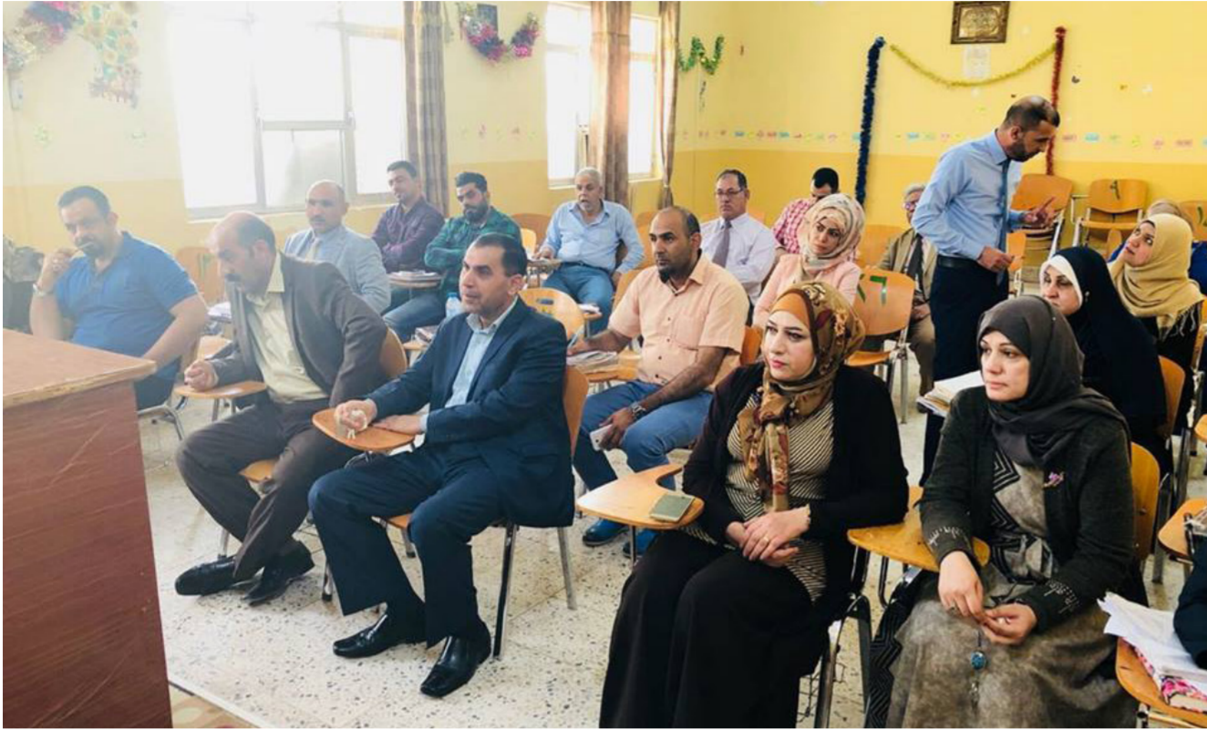
جانب من ندوة العادات والتقاليد الإسلامية الشرقية في إسبانيا