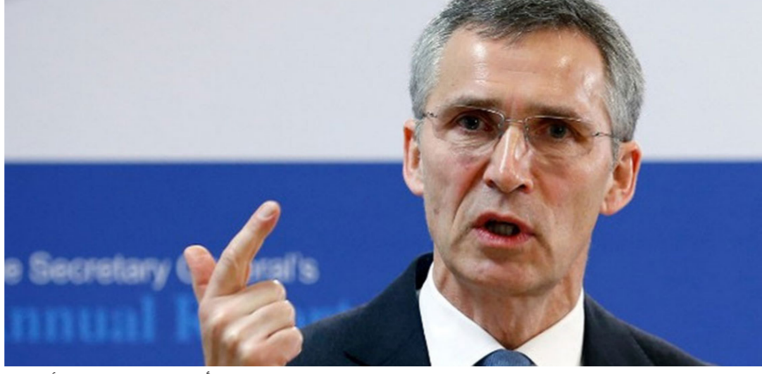
أمين عام حلف شمال الأطلسي

الدولية لبناء ائتلاف على استعداد للوقوف في وجه بوتين من خلال تفكيك شبكة التجسس الروسية في الغرب، وهذا يعني أن ما يقرب من 150 ضابط مخابرات روسي أمرت بريطانيا والولايات المتحدة وحلف شمال الأطلسي، و22 دولة أخرى، وأصبحت أيرلندا الدولة الـ24 التي تدعم موقف بريطانيا عندما أعلنت طرد روسي واحد امس الأول الثلاثاء، وقال ستولتنبرغ إن روسيا ستكون لديها الآن «قدرة منخفضة على القيام بعمل استخباراتي في الناتو» بعد عرض التضامن الذي قال إنه «لا أعتمد بأنهم يتوقعون». وأضاف أن المهمة الروسية خلف الناتو ستقتصر الآن على 20 شخصاً. أي أقل من الحد الأقصى الحالي وهو 30، موضحاً «أعمالنا تعكس مخاوف