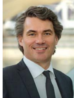
غافن باترسون الرئيس التنفيذي لشركة بت غروب

يُعد الأمن السيبراني واحداً من التحديات البارزة في العصر الرقمي. والجميع. من الأسر إلى الشركات إلى الحكومات. لهم مصلحة في حماية السلعة الأعظم قيمة في عصرنا: البيانات. والسؤال هو كيف يمكن تحقيق هذه الغاية. لا ينبغي لنا أن نستعين بحجم هذا التحدي. فمع اكتساب المهاجمين قدراً متزايداً من المهارة والإبداع. وتسلحهم بمجموعة متزايدة التنوع من الأسلحة. تقع الهجمات السيبرانية بوتيرة أسرع وقدر من التطور أعظم من أي وقت مضى. والواقع أن الفريق الأمني في شركتي «بي تي». التي تعمل في مجال تشغيل الشبكات وتقديم خدمة الإنترنت. يكتشف 100 ألف عينة من البرمجيات الخبيثة كل يوم – وهذا أكثر من واحد في الثانية الواحدة. في مواجهة الفكر الإبداعي بين المهاجمين السيبرانيين يتعين علينا