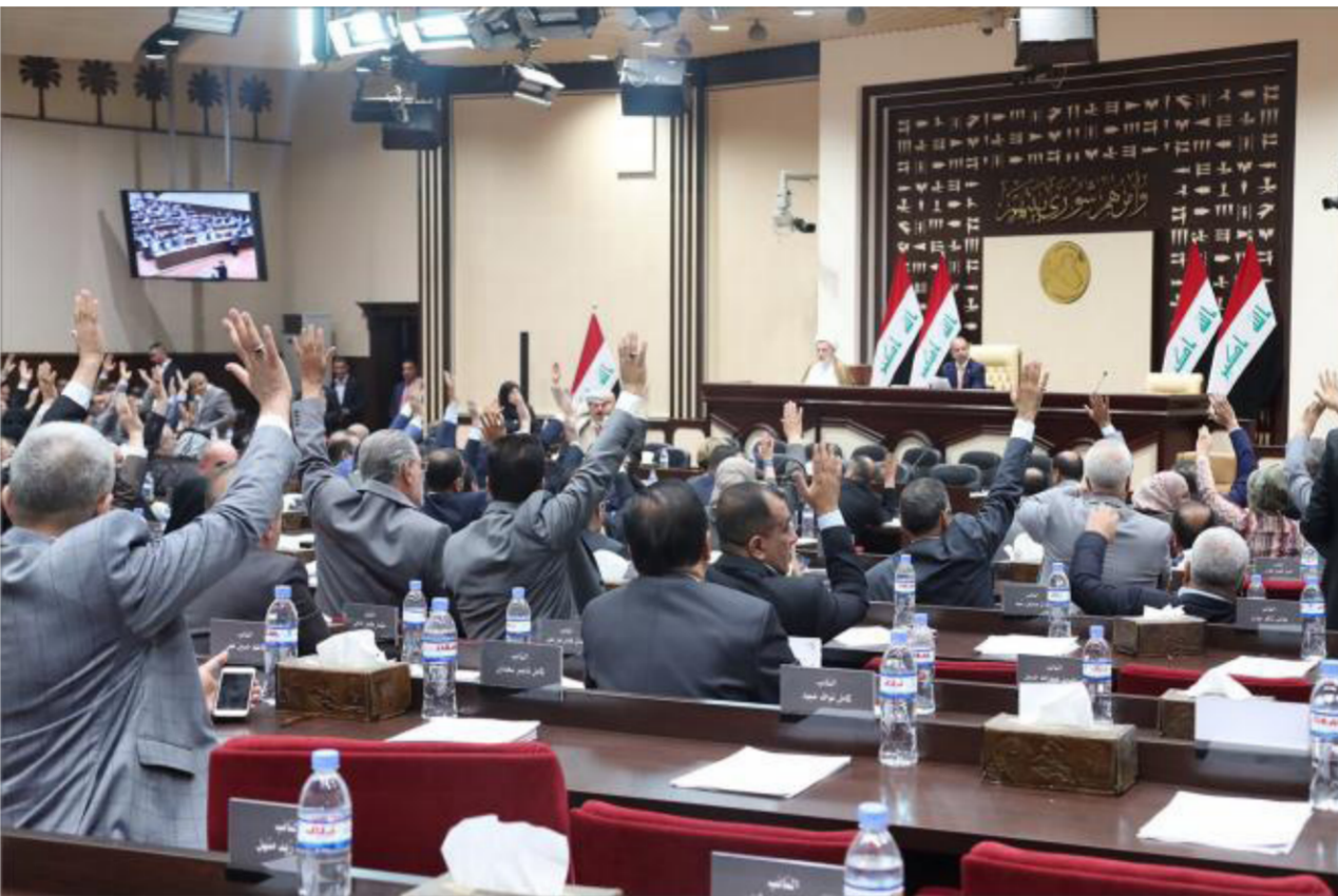
من داخل مجلس النواب "ارشيف"