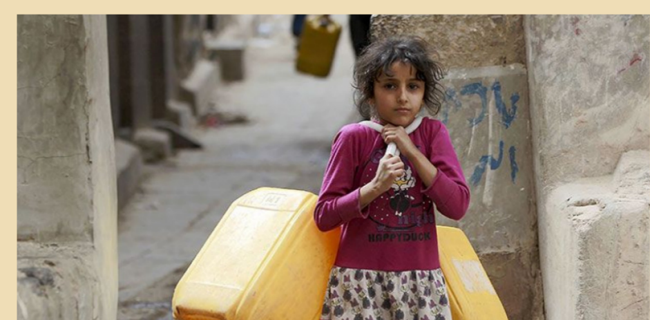
الجوع يهدد الملايين في اليمن

وفي ظل عدم صرف الأجور وارتفاع الأسعار أضحت الكثير من السلع الأساسية بعيدة المنال لعدد كبير من اليمنيين. وكانت إيرادات النفط تشكل أكثر من ثلثي آخر ميزانية اليمن والتي أعلنت في كانون الثاني 2014 لكن الحرب أضرت بالقطاع كثيراً ويقول المحللون إن الصادرات نزلت بنحو الربع. وستل بن داغر عن خطط الحكومة لتغطية العجز وإنعاش قطاع النفط لزيادة الإيرادات فأجاب أن البنك المركزي ووزارة المالية يدرسان الأمر. وساهمت وديعة سعودية بملياري دولار للبنك المركزي اليمني الأسبوع الماضي في استقرار العملة اليمنية التي هوت لمستوى متدن جديد فوق 500 ريال للدولار لكنه تعافى منذ ذلك الحين ليسجل نحو 440 ريالاً وهو ما يظل سعراً شديد الانخفاض مقارنة مع 215 ريالاً قبل الحرب.