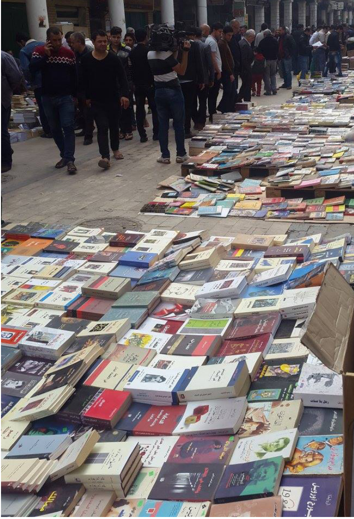
جانب من شارع المتنبي

هوية النص الاجناسية، وهنا تنبئ على نحو واضح غائبة/ علقة معرفة هوية النص الإجناسية، إذ أن فاعلية النص المعرفية والجمالية ليست في الشكل وإنما في مبررات الجنس الداخلية التي استندت ذلك الشكل، فمعرفة الكاتب بقوانين وآليات الجنس الذي وجد فيه النص نفسه وجربته ستمكنه من تحقيق جدلية الشكل/المضمون بشكل صحيح ويؤشر في الوقت نفسه إلى الوعي بالكتابة بعدها مفصلا تاريخيا يمر به الحدود بالنسبة للناقد الذي عليه معرفة يتمكن من مقارنة النصوص الإبداعية مقارنة سليمة يتم وفقها تحليل النص على وفق آليات الجنس الأدبي الذي ينتمي اليه عبر مايتح له النهج النقدي الذي يستعمله في التحليل .