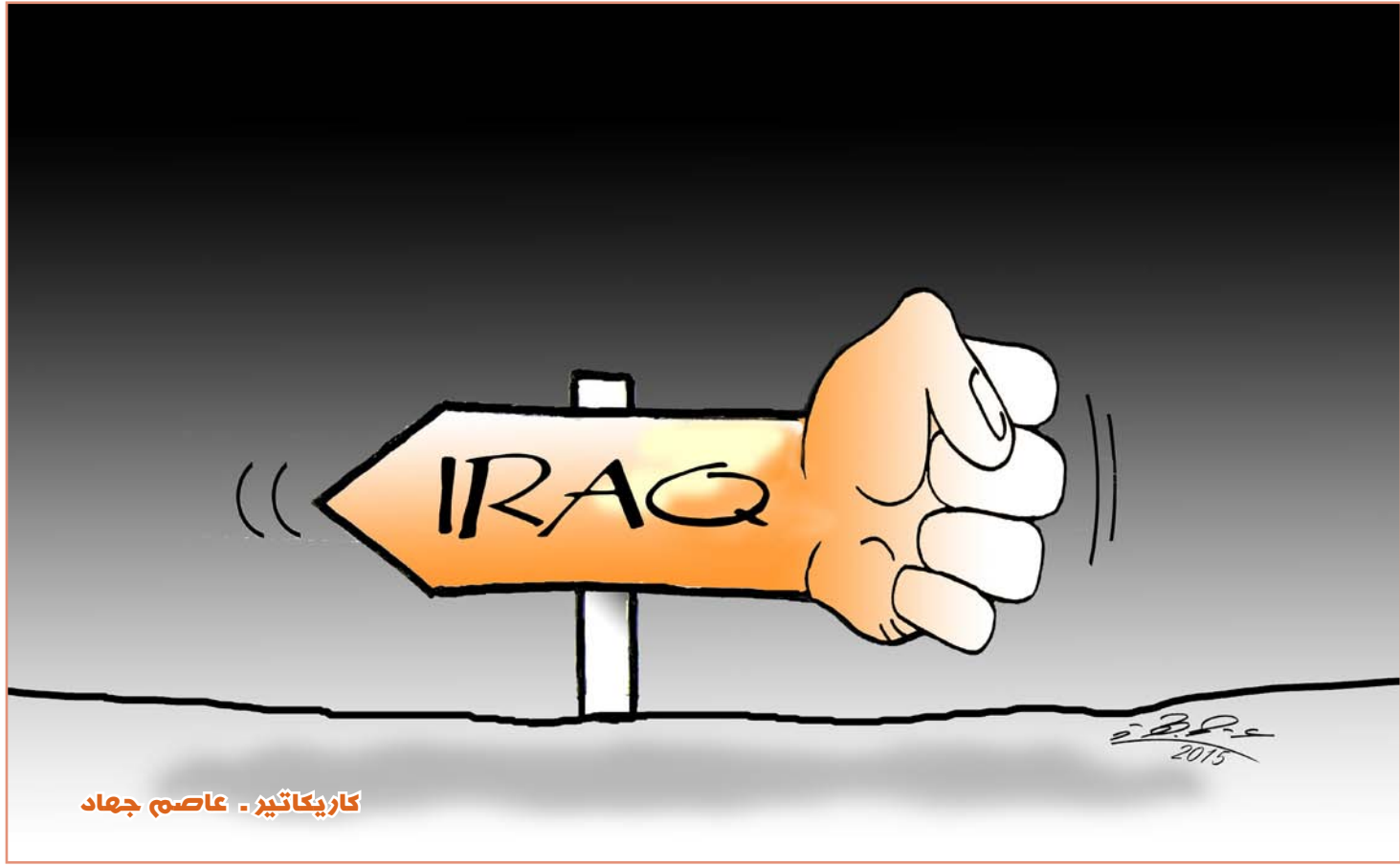
كاريكاتير - عاصم جهاد

الكذب نوع من التمثيل. والكاذبون مثلون بالسليقة. غير أن بعضهم يقوض داخل الشخصية فيبدو وكأنه يقول الحقيقة. وهذا ما نشهده في عالم اليوم.