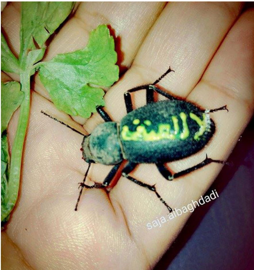
أحد أعمالها الفنية

ما هوايتك الاخرى؟ جميع هواياتي تقع ضمن إطار الفن التشكيلي.