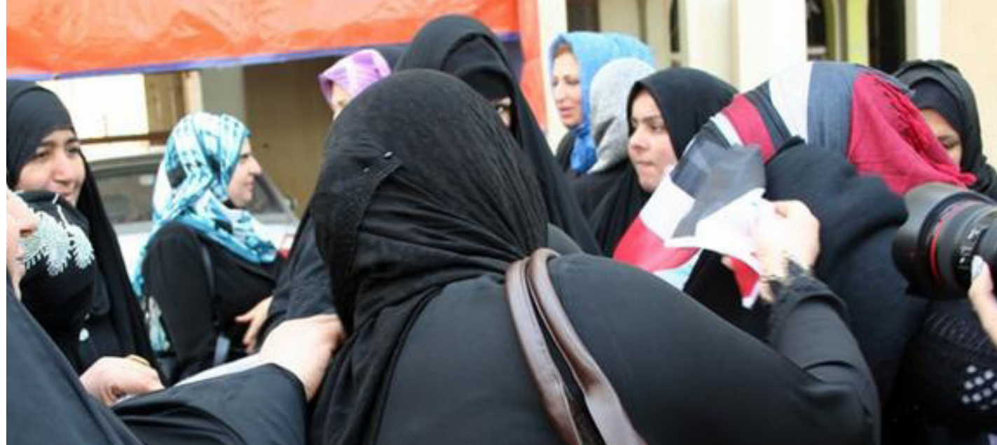
أرامل ومطلقات العراق والمصير المجهول