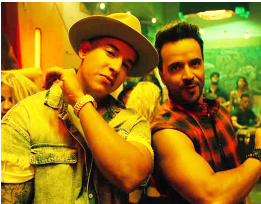
مطربا الأغنية من بورتوريكو