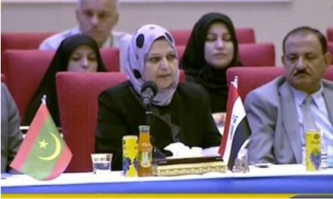
مؤتمر مناهضة العنف ضد المرأة

عليه الشريعة والدولة فضلا عن نبد الأفكار والمعتقدات السائدة في المجتمع المتوارثة للاجيال ووضع القوانين الرادعة بحق مرتكبي جرائم العنف كافة ضدها سواء أكان (عنفاً لفظياً، جسدياً، جنسياً، نفسياً، أسرياً)، وقد خرج المؤتمر بتوصيات شددت على الإسراع في إقرار قانون مكافحة العنف الأسري لحماية النساء والفتيات.