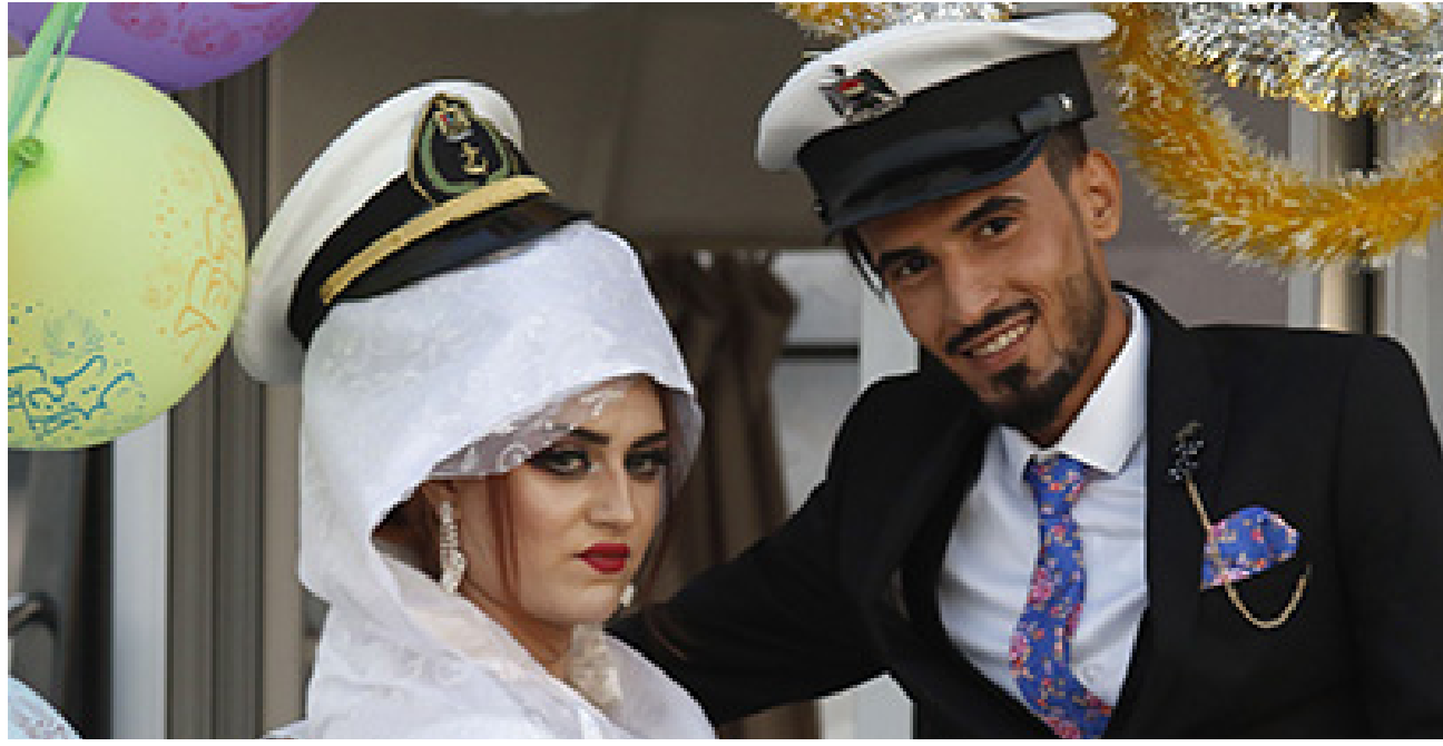
عرسان يصرون على اتمام زفافهم وسط شط العرب

حتى أم أحمد والدة العريس تبدو راضية عن هذا الحفل إذ تقول «الكل سعيد بفكرة الزفاف على متن القارب».