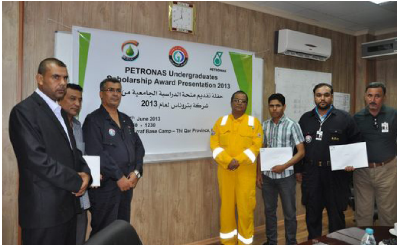
جانب لاجدي فعاليات شركة بتروناس في العراق

في منطقة الغراف ومخامتها كان السكان يعانون صعوبة