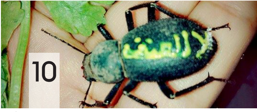
سجى البغدادي .. ترسم لوحاتها بالحشرات