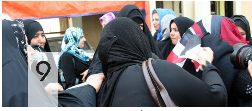
مليوناً أرملة ومطلقة خلفتهما الحرب والفقر والجهل