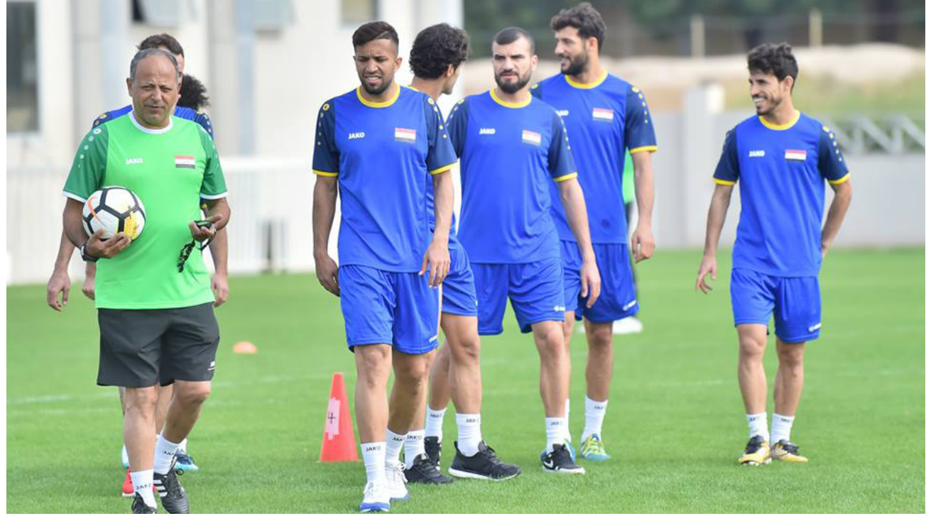
لاعبو المنتخب الوطني