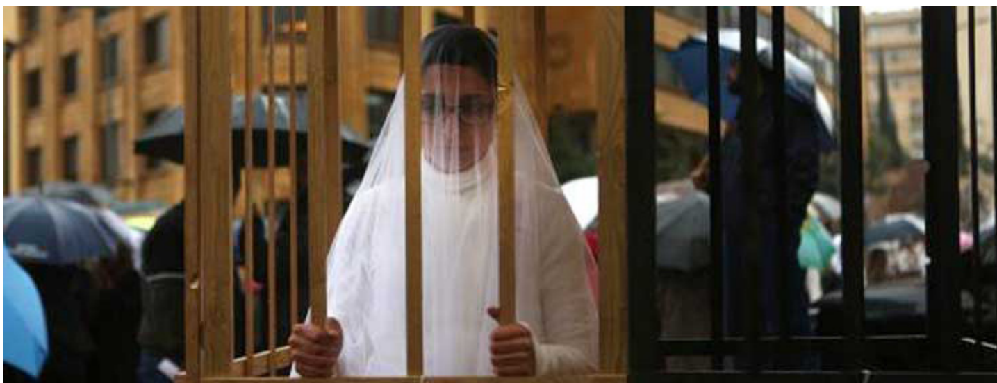
جانب من فعاليات حملة الـ 16 يوماً للحد من العنف ضد النساء في لبنان

وقال وزير الدولة لشؤون المرأة. جان أوغاسابيان. إنه تقدم بمشروع قانون من أجل تعديل المادتين 505 و518 من قانون العقوبات اللبناني. لمنع الإعفاء من العقوبة وتشديدها على من يقوم بالاعتداء الجنسي على قاصر أو أي فتاة