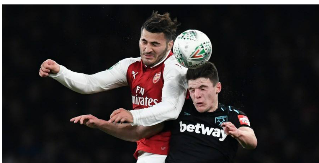
لقطة من مباراة سابقة لآرسنال

ديفيد مويس، المدير الفني لوست هام، من أصل 30 مواجهة جمعتها في مختلف المسابقات.. وفاز مويس على المدرب الفرنسي، في 4 مواجهات فقط، في حين كان التعادل بينهما 8 مناسبات. وصل الجانز إلى نصف نهائي كأس رابطة المحترفين الإنجليزية، لأول مرة منذ موسم 2010/2011، بعد الفوز على وست هام، من جانب آخر كشفت تقارير صحفية بريطانية، عن استقرار إدارة نادي آرسنال الإنجليزي، على مدير فني جديد للفريق، خلفاً للفرنسي آرسين فينجر، في المستقبل. ويراقب آرسنال ميك أرتيتا، لاعب الفريق الأسبق، والبالغ من العمر 35 عاماً، حيث يعمل حالياً كمساعد لبيب جوارديولا، المدير الفني لمانشستر سيتي، بعد أن رفض فرصة للانضمام