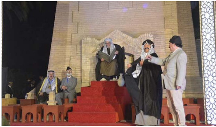
جانب من المهرجان

تضمنت الفعاليات. اضافة الى الجوق الموسيقي والالعاب النارية. جولة بالسيارات الكلاسيكية. التي يعود تاريخ صنعها الى اكثر من نصف قرن. في شارع الرشيد. والعربات التراثية للبايعات المتجولين. كذلك عرض فيلم تسجيلي عن النشاط العمراني لبغداد. وتقدم عرض مسرحي بعنوان الوجه الحضاري للعاصمة. وللحذاء على كل ماينوهها واختتمت كلمتها بالعرفان الى كل من بادر واسهم في صناعة النصر المؤزر والقضاء على الارهاب. وعبر مدير عام