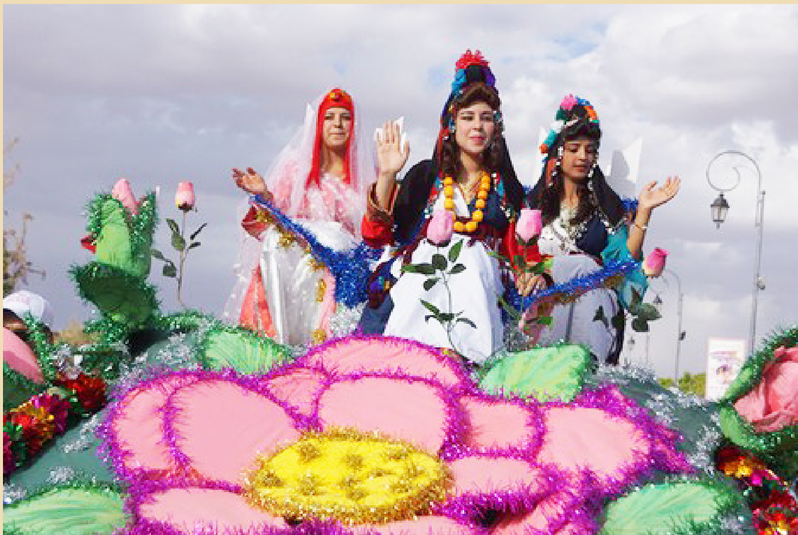
مهرجان الزهور في المغرب