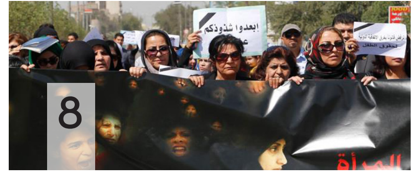
زواج القاصرات بين الرفض الاجتماعي والعادات والتقاليد