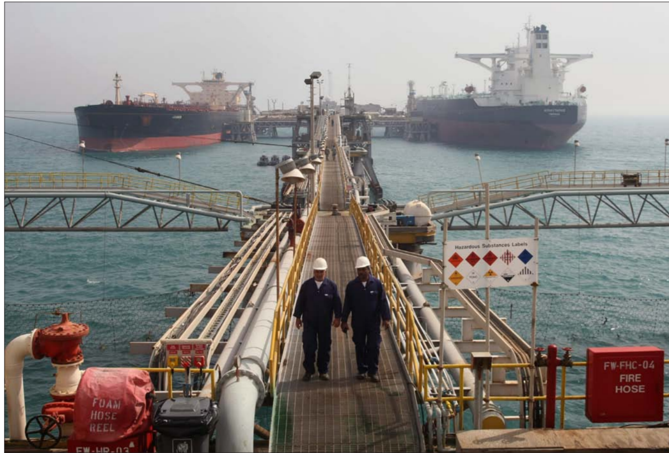
منصة لتصدير النفط في جنوبي العراق

يقبل عن 10 في المئة. مشيراً إلى أنه «سيشمل كل نشاطات الغاز الذي يحتوي على 500 جزء في المليون من الكبريت في العام المقبل بعلاوة 65 سنتاً للبرميل فوق متوسط أسعار زيت الغاز في الشرق الأوسط الذي يحتوي على النسبة ذاتها من الكبريت وهو ما يزيد خمسة سنتات على علاوة عقود 2017. وأبرمت المؤسسة عقودها المجددة لمدة لوقود الطائرات لعام 2018 بعلاوة 70 سنتاً للبرميل فوق متوسط الأسعار وقود الطائرات في الشرق الأوسط وهو ما يقل عن العلاوة التي أتفق عليها للعام في سوق أوبوطني لأوراق أسهمها.