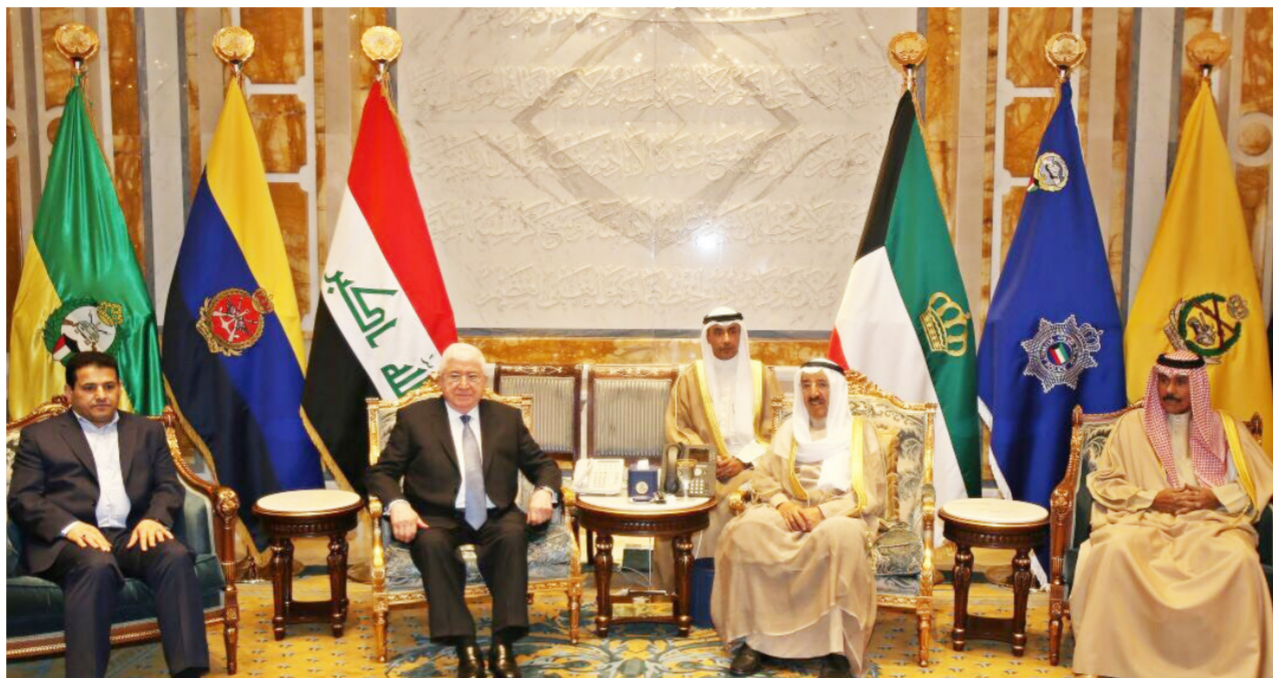
الرئيس معصوم في أثناء لقائه بأمر الكويت في الآجاء الصحيح لا سيما انها تتزامن مع مؤتمر المانحين لاعادة اعمار المدن المستعادة من داعش وبحسب مراقبين فإن زيارة معصوم على رأس وفد وزاري كبير الى الكويت تعتبر خطوة الاستثمار والتبادل التجاري وتسهيل دخول الشركات الكويتية الى العراق

بغداد - الصباح الجديد: تعد زيارة رئيس الجمهورية فؤاد معصوم الى الكويت هي الثانية لرئيس عراقي منذ عام 1990 بعد الزيارة التي قام بها الرئيس العراقي الراحل جلال الطالباني في عام 2008 . حيث توجه معصوم يوم الأول من امس الاثنين الى الكويت في زيارة رسمية استغرقت يوماً واحداً فقط . الزيارة لها ابعادا ايجابية للمدن المحرة المستعادة من تنظيم داعش الارهابي لاسيما وان معصوم التقى خلالها امير دولة الكويت صباح الاحمد الجابر الصباح لبحث ملف اعادة اعمار تلك المدن بالإضافة الى قضايا اخرى تهم الجانبين . معصوم ثمن اهتمام دولة الكويت بملف اعادة اعمار المناطق المحررة والمستعادة من تنظيم داعش الارهابي . حيث اعرب عن شكره للكويت على استضافتها مؤتمر المانحين لاعادة اعمار تلك المناطق المقرر عقده بداية العام المقبل. معصوم اكد ان العراق سيؤلي هذا المؤتمر اهمية كبيرة . مقدما شكره للكويت على رعايتها له لأنه مهم جدا في مساعدة العراق . مبينا أن العراق لا يستطيع اليوم ان يتنبأ بحجم ما سيحصل عليه لكنه متفائل بالأجواء المحيطة التي تجهد لعقد المؤتمر . معصوم دعا الشركات الكويتية الى لعب دور أكبر في الكثير من المجالات الاستثمارية المتاحة في العراق بما فيها المشاريع الكبيرة في مجال اعادة اعمار البنى التحتية المتضررة في البلاد . وقال معصوم ان "الحوار كفييل يحل جميع المشكلات في المنطقة. مشيراً الى اننا نحن مع وحدة الخليج وليس من مصلحة العراق وجود خلافات في المنطقة". وأضاف معصوم "وجدت من الحكومة الكويتية مرونة واستعدادا لتقدير الظروف في العراق". مؤكداً انه ناقش مع الجانب الكويتي التبعيضات وميناء خور عبدالله. وشدد معصوم على ان العلاقات بين البلدين تجاوزت كل الأزمات