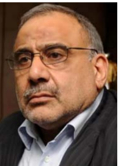
عادل عبد المهدي