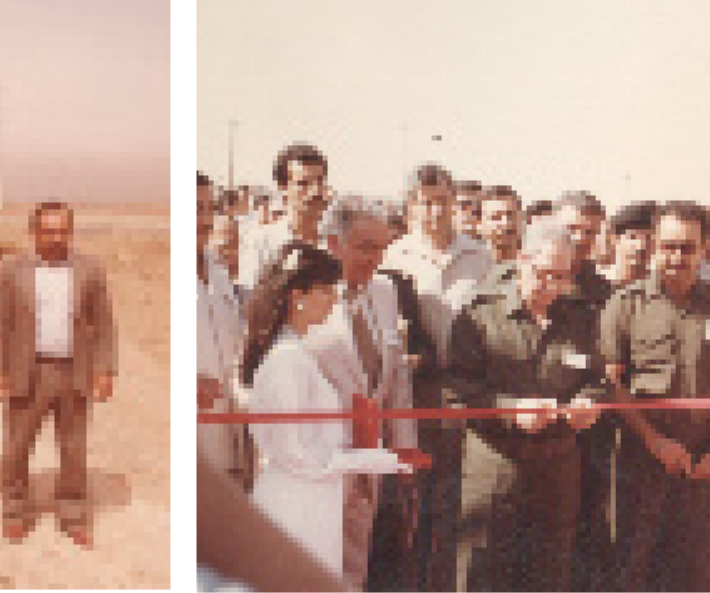
امين العاصمة يفتتح المشروع وأنا على يمينه وخالد الجنابي مستشار رئيس الجمهورية على يساره

ذلك لأن جميع العمارات التسع صُممت ليكون معظم اجزائها من الكونكريت مسبق الصنع . في العامل الاعتيادية لصناعة الكونكريت مسبق الصنع . تكون القوالب ثابتة . ويتم تنظيفها وربط حديد التسليح وشبكات الخدمات