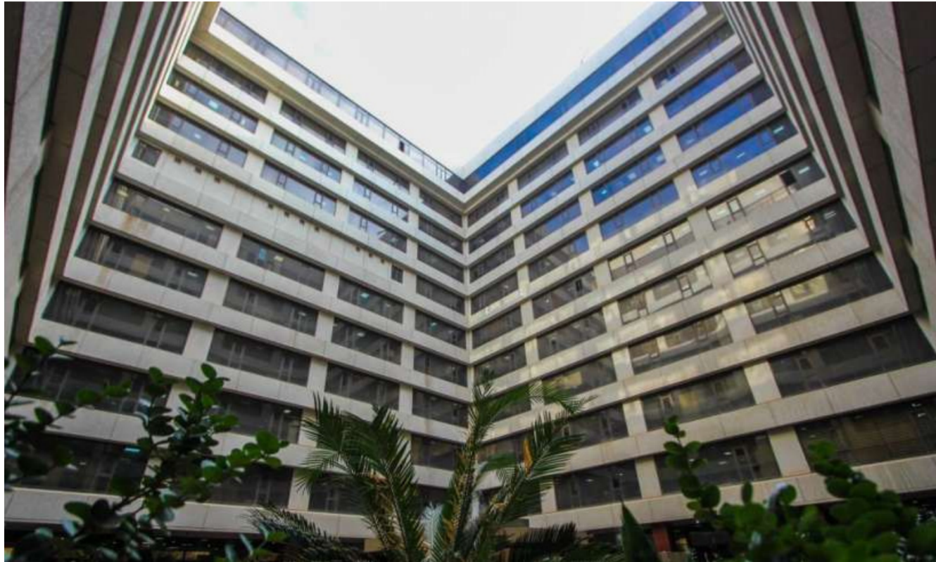
مبنى وزارة التعليم العالي

وتابع المتحدث الرسمي أن معدل الطالب بالنسبة لكليات المجموعة الهندسية يجب أن لا يقل عن ثلاث درجات عن أقل معدل تم قبوله في القبول المركزي للكليات نفسها . فيما ستكون أربع درجات فارقة عن أقل معدل تم قبوله في القبول المركزي بالنسبة لكليات العلوم . فيما لا يقل معدل التقدم الى التخصصات الأخرى عن خمس درجات عن أقل معدل تم قبوله في القبول المركزي للكليات نفسها او المعهد.