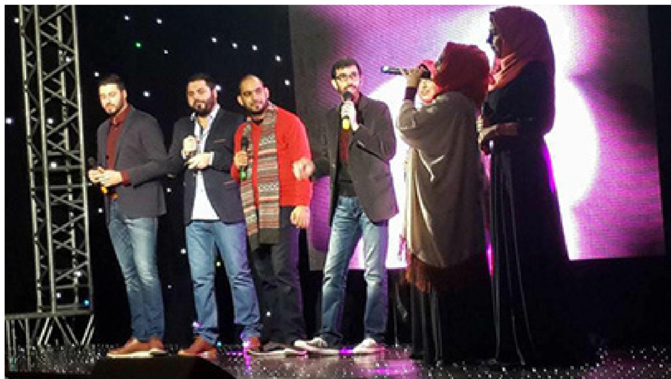
فرقة هارموني اللبنانية

العامّة للدين والذي يصفه البعض بالتجهّم، وذلك من خلال الاعتماد والتركيز على عناصر الفرح والبهجة والإيجابية بالفكرة وطريقة طرحها، كى تكون الرحلة مع طريق المناجاة والدعوات والاقتراب من الله رحلة سرور وأقبال. لأن الله محبة وجميل يحب الجمال وليس كما يصفه المنظرين والظالمين مصدر رعب وقناب وقوانين صارمة يمكن ان توذي بصاحبها الى التهلكة لأبسط الأسباب.