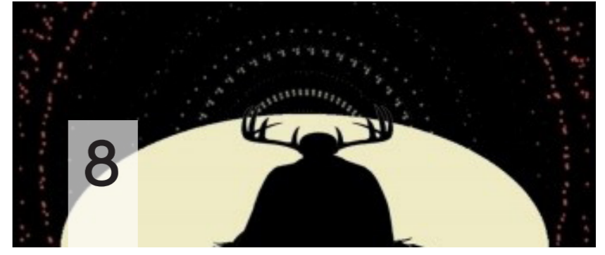
« الحركة والظل » سيكون لها الفضاء الريح