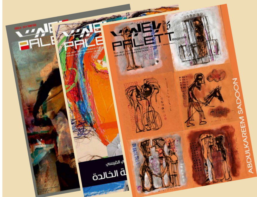
مجموعة اغلفة من اعداد المجلة