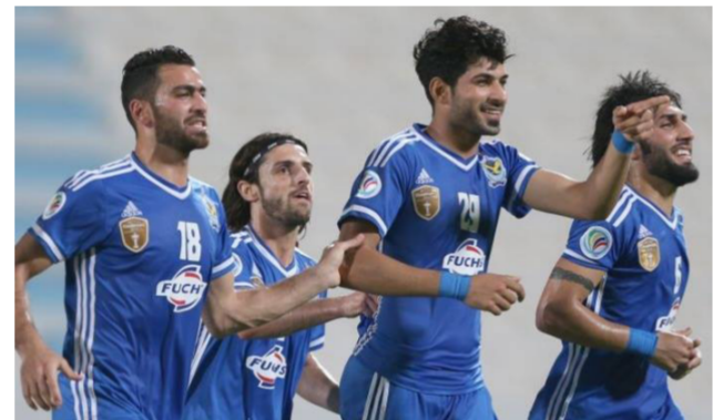
لاعبو نادي الجوية

وبالتالي على الجهاز الفني أن يلعب بطريقة متوازنة. مع استقلال بطء الخط الخلفي لفريق الاستقلال. وتابع بقوله: «فريق الاستقلال. مهما يكن. لا يرتقي إلى تاريخ وحجم القوة الجوية. حتى من حيث نوعية لاعبي الفريقين. لدينا نخبة كبيرة. سواء على مستوى البطولات الدولية مع المنتخب. أو مع فريق القوة الجوية. من خلال النسختين الماضيتين لبطولة كأس الآخاد الآسيوي».