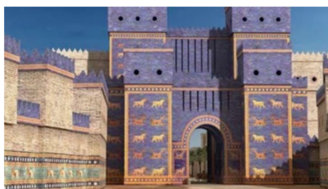
معرض بابل.. تاريخ وحضارة