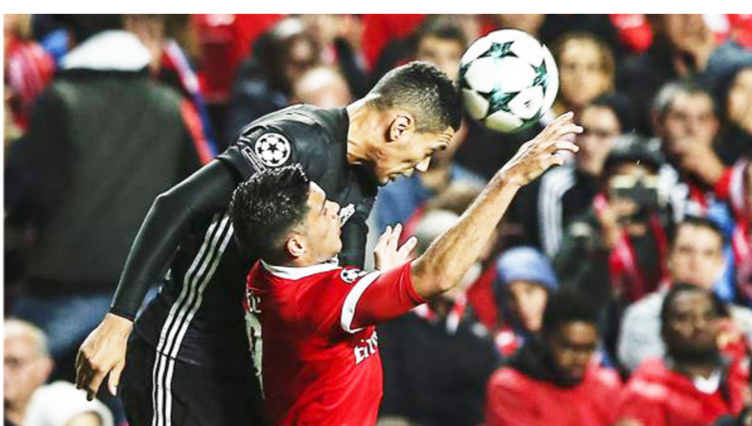
لقطة من مباراة مانشستر يونايتد

توديع دوري أبطال أوروبا لكرة القدم بعدما تعادل على أرضه (1-1) مع كاراسكا أجدام القادم من أذربيجان رغم خوض معظم فترات الشوط الثاني بلاعب إضافي عن المنافس أول أمس. وصنع أتلتيكو الكثير من الفرص في الشوط الأول لكنه تأخر بهدف سجله لاعب الوسط الإسباني ميشيل بضرنة رأس بعد ركلة ركنية ليهرج شباك الحارس يان أوبلاك في الدقيقة 40. وأدرك توماس بارتي لاعب وسط أتلتيكو بتسديدة قوية من مدى بعيد في الدقيقة 56. كما حصل صاحب الأرض على دفعة بطرد لاعب منافسه. البرازيلي بيدرو هنريكي بعد دقيقة واحدة. لكن أتلتيكو لم يستغل الزيادة العددية ولم يترجم السيطرة إلى أهداف بينما تعرض مدافعه ستيفان سافيتش للطرد بسبب حصوله