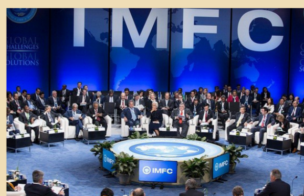
من اجتماعات البنك الدولي "إرشيف"

لمشروع العملية الطارئة للتنمية في العراق المقدره بـ350 مليون دولار، الذي تمت الموافقة عليه في تموز 2015 ومن المنتظر أن يُتيح التمويل