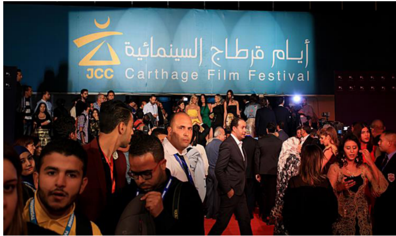
جانب من حفل افتتاح المهرجان

وسيكون افتتاح هذه التظاهرات في الأسبوع نفسه من أيام قرطاج السينمائية، المقامة في العاصمة، بحضور ضيوف المهرجان، فيما ستكون العروض يوماً بعد الاحتتام لتمتد على مدار ستة أيام. وتشهد الدورة 28 للمهرجان مشاركة 180 فيلماً تونسياً، وغربياً، وأجنبياً، من أكثر من 20 بلداً. وتبلغ ميزانية الدورة الحالية من المهرجان نحو ثلاثة ملايين دينار (1.2 مليون دولار)، بحسب المنظمين. وتأسس مهرجان أيام قرطاج السينمائية عام 1966 بمبادرة من السينمائي التونسي الطاهر شرعبة، ويشهد المهرجان عدة مسابقات، بينها المخصصة للأفلام الروائية الطويلة، والقصيرة، سيشارك فيها 15 فيلماً قصيراً و14 فيلماً طويلاً. إلى جانب مسابقة الفيلم الوثائقي الطويل (14 فيلماً) والوثائقي القصير (8 أفلام)، إضافة إلى جائزة الطاهر شرعبة للعمل الأول.