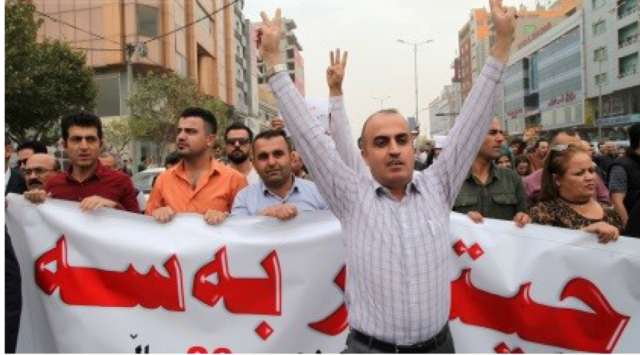
جانب من تظاهرات الاقليم لحل أزمة الرواتب

السليمانية - عباس كاريزي: ارحلوا يا من جئتم على صدورنا لمدة 26 عاما وكفى بكم سرقة نفوس الشعب واهدار ثرواته ايها الفاسدون، هذه كانت اهم الشعارات التي ردها آلاف المعلمين والملاكات التدريسية. في تظاهرات واسعة نظموها جابت شوارع محافظات السليمانية وحلبجة وادارتي رابرين وكرميان صباح امس الأربعاء للمطالبة بحل الحكومة الحالية وتوزيع رواتب الموظفين المتأخرة. المتظاهرون الذين جمعوا مع ساعات الصباح الاولى امام مديريات التربية في السليمانية، وغيرها من مدن الاقليم، رفعوا شعارات نددت بهيمنة الاطراف السياسية على مقدرات الشعب وتسخير موارد الاقليم وثرواته لاثراء بعض العائلات والاشخاص والاحزاب على حساب الصالح العام، وطالبوا الحكومة الاتحادية بالتدخل لرفع الغبن الذي اضر بالموظفين عموما وبالتدريسيين