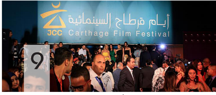
أيام قرطاج السينمائية يعيدل بوصلته نحو الجنوب