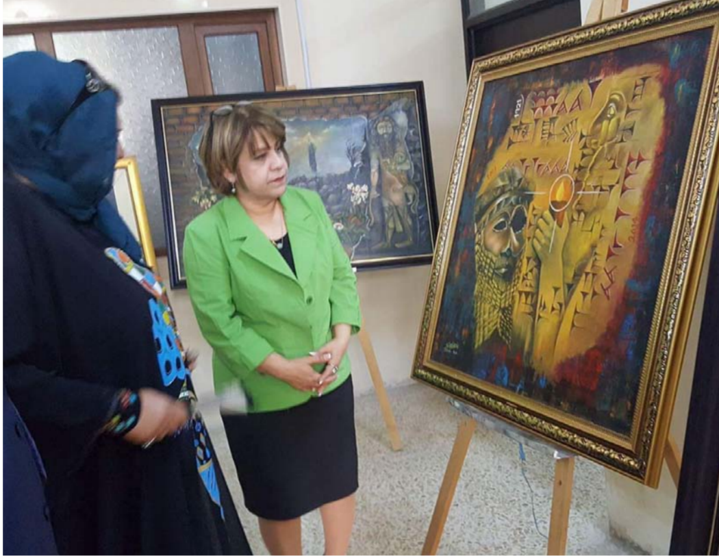
من معارض الفنانة في كركوك

نقبل النقد والنصيحة، في حين أرى الجيل الجديد عبيد ويستعمل أساليب ملتوية في العمل وغير متحضّر وهذا ما لمسته من معاشيتي لطلاب الفن، ولا اعتقد انهم سيحققون شيئاً مستقبلاً ان بقي حالهم كما هو لأن لديهم نشأت، وغرو بعد اول مشاركة لهم في أي معرض، وعند سماعهم الى أبسط مفردات المدح من قبل جهلاء الفن، أو الجاملين، ورأيت هذا لا يشمل الكل، فهناك شباب يعملون بجد على تطوير فنهم، بعيداً عن الغرور.