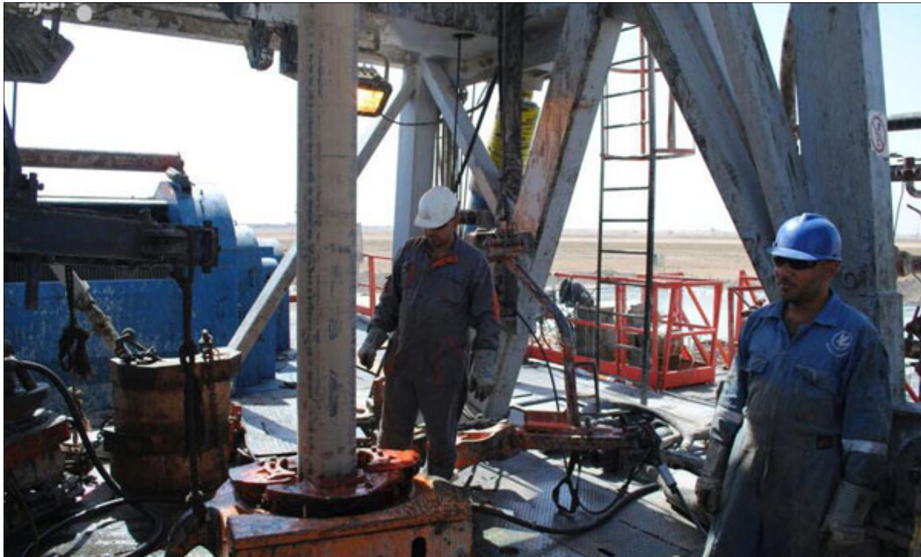
من آبار النفط جنوبي العراق