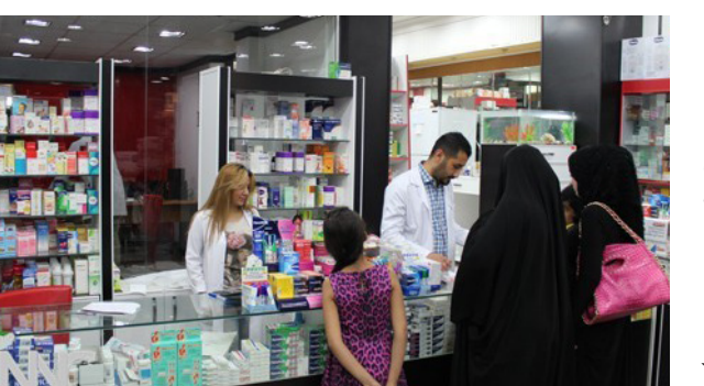
إحدى صيدليات العاصمة

خلال الاسابيع المقبلة». وأضاف بدر ان «مشروع تحديد الأدوية تم بالتنسيق مع نقابة الصيدالة والأطباء وسيكون بإمكان المواطن من شراء الدواء على كافة الصيدليات الطبيعية في المنفذ الحدودي الذي يديره الإقليم لحد الآن ناقيا قدمت أية قوة عسكرية سواء كانت عراقية أم تركية إلى معبر إبراهيم الخليل. وكانت وكالة انباء «الأناضول» التركية