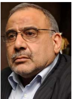
عادل عبد المهدي * وزير النفط السابق

حق الكراد العراق لجحات كبيرة. وتعرضوا لانتكاسات خطيرة. وتكرر مشهد بلوغهم اعلى القمم. ليتحول سريعا لاكثر الانتكاسات. فهناك ما رزق في البناءات الفكرية. يتطلب مراجعة شاملة. والا فان اي جأح يتحقق سينهار بسرعة. ومن دون مراجعة الذات. فان المرجعة مع الاخر ستبوء معقدة. وتعرض لانتكاسات متكررة. لاشك ان احد المآزق في الدولة المستقلة وحق تقرير المصير هو افتراس المنفذ للعالم الخارجي. وغيب الجوار الراعي والقابل بالانفصال. او دولة عظمى راعية. قادرة على فرض ارادتها. بالصد من خرائط سبق وأن رسمتها. لكن المآزق الهمم والاطخر هو فهم