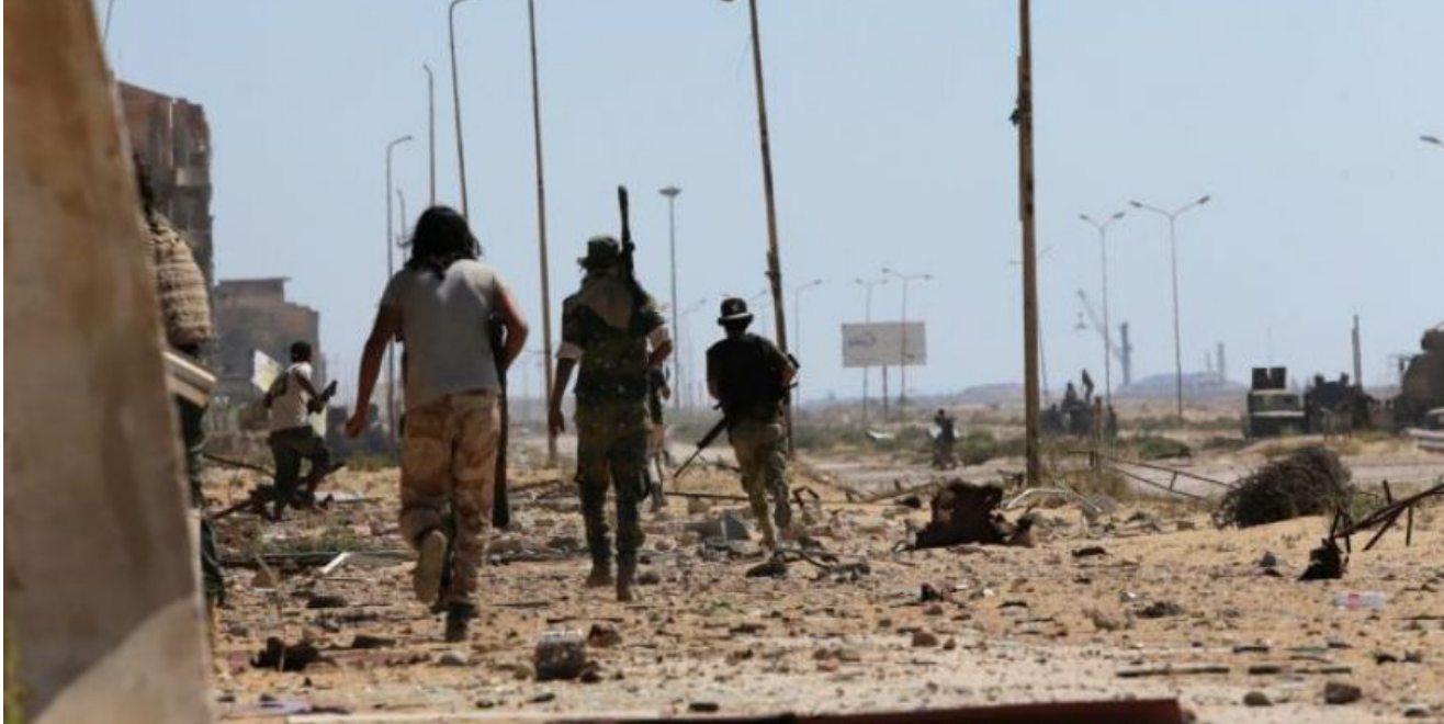
ليبي تطالب مجلس الامن بالتدخل

منطقة السدرة كانت متجهة للجنوب. فأعطيت حينها الأوامر للاشتباك الذي انتهى بانسحاب القوة التابعة لداعش نحو الجنوب دون تمكن قوة الاستطلاع من ملاحظتهم بسبب انعدام الرؤية. وأشار الهامالي إلى أن الكتيبة ضاعفت عدد دورياتها جنوبا وخاصة بعد الهجوم الإرهابي الأخير في الخماس والعشرين من الشهر الحالي على بوابة الستين جنوب أجدابيا والذي راح ضحيته 2 من منتسبي الكتيبة 152. مؤكدا أن الوضع الحالي في محيط السدرة مستتب وهادئ.