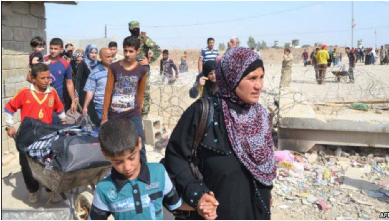
نازحون عائدون الى مناطقهم في الأنبار بعد خربها من "داعش"