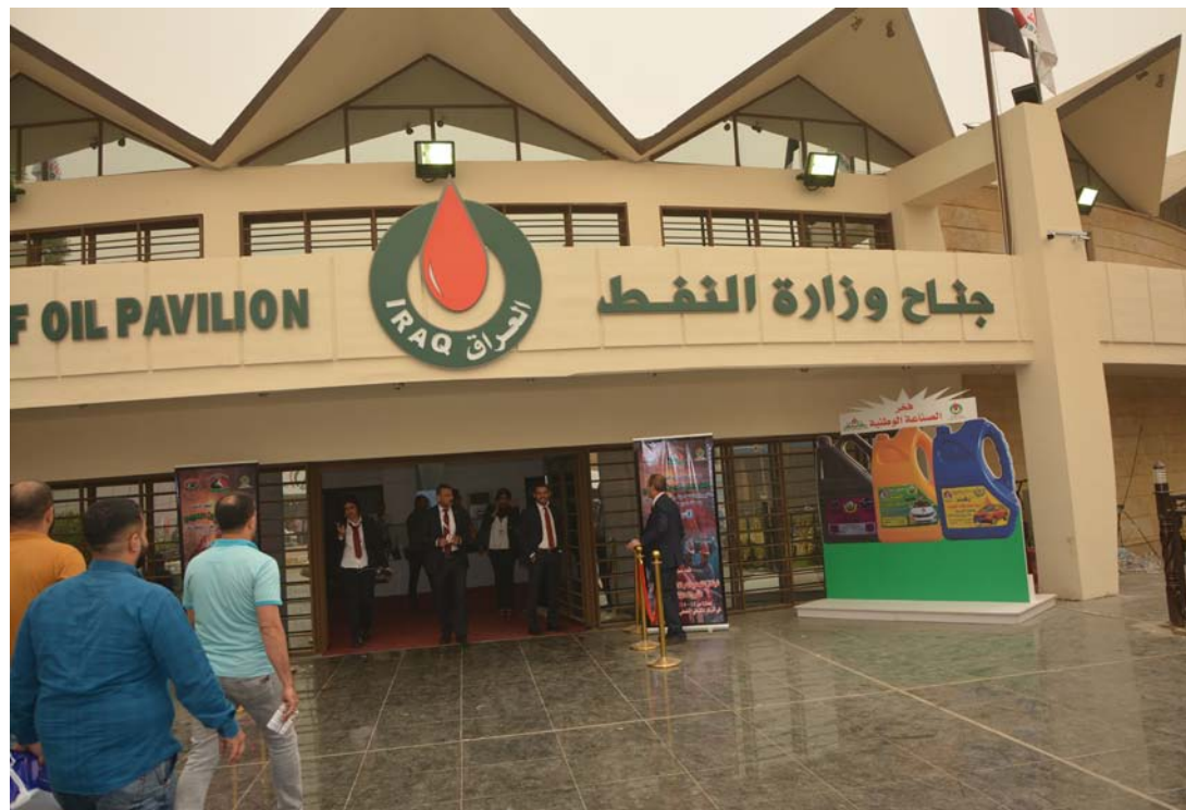
جانب من جناح الشركة

اهتمام الوزارة بهذه المشاركة كانت بادرة النجاح الأولى. حتى زيارة السيد الوزير جبار اللعبيي مصطحبا وزير البترول والطاقة السعودي خالد