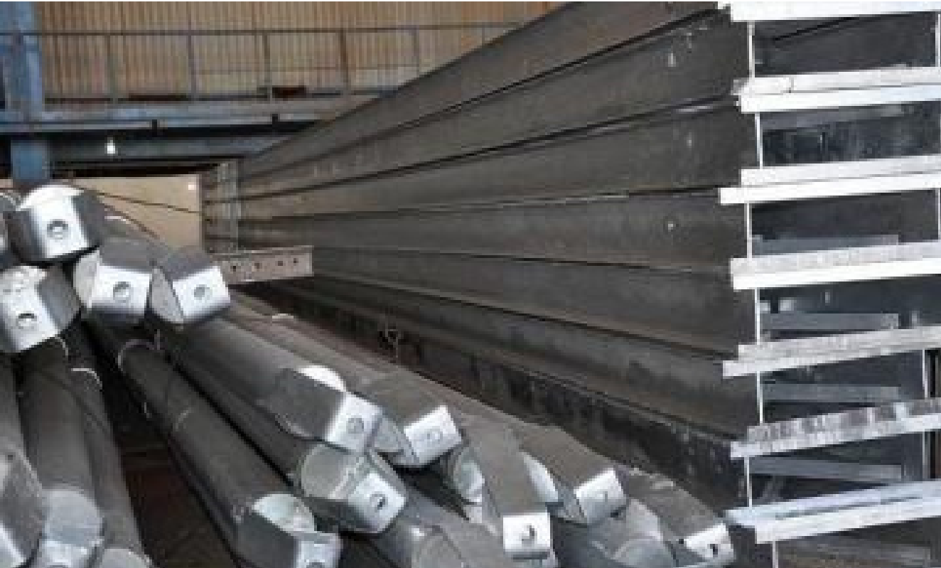
تسويق الأعمدة المشبكة والعلامات المرورية

تكنولوجيا اول جامعة عراقية تباشر بتطبيق نظام المعيشة ومن ضمنها الشركة العامة للأنظمة الالكترونية وقد تم الاطلاع على نشاط الشركة والأقسام الموجودة فيها واهم المعوقات التي من الممكن تجاوزها من خلال تطبيق نظام المعيشة كما تمت مناقشة امكانية تطوير نظام البرمجيات وتطوير منظومات السيطرة والاتصالات وأمكانية التعاون في تطوير مختبرات الفحص وبأ يواكب التطور التكنولوجي الحديث. . مؤكداً بان تطبيق نظام المعيشة سيعمل على تطوير الطاقات الصناعية وقدراتهم ومؤهلاتهم تمهيدا لامكانية توجيه هذه الطاقات بالمكان المناسب