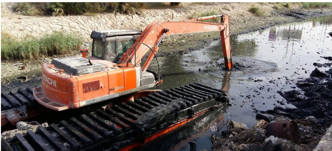
جانب من عمليات كرى وتطهير وتنظيف نهري العشار والخندق بالبصرة

تحقيق نسبة إنجاز متقدمة جدا في اعمال الكرى للبصرة .