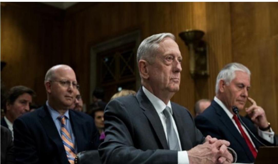
الإدارة الأميركية.. ترامب لإحتاج الى تفويض للحرب

من جهته. حذر السناتور الديمقراطي في اللجنة بن كاردين من تنامي المعارضة لتفويض عسكري يعطي الضوء الأخضر «لحرب شاملة في الفضاء لا نهاية لها». وأدلى ماتيس وتيلرسون بشهادتهما في اب بهذا الشأن في جلسة سرية قال كوركر بعدها إنهما «أظهرا انفتاحا» لفكرة إعادة التطرق إلى المسألة. لكن منذ ذلك الحين. ساءت علاقة كوركر بترامب حيث أصبح ينتقد الرئيس علنا فيما ازادت الدعوات لرقابة جديدة على عمليات الولايات المتحدة في أفريقيا والشرق الأوسط. وآسيا.