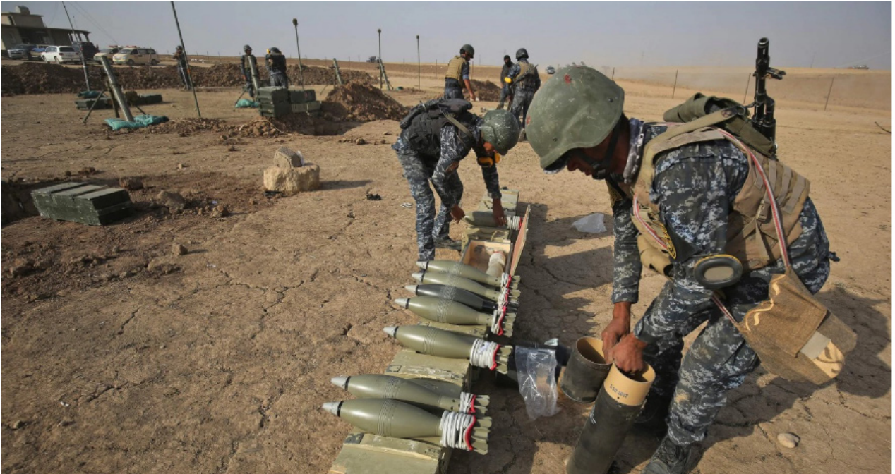
القوات المشتركة في فيشخابور

تصادم وقتال". وكشف المتحدث باسم العمليات المشتركة عن "قرب انطلاق حرك القوات العسكرية ومباشرتها مهامها وذلك خلال الأيام القليلة المقبلة لكي تصادق وتنفذ قرارات مجلس الأمن الدولي بشأنه".