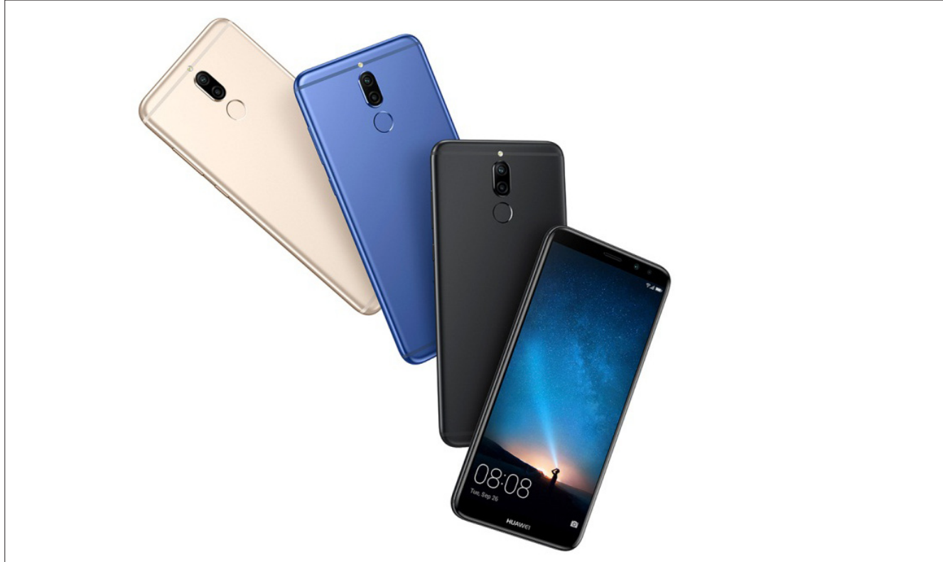
هاتف هواوي الجديد

يتميز الهاتف بأداء استثنائي، كما أنه مزود بشاشة بتقنية العرض الكامل، وتقنية إضاءة الفلاش مخصصة لصور سيلفي، وأحدث خوارزميات جمال الصور (نسخة 4.0)