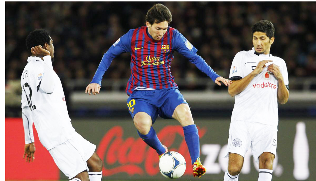
لقطة أرشيفية من منافسات كأس العالم للأندية

بمجرد حل لأوقيانوسيا. وأوضحت أن الفرق الأوروبية، ستتكون من آخر 4 فرق فائزة بدوري أبطال أوروبا، وآخر 4 فرق تأهلت للنهائي في دوري الأبطال، وأفضل 4 أندية في التصنيف، قبل انطلاق البطولة. ويتوقع أن تستضيف الصين هذه البطولة، خاصة أن قطر لن تستطيع استضافتها، في صيف عام 2021، بسبب حرارة الجو هناك. ومن جانبه، قال رينهارد جريندل، رئيس الاتحاد الألماني لكرة القدم، وعضو مجلس الاتحاد الدولي لكرة القدم (فيفا)، عبر حسابه على «فيسبوك»، إنه عارض اقتراحات، طرحت خلال اجتماع مجلس الفيفا، الأسبوع الماضي، بإقامة مونديال الأندية، بداية من 2021، بمشاركة 24 نادياً. واستنضم البطولة 12 فريقاً من قارة أوروبا، و5 فرق من قارة أمريكا الجنوبية، و2 من قارة إفريقيا، و2 من آسيا، و2 من أمريكا الشمالية، وفريق للبلد المستضيف، مع السعي