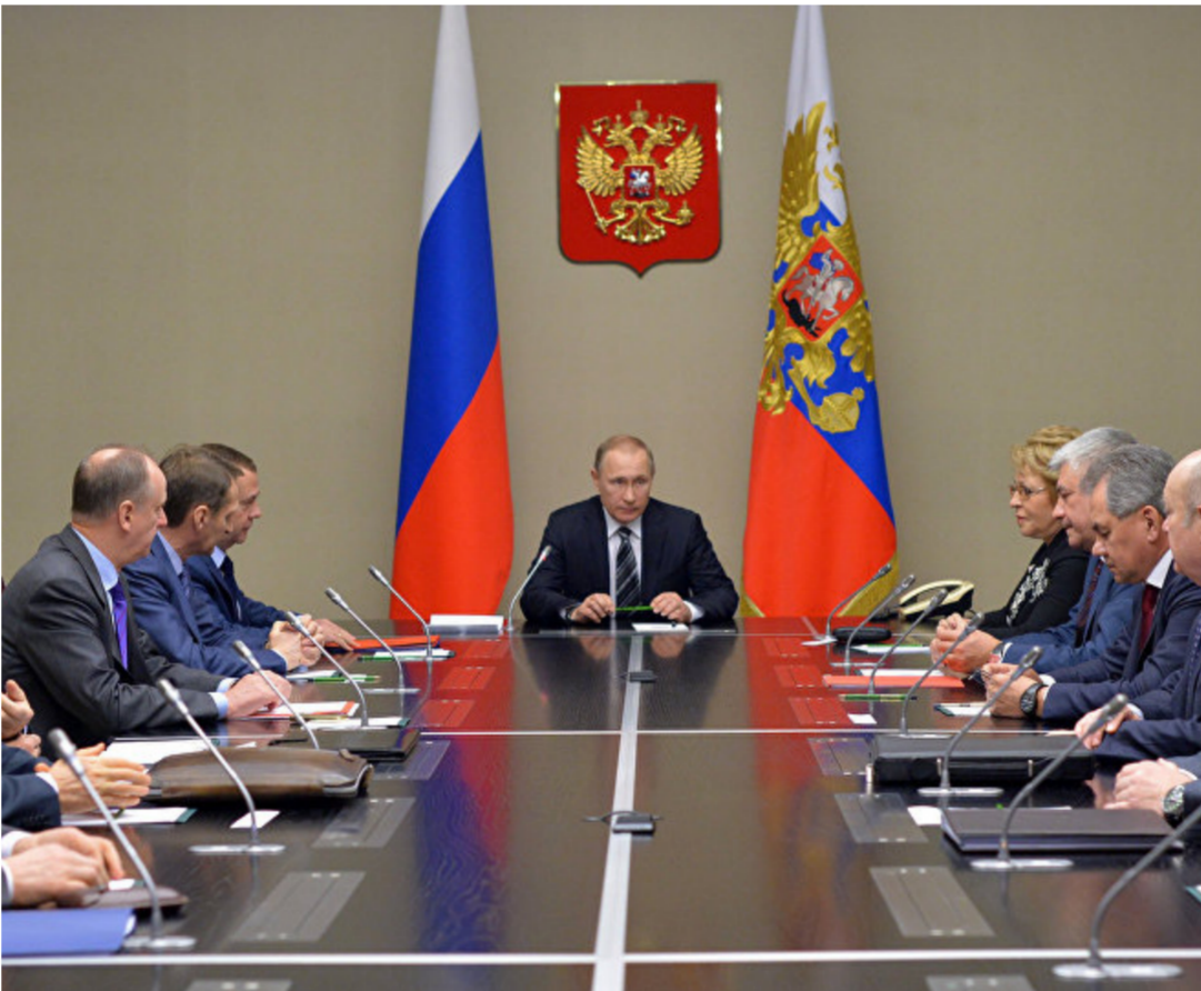
اجتماع مجلس الأمن القومي الروسي

الثالثة 31 تشرين الاول 2017 العدد (3811) Tue. 31 Oct. 2017 issue (3811)