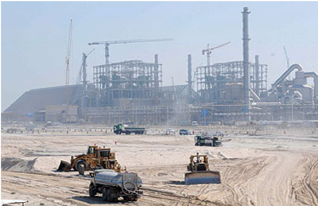
أحد المشاريع السعودية

وفي محاولته عرض التغيير الذي يتطلع إليه. حمل هاتفا قديما من طراز «نوکیا» بيد وآخر حديثا من طراز «آيفون» في اليد الأخرى خلال