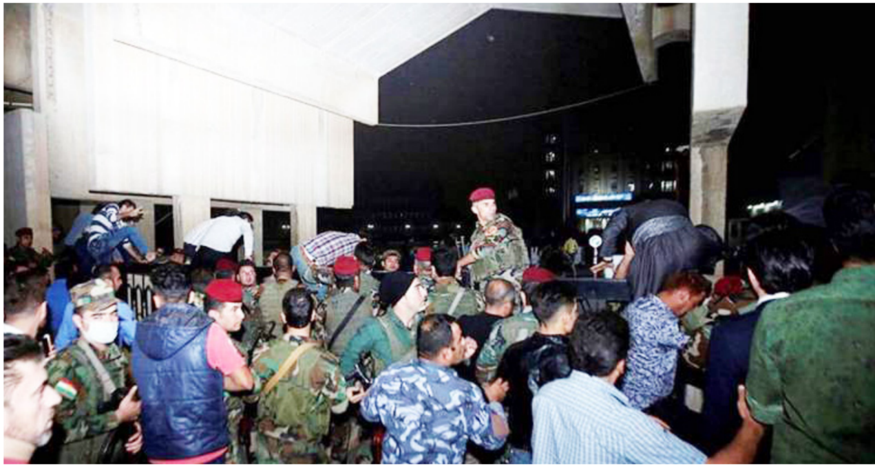
حفظة اقتحام المحتجين لبني برلمان الإقليم

بقرار من القائد العام للقوات المسلحة، لكننا لا نتمنى أن تصل الأمور إلى اسوء ما عليه الآن. "موضوع تدخلنا لحماية الإقليم من الاضطراب مرتبط