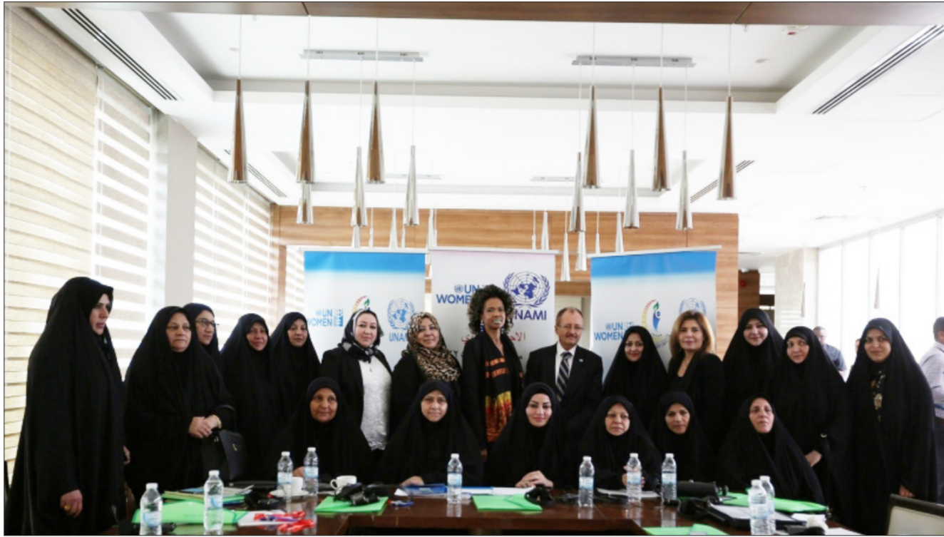
جانب من الاحتفال باليوم العالمي المفتوح في كربلاء