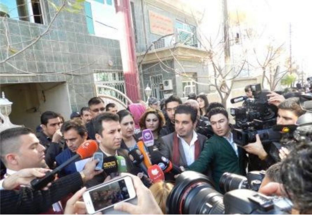
تظاهرة في السليمانية لوقف الاعتداءات ضد الصحفيين (الرشيف)