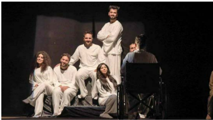
مهرجان الكويت لمسرح الشباب العربي

تطرق المسرحية إلى "مفهوم الإجهاء الجبري" وهي من إخراج وكتابة وميض كاظم. أذ سعى الكاتب إلى توصيل فكرته، وسط التحديات الكبيرة التي تعيشتها المنطقة. جراء الحروب والأرهاب الداعشي. وأضاف سالم: أن الدعم المستمر من قبل وزير الشباب والرياضة السيد عبد الحسين عبطان، في تنمية