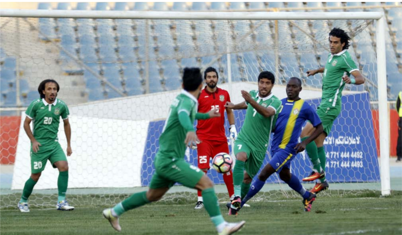
لحظة من مباريات دوري الكرة الممتاز

وقدم رئيس اتحاد الكرة نيابة عن المكتب التنفيذي للأتحاد والأسرة الكروية شكره وتقديره لمواقف الوزير الهادفة التي تدعم الرياضة عموما وكرة القدم بوجه خاص.