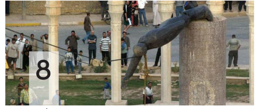
حروب العراق والأفلام الوثائقية