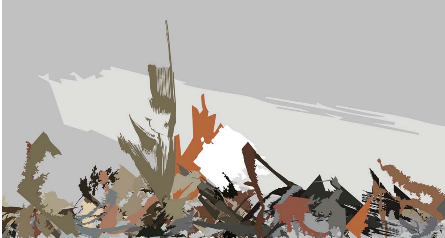
من أعمال الفنان الراحل أحمد الربيعي

استنتج الباحثون من سلسلة مطولة من التجارب العلمية أن ما يولده التكايف في الألفاظ والاستغلال الأكبر للمساحة البيضاء بالمادة المطبوعة تسبب الخرق أو الضيق والنفور نفسه الذي يسببها البياض المبالغ فيه أو الموضوع في غير محله. وتبقى التجارب والتساؤلات تتبادل الأدوار في اعتلاء عرش التفوق من ناحيتي الشكل والمعنى للنص الحديث وببساطة النثري.