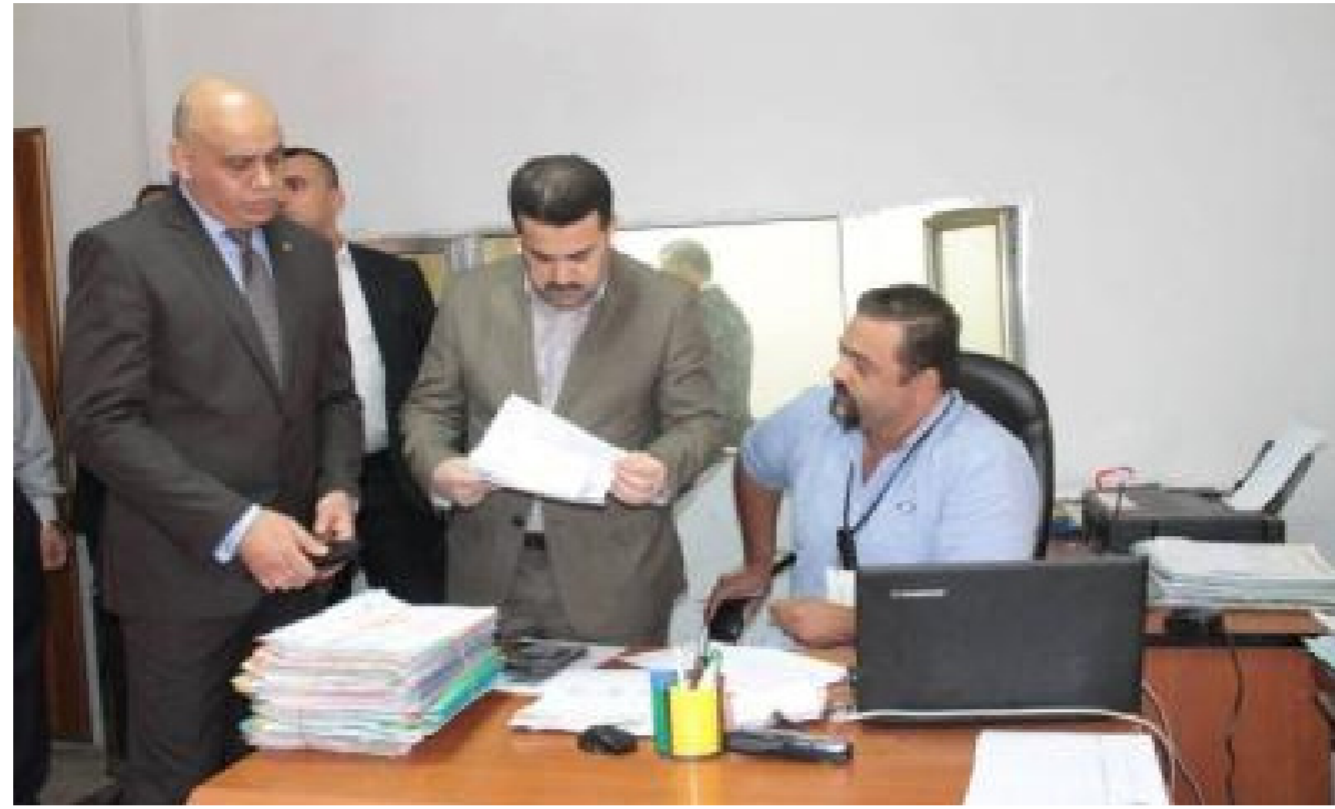
البنك الدولي يطلع على آلية وزارة العمل

في وزارة العمل تنفيذ البرنامج التجريبي للاعانات النقدية المشروطة بالصحة والتعليم في منطقة الصدر/2 بالتعاون مع البنك الدولي ووزارات الصحة، والتربية، والمالية) وبموجب البرنامج سنتمال الاسر التي تم اختيارها بمبالغ مالية تشجيعية مقابل انتظام ابنائهم المتسربين والمتسربين بالتعليم وكذلك انتظام الامهات الحوامل والابناء في برامج الرعاية الصحية التي تنفذها وزارة الصحة وذلك من اجل القضاء على الامية ورفع ثقافة المجتمع صحيا.