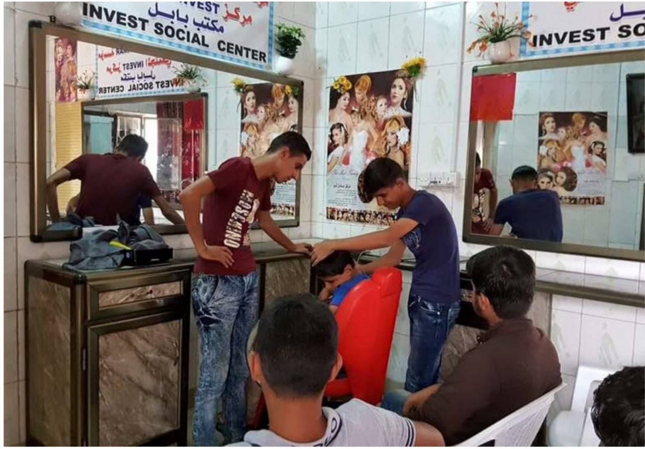
جانب من دورات تأهيل الشباب

والشؤون الاجتماعية الجنابي اهتمامه ودعم الوزارة للمشروع الجديد لإجاه AMAR. نحو البدء خلال السنة القريبة المقبلة