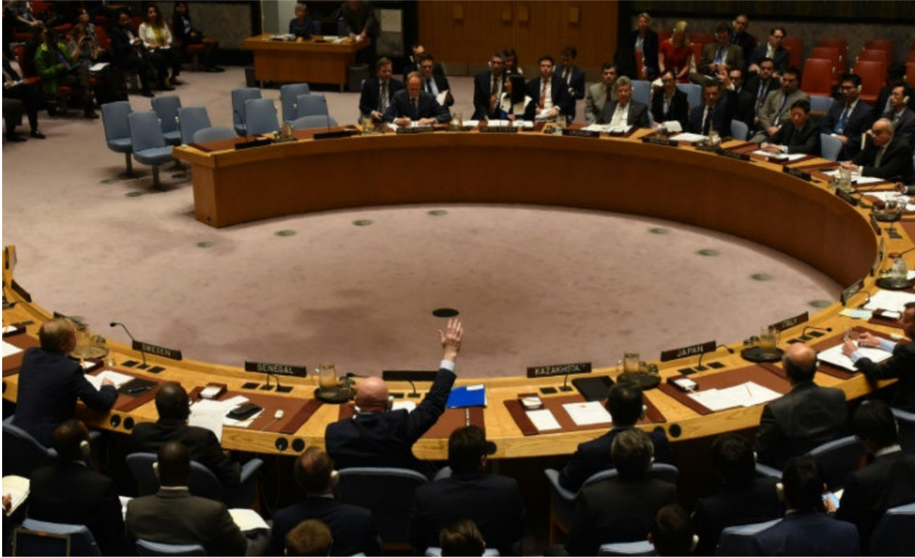
فيتو روسي حول سوريا

غارة سورية كما يدعي الغرب. وأكدت منظمة حظر الأسلحة الكيميائية استخدام السارين في هجوم نيسان، إلا أنها لا تملك صلاحية تحديد المسؤول عن الهجوم. تاركة هذه المهمة للجنة آلية التحقيق المشتركة. وتوصلت اللجنة حتى الآن إلى ان القوات الحكومية السورية مسؤولة عن هجمات بالكلورين على ثلاث قرى في عامي 2014 و2015. وأن مقاتلي تنظيم «داعش» استخدموا غاز الخردل عام 2015.