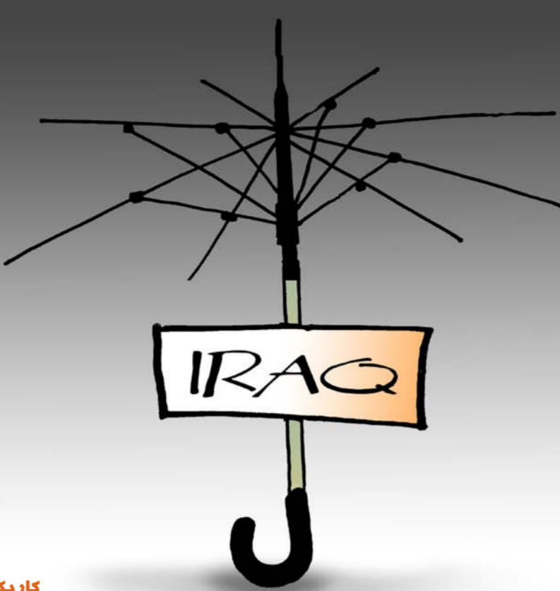
كاريكاتير - عاصم جهاد