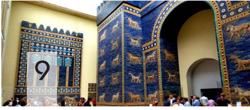
قرب بوابة عشتار يبشر بحرائقه