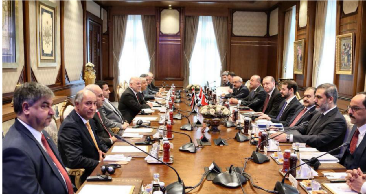
جانب من اجتماع بين الحكومة العراقية والتركية في أنقرة

من خلال تحقيق سريان القانون على جميع الأراضي". على جميع الأراضي كافة لاطراف الشعب العراقي كافة