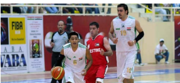
مباراة سابقة لوطني السلة

المقبل عدد من الاسماء والوجوه الجديدة. ويخوض منتخبنا اولى مبارياته في التصفيات مع نظيره الأيراني في عمان في الرابع والعشرين من الشهر المقبل. وتضم مجموعة العراق منتخبات ايران وكازخستان وقطر.