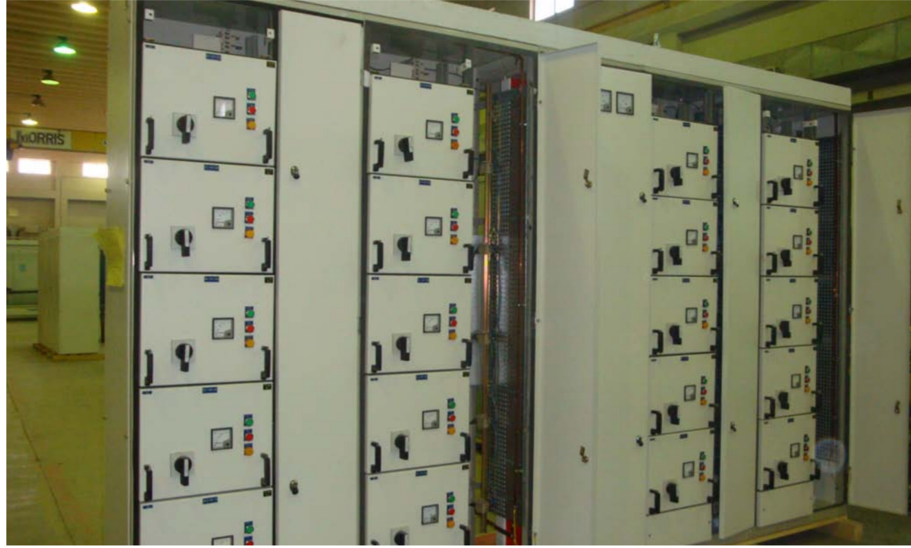
لوحات السيطرة ومنظومات الحماية