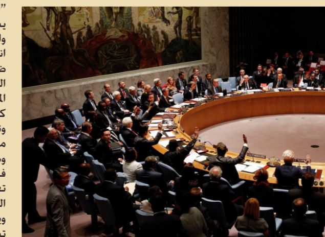
اجتماع سابق لمجلس الأمن

سفيرة الولايات المتحدة لدى الأمم المتحدة نيكي هالي موسكو بأنها "مرة أخرى" تنحاز إلى جانب