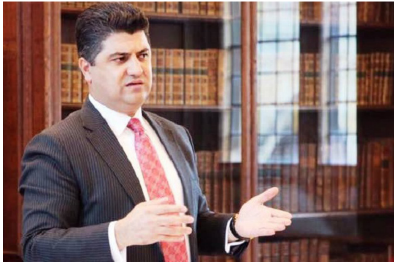
القيادي الكردي لاهور شيخ جنكي

سعدى أحمد بيهر باسم الأخاد الوطني الكردستاني، وانهم لن يسمحو لأي مسؤول في الأخاد الوطني بعد الآن من أراضاخ الحزب لمشيئة الحزب الديمقراطي الكردستاني. وكشف لاهور شيخ جنكي عن ان المؤتمر العام للأخاد الوطني الكردستاني سيتم عقده بعد شهرين من الآن. كاشفاً في الوقت ذاته على أنه سيتم ضخ دماء جديدة في المجلس القيادي والمكتب السياسي، منتقداً بشدة مجلس أمن إقليم كردستان الذي يتراسه جل مسعود البارزاني، مؤكداً أنه يتم استعمال هذا المجلس لصالح مسرور بارزاني الشخصية.