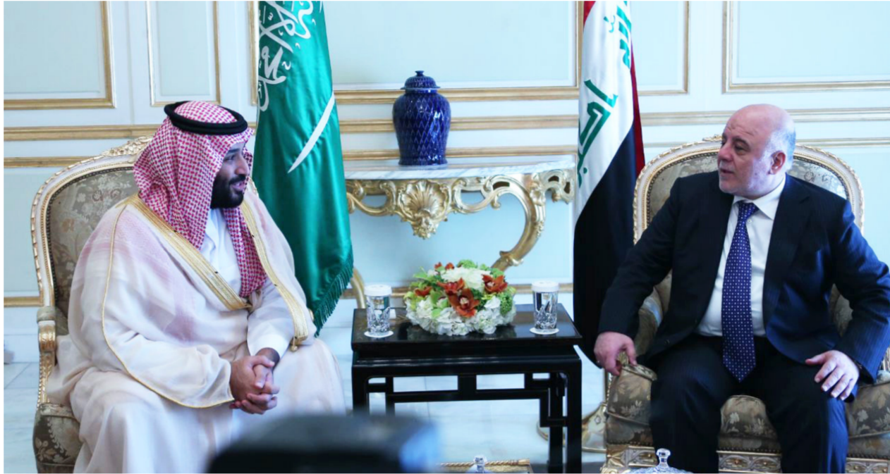
لقاء جمع العبادي بولي العهد خلال زيارته المملكة السعودية

العشرة الماضية 6 مليار و100 مليون دولار.