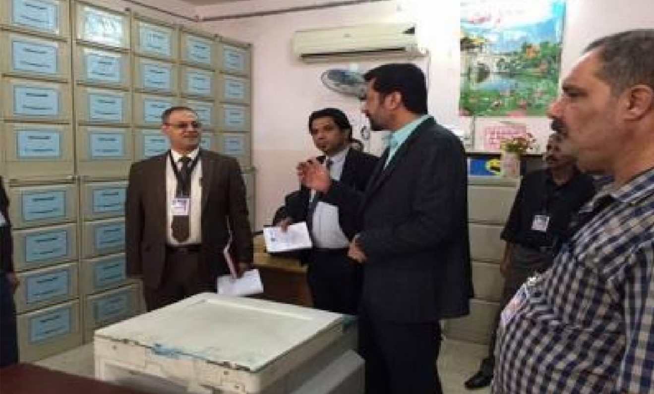
الوزارة حققت إنجازات استثنائية بشأن رعاية نازحي المحافظات المحررة

كما بين المدير العام ان المادة (36) تنص على انه اذا انتهت خدمة العمال لدى الشركة التي يعمل لديها من دون تبليغ دائرة التفاعد والضمان الاجتماعي فستكون الشركة مسؤولة عن دفع الاشتراكات عنه حتى تاريخ انذار اولي وبعد مرور عشرة ايام يتم تصديق المبالغ فيستقوم الدائرة بالاجراءات القانونية من خلال مفاحة دوائر الدولة لغرض عدم ترويح معاملاتهم الا بعد مراجعتهم الدائرة وتأييد التزاماتهم.