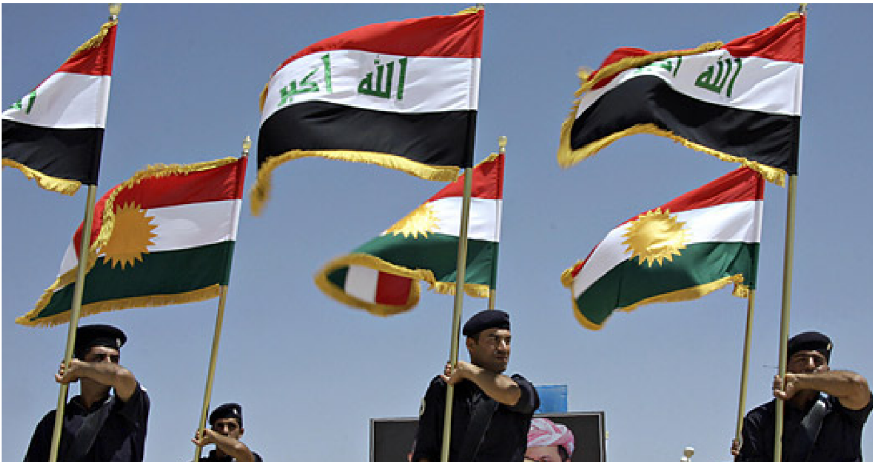
أجواء من التوتر تسود العلاقة بين بغداد وأربيل

ويشكل خاص للخلاص من الاقتصاد الريعي والاستهلاكي والعمل الجدي لبناء صناعة وطنية وزراعة حديثة ومتنوعة لتحقيق الاكتفاء الذاتي وتوفير الأمن الغذائي والاقتصادي. بخلاف الوضع الراهن حيث لا أمن غذائي ولا اقتصادي والاعتماد على موارد النفط الخام لا غير بالعراق ومنه الإقليم أيضاً، والذي لم ولن يساهم في تقدم العراق كله بما فيه الإقليم. واليوم وبعد أن حصل ما حصل على الحكومة الاتحادية ان تتخذ مواقف صارمة إزاء التجاوزات التي وقعت وما تزال ترتكب ضد الكرد في المناطق المتنازع عليها والتي تقود إلى مزيد من التوتر والصراع والنزاع الدموي. كما حصل في خانقين والتون كوبري وكركوك وغيرها. إن قرار سحب "قوات الحشد الشعبي" من المناطق المتنازع عليها بما فيها جماعات "الحشد الشعبي" المحلية مثل "الحشد التركماني والحشد العشائري، سيساعد على إبعاد محاولات الانتقام والإساءة أو التهجير القسري. كما حصل مؤخراً والعمل على إعادة من هجر قسراً أو بسبب خشيتهم من الانتقام إلى مناطق سكنهم.