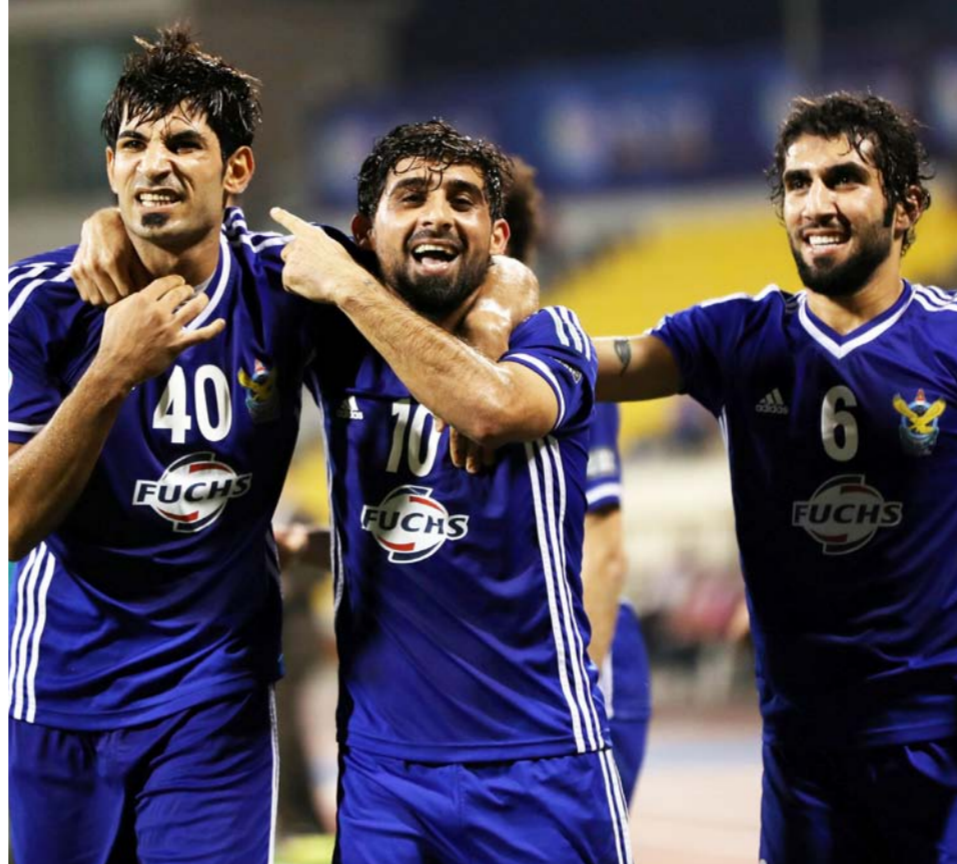
الجويون.. طموحات تجديد الزعامة الآسيوية

الذين دافعوا عن الوانته الزرقاء في المواسم السابقة، ولا سيما ان الفريق الجوي حامل اللقب القاري للنسخة السابقة، بات يملك ثقافة الفوز وحصد الألقاب خارجيا، وليس على الصعيد المحلي فحسب، لذلك فانه سيكون جدرا بالتتويج للمرة الثانية على التوالي والاحتفاظ بكأس الاتحاد الآسيوي. والذين دافعوا عن الوانته الزرقاء في المواسم السابقة، ولا سيما ان الفريق الجوي حامل اللقب القاري للنسخة السابقة، بات يملك ثقافة الفوز وحصد الألقاب خارجيا، وليس على الصعيد المحلي فحسب، لذلك فانه سيكون جدرا بالتتويج للمرة الثانية على التوالي والاحتفاظ بكأس الاتحاد الآسيوي.