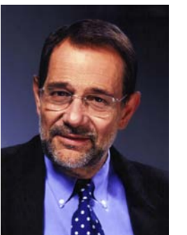
خافير سولانا الممثل الأعلى السابق للاتحاد الأوروبي

كان شعار الفائزين في البريكسيت «دعونا نعيد السيطرة» يعبر عن الشعور الذي يناسب بوضوح الأغلبية الضئيلة من الناخبين البريطانيين الذين أيدوا الانسحاب من الاتحاد الأوروبي. وبالمثل. فإن العديد من ناخبي ترامب مفتنعين بأنه على القوى المتراكمة من