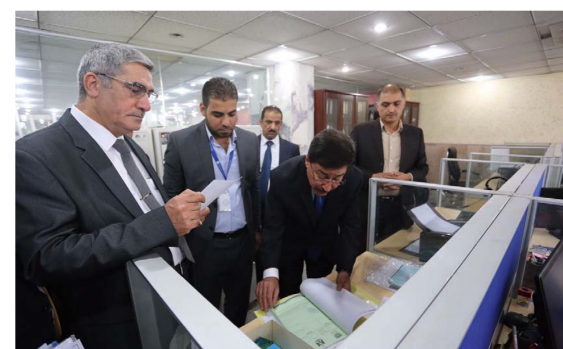
محافظ البنك المركزي في جولة داخل له داخل البنك

في نهاية الستينيات مع تطور التجارة العالمية، وتكونت كمنظمة عام 1973 ومقرها الرئيسي بلجيكا وبدء نشاطها عام 1977. وبلغ عدد الدول المشتركة فيها أكثر من 209 دولة من بينها معظم الدول العربية ويزيد عدد المؤسسات المالية المشتركة على 9000 مؤسسة. ويهدف نظامها المتطور الى تقديم أحدث الوسائل العلمية في مجال ربط وتبادل الرسائل والبيانات بين جميع أسواق المال من خلال البنوك المسؤولة عن تنفيذ ذلك بمختلف الدول، ويوفر الحماية والسرعة الكاملة لمثل هذه التعاملات ومتابعة تسليمها للجهات المعنية. وكان البنك المركزي قد الزم المصارف وشركات التحويل بالاجتماع مع الجهات الاستشارية المتعاقد معها لأغراض التنظيم. وقال البنك انه «يهدف الارتفاع وتحقيق الشفافية في عمل المصارف العراقية مع الجهات الاستشارية