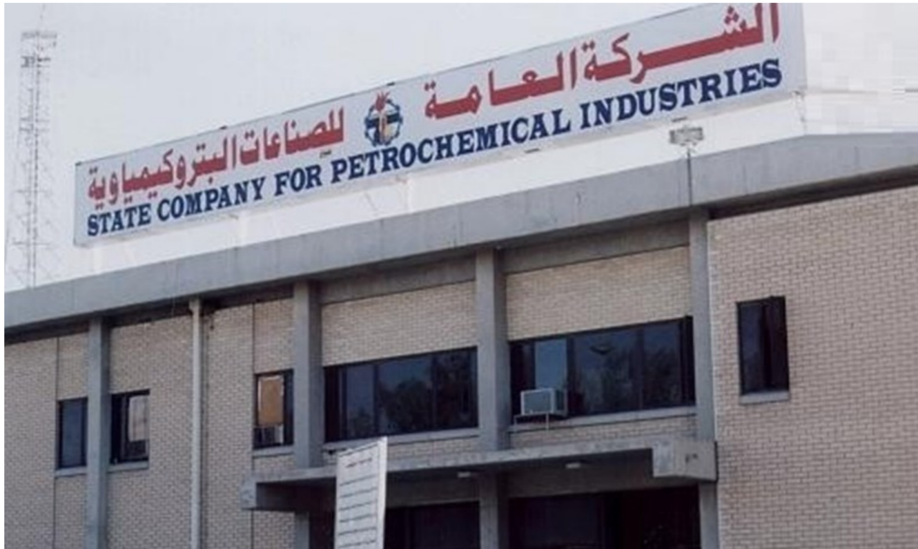
الشركة العامة للصناعات البتروكيمياوية