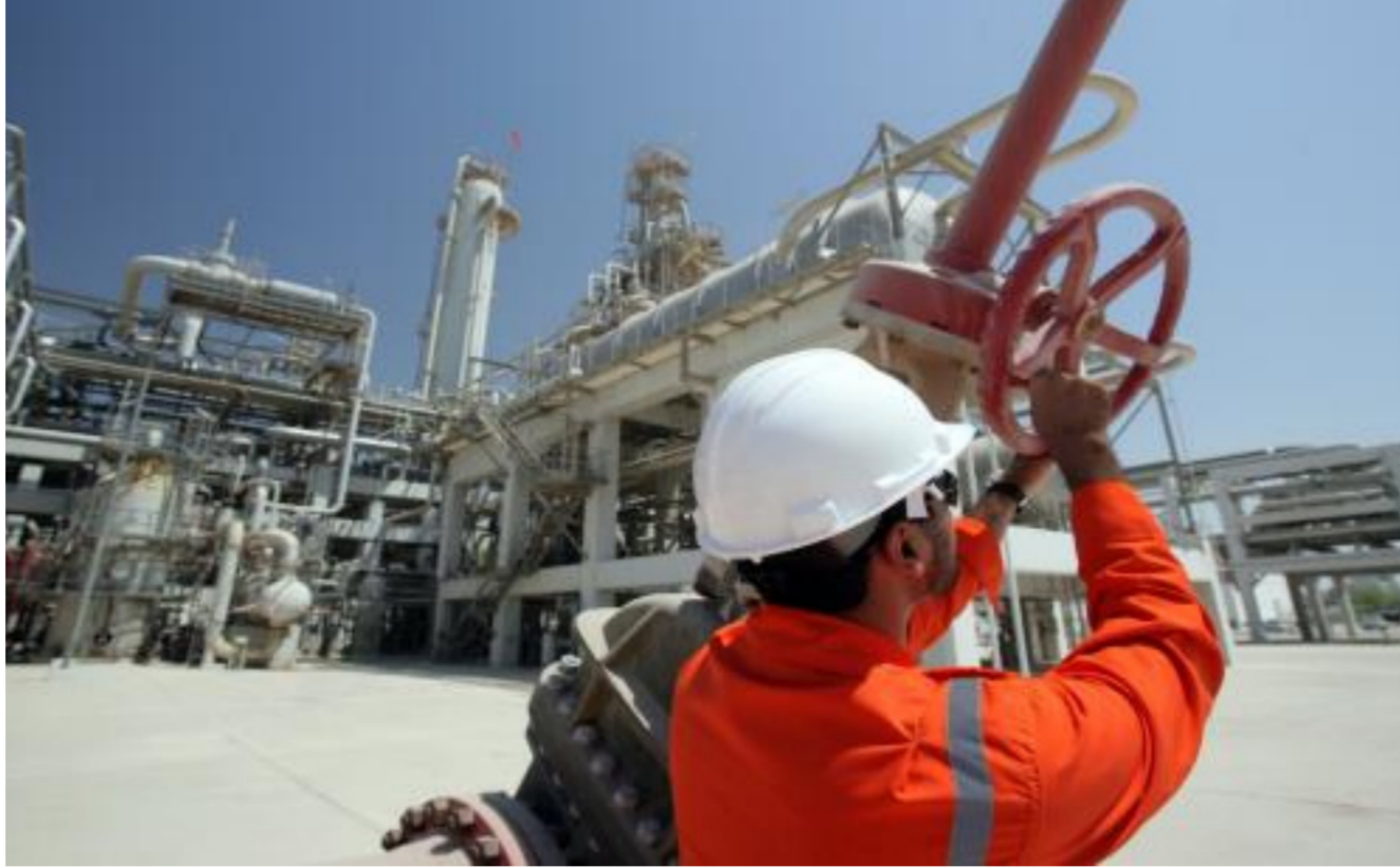
أحد حقول الغاز في البلاد

ومضاعفة صادرات مكثفات الغاز لثلاثة أمثالها في 2017 بفضل جمع كميات أكبر منهما من حقول النفط الجنوبية.