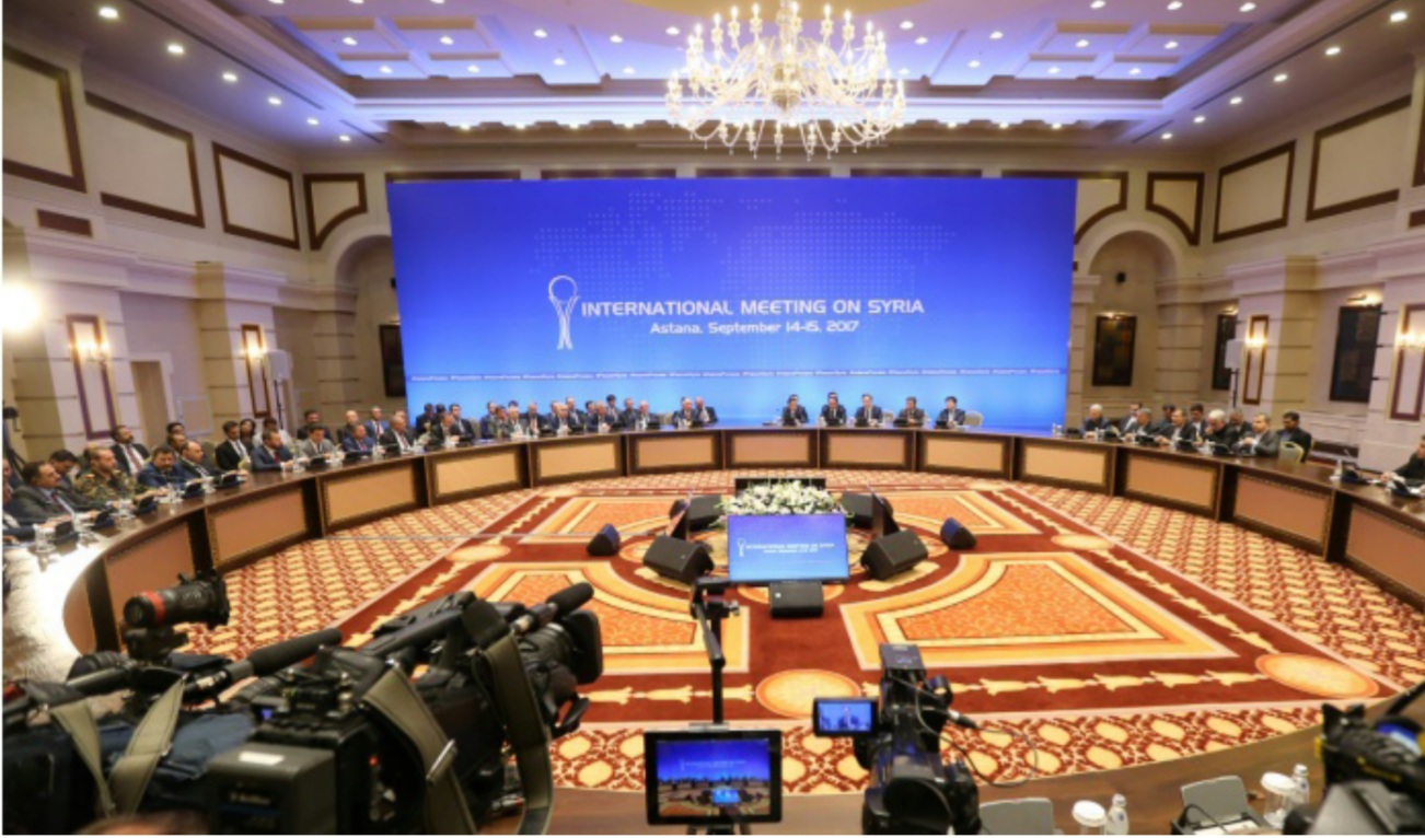
نشر قوات من تركيا وموسكو وإيران للمراقبة في ادلب