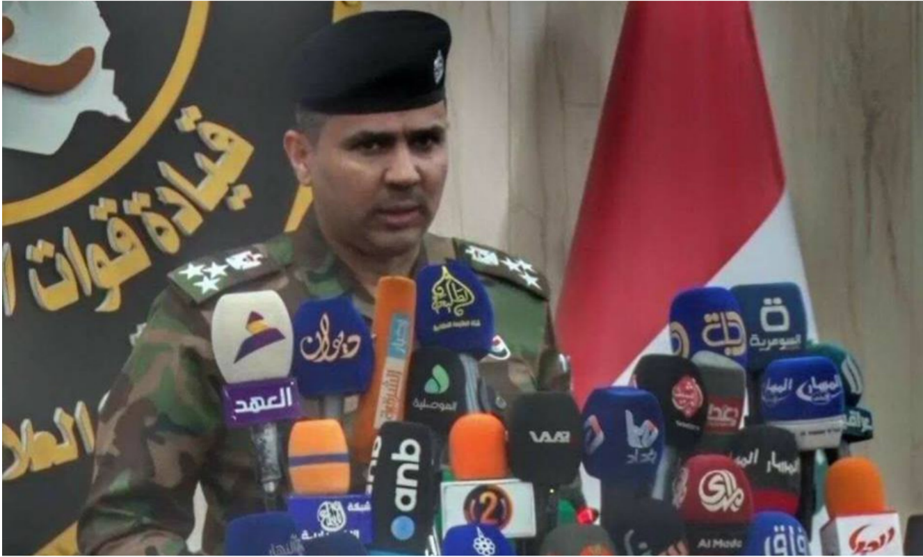
العميد سعد معن

وتدعيم شراكة حقيقية بينهما يجعلهما ركيزتين أساسيتين في تحقيق الأمن الوطني الشامل حيث للإعلام دوره المهم في تعريف المواطن بالتحديات الأمنية وتوعية المواطنين بدورهم في الإسهام بحل مشكلات المجتمع ومحاربة الظواهر السلبية وصياغة معادلة متوازنة بين الأمن والمواطنين. وأضاف العميد معن إن التعاطي مع القضايا الأمنية إعلامياً يجب أن يتم على وفق معايير المهنية والأخلاقية والموضوعية واستعمال الرسالة الإعلامية الأمنية وتوظيفها بنحو هادف وعلى نحو يجعلها قادرة على التعبير الموضوعي عن الحدث .