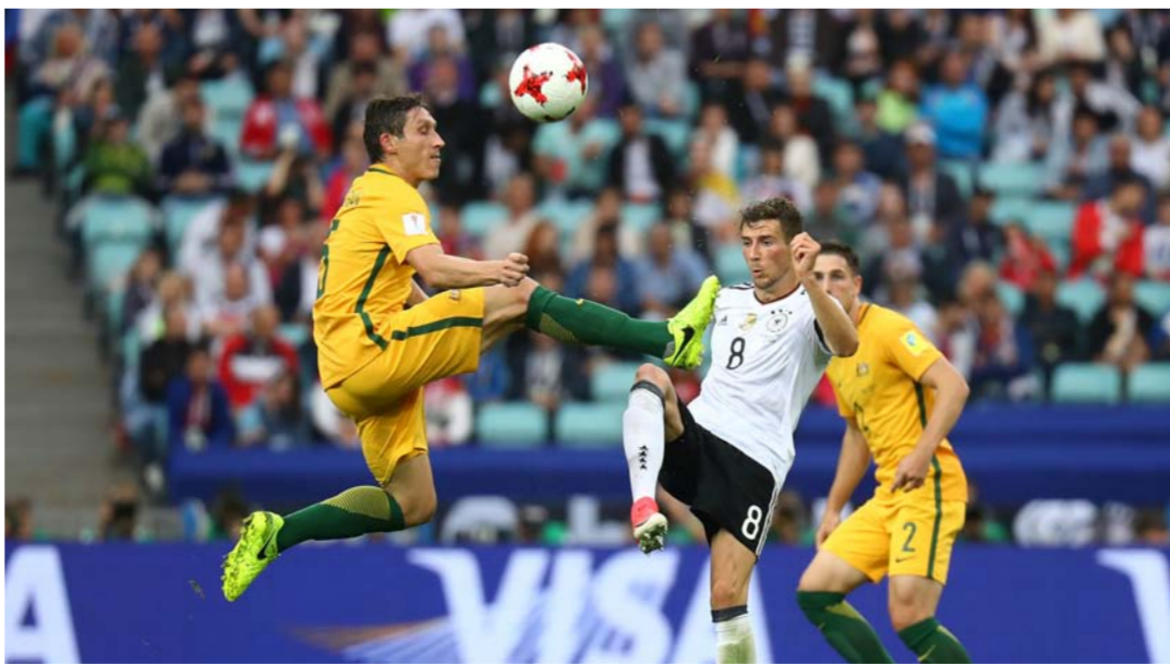
جانب من احدى مباريات المونديال

الفئة الثالثة ما بين 105 دولارات للمباراة في دور المجموعات وصولاً إلى 175 دولاراً للمباراة في دور الثمانية.