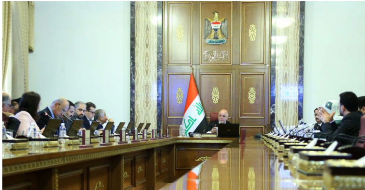
اجتماع مجلس الوزراء "ارشيف"

والمتروكيمياوية، ومشاريع السدود الخزانة والري وصيانتها، ومشاريع الموانئ النهرية والمطارات والطرق وسكك القطارات الحديدية. إضافة إلى مشاريع البنى التحتية الأخرى". وتابع الحديثي أن "رئيس مجلس الوزراء حيدر العبادي سيتراس اللجنة التي تتألف من وزير التخطيط والتعاون الأجنبي، ووزير المالية، ووزير الاسكان والإعمار، ووزير الصناعة والمعادن، ومدير المشركة في بيان له حصلت صحيفة "الصباح الجديد" على نسخة منه إن "قوات الجيش المتمثلة بقيادة عمليات الانبار وقوات الحشد الشعبي وقوات الحدود شرعت بعملية واسعة لتحرير عكاشات وفتح الطريق