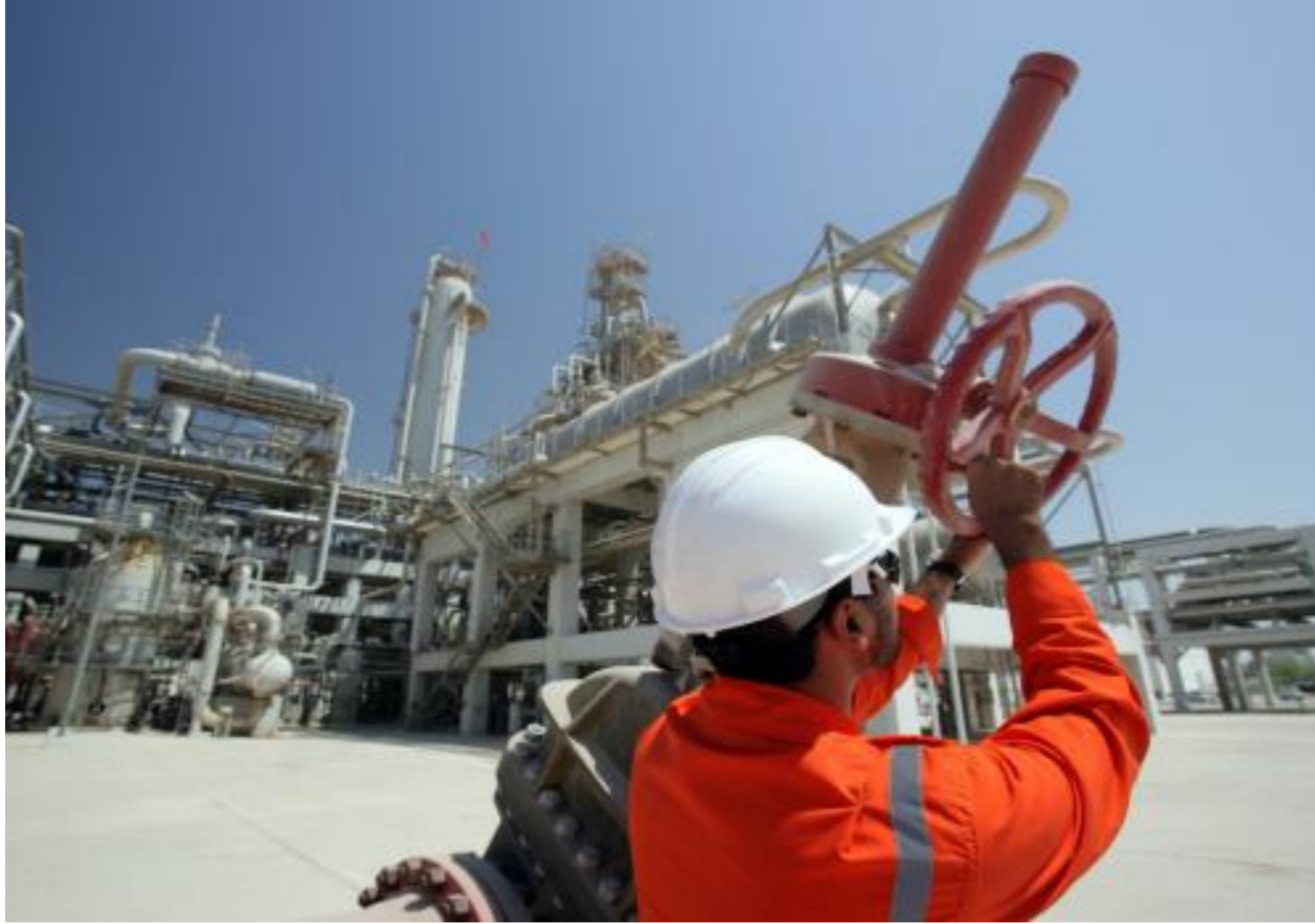
أحد حقول الغاز في البلاد