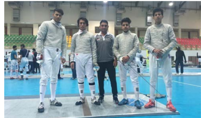
شباب السيف العربي

بغداد - فلاح الناصر : يشترك رئيس الاخاد العراقي للمبارزة زياد حسن في اجتماعات الجمعية العمومية للاتحاد الدولي التي تعقد في دولة الإمارات العربية المتحدة يومي 23 و24 من شهر تشرين الثاني المقبل. وبين حسن ان مشاركة العراق ستكون فرصة جديدة لتتسوق العمل المشترك والحصول على الدعم المتواصل من الاخاد الدولي الذي يرأسه الروسي أشكير أسمانوف. مشيراً إلى ان تشكيل الاخاد الدولي يضم شخصيات عربية. أبرزها نائب رئيس الاخاد الدولي المصري ثامر العربي. فيما تشغل الجزائرية فريال صالح عضوية المكتب التنفيذي. مؤكداً ان هنالك تنسيقاً عالياً مع الجميع من اجل دعم مسيرة رياضة المبارزة في العراق وتحقيقها للأفضل في المشاركات المقبلة.