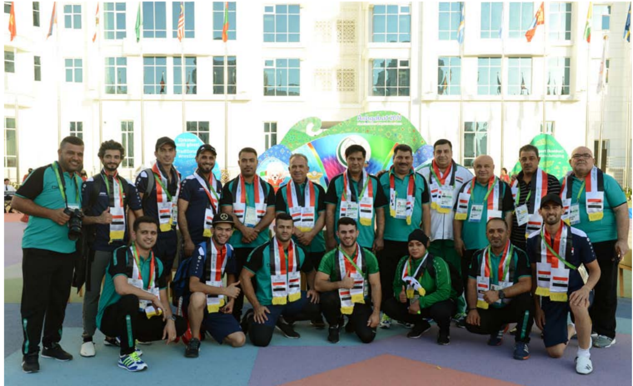
الوفد العراقي في تركمانستان

لاغير. ولديها العزيمة والاصرار لطرح منافساتها والتفوق عليهم لما تتمتع به من خضير عال يمكنها من اثبات الوجود في هذا الحفل الآسيوي الرائع .