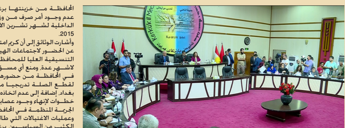
مجلس محافظة كركوك