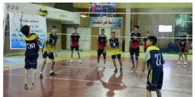
مهرجانات ناجحة للموهوبين

والخشد الشعبي الباسل وخبر الموصل من شر الارهاب الداعيني . وخصص الاجتماع لبحث البيات وخطط العمل المتعلقة بالمهرجانات الرياضية المقبلة والتي تعتمد الدائرة تنفيذها على التوالي عقب عطلة عيد الأضحى المبارك . انطلاقاً من المهرجان الخاص بالمركز الوطني لرعاية الموهبة الرياضية لكرة السلة. حاثاً تلك اللجان على بذل المزيد من الجهود وتعميق التعاون فيما بينها بعكس صورة