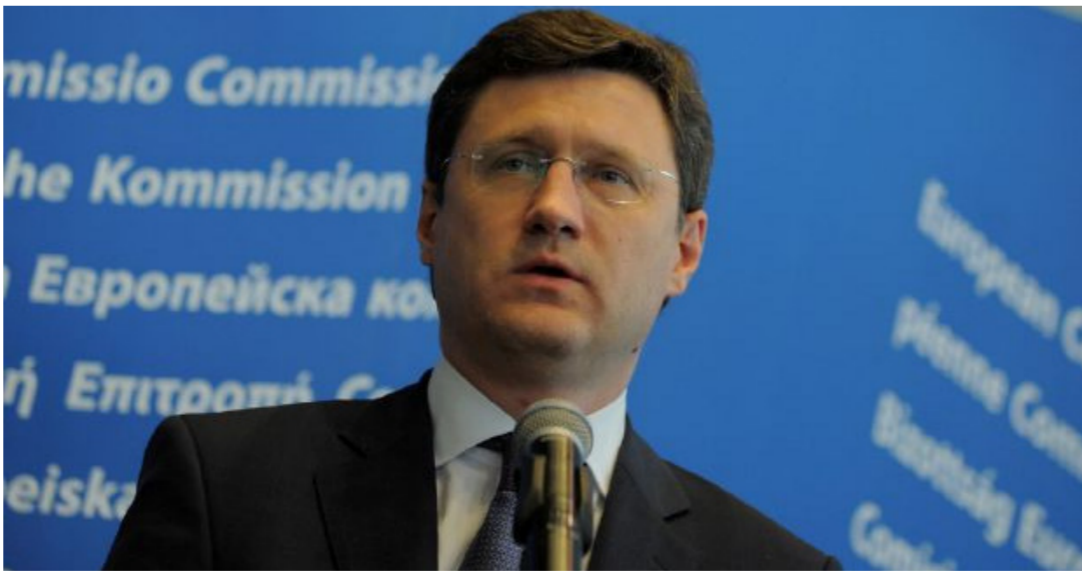
وزير الطاقة الروسي ألكسندر نوفاك

على الصعيد ذاته. توقع وزير النفط الكويتي عصام المرزوق في تصريح نشرته صحيفة الراي الكويتية أمس الأربعاء أن تستمر أسعار النفط الخام بارتفاع بين 50 و55 دولاراً للبرميل خلال الفترة المقبلة. ونقلت الصحيفة عن الوزير قوله إن استراتيجية منظمة أوبك "تسير وتضي دعماً على الطريق الصحيح". وأضاف أن "مؤشرات الانخفاض في