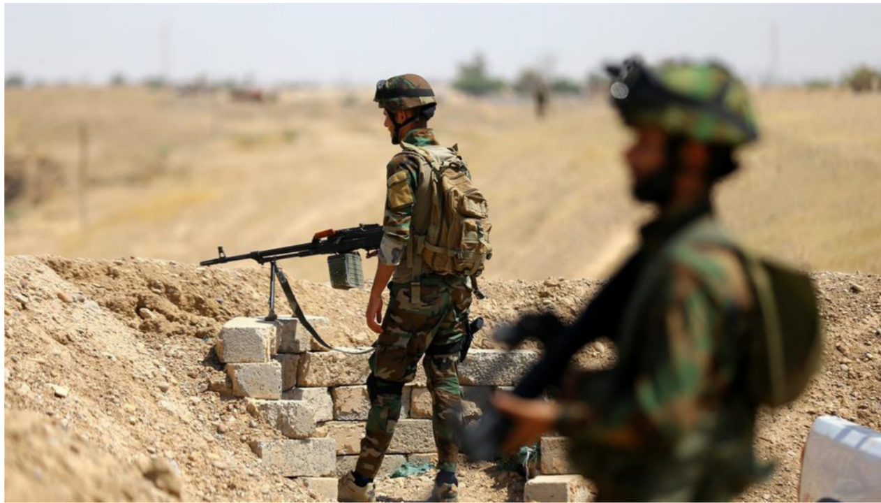
الاستعدادات العسكرية لمعركة تحرير الشرقا والحويجة

مناطق ما تزال تحت سيطرة داعش في العراق وخاصة قضاء الحويجة. وقال المصدر في حديث خاص لصحيفة "الصباح الجديد" إن اجتماعا لقيادات الجيش وعمليات شرق دجلة وضعت الملامح النهائية للمعركة المرتقبة لتحرير ما تبقى من مناطق صلاح الدين وجبال أكد. في وقت سابق، ان القوات الأمنية ستتوجه لتحرير أطراف صلاح الدين وبغداد وكركوك من دنس عصابات داعش في الأيام المقبلة. وقال الغاني في بيان صحفي تلقت صحيفة "الصباح الجديد" نسخة منه ان "القوات الأمنية حرت محافظة نينوى بالكامل" مبينا ان "القوات تستكمل تحرير أطراف صلاح الدين وبغداد وكركوك في الأيام المقبلة" وأضاف "القوات ستسحق رؤوس الدواعش العفنة في تلك المناطق". وأكد مصدر عسكري رفيع المستوى في قيادة العمليات المشتركة، أمس الأربعاء، ان قيادة العمليات رسمت خريطة المعركة لتحرير ما تبقى من