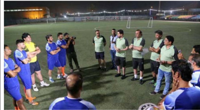
جانب من تدريبات نجوم العراق