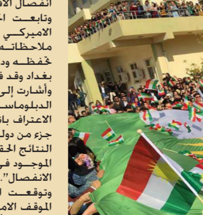
الاستفتاء بين التأييد والمعارضة

بغداد - الصباح الجديد: قضت المحكمة الاتحادية العليا، أمس الأربعاء، بأن الزام مجلس النواب للحكومة الاتحادية بوضع قانون الموازنة التي تخص قانون الموازنة كانت تتعلق بعقود التراخيص وأخذت تسلسل المادة (48) من قانون الموازنة، وأضاف أن "تلك المادة أقرت الحكومة الاتحادية ومن ضمنها وزارة النفط بمراجعة عقود