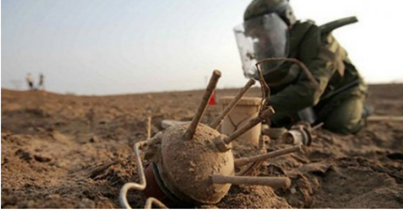
جهود كبيرة لازالة المتفجرات

إزالة مخلفات إرهابيي "داعش" من الألغام والمتفجرات في المناطق المحررة. وذكر بيان لوزارة الخارجية ان مثل العراق الدائم لدى الأمم المتحدة في جنيف السفير موبد صالح أفتتح معرضاً للصور الفوتوغرافية عن الآثار الإنسانية التي خدتها الألغام والعبوات الناسفة على المجتمع العراقي في مقر البعثة الكندية، والتي جسدت معاناة المواطنين في تلك المناطق من آثار الألغام والعبوات الناسفة التي خلفتها عصابات داعش الإرهابية في المناطق التي خربها القوات العراقية. والحكومة العراقية تواجه صعوبات كثيرة في عملية إزالتها. وأشار البيان الى ان العراق يحتاج الى دعم أكبر من المجتمع الدولي والمنظمات الدولية المعنية بإزالة الألغام لمعالجة هذه المشكلة عبر تزويده بالبعثات والتكنولوجيا المتطورة.