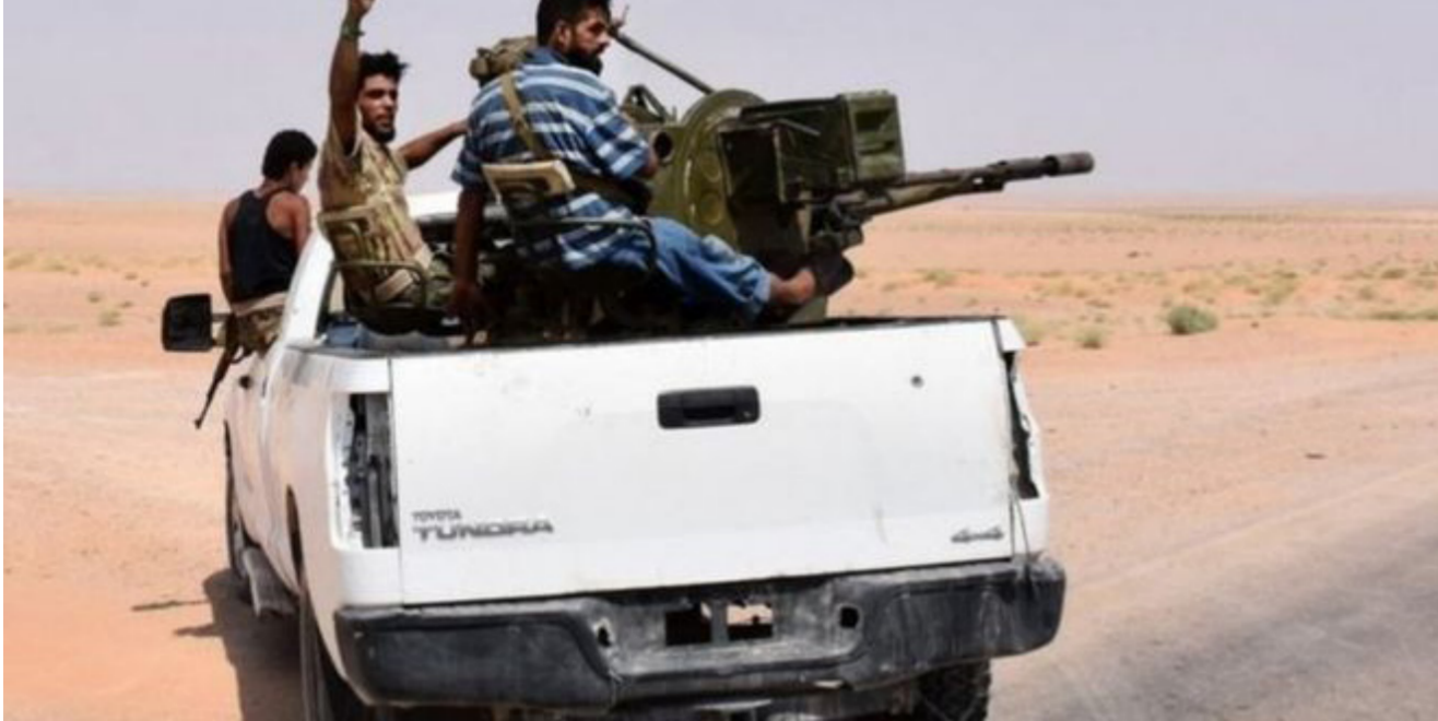
الجيش السوري يصل الى دير الزور

التنظيم بأنها عاصمة الخلافة . مقاتلو تحالف قوات سوريا الديمقراطية المدعوم من الولايات المتحدة . وأوردت الوكالة السورية أن الطيران الحربي دمر رتلا من 10 سيارات للتنظيم أثناء فرارهم من الجبهة الجنوبية الغربية لمدينة دير الزور باتجاه مدينة الميادين شرقا. وأشارت إلى أن اشتباكات عنيفة دارت مع المسلحين الذين كانوا يطوفون قاعدة اللواء 137 قبل أن يفر المسلحون من مواقعهم مخلفين وراءهم أسلحتهم، إضافة إلى الاشتباكات التي دارت أثناء تقدم وحدات الجيش غرب المدينة.