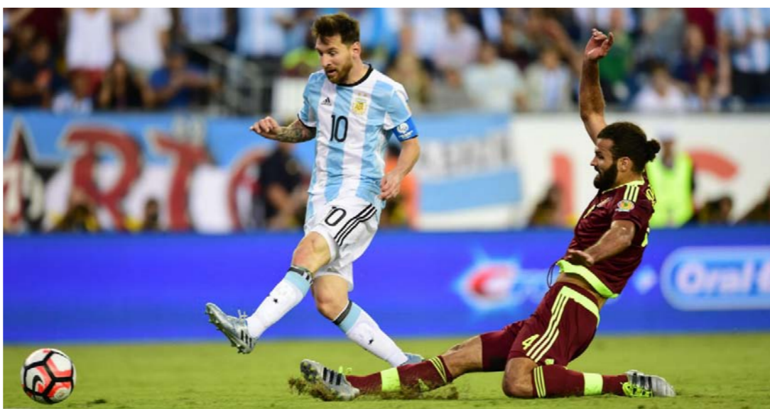
ميسي يحاول التخلص من الدفاع الفنزويلي

الاداء الهجومي للمنتخب. ويتقى أمام الأرجنتين في مباراتين بالتصفيات عندما تستقبل بيرو، في الخامس من الشهر المقبل. قبل أن تزور الإكوادور في العاشر من نفس الشهر. وفقد منتخب الأرجنتين، نقطتين ثمينتين، أمام ضيفه فنزويلا، الليلة الماضية، بتعاده الإيجابي 1-1. ضمن تصفيات قارة أمريكا الجنوبية المؤهلة لمونديال روسيا 2018. وفاز المنتخب الأرجنتيني بكل مبارياته الست السابقة في التصفيات ضد فنزويلا. وكان من المتوقع أن يكرر ذلك ضد الفريق الذي يتبدل الترتيب ولم يحقق أي انتصار في عشر مباريات.. وبقية الأرجنتين في المركز الخامس في تصفيات أمريكا الجنوبية قبل جولتين على النهاية، بعيداً عن المراكز الأربعة الأولى التي تؤهل مباشرة للنهائيات. إلى ذلك، عرّض الأرجنتيني أنجيل دي