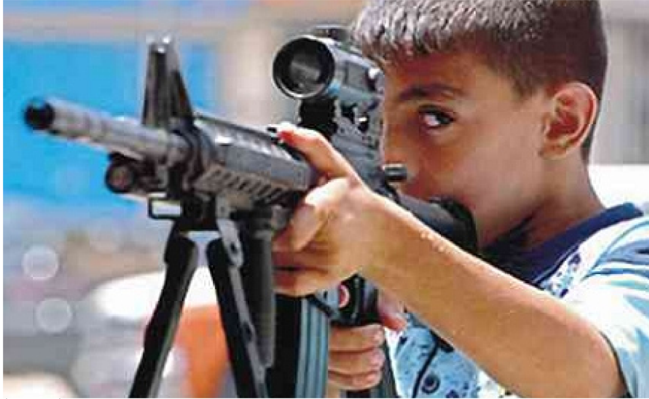
طفل يحمل سلاحاً بلاستيكياً