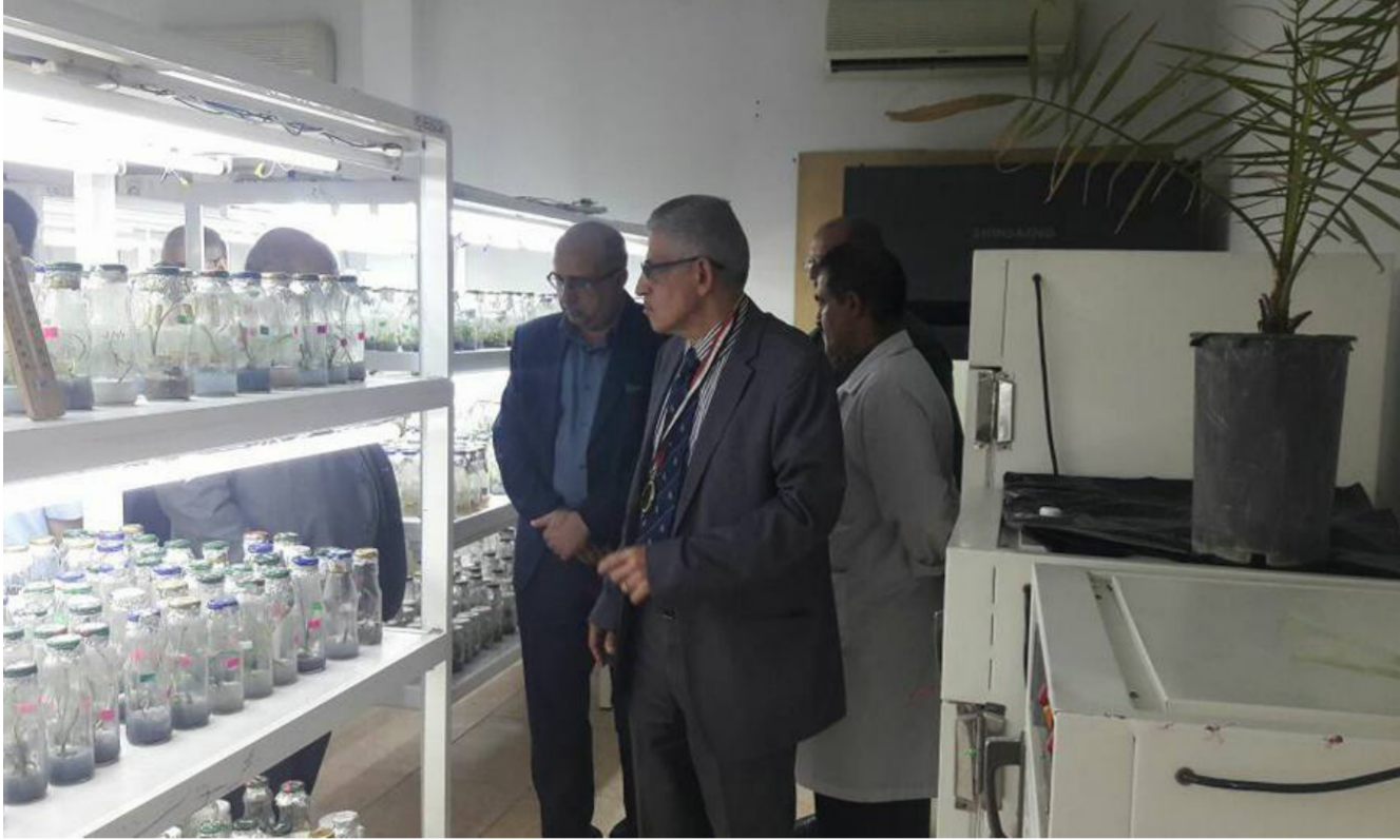
رئيس جامعة البصرة خلال زيارته لمركز أبحاث النخيل

الجودة التي تضمنها المواصفات القياسية الدولية ISO 9001 إصدار 2000 وتعديلاتها اللاحقة ودليل الجودة الصادرة عن وزارة التعليم العالي والبحث العلمي العراقية فضلاً عن ملاحظة أفاق التطور في جوانبه العملية والبحثية كافة.