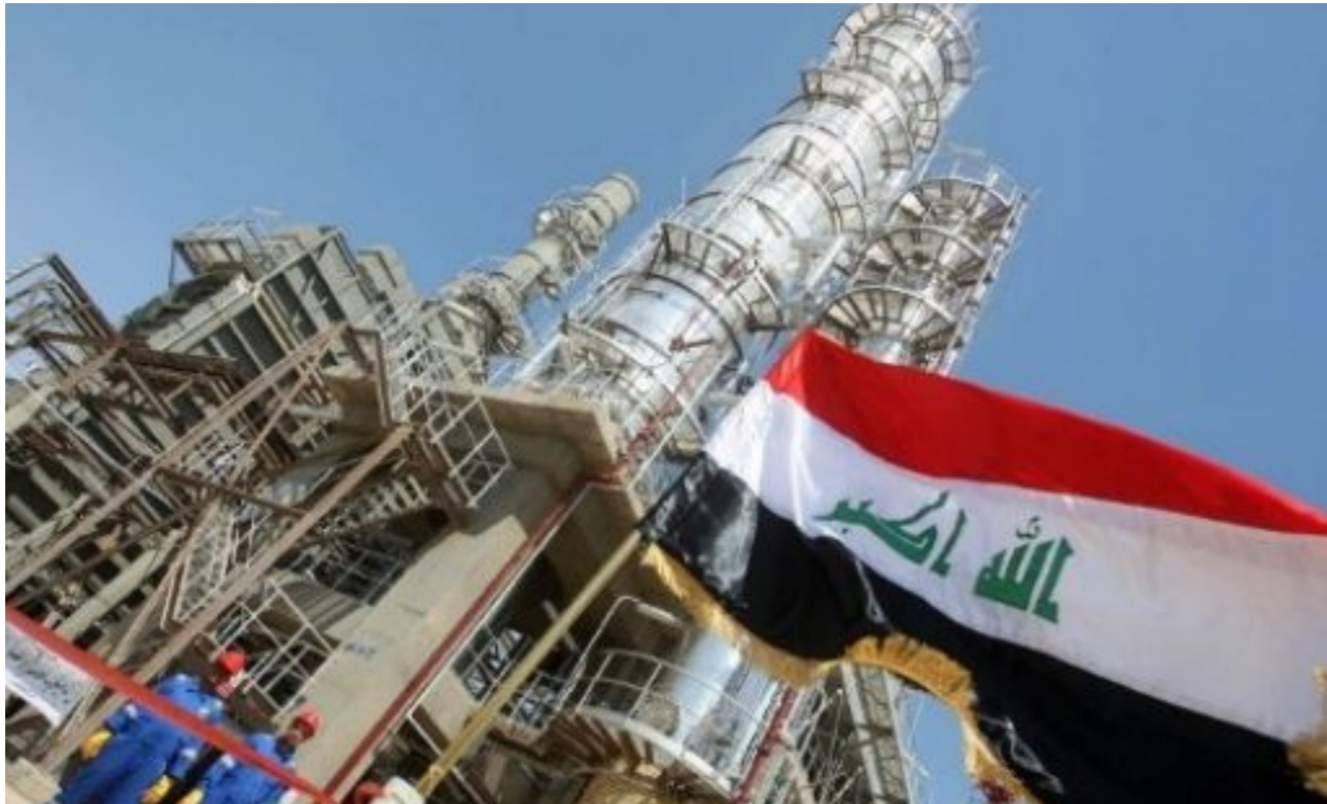
أحد الحقول النفطية

مخزون الوقود. وتظهر بيانات منصة تومسون رويترز إيكون أن نحو 250 ألف برميل من الطاقة التكريرية اليومية في جمهورية الدومنيكان الذي تركه الإعصار هارفي على مخزونات الوقود. لكن محللين يقولون إن الحصول على الصورة كاملة سيستغرق أسابيع.