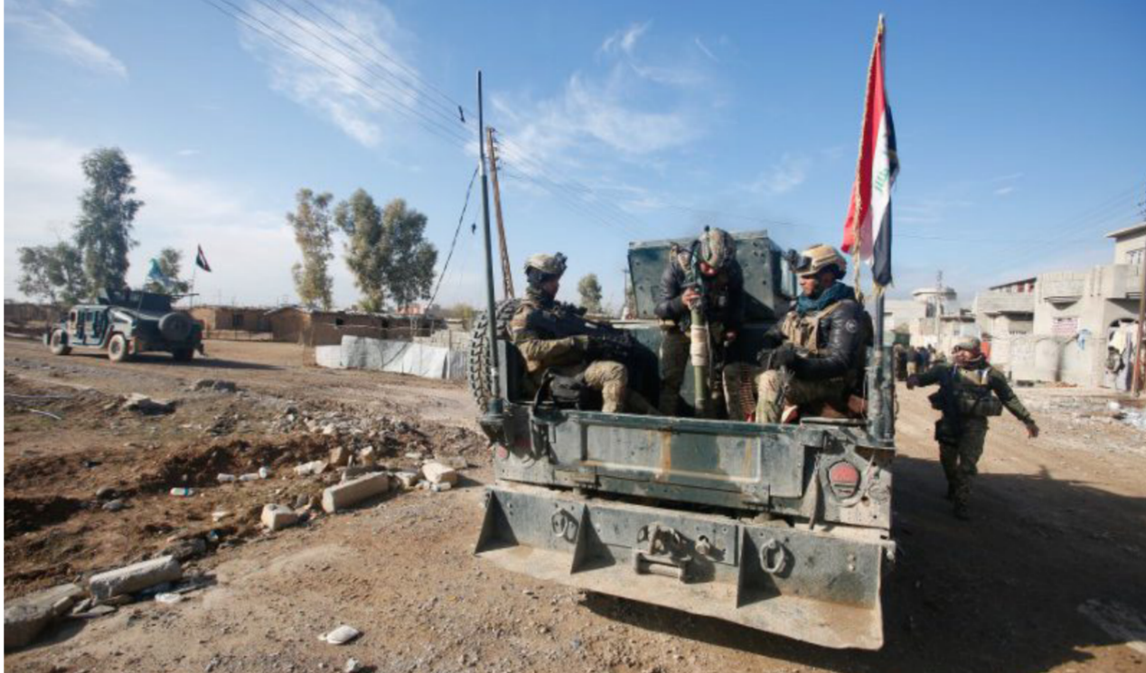
القوات المشتركة في الجانب الأيسر من الموصل

ستكون معقدة بعض الشيء لأنها المعقل الأخير للتنظيم المحصور فيها ولا يوجد له أي مخرج إلى جانب أن المنطقة قديمة وفيها أزقة ضيقة وعدد السكان فيها كبير ما يمنع استعمال أسلحة ثقيلة. وتوقع أن "تنتهي العمليات العسكرية بالوصول في غضون شهرين حيث سيتم القضاء على وجود داعش كلياً في المدينة. مشيراً إلى أن القوات الأمنية لديها خبرة سابقة مع المدينة وهناك ارتباط من طريقة تعامل الأجهزة الأمنية مع المدنيين. وأوضح قائد عمليات قادمون