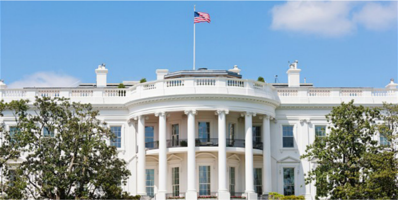
مبنى البيت الأبيض

تتعلق إلى مناقشة الأمر أثناء الزيارة. كما يأتي البيان بعد ساعات من إعلان نتنياهو أنه يخطط لإنشاء مستوطنة جديدة في الضفة الغربية المحتلة، وذلك في خطوة هي الأولى من نوعها منذ أكثر من 20 عاماً.