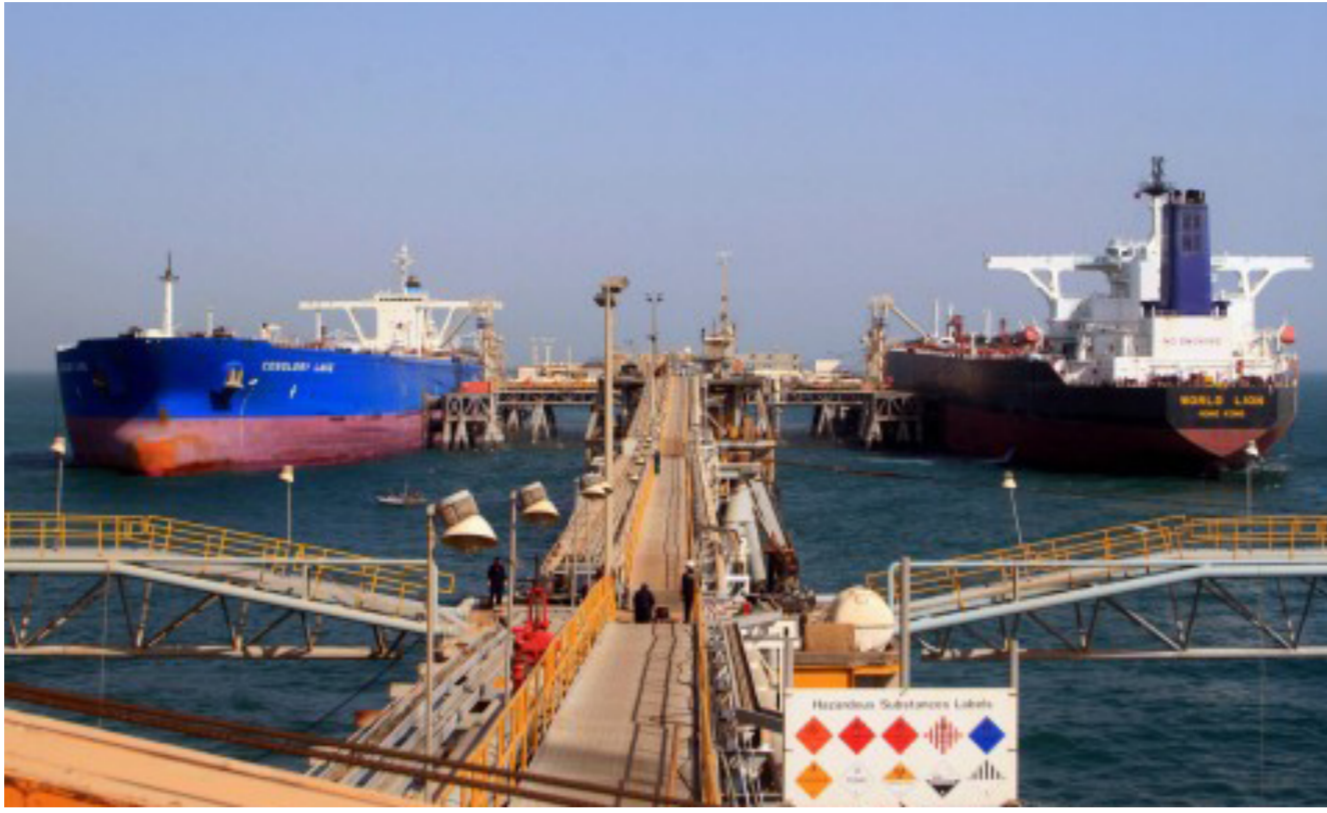
ناقلات للنفط في أحد موانئ البصرة