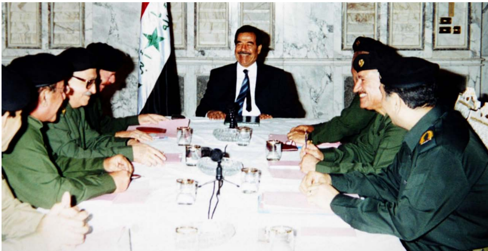
صدام وعزت الدوري وطارق عزيز مع عدد من الوزراء وهم يتردون البرزات العسكرية

الصهيونية تعد وحدة العرب كونها مناقضة لوجودها، وبناءً على ذلك، فإن خطط الصهيونية في الدفاع يستند إلى المبدأ القائل إن الأمة العربية يجب أن تدمر، ولكي تقوى الشعور بعدم الالتزام بمفهوم القومية العربية، أي بمعنى أن العرب ليسوا أمة واحدة، بل هم شعوب وبلدان، وعقب ذلك، من الضروري للصهيونية أن تحي جميع الاحتكاكات التاريخية القديمة التي حصلت في مسار القومية، لكي