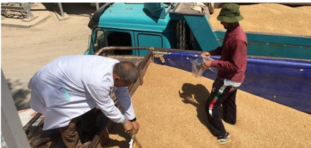
الشركة العامة لتجارة الحبوب

لبحث آليات نقل معدات المطحنة من مخازن الشركة إلى موقع المطحنة في محافظة ميسان