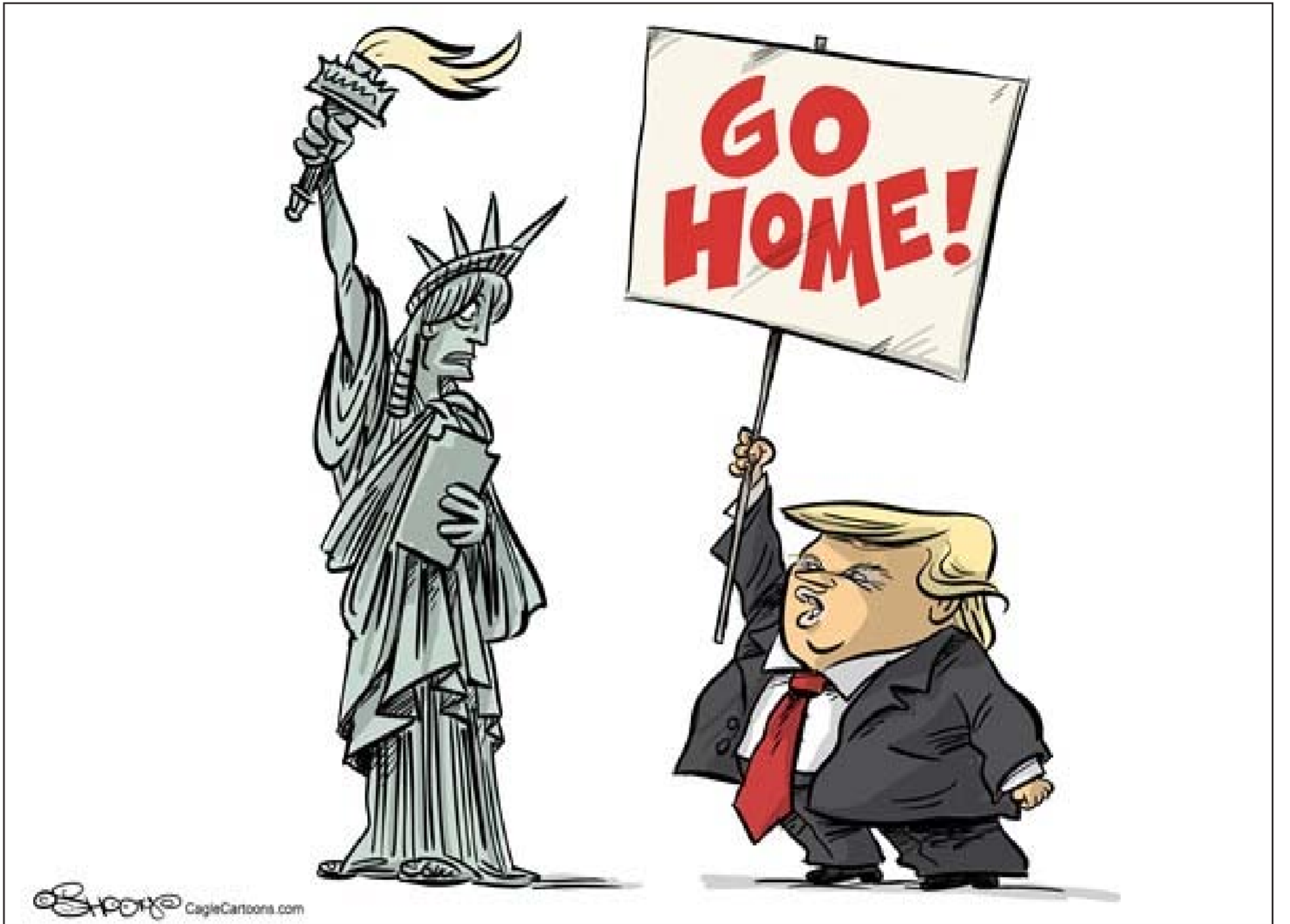
عن موقع «كارتون سياسي»