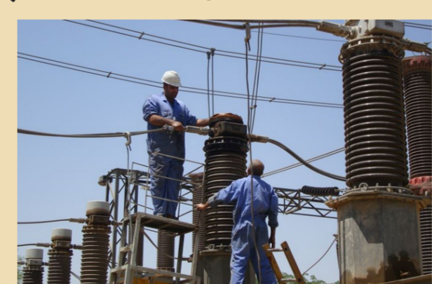
تأهيل الكهرباء في العراق

في مجلس الوزراء عقدت أمس الأول اجتماعاً مهماً برئاسة رئيس الوزراء جابر العبادي وحضور