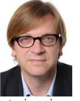
جوي فير هوفشتا رئيس الوزراء البلجيكي السابق

في الأسبوع نفسه الذي استعرضت فيه رئيسة الوزراء البريطانية تيريزا ماي رؤيتها حول الخروج البريطاني «الصعب» من الاتحاد الأوروبي - الانسحاب من السوق الأوروبية الموحدة والاتحاد الجمركي - التقى الرئيس الأميركي دونالد ترامب أحد كبار المشككين في أوروبا في حزب المحافظين. وهو مايكل جوف. وكان جوف داعماً لإعلان ترامب العام أن الولايات المتحدة تعتزم التحرك «بسرعة بالغة» للتوصل إلى اتفاق تجاري مرحلة ما بعد الخروج البريطاني مع المملكة المتحدة. ليس من المستغرب من أنصار الخروج في المملكة المتحدة الآن أن يروجوا لاتفاق تجاري افتراضي مع الولايات المتحدة كوسيلة لتشغيل الفراغ التجاري في بريطانيا بعد الخروج من الاتحاد الأوروبي. ولكن ربما يتبين لنا أن هذا الحل عقيم. لأن المملكة المتحدة لديها فائض تجاري مع الولايات المتحدة. وكان ترامب من أشد منتقدي العجز التجاري الأميركي. من ناحية