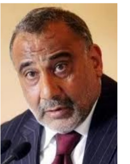
عادل عبد المهدي وزير النفط السابق

والتعسفية والعنصرية ضد مواطني الطرف الاخر؟ وهل هناك شعب قدم في مجاربة الازهاب ودفع ثمننا باهظاً اكثر من الشعب العراقي؟ وهل ان «القاعدة» و«داعش» و«جبهة النصرة» في فترات مختلفة. في العراق وافغانستان وسوريا وبلدان اخرى جاءت من العراق ام من دول اخرى بضمنها الولايات المتحدة الاميركية؟ وهل بين من قاموا بعمليات ارهابية داخل الولايات المتحدة او خارجها العراقي واحد لكي تتخذ هذه الاجراءات العنصرية. المتعسفة وغير المنطقية والتي لا تحمل اية مصلحة للامن وللعلاقات بين البلدين والشعبين. ففي الولايات المتحدة عشرات