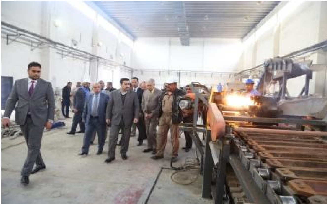
مصنع الصوف الصخري

سبب عكس ايجابا على واقع الشركة وسيسهم بشكل كبير في توجيه انظار المستهلكين والقطاع الخاص الى المنتج الوطني كبديل عن المستورد . لافتنا الى ان الشركة ستنتج نحو عقود المشاركة مع شركات عالية رصينة لأجاء مشاريعها المستقبلية . واكد المدير العام على ضرورة التعريف بماهية الصناعة العراقية والترويج عن المنتج المحلي من خلال وسائل الاعلام المتعددة داعيا في الوقت نفسه المواطن العراقي والترويج عن المنتج المحلي وتشجيع الصناعة العراقية ومحاربة المستورد للاسهام في تعزيز الاقتصاد وتحقيق النمو الاقتصادي .