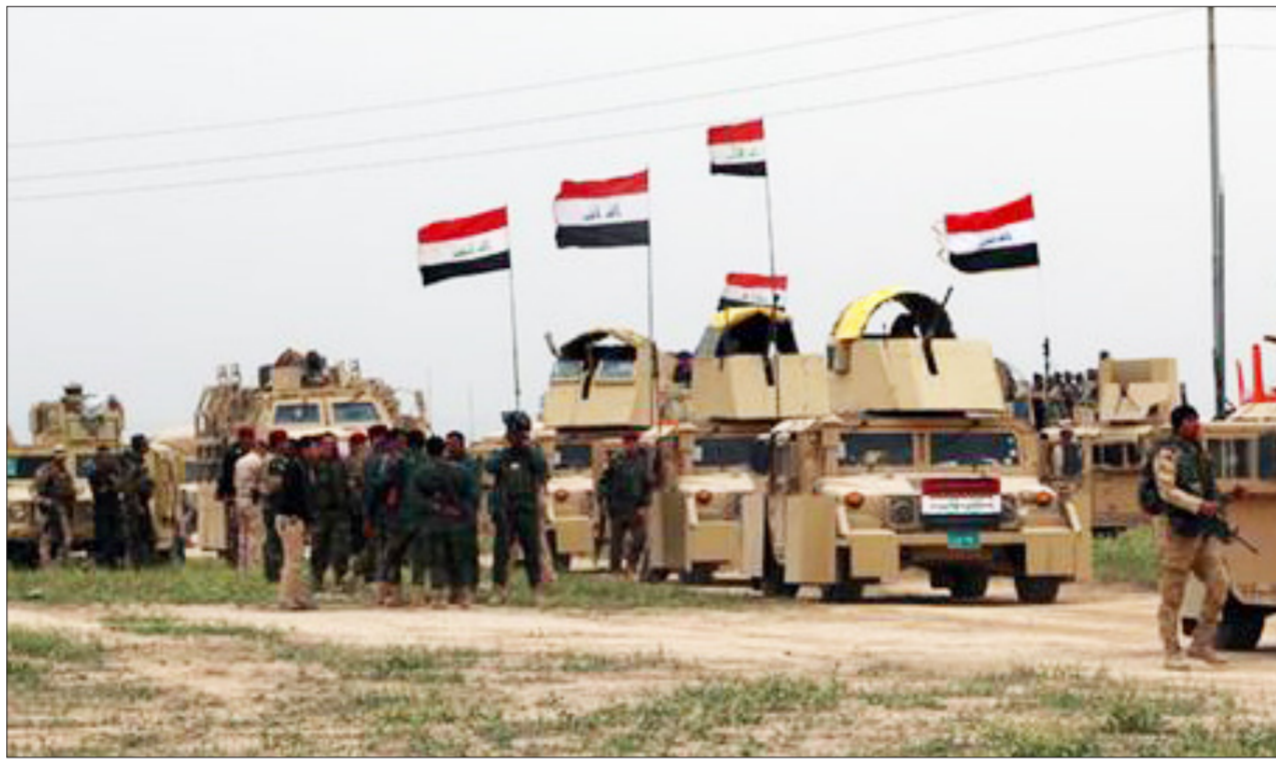
القوات المشتركة تستعد لبدء مرحلة تحرير الجانب الأيمن من الموصل