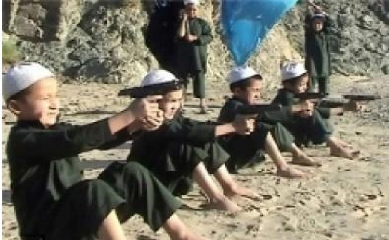
تأهيل الأطفال ما بعد داعش ودمجهم مجتمعيًا

أكد العراق على ضرورة التنسيق مع المنظمات الدولية ومنظمات المجتمع المدني لفتح مراكز للصدمة النفسية لغرض إعادة تأهيل الأطفال أو دمجهم مجتمعيًا