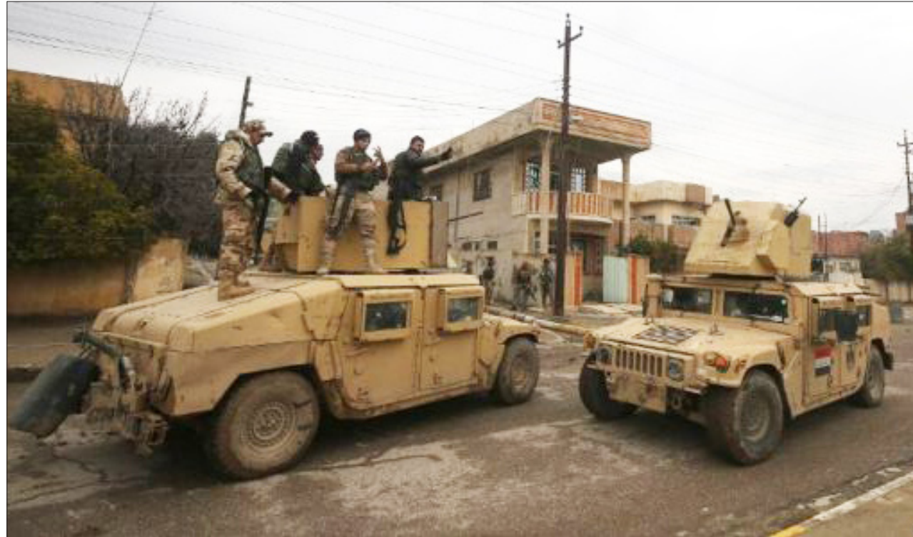
القوات المشتركة تستعد لاقتحام الجانب الأيمن من الموصل

مكافحة الارهاب إلى "الصباح الجديد". إن "القطعات العسكرية احكمت سيطرتها بنحو تام على الجانب الأيسر من الموصل". وتابع الضابط مفضلاً عدم ذكر اسمه أن "تنظيم داعش فقد آخر معاقله في هذا الجانب عندما تعرض إلى هزائم في حيي العربي والرشاد".