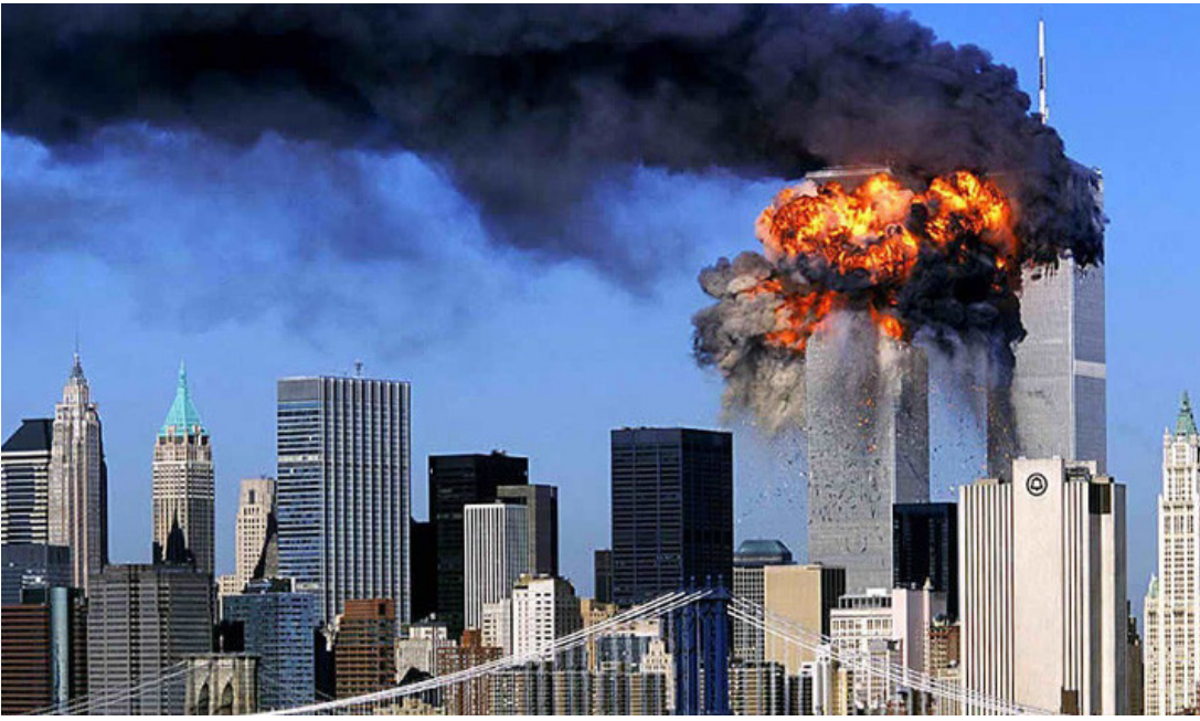
أحداث الحادي عشر من سبتمبر

المنتجين والكادحين والفقراء بالولايات المتحدة ذاتها نانيا. » وأضافوا ان « هذا النهج لم يقتصر على الجانب السياسي المتطرف حسب، بل وبالأساس برز بنحو صراح في سياساتها الاقتصادية والاجتماعية والثقافية والبيئية الدولية، مستفيدة من ظروف