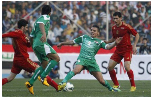
لقاء سابق للعراق أمام سوريا