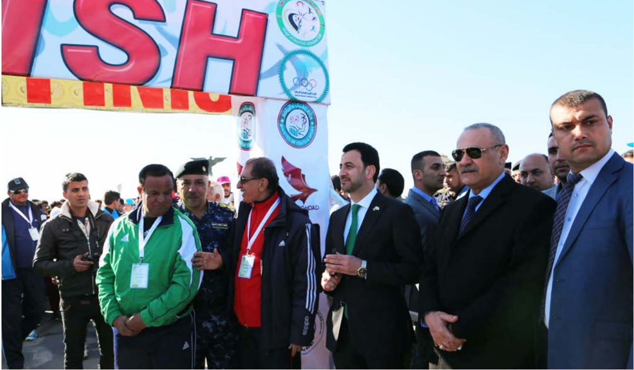
عبطان مع أسرة ألعاب القوى

الى ذلك، دعمت الدائرة المالية في وزارة الشباب والرياضة الرياضيين الابطال والرواد المشمولين بالمنحة الشهرية التي تراجعها مقر المصرف العراقي التجاري في منطقة جميلة بالنسبة لسكنة بغداد. وقرع المصرف بالنسبة لسكنة المحافظة