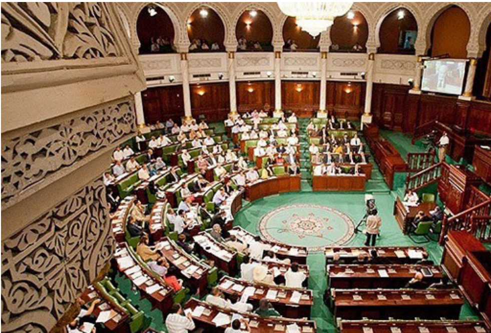
مجلس النواب الليبي

جعل الليبيين يعتبرونها حكومة وصاية أتت من الخارج، إضافة إلى محاولة سحب السلطات السيادية من مجلس النواب، التي تكون في حال عدم وجود رئيس من صلاحيات السلطة التشريعية. وهذا هو ما يعطي الشرعية للاتفاق السياسي، وما ينبثق عنه من أجسام، بما في ذلك المجلس الرئاسي المقترح».