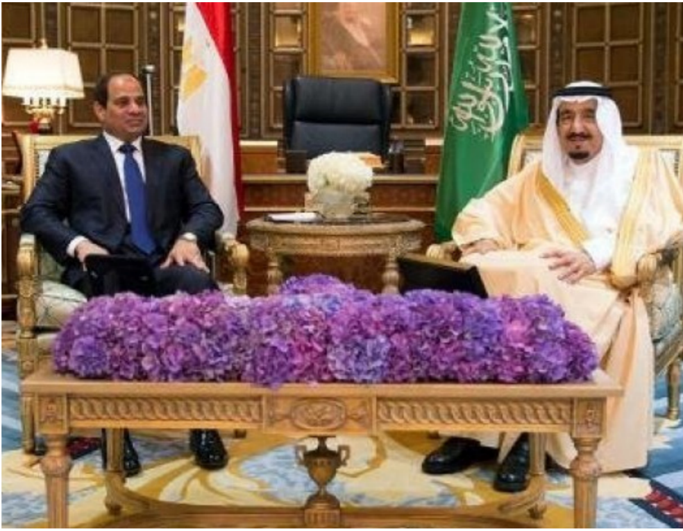
السياسي و الملك سلمان بن عبدالعزيز

الأساس حدث ما يشبه المقابضة بين الطرفين من خلال تقديم مصر للدعم الأمني للمنظومة الخليجية وتقديم الخليجيين الدعم الإقتصادي لمصر. *كان للعامل الإقليمي أثر واضح على سير العلاقات بين الطرفين خصوصا من الأطراف غير العربية في إقليم الشرق الأوسط كإسرائيل والتي أدت الحرب معها في 1973 إلى حدوث تقارب مصري خليجي كبير ثم بعد توقيع معاهدة السلام معها في نهاية عهد السادات إلى قطع العلاقات. والمنطق نفسه ينطبق على إيران والتي مثل قيام الثورة الإسلامية فيها في 1979 عامل دافع لتحسين العلاقات ثم أدى التقارب معها بعد تظاهرات 25 يناير إلى دفع العلاقات المصرية الخليجية نحو مزيد من الفتور والتدهور.