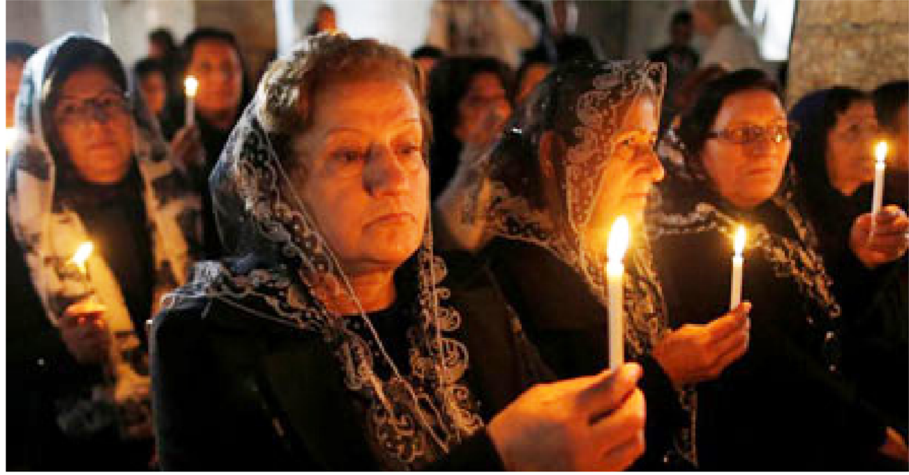
مسيحيون يحتفلون بأعياد الميلاد

شديداً بأ الذين لا يلتزمون بتفسيره المتشدد للدين. وخير المسيحيون في المنطقة ما بين الدخول في الإسلام أو دفع ويرياً.