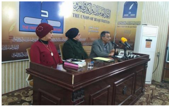
جانب من الجلسة

لكنني اجد ان هذا ايضا احد اسباب المشكلة الحقيقية التي تعاني منها المرأة، وهو محاولة التستر على المشكلات، فالذي يرفض مصطلح النسوية، والنص النسوي يوصفه بتبني مقصديات فكرية واجتماعية وفلسفية عبر تمخيلات الادب، فهو لا يريد الاعتراف