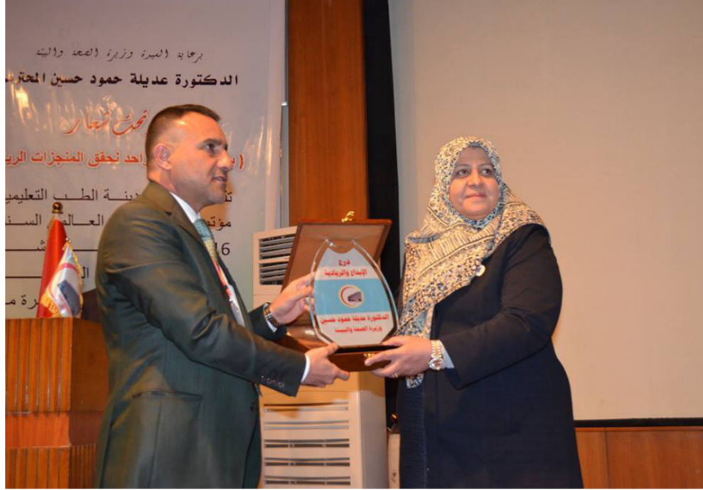
جانب من الافتتاح

مدينة الطب الصرح الطبي الشامخ الذي تمثل الواجهة للعراق واغترفت من معين اسماذته اجيال اطباء والصيادلة والتفريضيين