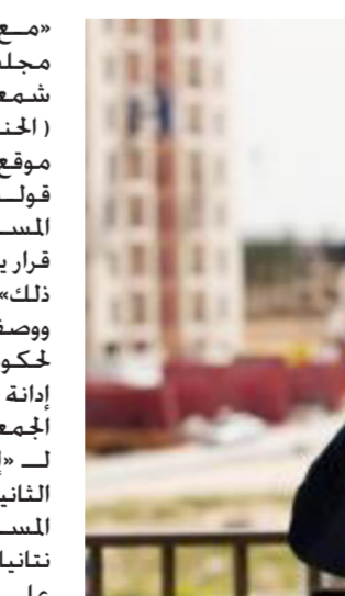
اسرائيل ستعيد حساباتها مع الامم المتحدة

وطالب إيلبي يشاي رئيس حزب «إخاد» الإسرائيلي، حكومة الاحتلال الإسرائيلي بعقد جلسة طارئة لتقرير ضم أراضي الضفة الغربية المحتلة لـ «إسرائيل»، وجاءت تصريحات يشاي