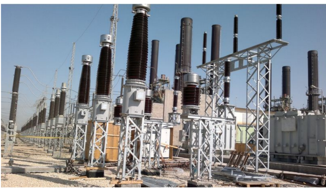
إحدى محطات الطاقة الكهربائية