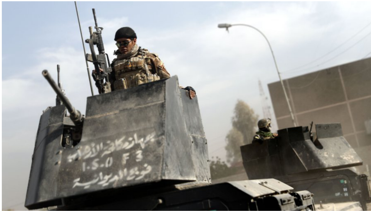
قوات مكافحة الإرهاب في الموصل

بغداد - أسامة نجاح: أعلنت قيادة قوات جهاز مكافحة الإرهاب، أمس الأحد عن استمرار العمليات العسكرية في جميع الجوار وعدم توقفها لتحرير الأحياء المتبقية بمدينة الموصل عدا الساحل الأيمن. لافتة إلى أنه لا يمكن إعلان ساعة الصفر للبدء بعملية تحرير الساحل الأيمن للموصل ولا لأي محور من المحاور لكي لا يتم استغلالها من قبل الجماعات الإرهابية. فيما أكدت قيادة فرقة الرد السريع، أمس الأحد، إكمال تحرير 85% من الساحل الأيسر في مدينة الموصل. وقال القائد في جهاز مكافحة الإرهاب الفريق الركن عبد الوهاب الساعدي إن "القوات الأمنية بصرفها كافة مستمرة بالعمليات العسكرية لتحرير ما تبقى من مدينة الموصل وإنها تخوض اشتباكات شرسة في العديد من الأحياء وعلى المحاور كافة". وأضاف الساعدي في حديثه لصحيفة "الصباح الجديد" إن