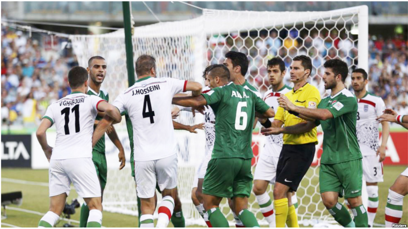
جانب من إحدى مباريات الوطني أمام إيران

من جانبه قدم رئيس الهيئة العامة للشباب والرياضة الليبي شكره الكبير الى وزير الشباب والرياضة على الحفاوة التي وجدها لدى العراقيين عمومها والوزير على وجه الخصوص، مبيداً دعمه الكامل لجهود الوزارة في رفع الحظر عن الملاعب العراقية ومتعهداً بان