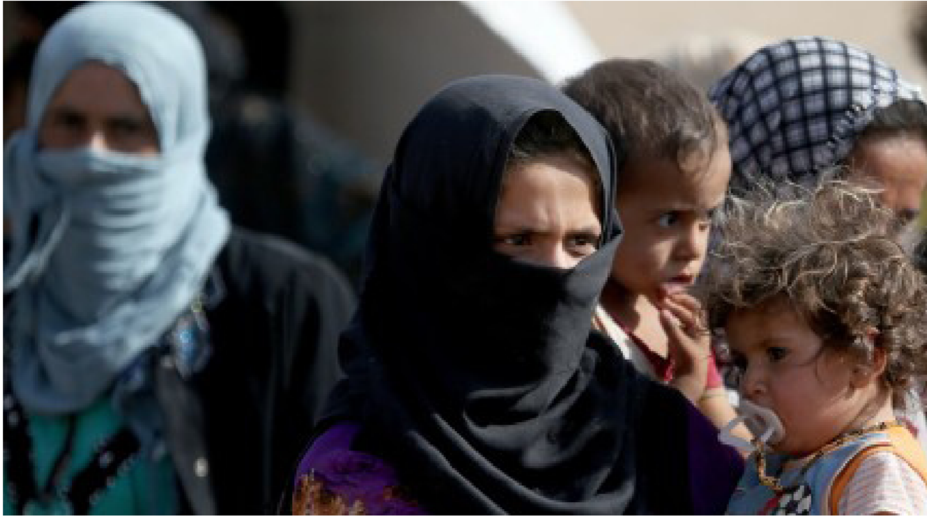
نساء هاربات من داعش "ارشيّف"