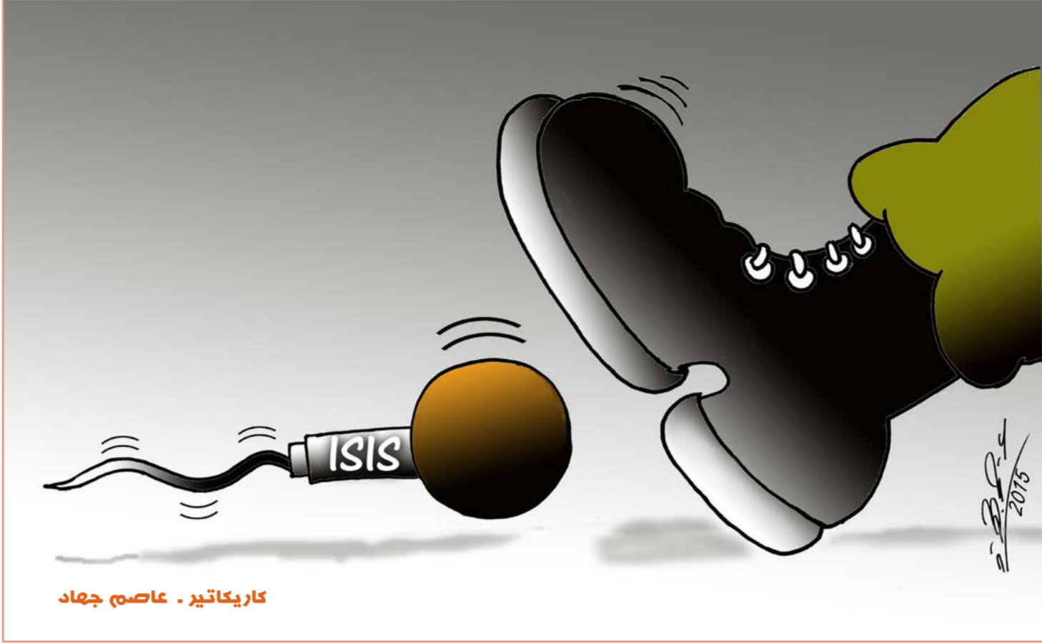
كاريكاتير - عاصم جهاد

وعندما غاب لودفيك في أحد الأيام عن موعد تسلمه للطعام من أحد المتاجر المحلية، علم الناس أن مكروها قد وقع له، واتصل عمدة المدينة بعاملي الصحة للاطمئنان عليه، لكنهم وجدوه جثة هامدة في المزرعة التي اعتاد العيش فيها.