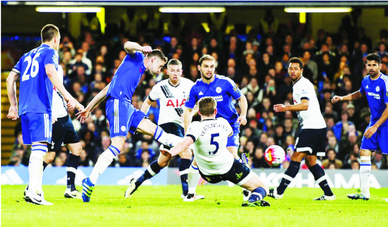
لقطة من الدوري الإنجليزي

وتخلو مباريات المرحلة من لقاءات بارزة أو صعبة على الورق بالنسبة لفرق الصدارة إذ يخوض معظمها لقاءات مع فرق من وسط النطاق الترتيب أو متدلي القائمة. ويستضيف تشيلسي المتصدر برصيد 43 نقطة، بورنوث العاشر اليوم الأثين على ملعبه اللندني توسيع فارق النقاط الستة حالياً مع الثاني ليفربول. وفي اليوم نفسه، يلقي