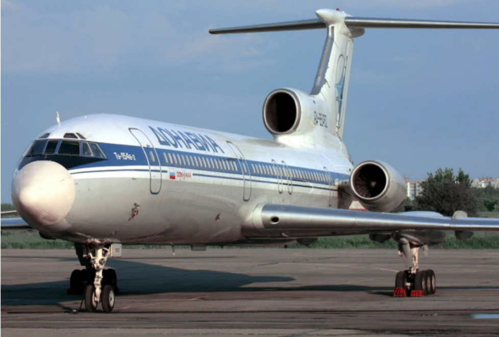
نموذج عن الطائرة الروسية

أمني، أن الطائرة التي اختفت من على شاشات الرادارات، وعلى متنها 91 شخصاً، خطمت على الأرجح في جبال إقليم كراسنودار جنوبي روسيا، ولم تنشر أي مصادر روسية حكومية أو وسائل إعلام محلية إلى سبب فقدان الاتصال بالطائرة حتى اللحظة.