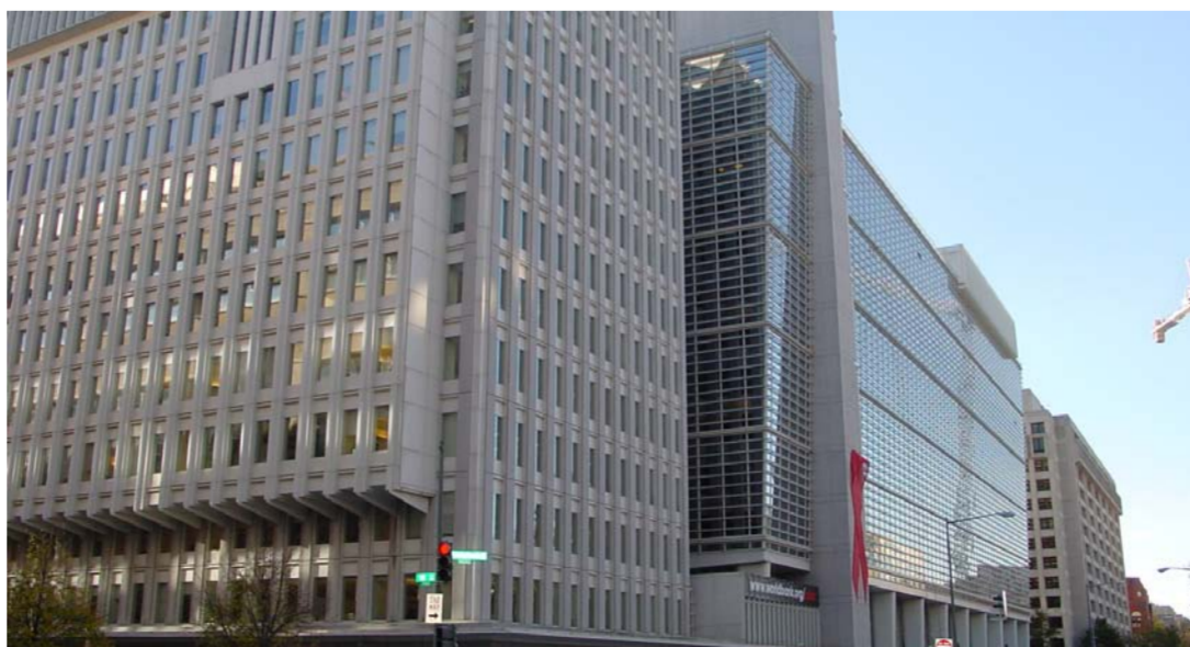
مبنى البنك الدولي

وتراجعت بورصة وول ستريت ومؤشر الدولار الذي يقيس أداء العملة الأميركية أمام سلة من ست عملات رئيسية بعدما قال (إف. بي. أي) إنه سيجري تحقيقاً في مزيد من الرسائل الإلكترونية التي تخص كلينتون حينما كانت وزيرة للخارجية.