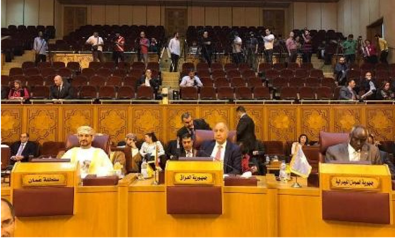
اجتماعات المجلس الوزاري

كوسيلة اراهبية في اشاعة الرعب واغراق التجمعات السكانية وتعرض سلامة وحياة المواطنين الخاصة للخطر وكما حدث في احتلال منظومة سدتي الرمادي والفلوجة على نهر الفرات وسد الموصل على نهر دجلة . وقد هنا المجلس العراق وشعبه بمناسبة ادراج الاهوار وبعض المناطق الاثرية على قائمة التراث العالمي التابعة لمنظمة اليونسكو التي عقدت في اسطنبول والحفاظ على هذا التراث الانساني وتوفير الحصص المائية المطلوبة لاستدامة الاهوار.