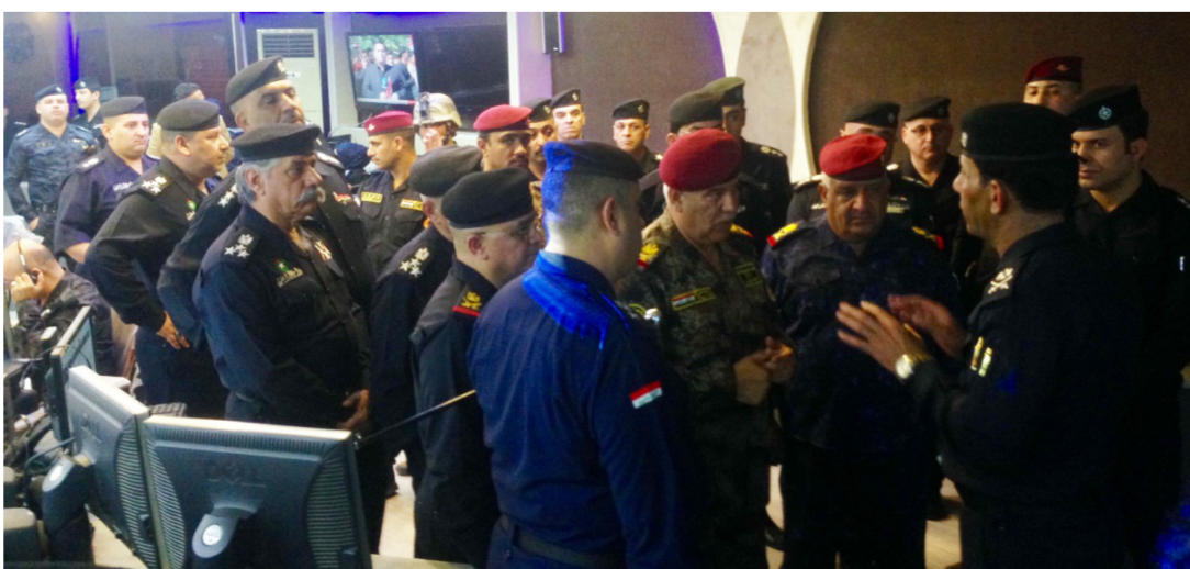
جانب من افتتاح منظومة السيطرة والمعلومات المركزية الحديثة

منطقة وعزلها . والقضاء التام على الحركات الارهابية . وهنا يجب ان يكون الاعلام الوطني وخبراء الحرب النفسية حاضرين ومساندين للقوات الامنية التي لن تستطيع التصدي للأرهاب من دون دعم المواطن والالتخصصين بالشأن الاستراتيجي وعمامة السكان . فيما اكد مدير عام شرطة النجدة اللواء عيسى عبد الحضر سحيب ان الدورة الاولى لاعاد الفوضيين الخواص تلقت تدريبات تخصصية في جناح تدريب المديرية من مدرسين محترفين . على التعامل السريع مع الحركات المشبوهة والجرمين . ومبادئ حقوق الانسان وقانون العقوبات واصول المحاكمات والتحقيق الجنائي اضافة للتدريب الوجداني والفني . وأحدث ما وصلت اليه الامكانيات المتقدمة . في