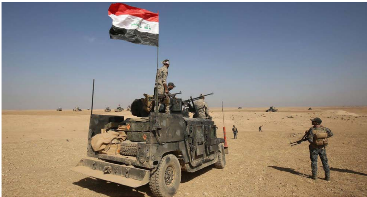
القوات الأمنية تستكمل تحرير مناطق نينوى من زمر داعش الإرهابية "ارشييف"

بأخاه وتم خربها بالكامل". وتابع أن "قطعاعات الشرطة الاخادية طهرت المجلس البلدي لناحية الشورة ورفعت العلم العراقي فوق مركز الناحية". لافتاً إلى أن "القطعات تلاحق الإرهابيين الفارين