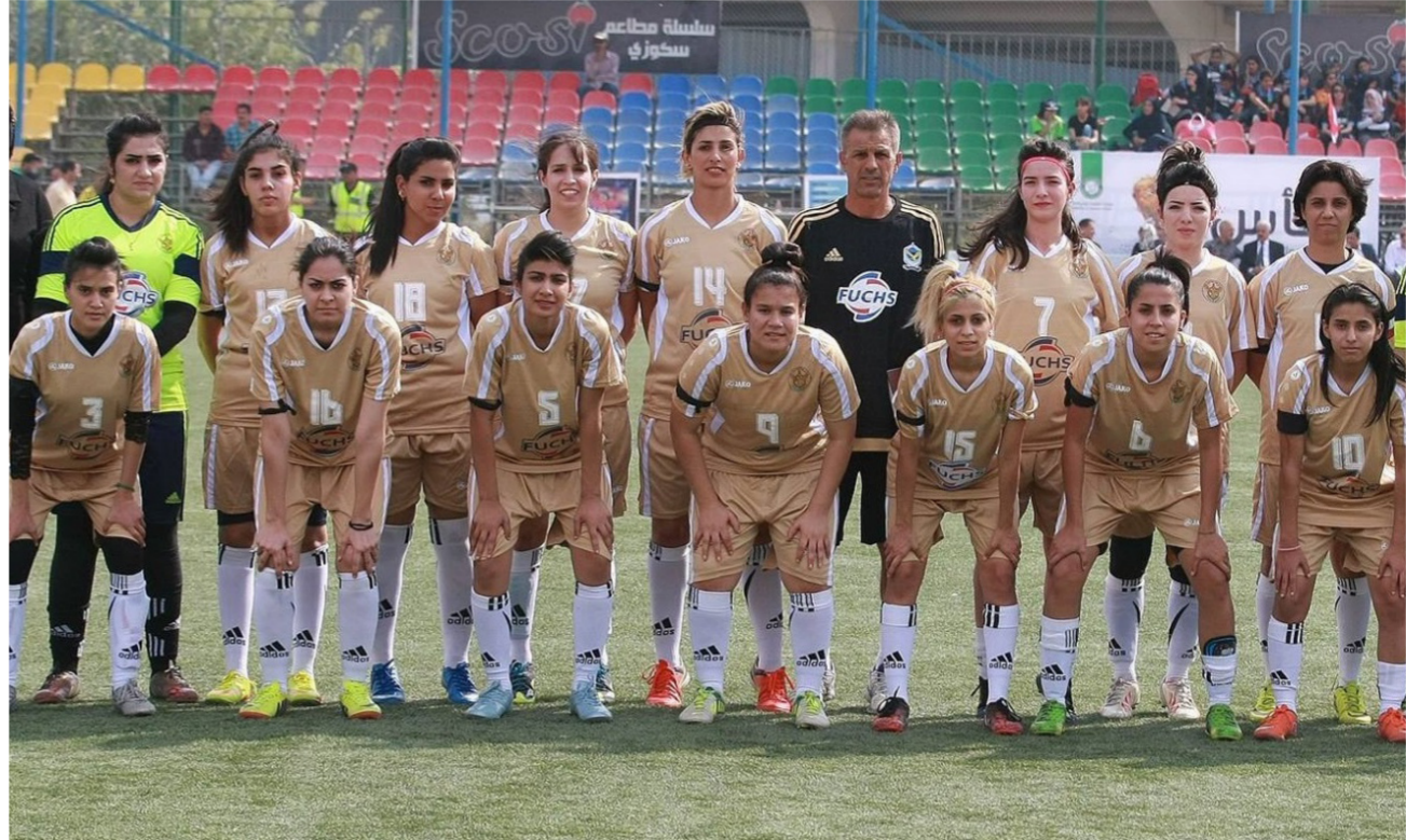
فريق القوة الجوية النسوي

واضاف عبد القادر ان الملعب يشكل اضافة مهمة لرصيدنا من الملاعب والمنشآت الرياضية وبالتالي تخفيف الضغط عن ملعب الشعب الدولي اذ سيكون الملعب مخصصا لاحتضان تدريبات المنتخب الوطنية والمباريات الودية والرسمية لدوري كرة القدم الممتاز مبنيا ان الفترة التي مضت شهدت تصاعدا في