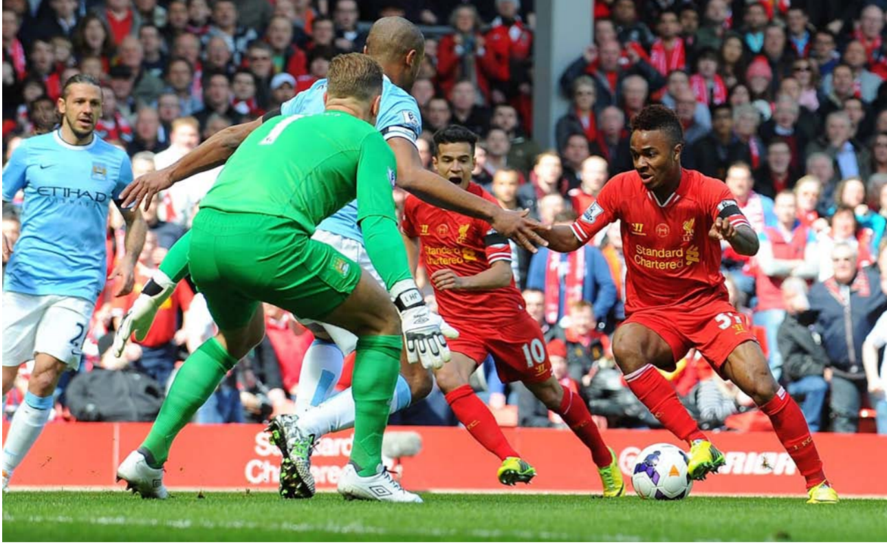
جانبا من احدى مباريات ليفربول

كما خلت القائمة من وجود نادي بوفنتوس الإيطالي، الذي تعرض لخسارة أمام نادي ميلان في آخر جولة من بطولة «الكالتشيو»، وهو ما أثر على رصيده النقطة، إضافة إلى نادي باريس سان جيرمان الفرنسي الذي سجل نتائج متذبذبة هذا الموسم مع مديره الجديد الإسباني أوناي إيربي في أول موسم له من دون مهاجمه السويدي زلاتان إبراهيموفيتش منذ عام 2012 بعد رحيله إلى نادي مانشستر يونايتد الإنجليزي.