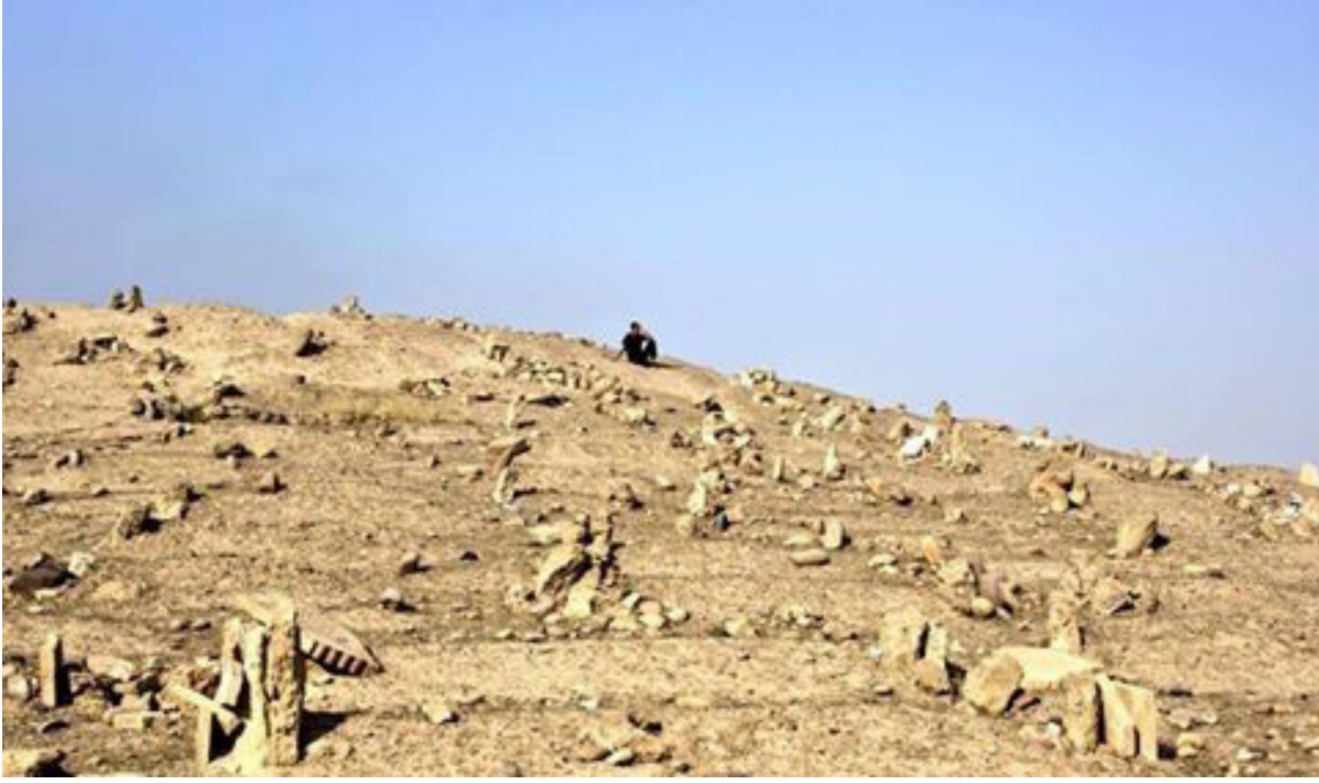
مقبرة وادي عكاب غربي الموصل