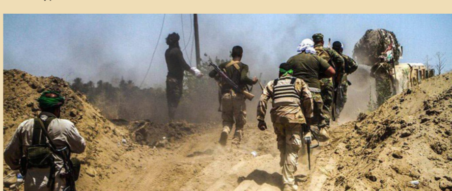
القوات الأمنية امام مهمة صعبة لتخليص الأبرياء من قبضة داعش