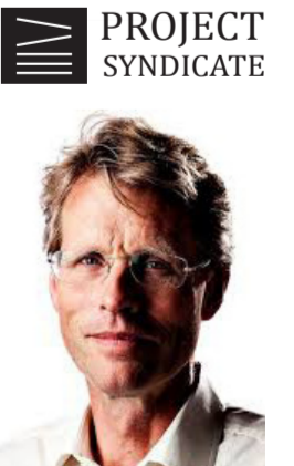
بو ليدكارد الرئيس السابق لصحيفة بوليتيكن اليومية الدنماركية

ونظرا لصعوبة التعاون على نطاق واسع بين الحكومات . لا يمكن أن يتوقع التوصل إلى إتفاق عالمي . مع الظروف الجوية القاسية التي أصبحت متكررة بنحو متزايد . في الواقع . تشير الأدلة إلى أن تأثيرات التغيرات الحالية لاينعانات الغازات الدفيئة وصلت بالفعل إلى نهاية السيناريوهات المرتقبة . كما يحذر علماء المناخ من الآن أن نافذة الدرجتين ستغلق بنحو سريع جداً . إذا لم تكن قد أغلقت بالفعل . إذا أردنا تحقيق أهدافنا بخصوص المناخ . ينبغي علينا اتخاذ إجراءات قوية وفورية للحد من الإنبعاثات