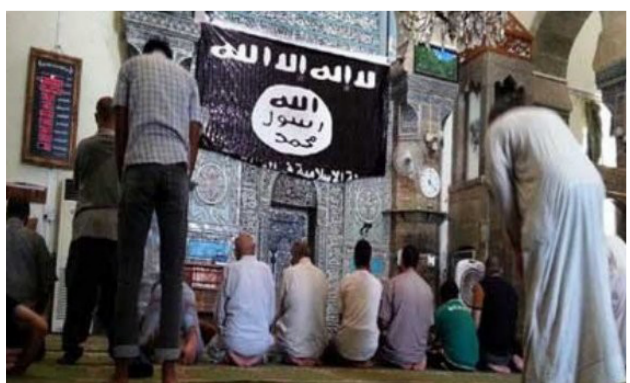
جانب من صلاة الجمعة في أحد جوامع الموصل

الاسبوعين الماضيين وسط شكوك بأنهم ربما هربوا خارج الموصل عقب انطلاق عمليات التحرير". وكان مصدر محلي من داخل