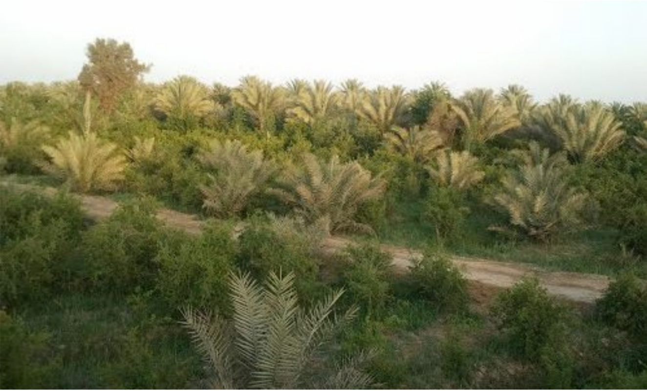
البساتين الزراعية في ديالى

بصورة غير طبيعية وأصبحت هناك تلال من النفايات يتطلب موضوع معالجتها اهتماما أكبر من قبل مديرية بلدية بعقوبة وإتباع الآلية السليمة لمعالجة وطمر النفايات.