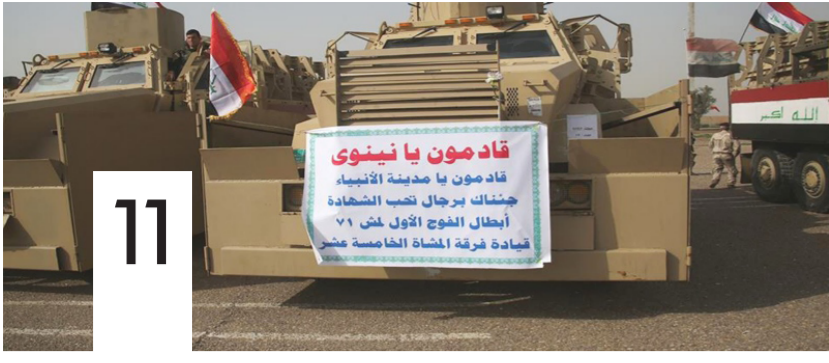
نينوى .. تحديات وحسابات ما بعد التحرير