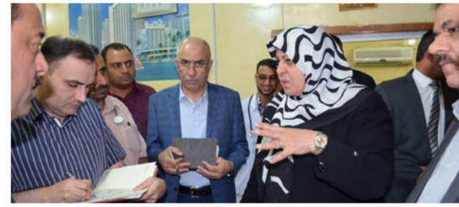
سعيها جادا ودؤوبا لتقديم الإسناد الطبي المطلوب للمستشفيات التابعة لطبابة الحشد الشعبي وتلبية احتياجاتها الضرورية بما

يسهم في تعزيز الانتصارات المتلاحقة على الدواعش. على صعيد متصل زارت الوزيرة مستشفى الشرفاء العام بمحافظة صلاح الدين وأطلعت ميدانياً على احتياجات المستشفى بعد أيام من تحريرها من عصابات داعش الإرهابية وأوعزت بدعم المستشفى بمبلغ 100 مليون دينار لاعماره وتأهيل صالات العمليات ودهات رقود المرضى وأصلاح الأضرار التي خلفتها عصابات داعش الإرهابية.