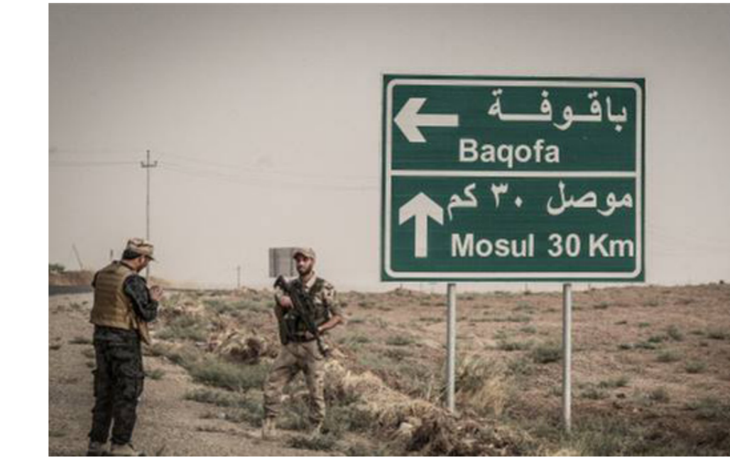
القوات العراقية على مشارف الموصل

لقد حاولت تركيا، جعل تواجدها العسكري معرقلا لتقدم العسكري، نحو الموصل، فحاولت افعال ازمة مع بغداد لتؤجل انطلاق معركة الموصل، لكنها فشلت في ذلك، اضافة الى ان موقف الولايات المتحدة، كان مع العراق ضد تركيا، ولهذا ما زال الدور التركي هامشيا بل لا وجود له والمعركة جري اليوم بأيدي عراقية كاملة ولا وجود لأي قوات اجنبية عدا، لتلك التي جاءت بطلب من الحكومة.