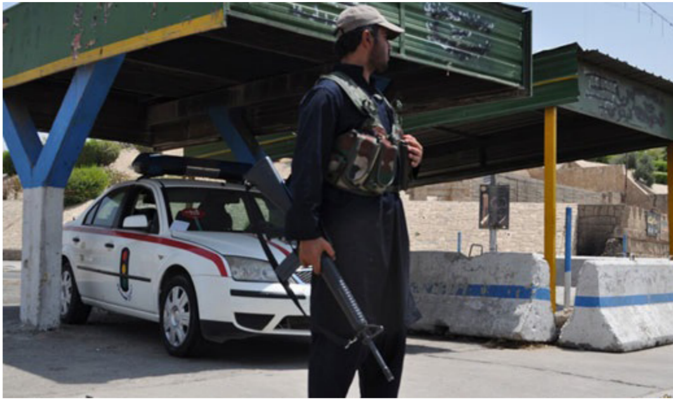
انتشار لعناصر داعش في الموصل

دخولهم للمدينة". على صعيد آخر اصدرت كتائب احرار نينوى باقة من التعليمات الى اهالي الموصل بالتزامن مع اقتراب معركة خريبرها. ودعت الاهالي الى الابتعاد عن اماكن جمع داعش وامكن عتادهم. وعدم الاختلاط بهم، و اذا كان منزل جيرانكم مقرا للدواعش حاولوا الانتقال الى أي بيت ثاني او السكن عند احد اقربانكم، وعندما يُقصف مقر للدواعش برجى عدم التجمع عند المنطقة المصوفة، وعند دخول القوات الامنية الى الموصل، سوف يقوم افراد المقاومة بوضع علامة X