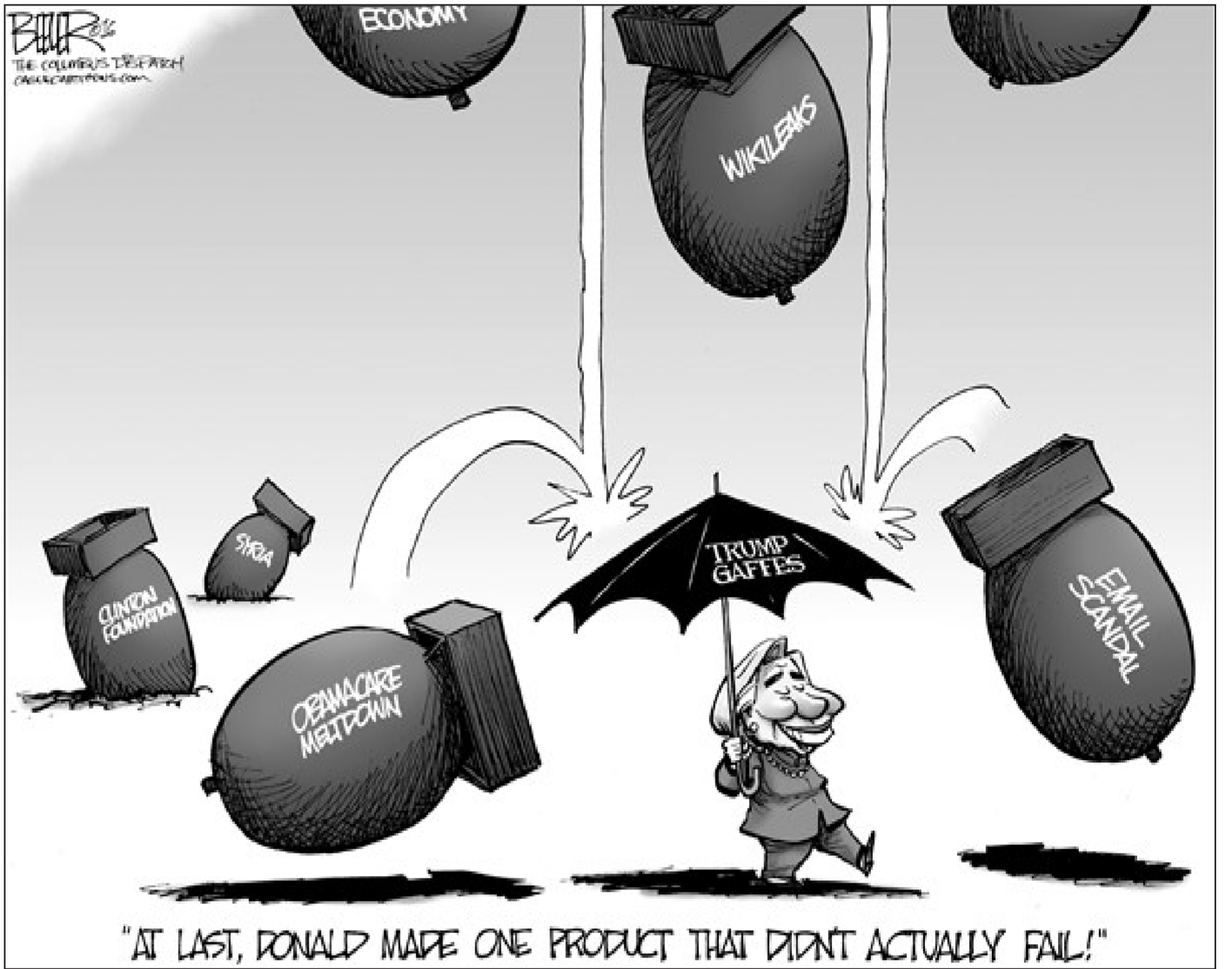
"AT LAST, DONALD MADE ONE PRODUCT THAT DIDN'T ACTUALLY FAIL!"