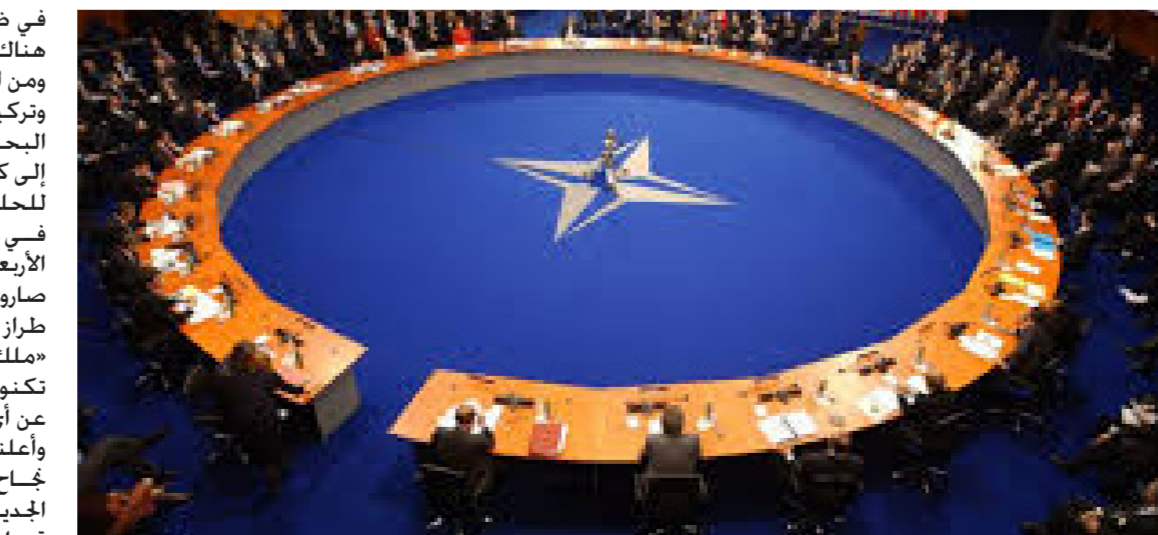
حلف شمال الأطلسي

تكنولوجيا تمكنه من إصابة الهدف بدقة عالية. ويعمل بالوقود السائل. وينطلق من منصة تحت الأرض. وبإمكانه حمل رؤوس حربية مدمرة تزن 10 أطنان إلى أي بقعة على الأرض. ويسمح مخزون الطاقة الخاص بالصاروخ بتخليقه عبر القطبين الشمالي والجنوبي. وسيحل مكان منظومة الصواريخ «36ز» أم» التي ستوقف عن الخدمة بحلول عام 2018. وأكدت موسكو أن الصاروخ الجديد وهو من منظومة «سارمات». لن يستخدم إلا في حالة الردع النووي. وذلك وسط توتر بين الغرب وروسيا في قضايا عدة من بينها الأزمة السورية والملف الأوكراني. ونجح الصاروخ الجديد في إصابة الهدف المحد في ميدان «كورا» في شبه جزيرة «كامتشاتكا» في الشرق الأقصى الروسي. على الحدود مع كازاخستان. وفق ما ذكرت وسائل إعلام روسية.