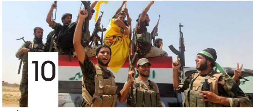
معركة الموصل.. عراقية بامتياز