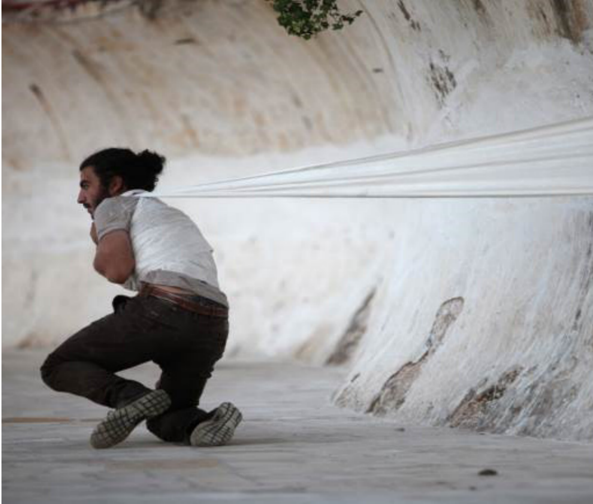
جانب من العرض «بطاقة إلى أتلانتس»

قوله خلال العرض أن البحر هو عمق. بمعنى إذا غرقت، ومنت، تنزل وتصبح في أتلانتس. في هذه اليوتوبيا المائية، وهنا، أريد التحدث قليلاً عن كون أوروبا في نظرنا الذين إليها هي اليوتوبيا، لكنها، فعلياً، ليست على هذه الحال. اليوتوبيا تقع في العمق، في نقطة الغرق، وليس في نقطة الوصول. - لينسا: طوال العرض، كانت لدينا فكرة - بأننا مع الأوروبيين. علينا أن نزل إلى البحر بحثاً عن مكان جامع لنا، فعلياً الأوروبيين أن يغرقوا أيضاً، أن يبلغوا عمقا ما، نلتقي وإياهم فيه، على أن الأهم هو كيفية حديث أناس البحر عن هذا المجال المائي باعتبارها متغيراً بشكل دائم، فقد حاولنا أن ندخل في هذا التفصيل، الذي يحمل أبعاداً كثيرة، لا سيما المحسوسة منها.