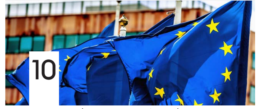
أوروبا منشغلة بعودة المقاتلين الأجانب بعد معركة الموصل