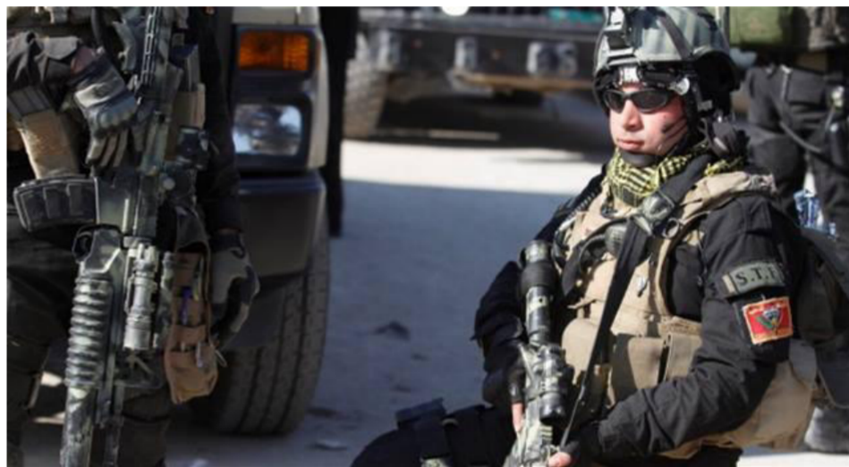
قوات جهاز مكافحة الإرهاب في الموصل

بغداد - أسامة نجاح: أعلنت قيادة جهاز مكافحة الإرهاب يوم أمس الأربعاء، عن اقتراب القوات الأمنية من دخول منطقة (كوكجلي) أول أحياء مدينة الموصل التي تبعد 4 كم عن مركز المحافظة، فيما حررت ثلاث مناطق حيوية في المحور الشرقي لمدينة الموصل من دون أي خسائر بشرية بين صفوف القوات الأمنية. وقال قائد المحور الجنوبي لجهاز مكافحة الإرهاب في عمليات تحرير الموصل الفريق الركن عبد الوهاب الساعدي إن "القوات الأمنية تخوض معارك عنيفة لتحرير منطقة بزواية من سيطرة تنظيم داعش الإجرامي". مشيراً إلى "وجود عمليات مدفعية وجوية