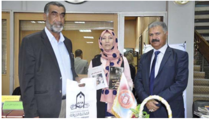
جانب من حفل التوقيع