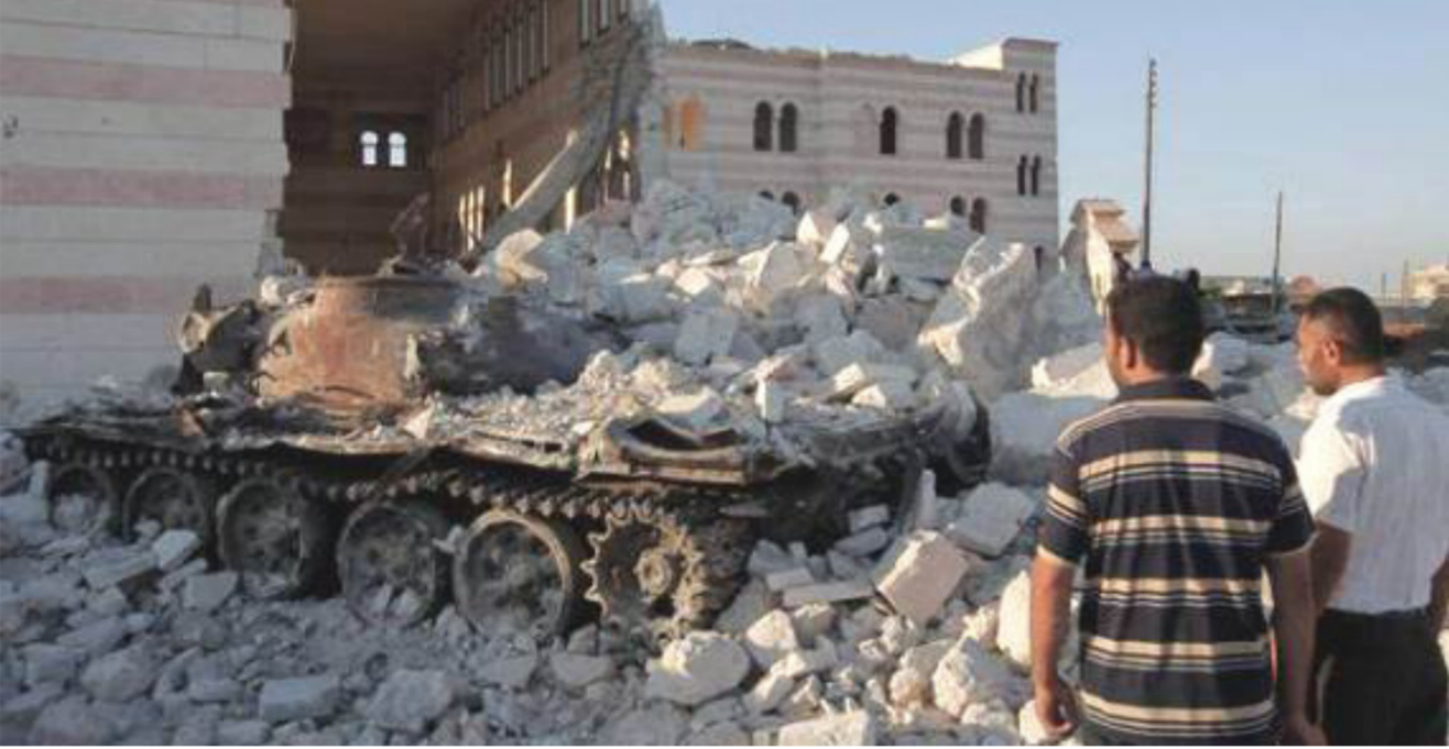
آثار القصف في حلب

ثلاثة هجمات الى النظام السوري وهجومًا واحدًا الى تنظيم الدولة الإسلامية. وفي السياق ذاته، طالب وزير الخارجية الفرنسي جان مارك ابرولت امس الاول السبت مجلس الامن باعتماد قرار يدين استخدام اسلحة كيميائية في سوريا. ويفرض «عقوبات» على منفذي هذه الاعمال «غير الانسانية».