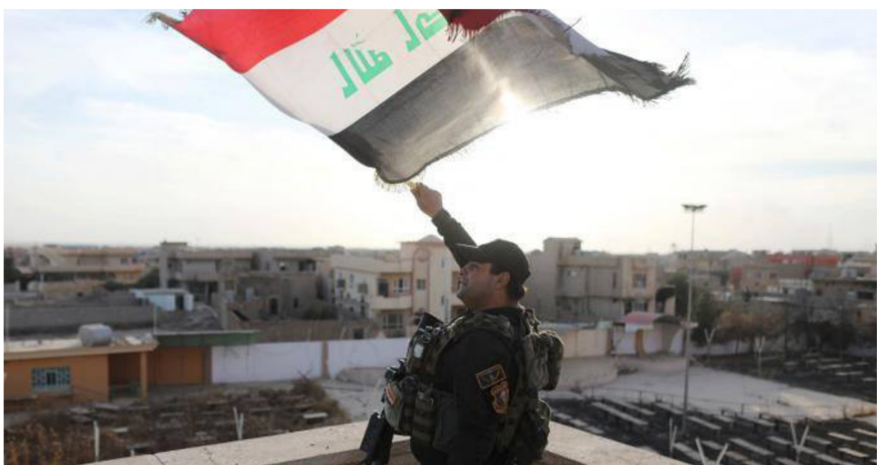
جهاز مكافحة الإرهاب يرفع العلم العراقي فوق بنايات إحدى المناطق المحررة في الموصل

بغداد - الصباح الجديد: كشفت قيادة قوات جهاز مكافحة الإرهاب يوم أمس الأحد، إن الخطوة المقبلة للقوات الأمنية ستكون نحو اقتحام مدينة الموصل، مشيرة إلى أنها على مسافة لا تزيد على 8 كم عن مركز محافظة الموصل، فيما أشارت مصادر أمنية في قيادة العمليات المشتركة أن القوات الأمنية حررت أكثر من 42 قرية تتوزع بين محاور العمليات من جهة الجنوب (القيارة) والجنوب الشرقي (كوير) والشمال (سد الموصل). وقال قائد قوات النخبة الثانية في جهاز مكافحة الإرهاب اللواء الركن معن السعدي إن "القوات تنهيا لهجوم واقتحام مدينة الموصل". لافتاً إلى إن "القوات أخذت مواضعها الآن في ناحية برطلة شرق مدينة الموصل". وأضاف السعدي في حديث خاص لصحيفة "الصباح الجديد" أن "الاستعدادات العسكرية الخاصة بتحرير الموصل ستدخل حيز التنفيذ مع بدء الهجوم على المدينة التي ستكون وجهتنا المقبلة حيث أعدت القوات الأمنية خططاً لإجباط التعرضات الانتحارية والعجلات اللغمومية التي