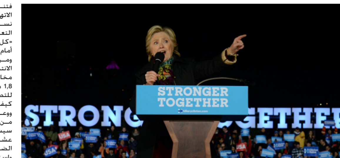
المرشحة الديمقراطية هيلاري كلينتون في فيلادلفيا

فتناول مجددا وبكثير من العدائية الاتهامات التي وجهتها اليه عشر نساء حتى الآن بالتحرش بهن او التعدي عليهن جنسيا متوعدا بأن «كل هؤلاء النساء الكاذبات سيلاقن أمام القضاء بعد الانتخابات». ومرة جديدة شكك في نزاهة الانتخابات مسبقا وقال «هناك مخالفات هائلة، الأمر لا يصدق: ثمة 1,8 مليون شخص متوفى مسجلون للتصويت. ديمقراطيون وجمهوريون ومستقلون. كيف يمكن ان يحصل هذا الأمر؟» ووعد ب«جعل أميركا عظيمة من جديد». مؤكدا أن برنامجه سيستحدث 25 مليون وظيفة خلال عشر سنوات، كما تعهد بخفض الضرائب. واستعار المرشح عبارة شهيرة للرئيس أبراهام لينكولن (1865- 1861) قالها عام 1863 في خطاب القاه في الموقع ذاته، فدعا الى حكومة «من الشعب، عبر الشعب. ومن اجل الشعب». غير أن المرشح الشعبي عرض رؤية لأميركا بعيدة جدا عن تلك التي يصورها ذلك الخطاب التاريخي