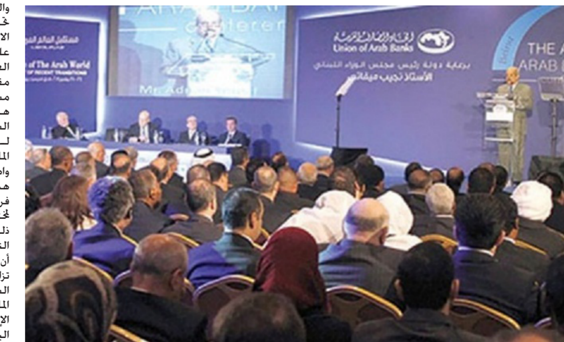
من أجواء المؤتمر

وعلى هامش المؤتمر عقدت مجموعة العمل العربية حول الشمول المالي اجتماعاً في الرباط من أجل الإعداد لأسبوع اليوم العربي للشمول المالي في 27 نيسان، وبحث مجموعة العمل، وهي هيئة متفرعة عن صندوق النقد العربي، خلال هذا الاجتماع البرامج والأنشطة التي ستنظم خلال الأسبوع في البلدان العربية. إضافة إلى إعداد مشروع قانون عربي نموذجي لحماية مستهلك الخدمات المالية، ودراسة مشروع تطوير مؤشرات خاصة بقياس الشمول المالي في الدول العربية وتقييم أثر السياسات والخطط المنبثقة من هذا المجال.