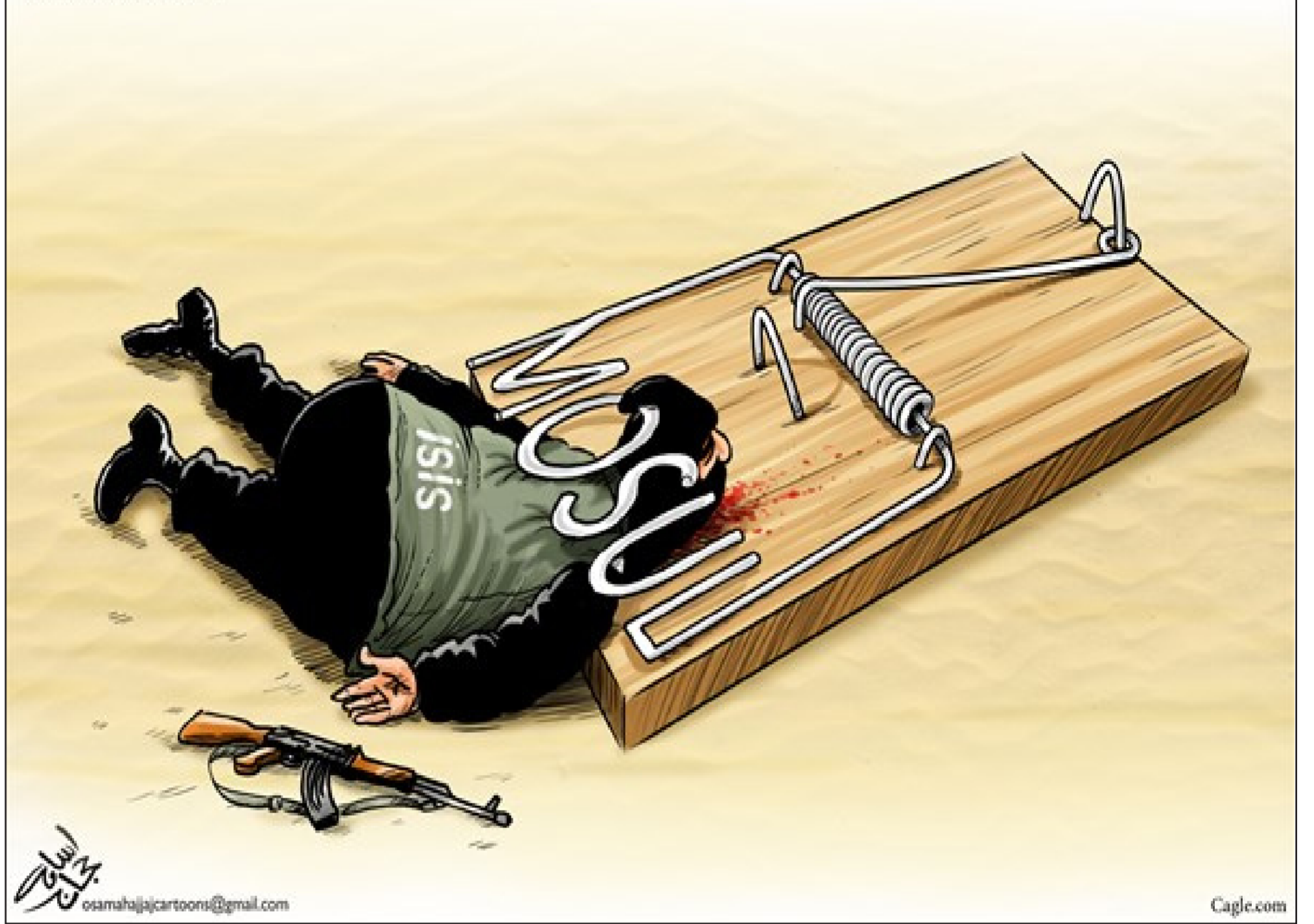
عن موقع «كارتون سياسي»