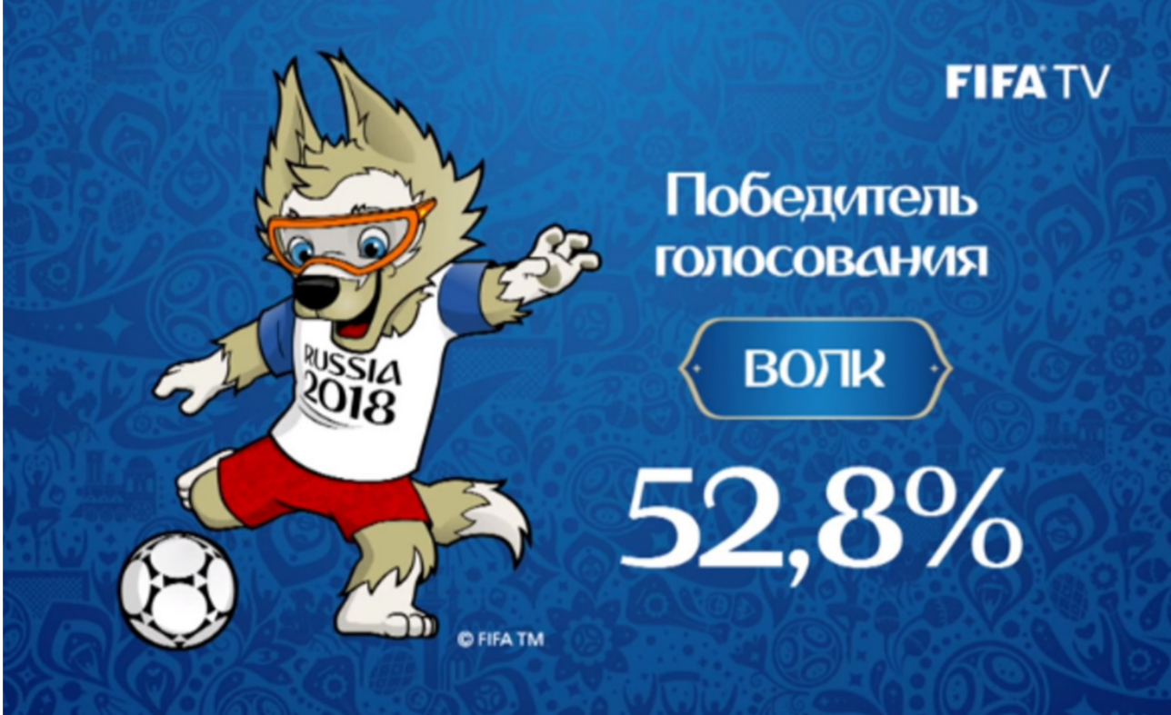
تميمة مونديال روسيا 2018

وفي هذا الصدد، فإن إدارة فيفا وليس مجلس الاخاد الدولي، بإمكانه إسقاط الملفات التي لا تستوفي المعايير التقنية. ومازال الباب مفتوحاً على مصرعيه أمام خارطة الطريق فيما يتعلق بروتاتب أعضاء المجلس الذين يتقاضون حالياً 300 ألف فرنك سويسري (303 آلاف دولار)، على عكس راتب رئيس الاخاد الذي يقاضى 1.5 مليون فرنك سويسري. وتبدو خارطة الطريق (فيفا 2.0) وكأنها إضافة تقنية لإصلاحات فيفا في أعقاب فضائح الفساد، لاسيما عقب الانتقادات التي تعرض لها إنفانتينو في وقت سابق لعدم تطبيقه الهياكل المناسبة للقيادة الجديدة. وأبدى إنفانتينو ثقته في أن خارطة الطريق ستعود بالنفع على جميع المشاركين في هذه الرياضة.