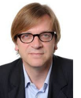
جوي فير هوفشتات رئيس الوزراء البلجيكي السابق