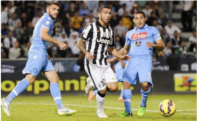
لقاء سابق لنابولي أمام يوفنتوس

تطور بالفعل في الفترة الماضية لأوضاع في غاية الخطورة على النظام العام". وتم إغلاق مدرجات الفريق الضيف، عندما التقى الفريقان في تورينو ونابولي، الموسم الماضي، لنفس السبب. وستكون المباراة، أول لقاء يخوضه جونزالو هيجوين مهاجم يوفنتوس، أمام ناديه