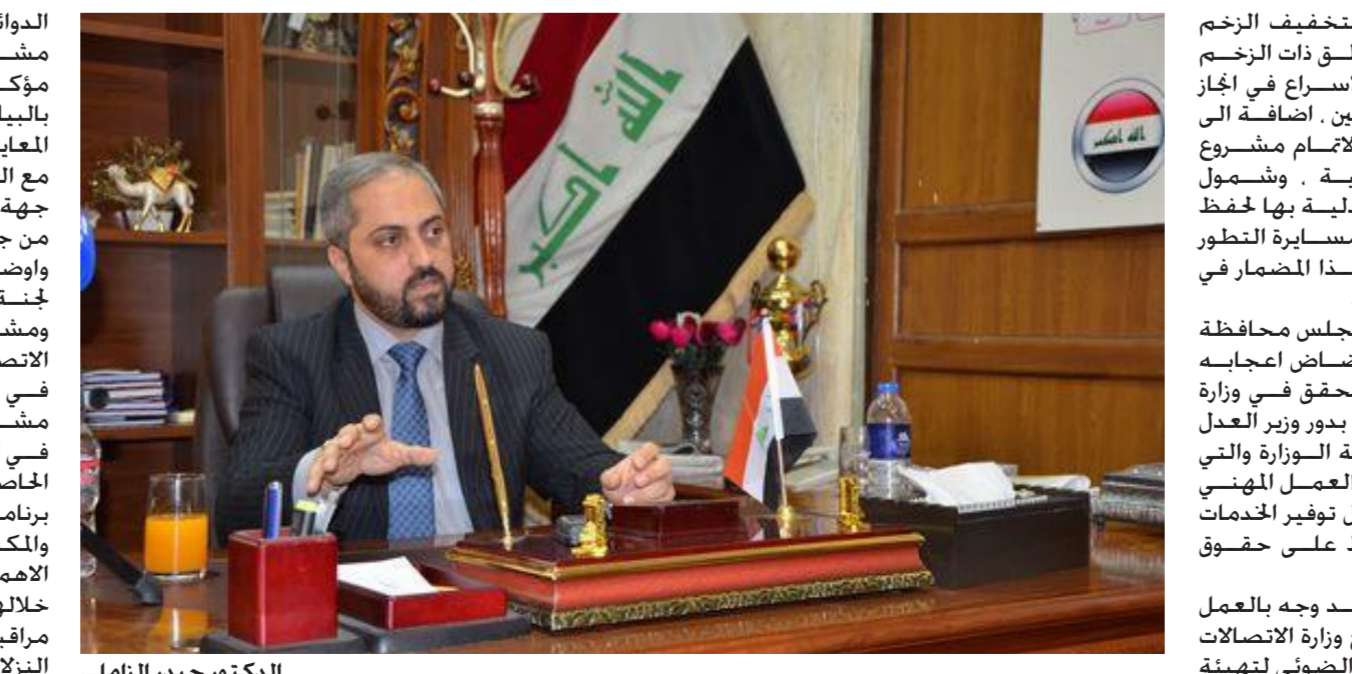
الدكتور حيدر الزامل

الدوائر العدلية على المضي ضمن مشروع الحكومة الالكترونية . مؤكداً على اهمية اعداد قاموس بالبيانات لغرض توحيدها ووضع المعايير الخاصة بها ومشاركتها مع الدوائر العدلية فيما بينها من جهة وبين الوزارة والوزارات الأخرى من جهة اخرى . ووضح الوزير خلال ترؤسه اجتماع لجنة السلامة الوطنية لامن ومشاركة المعلومات وحماية الاتصالات. وعضوية المدراء العميين في الوزارة حيث تم التطرق الى مشاريع الحكومة الالكترونية في الدوائر العدلية ومدى التقدم الحاصل بها . مشيراً الى تطبيق برنامج الاشراف الالكترونية ذات الالمكنة في الدوائر العدلية ذات الالمكنة القصوى. والتي حققت من خلالها ربط السجون بمنظومة مراقبة الالكترونية وادارة ملفات النزلاء. والشروع بمكنة دائرة رعاية