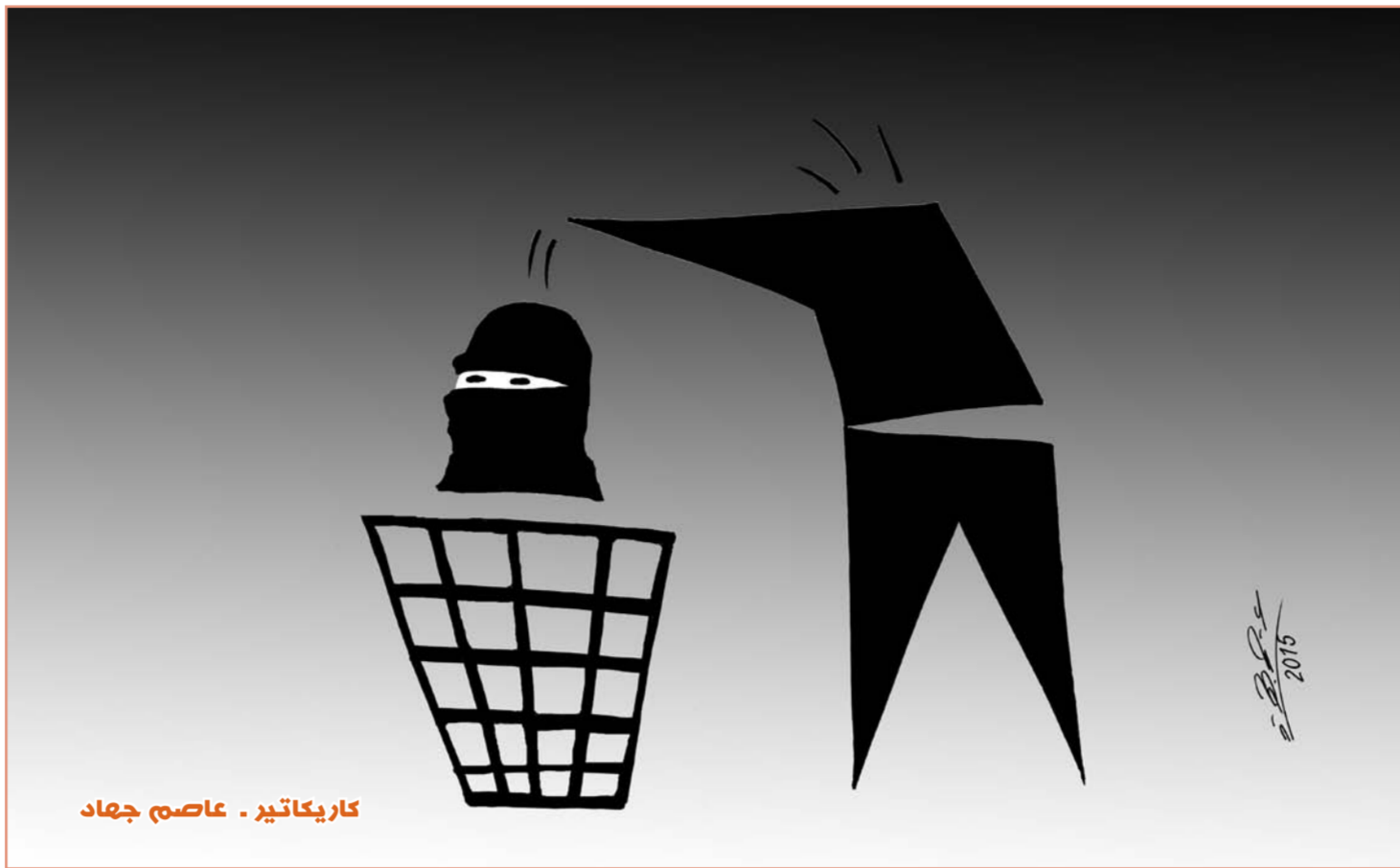
كاريكاتير - عاصم جهاد

افاد مصدر محلي في محافظة نينوى، بأن القوات الامنية رفعت العلم العراقي على أول كنيسة في ناحية برطلة شرق الموصل، بعد تحريرها من سيطرة تنظيم "داعش" بالكامل، فيما أشار إلى مقتل مسؤول كتيبة الاقتحام في التنظيم أويزكي الجنسية. وقال المصدر في حديث له، إن "قوات مكافحة الإرهاب نجحت في عمليات تحرير ناحية برطلة خلال 24 ساعة، حيث كان الهجوم من ثلاثة محاور، وسرعة المياغثة اسهمت بتحرير الناحية بنحو كامل". مبيناً أن "القوات العراقية رفعت العلم على أول كنيسة في برطلة". وأضاف المصدر الذي طلب عدم الكشف عن اسمه، أن "قوات مكافحة الإرهاب تمكنت من قتل 80 مسلحاً من تنظيم داعش بينهم قائد كتيبة الاقتحامات المدعو أبو طلحة الأوزيكي".