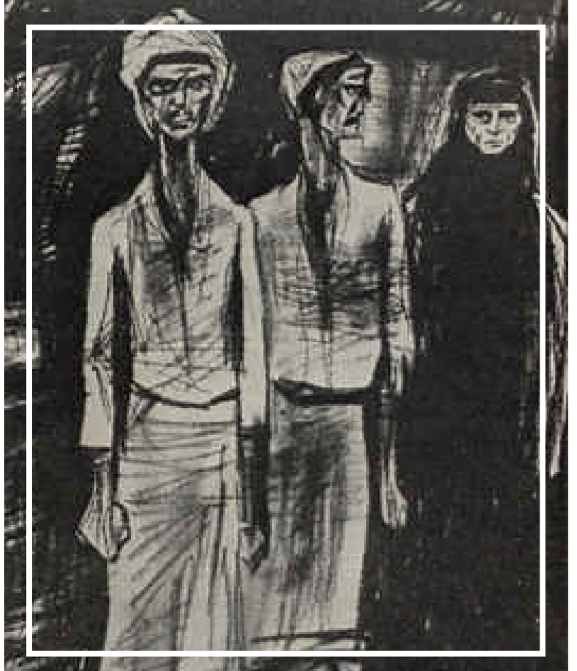
من أعمال الفنان محمود صبري

بابلو نيرودا ترجمته: حماد صبح أستطيع أن أكتب الليلة أشد القصائد حزناً . والنجوم ترتعش صافية في المدى . ريح الليل تدور مدومة مترنمة . أستطيع أن أكتب الليلة أشد القصائد حزناً . أحببت تلك المرأة، وأحبتني هي بين حين وآخر . ضممتها إلى صدري في ليلال تشبه هذه الليلة . وقبلتها مراراً تحت السماء المترامية . أحبتني تلك المرأة، وأحببتها أنا بين حين وآخر . كيف لا أكون أحببت عينيها النجلابين الوداعتين؟ أستطيع أن أكتب الليلة أشد القصائد حزناً حين أفكر في أنها ما عادت لي، وأشعر بأنني ضيعتها، وأصيح إلى الليل الرجيب الذي يزداد رحابة