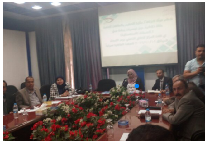
جانب من الورشة

ضرورة التدرب في كتابة التحقيقات الاستقصائية في مؤسسات الدولة والقطاع الخاص، ان تقوم هيئة النزاهة بتشكيل مركز صحفي استقصائي لدعم التحقيقات الاستقصائية بالتعاون مع نقابة الصحفيين لغرض التأهيل والتطوير. ضرورة تفعيل المعايير والمقاييس التي تتيح للصحافي الاستقصائي العمل في كشف ملفات الفساد. دعوة دوائر الهيئة لرصد ما ينشر في وسائل الاعلام من قضايا صحافي، خاصة قانون الحصول على المعلومات، وقانون حرية التعبير وتفعيل قانون حماية الصحفيين الذي صدر عام 2011.