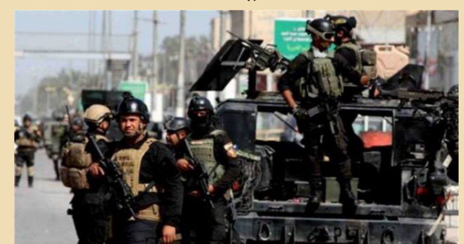
قوات جهاز مكافحة الإرهاب ذات التجهيز والتدريب عالي المستوى

بغداد - الصباح الجديد: أفادت محطة "سكاي نيوز" الأميركية. بان قوة "ضخمة" من جهاز مكافحة الإرهاب ستشارك في اقتحام مركز مدينة الموصل. مبيّنة أن قوات الجهاز مدربة تدريباً عالياً ومزودة بدبابات وعربات "همتي" مدعمة ومتقلبة وقاذفات صواريخ ومركبات لإزالة الألغام. وذكرت المحطة في تقرير لها تابعتها السورية نينوى أن "عملية اقتحام مركز مدينة الموصل المرتقبة ستشارك فيها قوة ضخمة من جهاز مكافحة الإرهاب مجهزة تجهيزاً عالياً". وأضاف التقرير أن "هذه القوة المدربة تدريباً عالياً أيضاً تقاتل