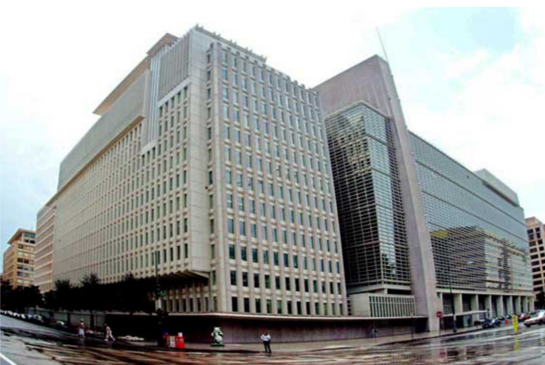
مبنى البنك الدولي

قياسية بلغت 33.6 مليون برميل يوميا في أيلول. وأبقى البنك على توقعاته متوسط أسعار النفط في 2016 من دون تغيير عند 43 دولارا للبرميل. وقال وزير الطاقة السعودي خالد الفالح الذي خُتل ببلاده مركز الصدارة بين منتجي أوبك أمس الأربعاء إن أسواق النفط بلغت نهاية منحنى نزولي حاد إذ تحسّن العوامل الأساسية في الوقت الذي يعود فيه التوازن بين العرض والطلب. وتضررت سوق النفط العالمية من تحمّ في المعروض هي الأكبر في 30 عاما على مدار أكثر من سنتين ما تسبب في هبوط الأسعار من مستوى 100 دولار للبرميل في 2014 إلى 27 دولارا للبرميل في وقت سابق من هذا العام. غير أن الأسعار استقرت منذ ذلك الحين عند نحو 50 دولارا للبرميل لأسباب منها انخفاض إنتاج المستقلين وتعطل الإمدادات في بعض الدول الأعضاء بأوبك. وقال البنك الدولي إنه يتوقع حدوث تعافٍ متوسط لمعظم السلع الأولية ومن بينها المعادن والسلع الزراعية في