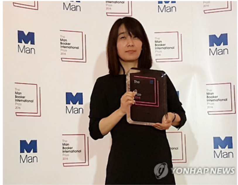
الكاتبة الكورية الجنوبية هان كانغ

الجزء الثاني عن زوج شقيقة يونغ - هاي، وهو القسم الأجمل والأكثر قتامة بنشاعريته العميقة الكثيفة، زوج إن - هاي الذي لا نعرف اسمه، فنان فيديو يوحى الخضوع