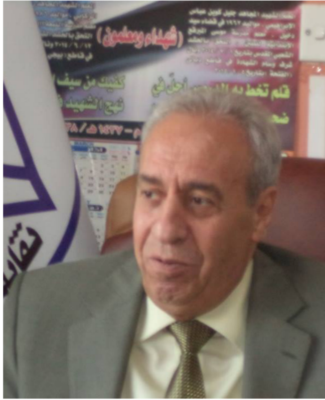
نقيب المعلمين السوريين