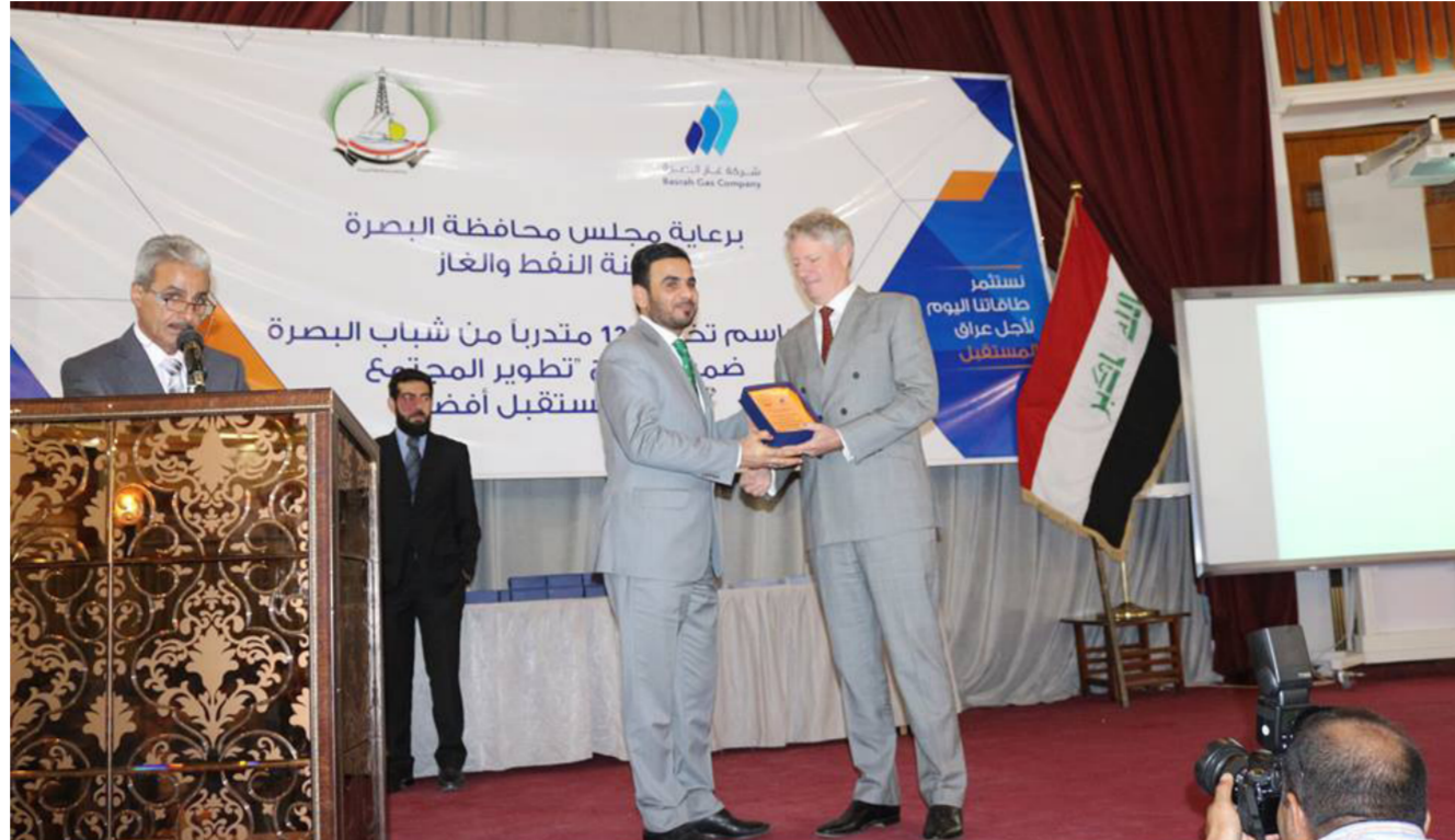
شهادة تقديرية من لجنة النفط والغاز في مجلس محافظة البصرة لمدير عام شركة غاز البصرة

تهدف الدورة إلى تأهيل الشباب لغرض تشغيلهم في الشركات الأجنبية وإجراء عملية مقابلات من قبل إحدى الشركات العاملة في القطاع النفطي مع الشباب