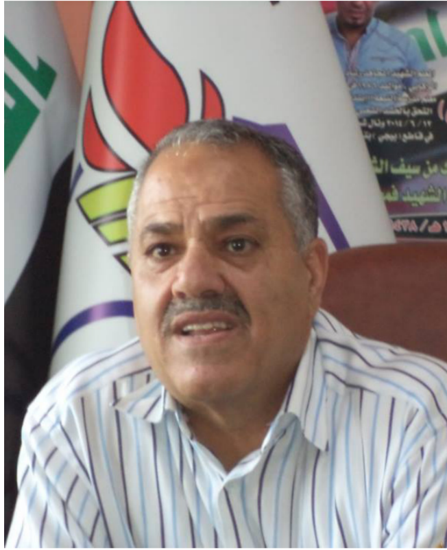
نقيب المعلمين البغداديين