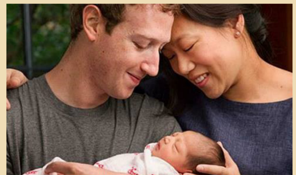
مارك زوكبيرغ وزوجته ومولده