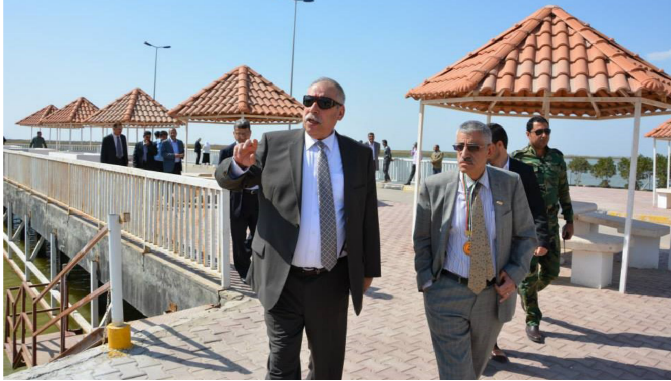
رئيس جامعة البصرة خلال زيارته لأحد مواقع عمل مركز علوم البحار