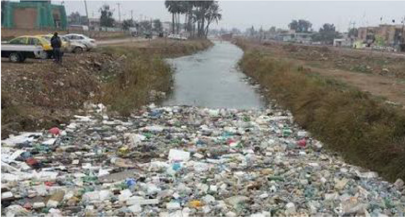
التلوث في العراق

الطبيعة، ولهذا يجب أن يدرس كل مشروع يستهدف استثمار البيئة بواسطة المختصين وفريق من الباحثين في الفروع الأساسية التي تهتم بدراسة البيئة الطبيعية، حتى يفروا معاً التغييرات المتوقع حدوثها عندما يتم المشروع، فيعملوا معاً على التخفيف من التأثيرات السلبية المحتملة، ويجب أن تظل الصلة بين المختصين والباحثين قائمة لمعالجة ما قد يظهر من مشكلات جديدة.