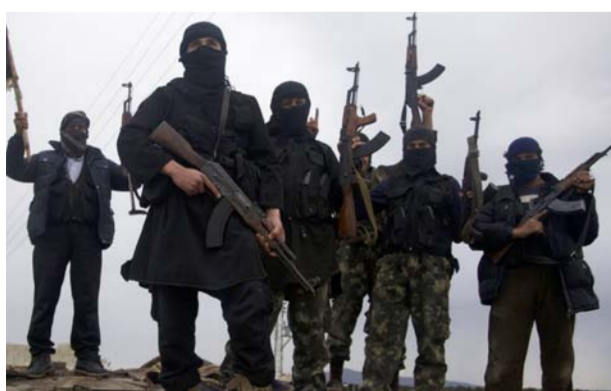
عناصر داعش في الموصل

التي تضم أكثر من 1.2 مليون نسمة". ونقلت الصحيفة عن الكولونيل فيمش دي بريتون غورن الضابط السابق في القوات البريطانية