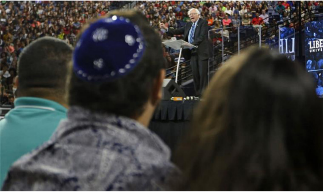
الحملة الانتخابية الأميركية

كما نوه وولف في تقريره انه استعان بعدة احصائيات وبيانات كانت قد قامت بها جهات اعلامية في مركز وتواجد تلك الفئة في اميركا حيث وجد انها تنحصر في الجهات الشمالية ، حيث تشير أحدث الاحصائيات العتمدة الى ان نسبة اليهود في المجتمع الاميركي لا تتعدى 2% من مجموع السكان. تبلغ نسبة المسجلين في الدوائر الانتخابية والمشاركين 90% منهم «مقابل اقدم