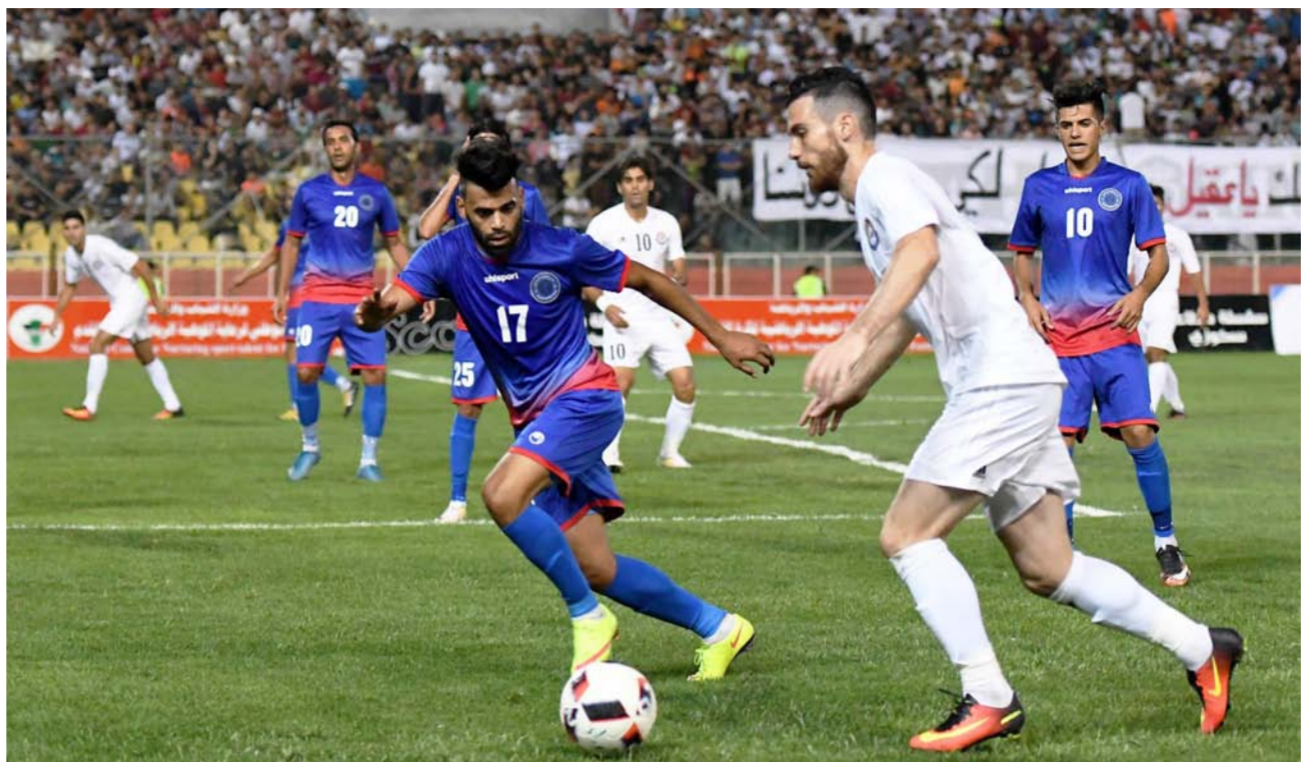
جانب من مباراة الزوراء والطلبة..

أنواع الاسناد حتى يحقق النتائج الإيجابية ويرفع اسم العراق عالمياً ويتأهل إلى نهائيات كأس العالم، ليضاف هذا الإنجاز إلى الإنجازات الكثيرة التي خُفقت والتي جاءت ثمرة التعاون المشترك بين الوزارة وأحاد الكرة والمؤسسات الرياضية الأخرى.. وأوضح عبطان أن امنا كبيرا في لاعبين وجومنا ولاسيما والريضة عبد الحسين عبطان من النجاحات الكروية تبدأ من هذه الفئة العمرية التي ستؤكد علو كعب الكرة العراقية في المحفل القاري الهام على صعيد اللاعبين دون 16 عاماً.