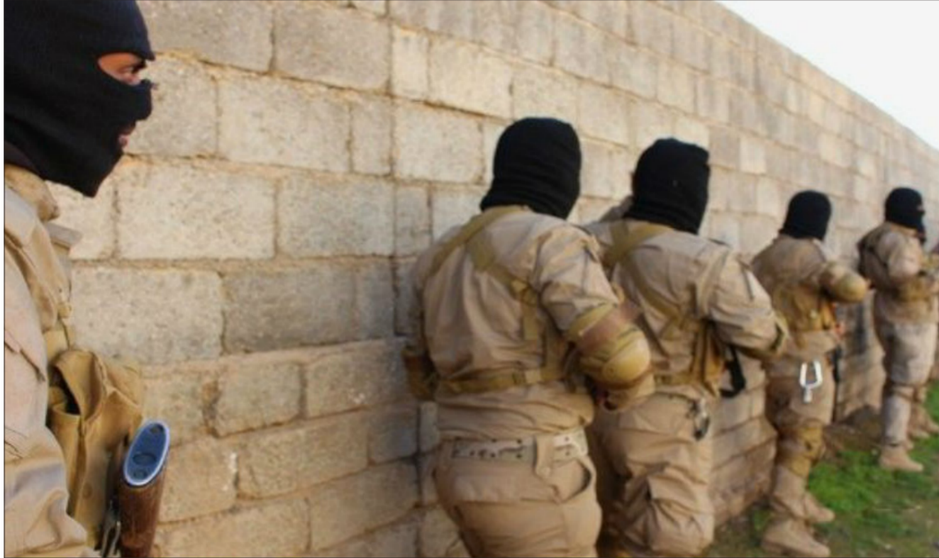
عناصر من داعش في الموصل

مدخل حي العربي (شمال المدينة) وكان التنظيم قد اغلق عدداً من الأحياء السكنية في الجانب الأيسر بالكتل الكونكريتية الأسبوع الماضي. خاصة تلك الواقعة بالمناطق الشرقية و الشرقية الجنوبية. واستمر التنظيم بنقل مادة النفط الخام وخزنها بحفر اعدها لهذا الغرض في اطراف الموصل وخاصة في المناطق الشمالية (محور تكليف والشلالات) وفي المنطقة الغربية باتجاه محور الكسكس.