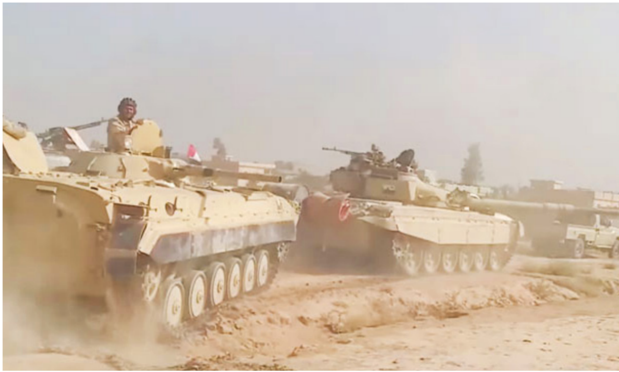
القوات الأمنية خلال معركة تحرير الشرفاق

وأوضح أن العملية شاركت فيها قطعات الجيش العراقي من الفرقة 9 والفرقة 11 والفرقة 15 ولواء 51 والحشد الشعبي وبإسناد نوعي من القوة الجوية وطيران الجيش وطيران التحالف