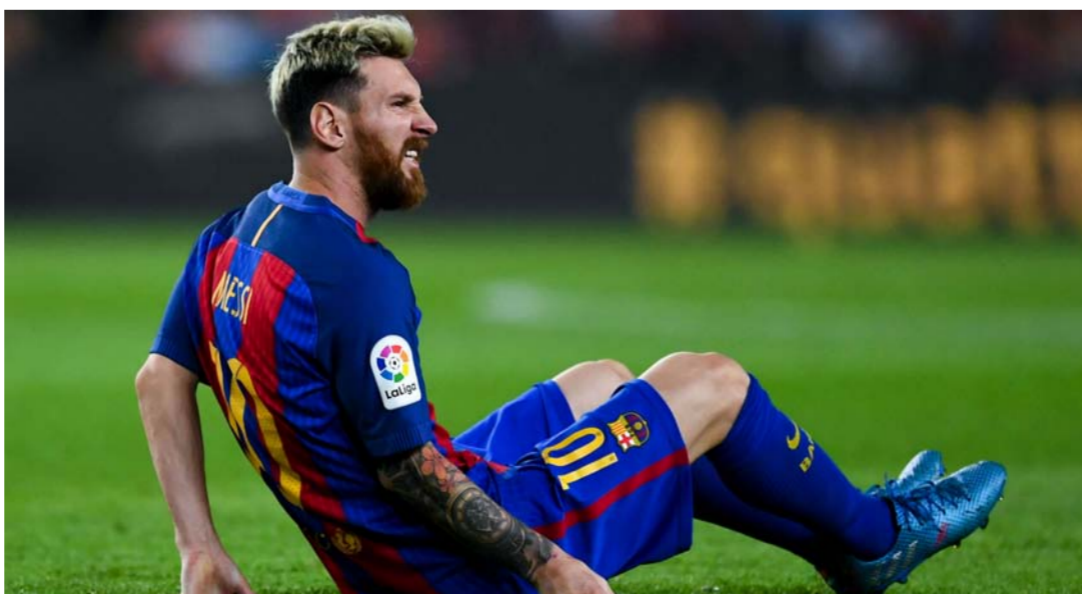
ميسي يتعرض إلى إصابة جديدة

وكان ميسي قد تعرض لتمزق في العضلة الضامة لساقه اليمنى الأربعاء