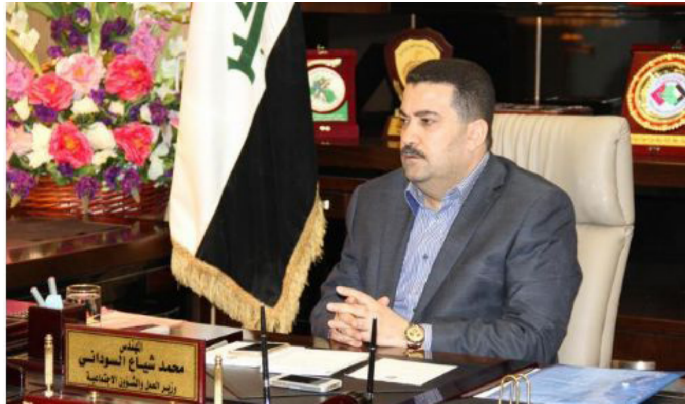
محمد شياع السوداني

امكانية التعاون مع الجانب الصيني من خلال الاستثمار في المدينة الصناعية التي يجري العمل على إنجازها في محافظة ذي قار . ومن جانبه بين الوفد الصيني استعداده لتمتين علاقات التعاون الصناعي مع شركات الوزارة والرغبة في الدخول وبقوة لتطوير الاقتصاد العراقي والنهوض بالصناعة المحلية بالاستفادة من خبرات الشركات الصينية في هذا المجال .