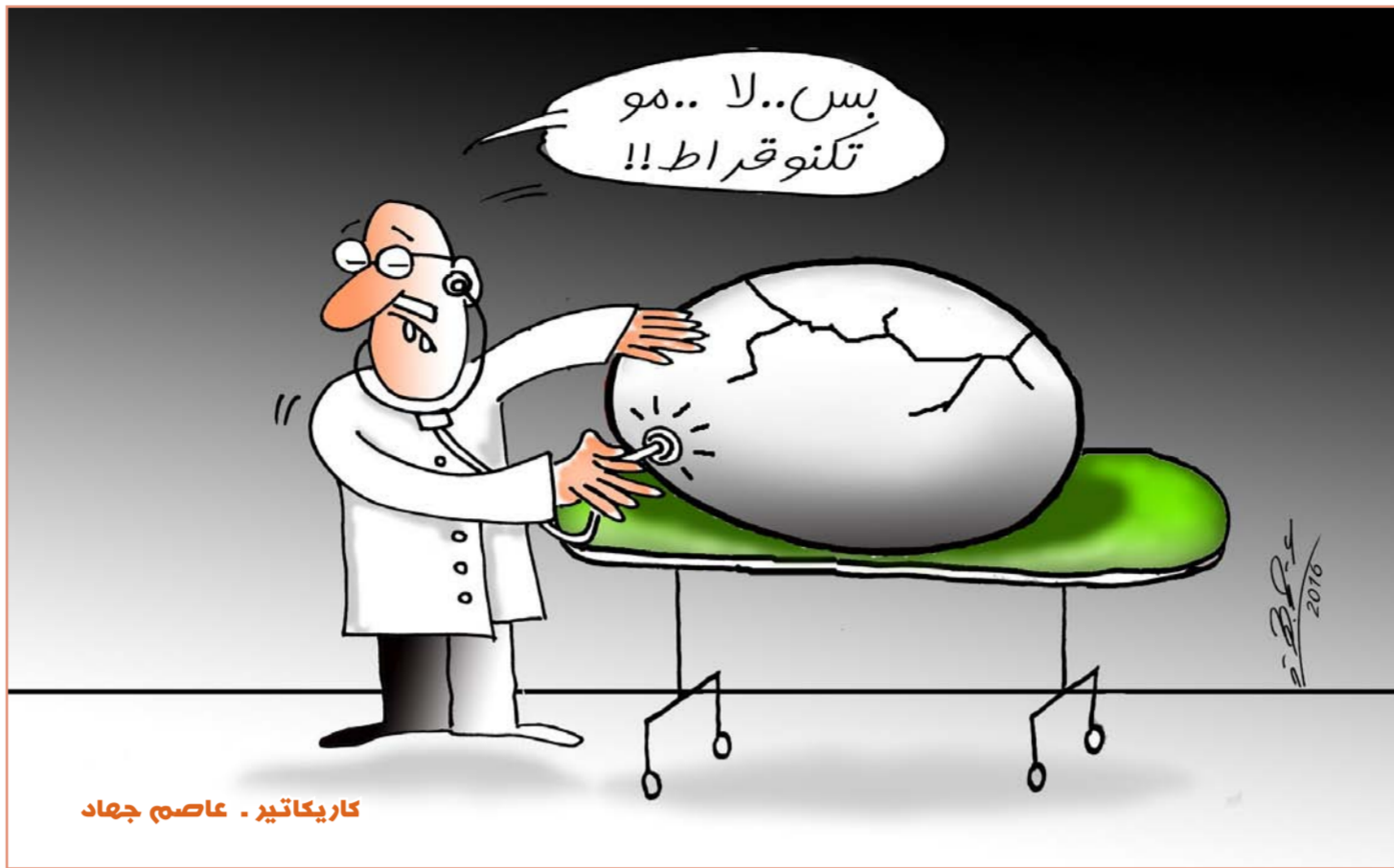
كاريكاتير - عاصم جهاد

وتبلغ الكلفة نحو 400 مليون دولار لصناعة طائرة واحدة. ويأمل الباحثون أن يؤدي التعاون الأفضل إلى تقليص هذه الكلفة.