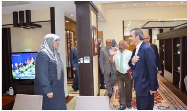
جانبا من اللقاء

مجموعة G5 الذي ستهجنه وقائمه العاصمة ايرانية طهران في منتصف الشهر المقبل وهي ثلثة بالعراق وبران وباكستان وافغانستان ومنظمة الصحة العالمية . وتعد هذه المجموعة من المجموع التي تعمل على التنسيق