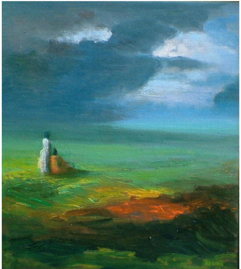
لوحة للفنان رسمي الخفاجي

... هو عنوان . لكنه يحتاج الى ضرورة كي يقرأ سبب نصوص الحرب متواضع وتكونت افكار الحرب ادب الحرب فلسفة الحرب حادثة الحرب . والصورة ما زالت كالحلم تأبه في المعنى يريد ان يجد في الصورة تساؤلا واذا بالقراءة وجد سطوة لوجوده فأصبح غائبا وغريبا وهو معلق بين الخلق والوجود