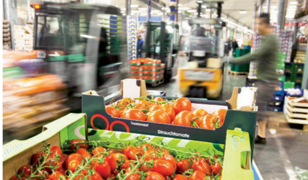
صدرت روسيا في العام الماضي منتجات زراعية وغذائية بمقدار 16 مليار دولار

على هامش أعمال اللجنة الحكومية الروسية - العراقية للتعاون التجاري والاقتصادي والعلمي والتقني، التي أنهت اجتماعاتها في بغداد يوم الخميس. وخلال المحادثات بين هيئات الرقابة في البلدين أعرب الجانب العراقي عن رغبته في توسيع التعاون في المجال الزراعي التركي بإسقاط قاذفة روسية فوق سوريا يوم الـ 24 من شهر تشرين الثاني الماضي. لتصف موسكو هذا العمل بـ «الطعنة في الظهر» على إثرها فرضت موسكو حظراً على استيراد بعض أنواع المنتجات الزراعية والغذائية من تركيا. إضافة إلى حظر رحلات الطيران غير المنتظمة «تشارتر» ووقف بيع تذاكر الرحلات السياحية إلى تركيا. وكذلك تضمنت القيود فرض تأشيرات دخول على المواطنين الأتراك. وحظر استخدام الأيدي العاملة التركية في روسيا. ودخلت هذه الإجراءات حيز التنفيذ ابتداءً من مطلع عام 2016.