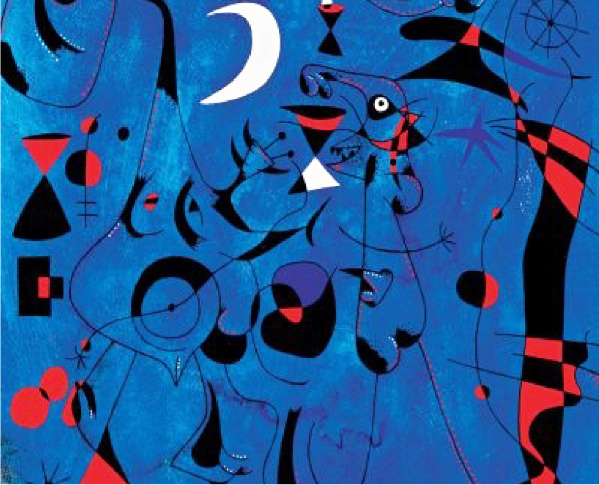
جوان ميرو: "الأرقام في ليلة واسترشادا المسارات المفسورية من القواقع"

الذي كان نصيبنا من الدياجير؟ هكذا نلمح في المساء في البلدات الكبيرة التي ترتي للماشية، حيث يتزود الريفيون بيزرعهم؛ أقفرت كل البنابيع، وكل مساحة جف وخَلها موسومة بأشجار حوافر الماشية، والغرياء بلا أسماء وبلا وجوه، يعتمرون قلنسوات طويلة مسبلة، يقترسون، تحت الأرقعة وحذو دعامة البوابة الحجرية، من فنيات الأرض الكبيرة اللواتي يعطرن الظل والليل، مثل قوارب من صنوبر في الظلال.