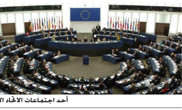
أحد اجتماعات الاتحاد الأوروبي

أن الحكومة ستنفق أكثر من 600 مليون دولار مساعدات من تركيا لتوسيد أقطار لشركات التأمين على الحصول لمساعدة المزارعين الصغار والمتوسطين ومرمي الماشية على مواصلة نشاطاتهم في ظروف طبيعية، عبر خفض الكلفة ودعم أسعار الأعلاف والتمويل لمقاومة أثر الجفاف. ويعيش نحو 33 في المئة من سكان المغرب من النشاطات الزراعية وتفرعاتها، التي تمثل 15 في المئة من الناتج المحلي الإجمالي.