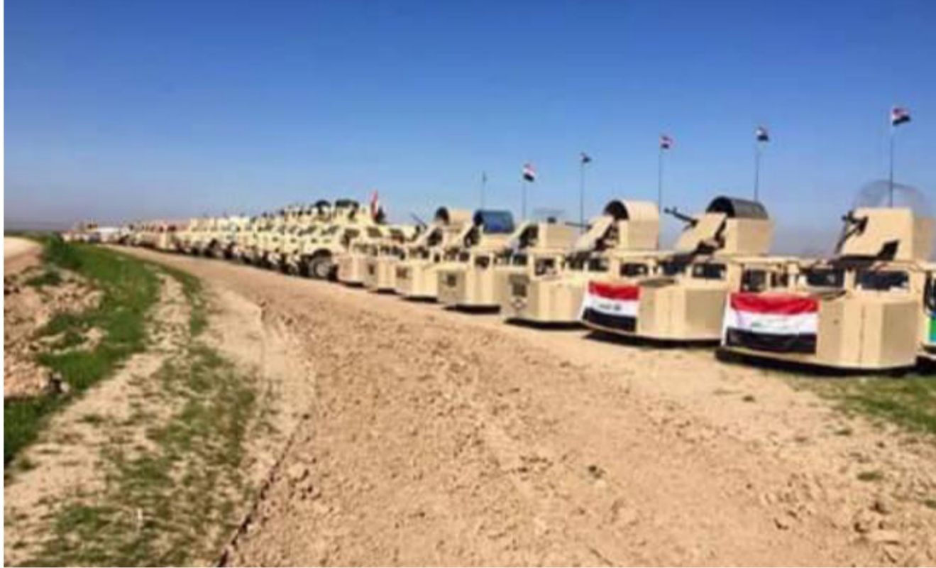
القوات الأمنية تتحشد قرب الموصل