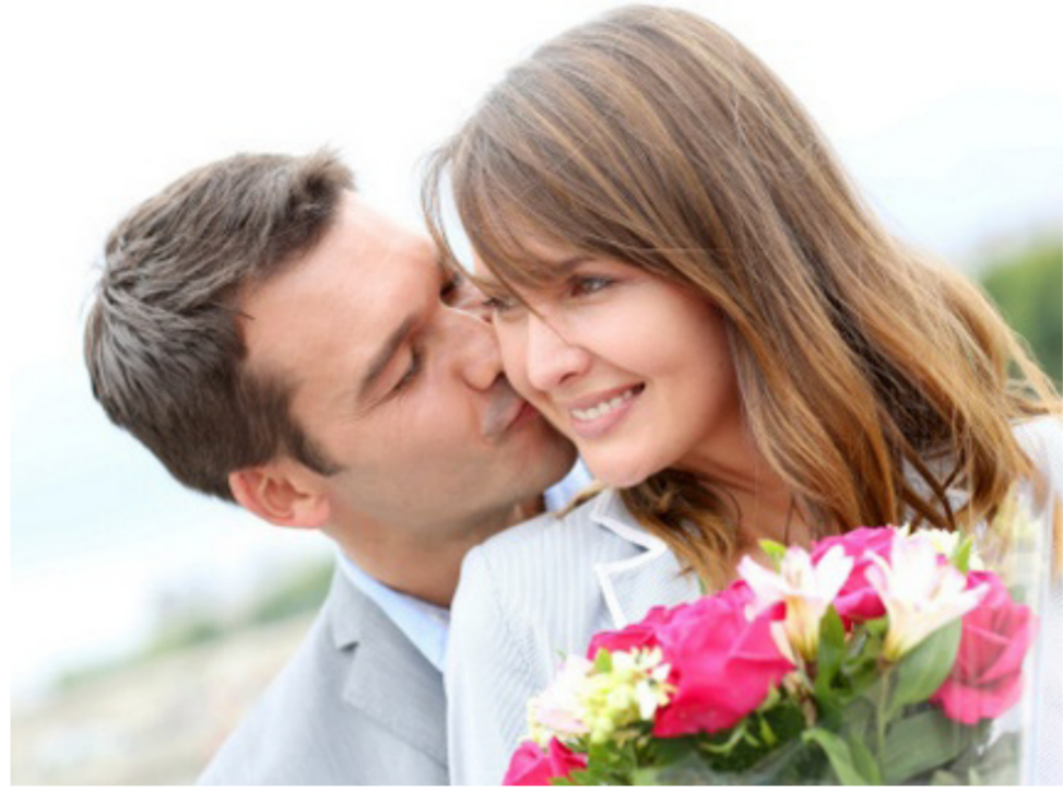
الزهور رمز للحب في عيد

سيدة من بين كل 7 سيدات شاركن في المسح إتهن يعترمن إنهاء العلاقة العاطفية إذا لم يقدم لها شريكها هدية عيد الحب لهذا العام.