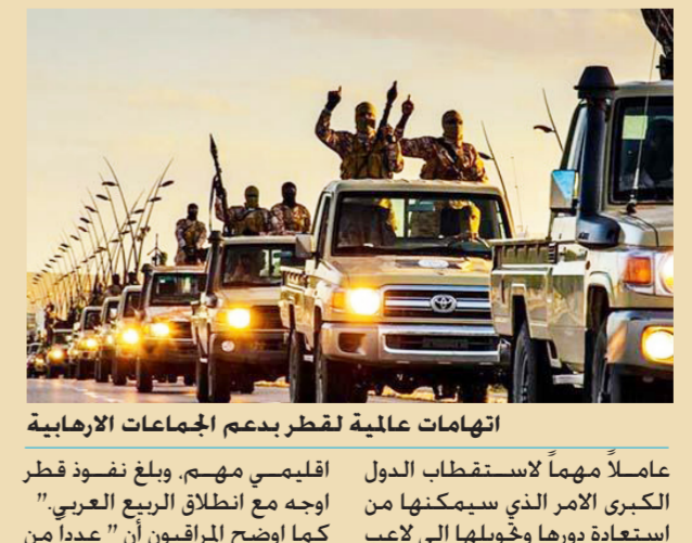
اتهامات عالمية لتطير بدعم الجماعات الارهابية

الصحف البريطانية اتهمت قطر بتحويل عدد من الجماعات الإرهابية في منطقة الشرق الأوسط خاصة في ليبيا وسوريا والعراق. على سبيل المثال أن الدوحة تستثمر ملايين الأموال في لندن من أجل حصد المزيد من الأرباح لتمويل الإرهاب وتزويد الجماعات التي تهدد الغرب بالسلاح. هذه الاتهامات والفضائح وبحسب بعض المراقبين دفعت السلطات في قطر إلى الاعتماد على قوتها المالية وثرواتها الطبيعية. واستعملها كسلاح جيد لتقرب من بعض الدول الكبرى الأمر الذي سيمكثها من ممارسة ضغوط إضافية على تلك