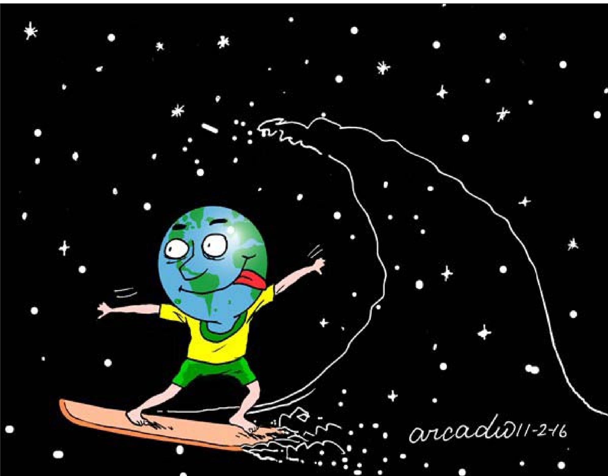
عن موقع «كارتون سياسي»