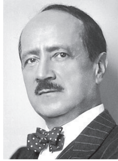
سان جون بيرس

و فوق الأرض الصلصالية الاستوائية الحمراء