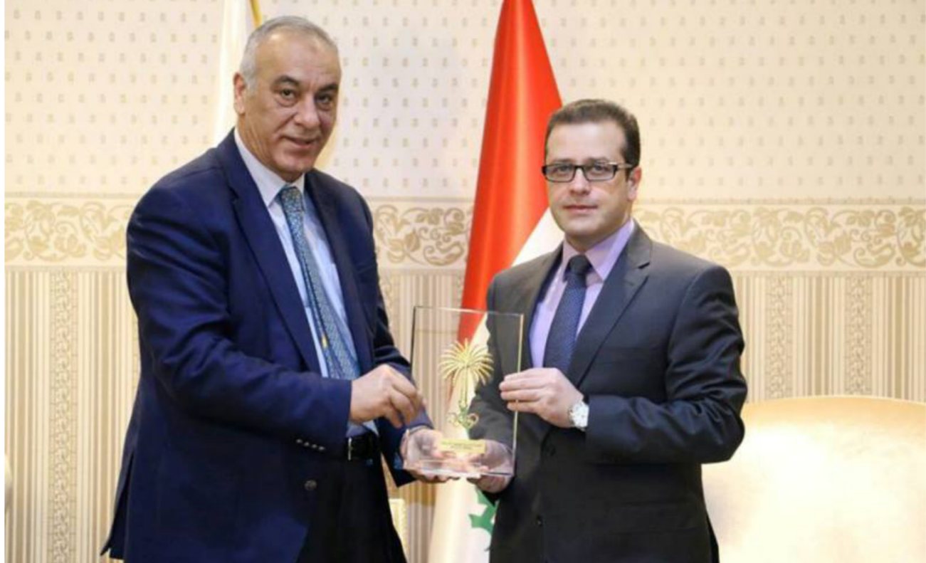
جانب من لقاء وزير التربية برئيس اللجنة الأولمبية

مهمة منتسبي الوزارة من الرياضيين والمدربين والحكام الذين يمثلون المنتخب الوطني في المحافل الدولية بنحو يجعلهم تقدم عطاء افضل لتحقيق نتيجة ايجابية . معرباً عن سعادته الكبيرة ان يرتبط الأجاز الكفاءات المتواجدة في مختلف الأحدات المركزية وما تشكله