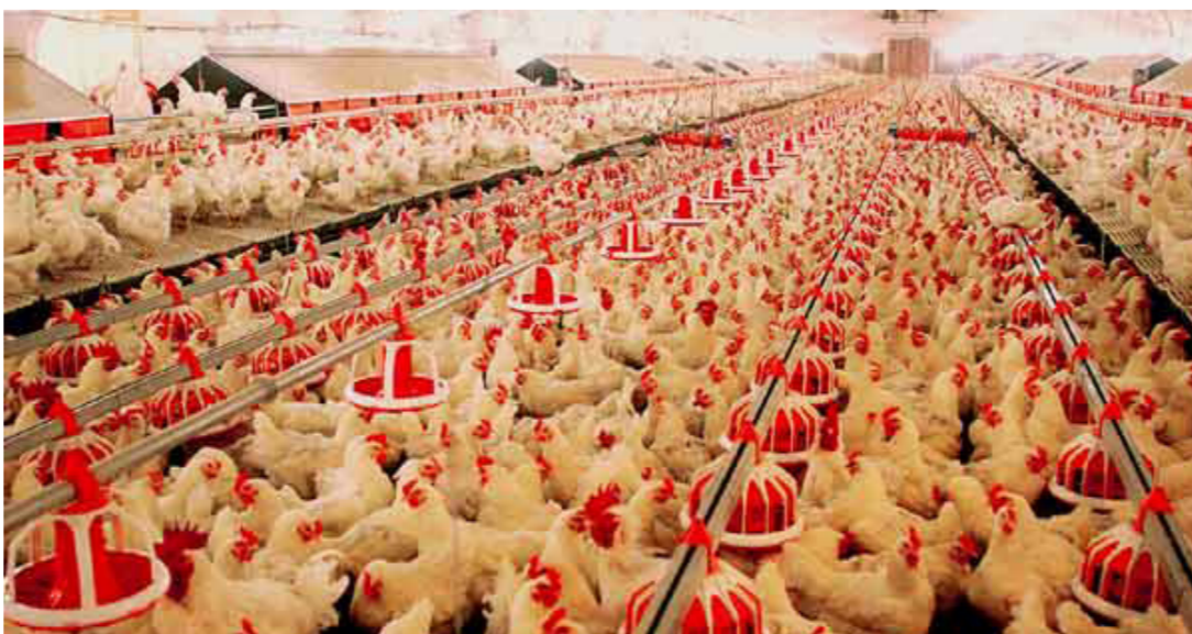
مشروع تربية الدواجن

من جهة اخرى أعلنت وزارة الزراعة عن شمول العجول الحية المستوردة لأغراض التسمين بقرص المبادرة الزراعية وبنسبة اسهام 100% . وذكر قسم العلاقات والاعلام والتعاون الدولي في الوزارة بأن مجلس ادارة صناديق الاقراض التخصصية قرر في جلسته المتعمدة مؤخرا واستنادا الى محضر اللجنة المشكلة بهذا الخصوص شمول العجول الحية المستوردة لأغراض التسمين فقط بقرص المبادرة الزراعية للحكومة العراقية وبنسبة اسهام 100%.