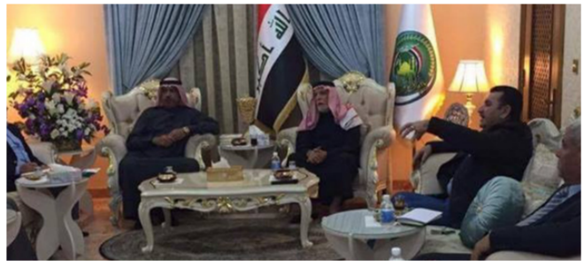
جانب من الاجتماع

تأخذ على عاتقها تسهيل إعادة نازحي محافظة الأنبار الى مدنهم.