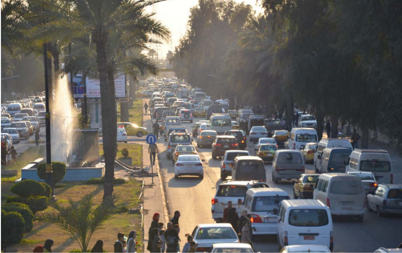
الاختناقات المرورية في بغداد

اعمال الموسم الربيعي التي تشمل تشجير الشوارع وزراعتها بالأشجار والنباتات الدائمة والموسمية والاهتمام بالحدائق والمنتزهات وتجهيزها بجميع الخدمات الضرورية لاستقبال العائلات البغدادية.