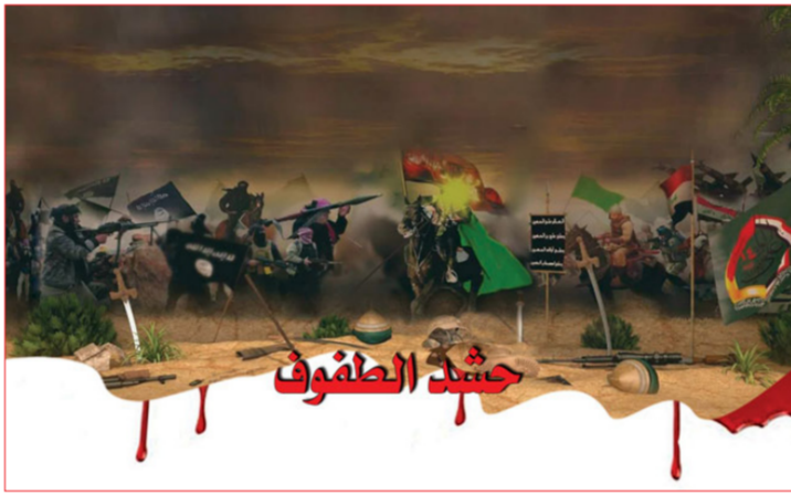
المصق الدعائي للعمل

واعشاب برية، منها ما تم عرضه على شكل جدارية من الفلكس بقياس (10م x 2.5م) وأخرى عرضت على الأرض الترابية بمساحة (10م x 2م) من ومقتنيات الشهداء وملابس رثة تمثل ملايين سود للمهزومين من عناصر (داعش)، إضافة إلى إطلاقات نارية وبعض الأسلحة القديمة بين الرمح والسهم والبندقية، فيما رافق الحشد فقرات الرسم الحر لقضية الحشد الشعبي أيضاً شمل الربط بين الماضي والحاضر كفكرة فنية.