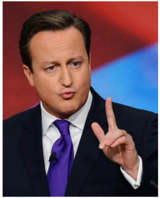
رئيس وزراء بريطانيا ديفيد كاميرون

تشككا في الاتحاد الأوروبي في الداخل بأنه ربما يجد وسيلة لتأمين تفوق البرلمان. وأكد كاميرون رغبته في بقاء بريطانيا في اتحاد أوروبي معدل ويناضل بقوة من أجل تهدئة مخاوف الشعب البريطاني قبل قصة تعقد يومي 18 و19 فبراير شباط حيث يأمل بالتوصل لاتفاق مع نظرائه في الاتحاد الأوروبي. ويقول مفاوضون بريطانيون وأوروبيون إنه تم الاتفاق على معظم حزمة الإصلاحات ولكن سيبتعين على كاميرون تسوية قضايا شائكة نهائياً مثل الهجرة حيث يأمل الزعماء البريطانيون بأن يتمكنوا من الحد من استحقاقات الرعاية الاجتماعية التي تمنح لعمال الاتحاد الأوروبي.