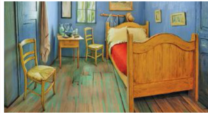
رسم افتراضي لغرفة فان غوخ

غوخ تلقى رواجاً وتقديراً كبيرين من الزوار، وأعاد تشكيل الغرفة بحجمها الطبيعي مجموعة من الفنانين في شيكاغو مستخدمين الالوان القوية الواردة في اللوحة، وقالت هيكنس: "انها فرصة للتفكير والتجول في الغرفة والاقامة فيها والقاء نظرة جديدة