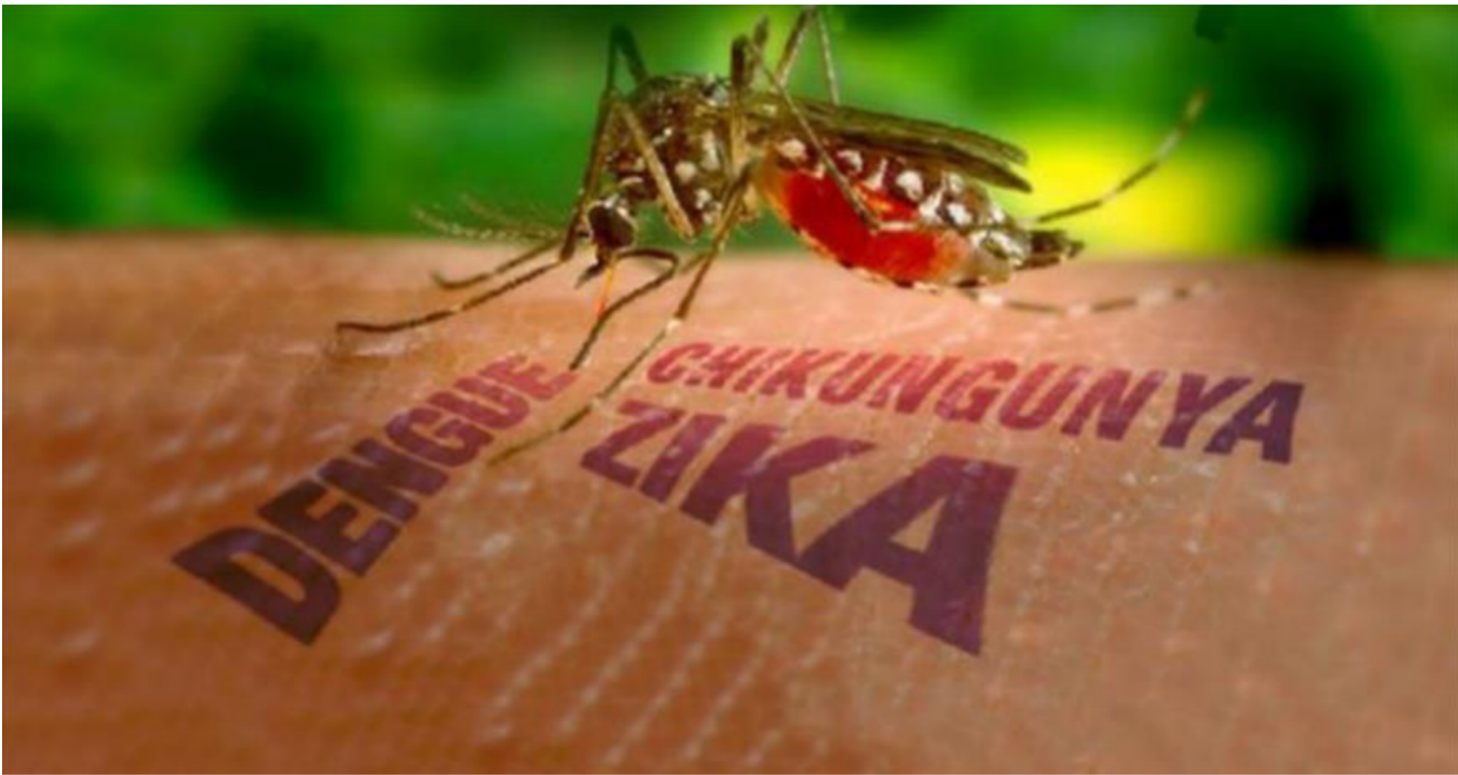
فايروس زيكا ينتقل عبر البعوض

والأحداث القادمة إمكانية إنتقال المرض من شخص إلى شخص آخر بنحو مباشر أي أن العدوى لا تتوقف على وجود البعوض الناقل للمرض فسيصنف هذا المرض بأنه وباء عالمي لا يتحدد بمنطقة أو مكان وإنما كل بقع الأرض تكون عرضة للإصابة به كأي فايروس وبائي آخر مثل مرض نقص المناعة المكتسب أو ما يسمى بفيروس وبائي آخر مثل مرض إيدز» أو مرض أنفلونزا الطيور أو أنفلونزا الخنازير وغيرها. المعلومات الطبية الحالية والتي تبحث بالعدوى المباشرة من شخص إلى شخص آخر تشير إلى إمكانية إنتقال هذا المرض عن طريق سوائل الجسم حيث أستخلص فايروس الزيكا من لعاب الإنسان ومن سائله النوي ما قد يتيح الفرصة إلى التنظير بأن هذا المرض قد ينتقل عن طريق ممارسة الجنس مع شخص آخر أو عن طريق التقبيل الفم بالفم، على هذا الأساس ونحن إجمالاً عام يمكن تصنيف طرق الوقاية من هذا المرض كما يلي :