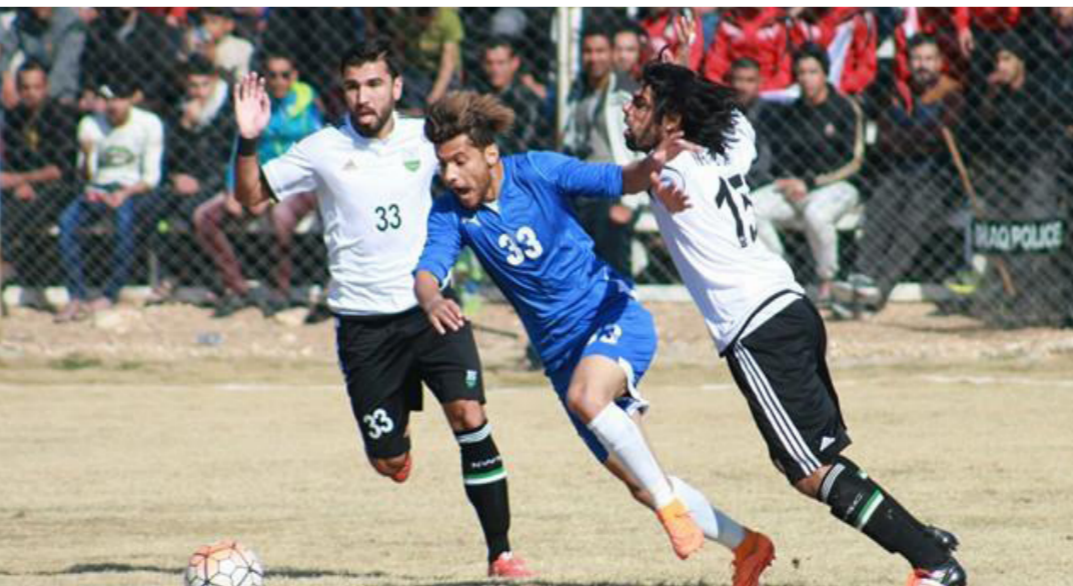
من مباراة نفط الوسط والسماوة

وتابع بحر العلوم ان ادارة نادي نفط الوسط توجه الانتقاد الى حكم المباراة الدولي وانق محمد الذي مقترض منه ان لا يتسرع في اشهاد البطاقة الحمراء التي تعترف ان كرار يستحقها، لكن المفروض ان يمنح