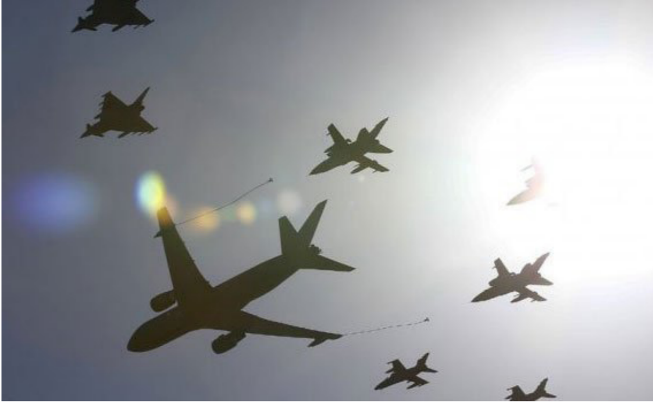
طائرات حربية روسية في سماء سوريا

دي مستورا «وصلتنا رسائل كثيرة من الشعب السوري تطالب بإبصال المساعدات الإنسانية، واتفقنا مع الأطراف المعنية على وقف الأعمال العدائية وليس وقف إطلاق النار». وأعلن المتحدث باسم الخارجية الألمانية مارتن شيفر «يجب ان ندرس كيفية نقل المساعدات الإنسانية لأشخاص يائسين وجائعين وكيفية إعادة خربك المفاوضات السلام، فيما أكدت روسيا انها لا تنوع وقف غاراتها «المشروعة» ضد المتطرفين (داعش و النصر) لكنها وعدت باقتراح «افكار جديدة» في ميونيخ للتوصل الى وقف لإطلاق النار.