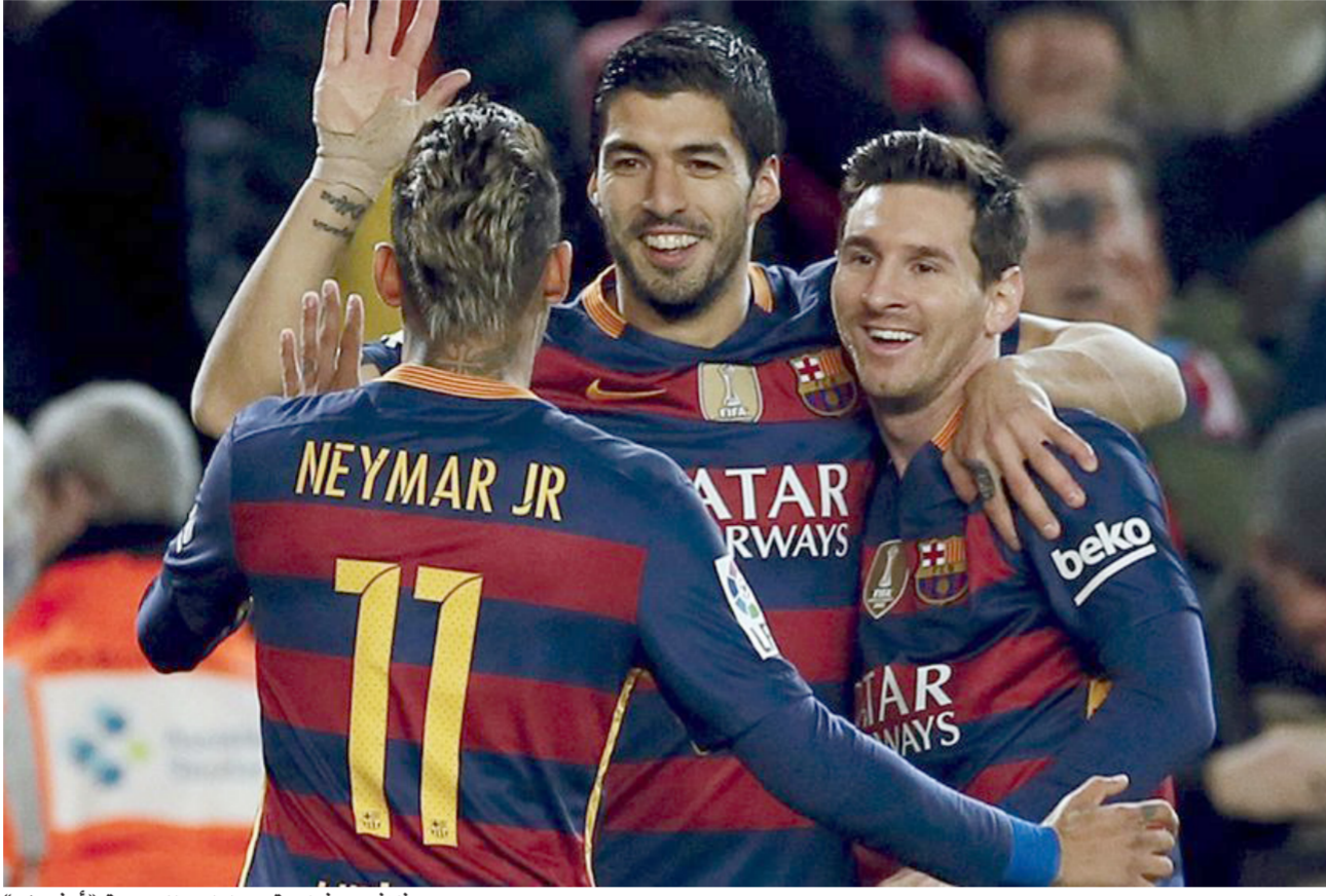
ثلاثي برشلونة يتبادلون التهنة «أرشيف»

وأشار التقرير إلى والد نيمار سيلعب دوراً مهماً في صفقة ابنه. حيث لم يظهر نيته أو رغبته في بقاء ابنه في صفوف برشلونة. وأيضاً لم يتحدث عن صفقة جديدة.