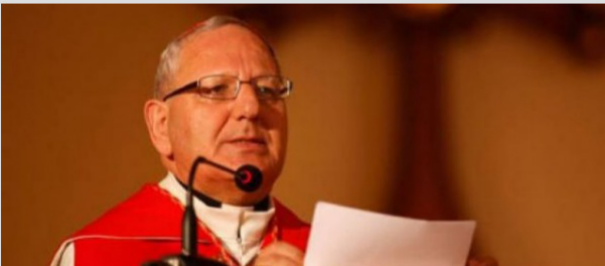
البطيريك لويس روفائيل ساكو

بغداد - الصباح الجديد: أعلن رئيس الكنيسة الكلدانية في العراق والعالم البطيريك لويس روفائيل ساكو، عن مقاطعة المسيحيين لمؤتمر حماية التعايش السلمي في بغداد بسبب «الخيف» الذي يمارس ضدهم، فيما اعتبر المشاركة بالمؤتمر بأنها غير مجدية كونها «يخصص