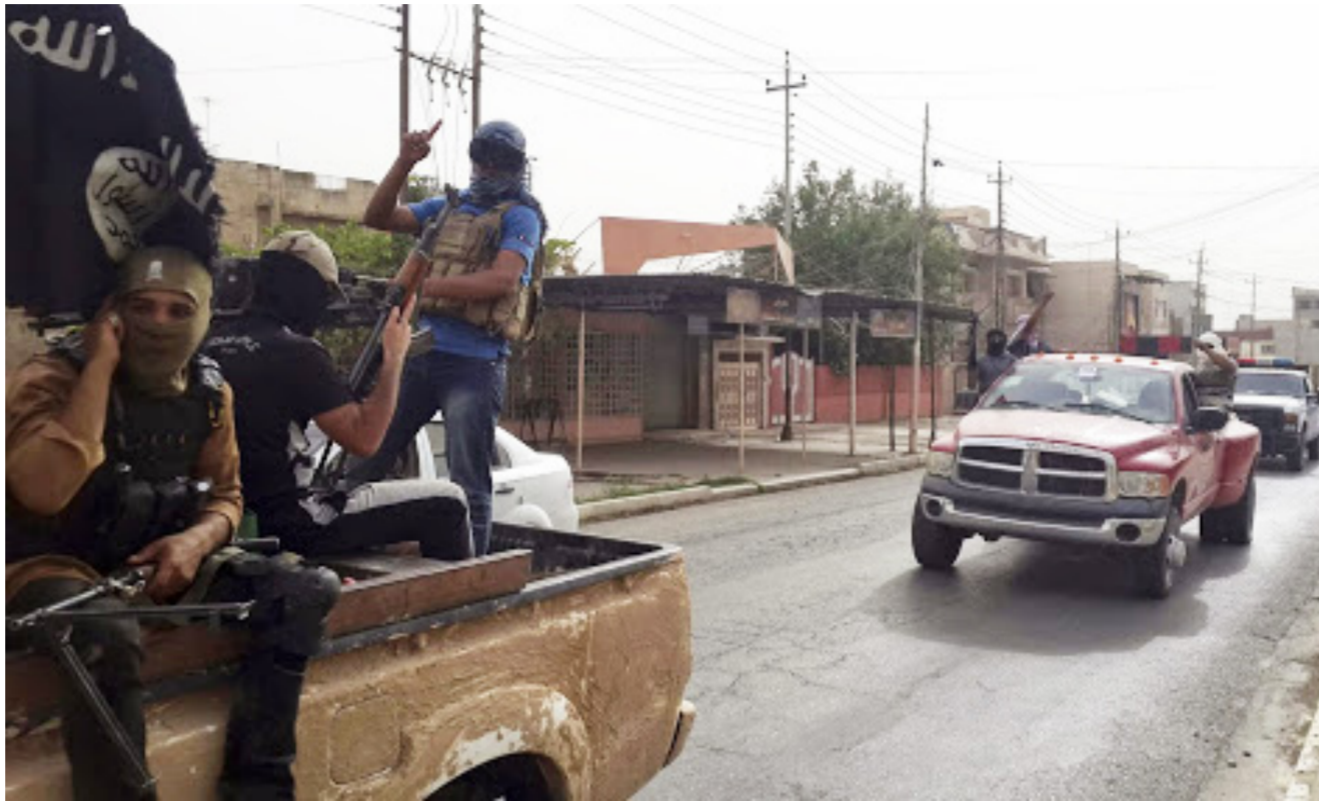
عنصر داعش في شوارع الموصل