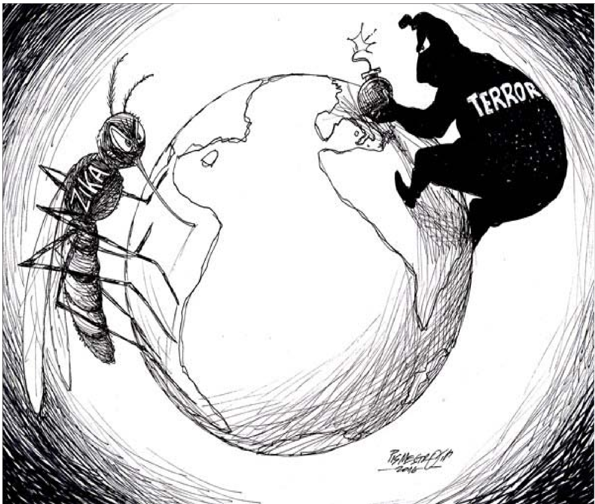
عن موقع «كارتون سياسي»