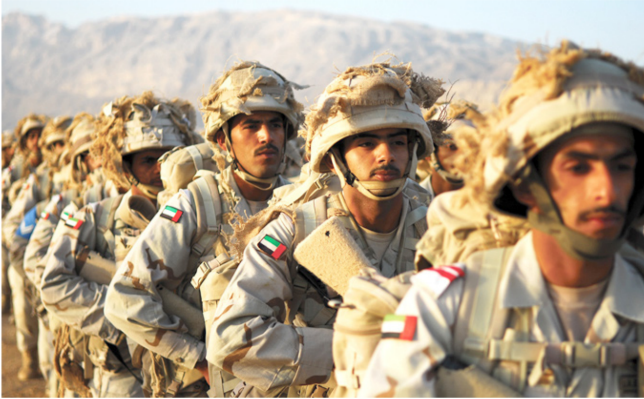
عناصر من الجيش الاماراتي

أن التدخل البري ضد «داعش» سيعجل بالتوصل إلى حل سياسي بين فصائل المعارضة ونظام الرئيس بشار الأسد وروسيا التي تستغل محاربة التنظيم المتطرف في الاستيلاء على مناطق استراتيجية في عودة تنظيم «داعش» إلى خفيق مكاسب في مناطق استراتيجية.