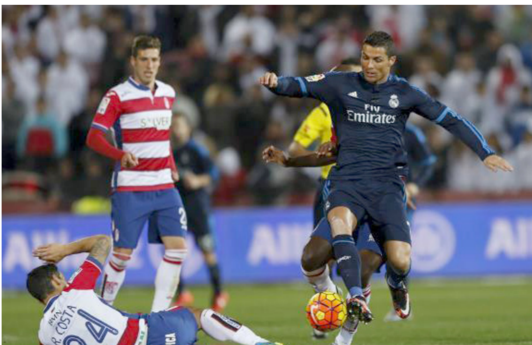
جانب من مباراة ريال مدريد وغرناطة

وتطرق زيزو للحديث عن إصابتي كارفخال ومارسيلو في المباراة. وقال «: كارفخال لا يعاني من أي شيء. مجرد إرهاق.. في المقابل فإن مارسيلو لا تدري بعد مدى خطورة الإصابة». وعاد زيزو للحديث عن مودريتش وقال «:ممتاز بالصدرة العالية على الاحتفاظ بالكرة. لهذا هو ميل للعب في المقدمة واليوم أثبت أن هذا يعود بالنفع على الفريق». وتابع «: علينا أن نعمل على تحسين الجانبين لكن الهجومية أيضا يحتاج للعمل ففي المواجهة مثل أنت تحتاج للتسجيل والتغلب على الصعوبات». واختتم زيزو مؤثره الصحفي بالتأكيد على أن الفريق جاهز لمواجهة روما في ذهاب دور ال16 من مسابقة دوري أبطال أوروبا من دون وجود أي مشكلات.