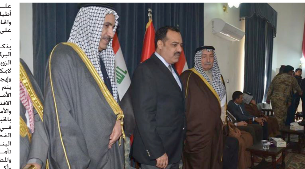
الزوبعي خلال حضوره مؤتمر عشائر الفرات الأوسط

بذكر أن رئيس هيئة النزاهة البرلمانية النائب طلال خضير الزوبعي أكد في وقت سابق انه لا يمكن القيام بأي تغيير حقيقي وإيجابي في المجتمع والدولة مالم يتم القضاء على الفساد وتقوية الاقتصاد وتشجيع القابليات والامكانيات الذاتية والاهتمام بالخبرات والأبداعات الوطنية وزجها في العمل والاستفادة من خبرات القطاع الخاص في عملية إعادة البناء .. وما يحقق الهدف وهو تأمين الحياة بتطلبتها المهمة والمطلوبة . وأكد الزوبعي أن تحقيق الإصلاحات التي يطالب بها الشعب مرتبطة