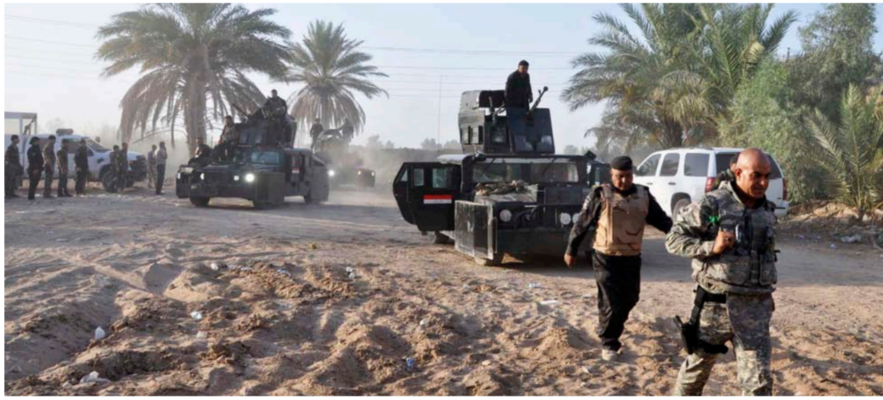
القوات الأمنية في الرمادي

الانبار تمكنت. من تحرير مركز منطقة جويبة شرق الرمادي من داعش". وأضاف الحلاوي أن "القوات الأمنية اشنت مع عناصر التنظيم الذين كانوا يتواجدون في المنطقة، وكانت مقاومتهم ضعيفة وقتل عدد منهم". مبيّناً أن "الكثير من الأسرى جرى إخلاؤها من المنطقة ونقلها إلى مركز الرمادي، في حين تواصل القوات الأمنية التقدم لتحرير ما تبقى من المنطقة". قبل ذلك، أعلن قائد العمليات الخاصة الثالثة التابعة لجهاز مكافحة الإرهاب اللواء الركن سامي العارضي أمس الأول أن القوات الأمنية أخلت 1250 مدني من منطقة جويبة شرق مدينة الرمادي منذ صباح السبت حتى الأحد.