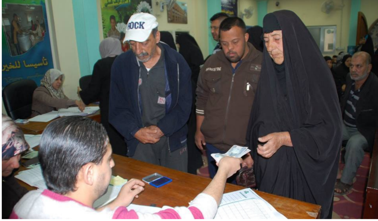
المستفيدون من إعانات الحماية الاجتماعية

المستفيدين في دور الدولة للايتام بلغ (452) مستفيداً. منهم (159) مستفيداً في بغداد وفي بقية المحافظات (293) مستفيداً. وفيما يخص عدد المسنين في دور رعاية المسنين في بغداد والمحافظات. ذكر المتحدث باسم الوزارة أن مجموعهم يبلغ (488) مستفيداً. حيث يبلغ عدد الرجال (194) مسناً والنساء يبلغ (294) مسنة. وعن أعداد الدور الأيوائية في بغداد والمحافظات قال منعم أن عدد دور الدولة للايتام يبلغ (22) داراً وللمسنين 10 دور ولشديد