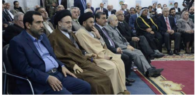
جانب من الحضور

جملة من المسائل التي تربط بالوقفين وجهودهما في بناء المصالح الاجتماعية وبناء دولة قانونية خالية من الفساد.