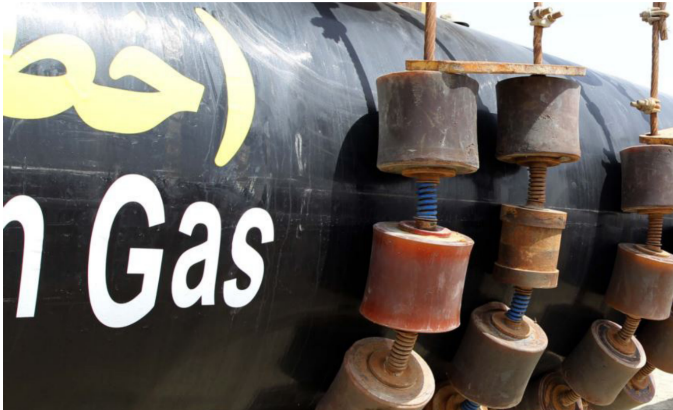
خط الغاز العراقي - الإيراني

بعدها إلى العاصمة بغداد ويتفرع إلى فرعين لإيصال الغاز لحطتي الصدر والقدس الغازيتين. من جانب آخر أكد وزير النفط عادل عبد المهدي أن العراق حريص على تعزيز العلاقات والتواصل مع شركة شل لبحث توسيع آفاق التعاون ومتابعة مشاريعها في تطوير الحقول النفطية.