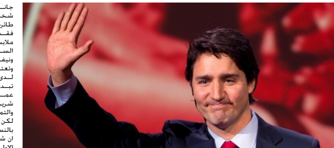
رئيس الوزراء الكندي