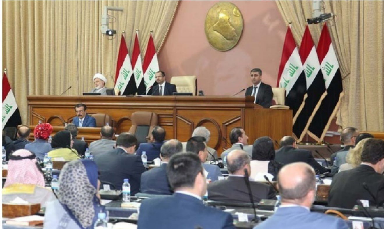
احدى جلسات مجلس النواب

الاستثناءات المتعلقة بالجرائم الخطيرة كالإرهاب، وأمن الدولة، وهدر المال العام، والاختلاس، والتزوير، وتهريب الآثار، مشيراً إلى أن «مشروع القانون سيطرح للنقاش خلال القراءة الثانية له، والتصويت سيكون متروكاً للكتل النيابية». يذكر إن رئيس البرلمان سليم الجبوري قد حد، في وقت سابق من الأسبوع الجاري موعداً آخرياً لحسم قانوني العفو العام والمحكمة الاتحادية.