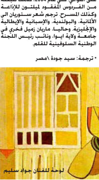
لوحة للفنان جواد سليم