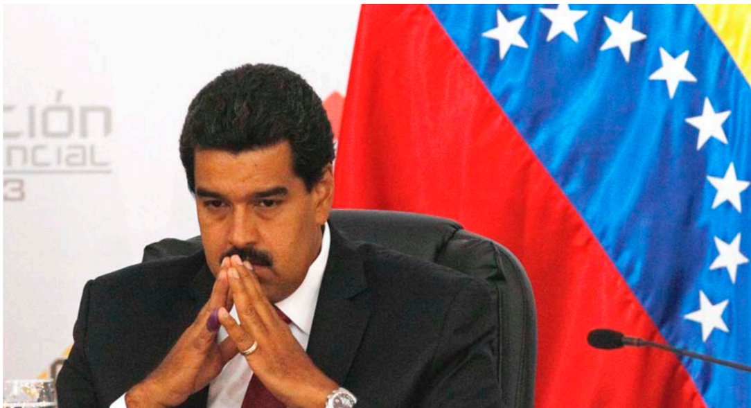
الرئيس الفنزويلي نيكولاس مادورو

وقفاً لصندوق النقد الدولي فإن المسؤولين لا يقومون على أكمل وجه، عندما يتكشأ الاقتصاد بنسبة 10% في عام، ثم يزداد انكماشاً بنسبة 6% أخرى في العام الذي يليه، وينفجر التضخم إلى 720%، ولا غرابة إذن في أن الأسواق تتوقع أن تختلف فنزويلا عن سداد ديونها في المستقبل القريب جداً، فالدولة