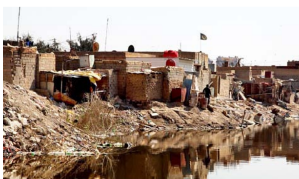
العشوائيات في بغداد

بغداد - الصباح الجديد: دعا قضاة، أمس السبت، الجهات المختصة إلى تنظيم مناطق العشوائيات في العاصمة بغداد بنحو سريع، فيما أكدوا أن عصابات السرقة والخطف تنشط بالأقضية الضيقة لهذه العشوائيات. وقال نائب رئيس استئناف الرصافة القاضي هاشم الحفاجي في بيان أوردته السلطة القضائية، ورد إلى "الصباح الجديد" إن "عصابات السرقة والخطف والمخدرات باتت تستغل أماكن معينة لتسهيل عملياتها وهي حالياً العشوائيات والمعروفة محلياً بالخواصم"، مشيراً إلى أن "هذه المناطق باتت مآوى للمجرمين والمسرقاتهم ومن الصعب الوصول إليهم من قبل الأجهزة الأمنية لانعدام التنظيم العمراني وضيق أزقتها". ودعا الحفاجي إلى "إيجاد حلول سريعة للعشوائيات من خلال تسجيل أسماء ساكنيها وجرّد أعدادهم والحصول على موافقات رسمية قبل السكن فيها كإجراء انقلاقي قبل إنهاء هذه الظاهرة".