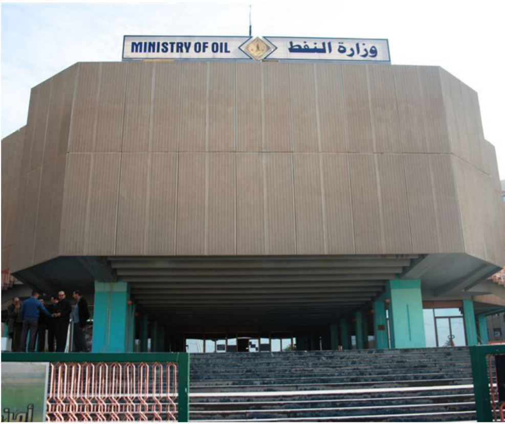
مبنى وزارة النفط

وقبل اندلاع الأزمة الأمنية بسبب اجتياح تنظيم داعش الارهابي مناطق عدة في شمال وغرب البلاد كانت الحكومة الاخابية تدبر الحقول النفطية في كركوك، لكن بعد ذلك بدأت وزارة الثروات الطبيعية في حكومة اقليم كردستان بالاشراف على انتاج النفط لا سيما في حقلي باي حسن وهافانا، لتتم ادارتهما من قبل حكومتي الاقليم والمركز سوية.