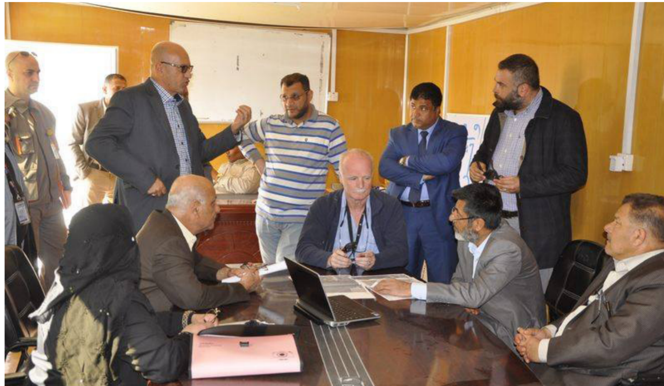
مدير عام الموانئ يلتقي إدارة شركة برتش بتروليوم البريطانية