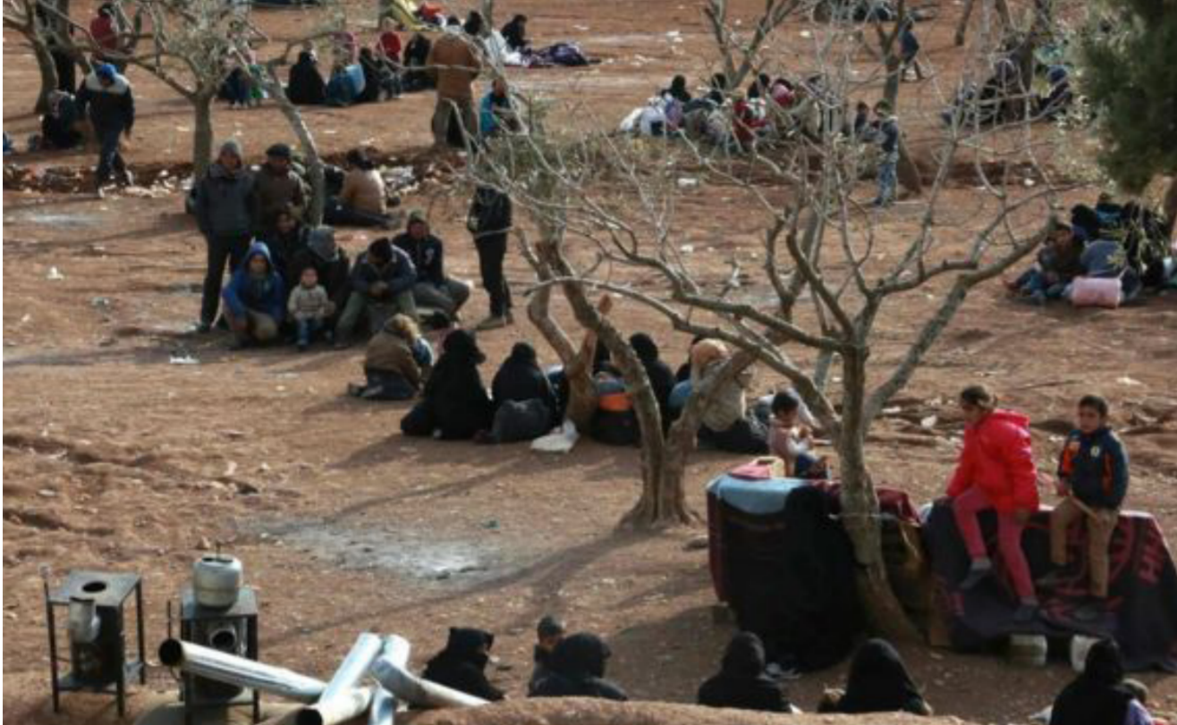
نزوح العائلات السورية الى تركيا بحسب لهجوم روسي على حلب