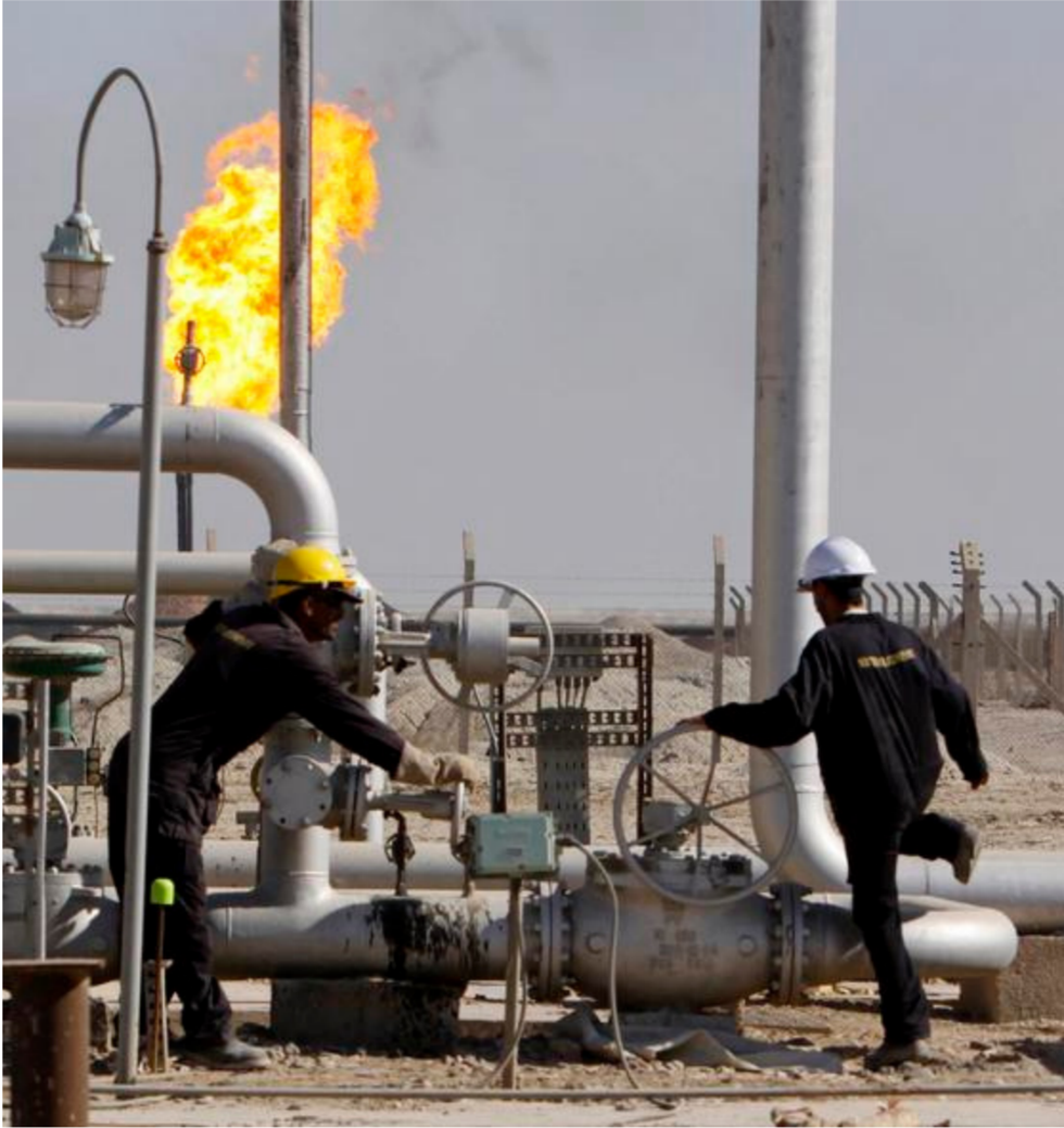
حقول نفطية عراقية

الآخادي، ولكن عدم توفر النفط أدى إلى مغادرة الناقلتين ميناء جيهان فارغتين. كذلك كانت هناك حمولة ثالثة تعود لشركة نيسيا الإسبانية، متعاقدة مع سومو أيضاً لتحميلها، واضطرت الشركة إلى إلغاء الشحنة بعد أن كان من المقرر تحميلها في أواخر حزيران، وذلك بسبب عدم كفاية النفط في خزانات سومو في جيهان، وأدى هذا الأمر ليس فقط إلى خسارة في المبيعات وإمّا مطالبات الشركتين أعلاه بالتعويض عن الأضرار، وستضطر سومو قانونياً