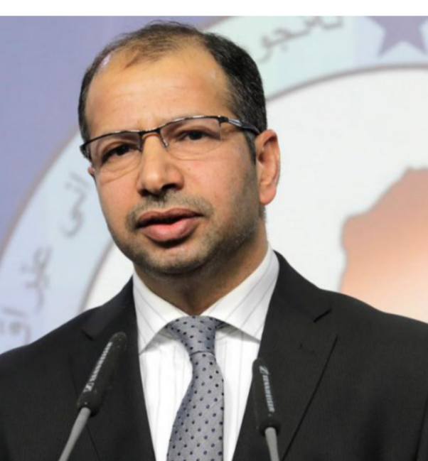
مؤتمر صحفي لسليم الجبوري "رشيّف"

أما بخصوص المحكمة الاتحادية، رد النائب عن اتحاد القوى أن "الکرد يصرون على اتخاذ القرارات داخل المحكمة بالاغلبية، لكن التوجه العام سيذهب بالاغلبية البسيطة (نصف +1)". وخلص الكربولي بالقول إن "الأوضاع العامة ماضية بتمرير القانونين ضمن السقف الزمني الأخير الذي وضعه الجبوري". يذكر أن قانوني المحكمة الاتحادية والعفو العام قد وردا ضمن وثيقة الاتفاق السياسي التي تشكلت بموجبها حكومة حيدر العبادي في أيلول من العام 2014.