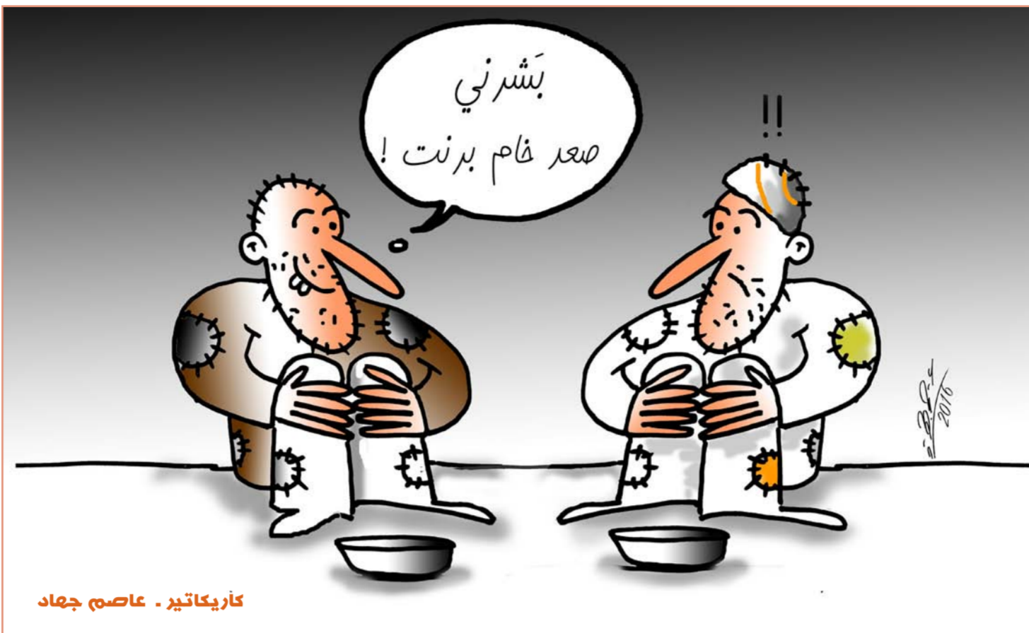
كاريماتير - عاصم جهاد

واشنطن - أ ف ب: توقف الشرطيون المكلفون السهر على أمن أعضاء الكونغرس الأمريكي عن استخدام منصة إطلاق النار التدريبية الجديدة القادمة تحت تلة الكابيتول، لأن الرصاص كان يرتد بأجسامهم كما ذكرت صحيفة «واشنطن بوست». وأوضحت الصحيفة الرئيسية في العاصمة الأمريكية ان حوادث عدة مثيرة للقلق وقعت منذ اعادة افتتاح القاعة القادمة تحت الارض بعد خديتها. وأصيب عنصر من هذه الوحدة الخاصة بجروح طفيفة في العين، فيما خدت زملاء له عن ارتداد الرصاص او شظايا عليهم. وقال ناطق باسم شرطة الكابيتول ان هذا الوضع عائد الى مشكلة «في التصميم» ما يستدعي فتح تحقيق ووحدة «يوناييتد ستايتس كابيتول بوليس» هي وكالة فيديرالية للشرطة مكلفة حماية الكونغرس الأمريكي في واشنطن وخصوصاً أعضاء مجلسه، ويفترض بأفراد هذه الشرطة التعرب بانتظام على إطلاق النار.