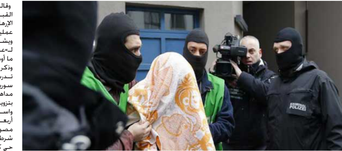
السلطات الألمانية تعتقل خلية جزائرية في برلين

وقالت المصادر إن أحد الذين القي القبض عليهم على صلة بالخلية الإرهابية في بلجيكا التي نفذت عمليات في باريس. ويشتمه بأن المطلوبين الأربعة أعدوا لهعمل خطير يهدد أمن الدولة». وفق ما أوضحت شرطة برلين في بيان لها. وذكر البيان أن أحد الرجلين الموقوفين تدرب على استخدام السلاح في سوريا. أما الرجل الثاني الذي أوقف في برلين. فيشتبه بأنه قام بتزوير وثائق. واستهدفت الداهمات في العاصمة أربعة شقق وموقعي عمل. وشاهد مصوروكالة فرانس برس للأنباء شرطين ملثمين يخرجون من مبنى في حي كرويتمسبرغ وهم يتقارون مشتبهها به أخفي وجهه. وكان المتحدث باسم الادعاء العام في ألمانيا قد كشف يوم الخميس الماضي عن إعتقال عناصر خلية إرهابية كانت تخطط للقيام بهجمات في العاصمة.