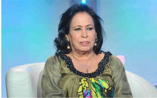
حياة الفهد تخوض سباق رمضان ببائعة النخي

السنوات الأخيرة الكثير من الشخصيات الحادة الايجابية. ما دفعها الى كسر التقليد المشهور عنها. والعودة بالجمهور الى ذكريات الاعمال التي قدمتها في السابق والتي كانت حُمل في طياتها كوميدياً الموقف". وفي سياق آخر تحدثت الفنانة حياة الفهد عن جديدها من الاعمال ومنها ما يخص شهر رمضان القادم. ومن تلك الاعمال مسلسل يحمل عنوان "بائعة النخي". حيث تم الانتهاء من بناء القرية التراثية الخاصة به. وسيتم المباشرة بتصوير مشاهدته الأولى في غضون