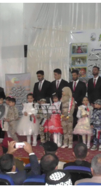
جانب من الاحتفالية

بمناطق الاحوار من نهري دجلة والفرات . مشيراً الى ان المساحات المغمورة حالياً من مناطق الاحوار لا تشكل سوى 35 بالمئة من المساحات التي كانت تشكل مناطق الاحوار قبل التجفيف .