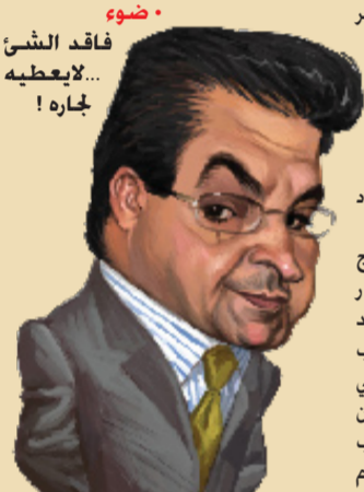
فأد الشئي... لابعطيه... جاره!

سان فرانسيسكو - أ ف ب: أعلنت خدمة "واتساب" للدرشة التابعة لمجموعة "فايسبوك" أنها تخطت عتبة بليون مستخدم. وقالت الخدمة في رسالة نشرتها على مدونتها الرسمية: "بات بليون شخص يستخدم واتساب. أي تقريباً شخص واحد من أصل سبعة في العالم يلجأ كل شهر إلى تطبيقنا للتواصل مع أقربائه وأصدقائه وعائلته". وقد ازداد عدد مستخدمي التطبيق أكثر من مرتين منذ أن استحوذت "فايس بوك" عليه بداية العام 2014. واعتبر شراء "واتساب" أكبر صفقة تبرمها شبكة التواصل الاجتماعي في تاريخها. وقدرت قيمتها عند إجازها في بداية تشرين الأول 2014 بأكثر من 20 بليون دولار. وأعلن مؤسس "فايس بوك" ومديرها