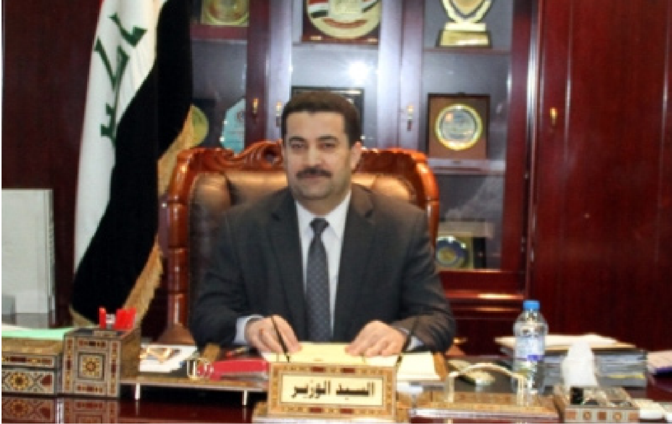
محمد شياع السوداني

منتجات عديدة ومتنوعة . مشيراً الى ان الوزارة عملت على ايجاد اسواق او منافذ لتصريف هذه المنتجات . فضلاً عن تنفيذ برامج تدريبية جديدة حسب المهن التي يحتاجها سوق العمل . وتابع السوداني ان الالية الجديدة في منح اعانة الحماية الاجتماعية لن تسمح بحصول الفئات الفقيرة كون العملية قائمة على الباحث الاجتماعي والزيارة الميدانية وكذلك نقاط محكمة البيانات وجميعها نقاط محكمة حول دون حدوث تجاوز على برنامج الحماية الاجتماعية .