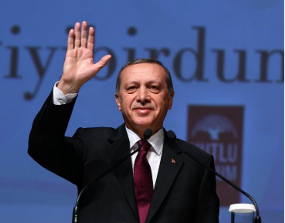
رجب طيب أردوغان

السياسات الموجهة نحو النمو لم تكن موجودة، وهذا التضخم ليست له أهداف، ولم يتم بعد استعمال كميات كبيرة من المدخرات في صناديق الثروات السيادية، صناديق التقاعد وشركات التأمين لصالح القطاع العام، ربما بسبب انسداد قنوات الوساطة المتعلقة بالمخاطر والحوافز