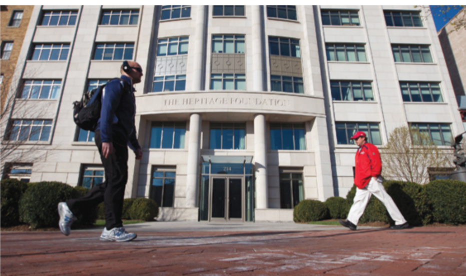
مبنى مؤسسة هيرتيج