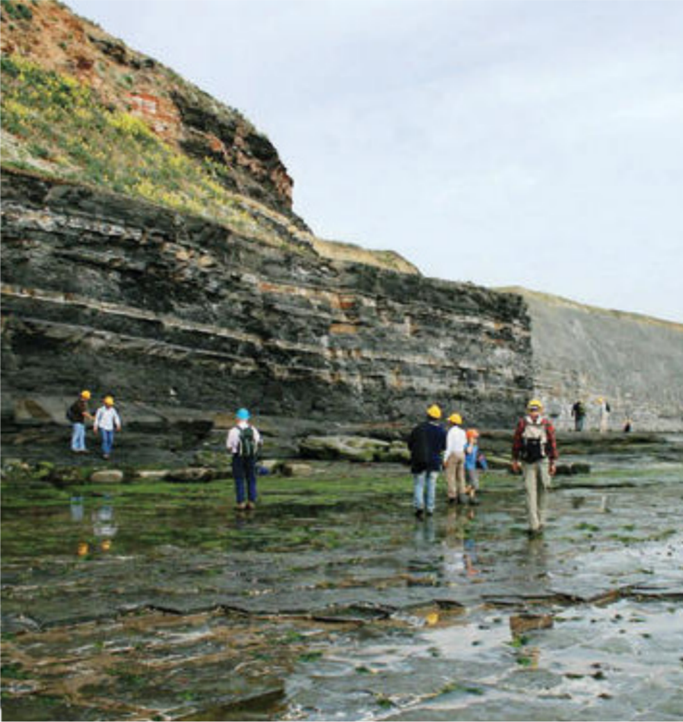
أحد أماكن النفط الصخري

2015 والصادر عن شركة DNO النرويجية بأنه تم توقيع عقد بين الشركة وحكومة الإقليم يسمح فيه للشركات بالمبيعات الداخلية للسوق المحلي!! علماً إن أساس التقرير أن معدل إنتاج حقل طاووكي لسنة 2014 كان قد بلغ نحو (91) ألف برميل يوميا. وتم تصريف نصفه للبيع الداخلي والنصف الآخر للتصدير. وهذا هو حال جميع الشركات العاملة