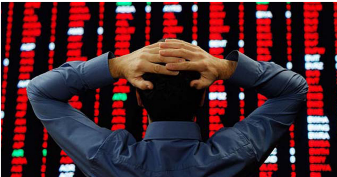
العالم مقبل على أزمة اقتصادية جديدة

النقد الدولي» أوليفيه بلانكاره الهبوط في أسعار الأسهم بـ«الخبر». ويقول إما أن يكون دلالة على خلل أعمق في الاقتصاد الدولي، أو عاصفة في فنجان لا تلبث أن تنقضي وترحل. ويعتقد بلانكاره أن في الإمكان أن تعاني الأسواق المالية، بفعول رجعي، توقف المال الرخيص الذي ضخه «مجلس الاحتياطي الفيدرالي» بموجب برنامج الإنعاش النقدي، وكذلك رفعة الفائدة للمرة الأولى منذ العام ٢٠٠٧. ويتراقق وقف أميركا ضخ المال الرخيص في الأسواق مع إعلان رئيس المصرف المركزي الأوروبي، ماريو دراغي، نيته وقف البرنامج الأوروبي في زيادة الكتلة النقدية من اليورو بسبب بقاء نسبة التضخم منخفضة جداً في عموم الاتحاد الأوروبي.