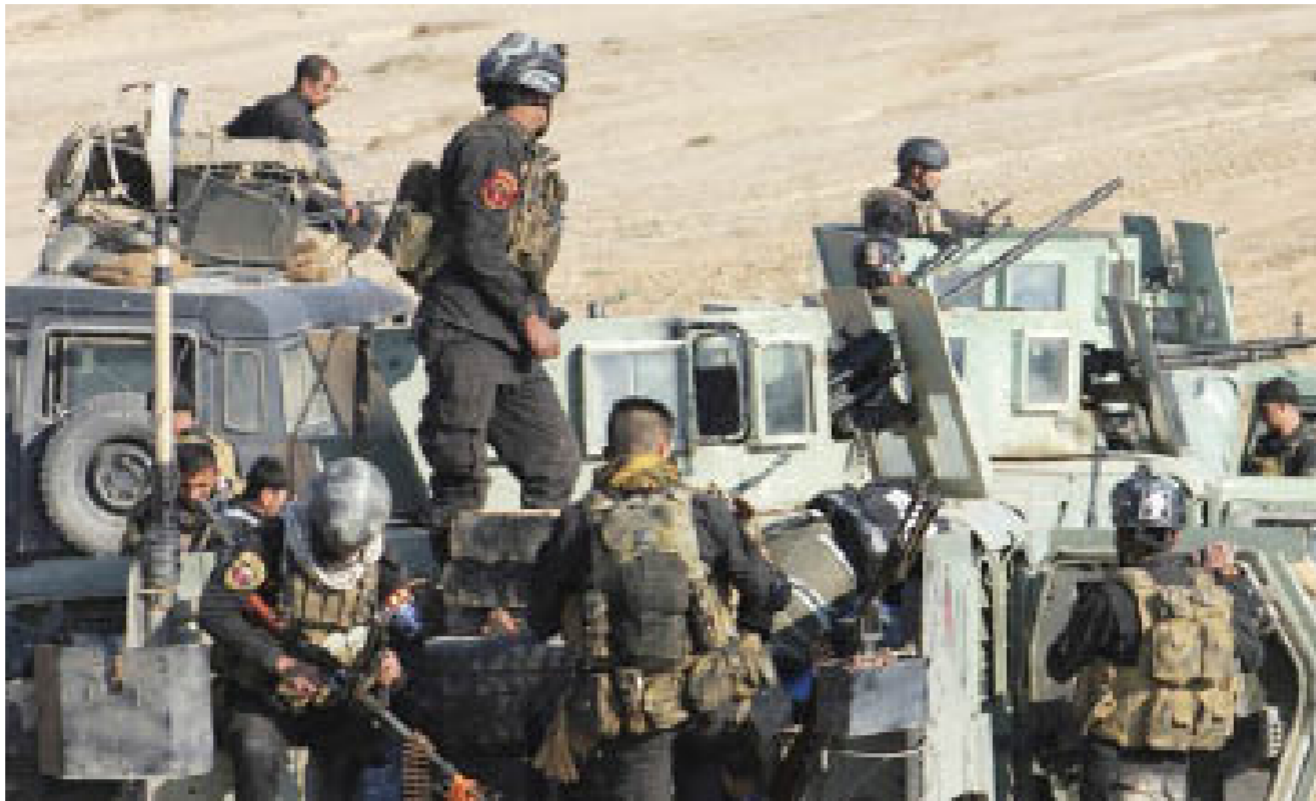
القوات الأمنية العراقية