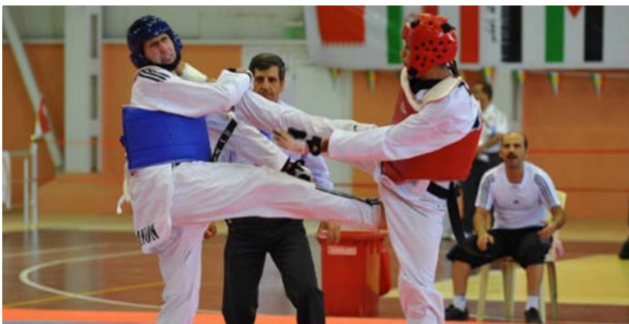
لقطة من منافسات التايكواندو «ارشيف»