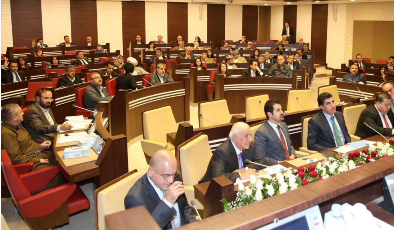
طالبت خمس كتل في برلمان الاقليم باعادة اموال الشعب المسروقة

بوضوح الى وجود مبالغ طائلة من واردات وثروات الاقليم مكدسة في بنوك الخارج. وأشارت هذه الكتل في بيانها الى انها ستبتدل مساعيها لانهاء ظاهرة الفساد المستشرية في مؤسسات الاقليم. واحتكار بعض الاحزاب لواردات الاقليم. بهدف احتواء الازمة الاقتصادية التي انقلت كامل المواطنين وادت الى تأخر رواتب الموظفين للاشهر الخمسة الماضية. مطالبة هيئة النزاهة والادعاء العام بتحرية ملف الفساد في الاقليم. ومتابعة اخفاء اموال النفط واعادتها لانتقاد شعب كردستان من ازمتته المالية الخانقة.