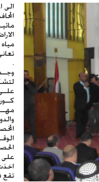
جانب من الاحتفالية

الى اعتماد العدالة في توزيعها بين المحافظات وبما يضمن توفير حصة كافية لمناطق الاحوار وارواء الاراضي الزراعية المتاخمة لها وتوفير مياه الشرب للمدن الاحوارية التي تعاني من الشحة ورداءة نوعية المياه العراقية وغرفة تجارة الناصرية .