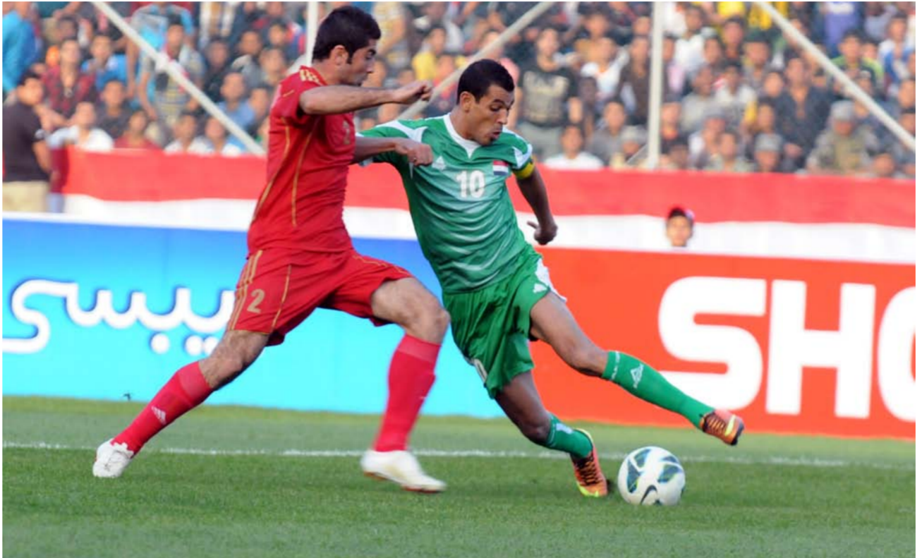
جانب من لقاء سابق بين العراق وسوريا

اعتقاد خاطئ: كل منتخبات العالم تتطور بسرعة كبيرة إلا نحن في العراق في فترات سابقة كنا تغلب بسهولة على مثل هذه المنتخبات لكن الآن لم يعد الأمر سهلاً. الفارق الفنية باتت قليلة للغاية. كما ان هذه الدول تملك مسابقات محلية على مستوى متميز. والأمر بالتأكيد سيزداد صعوبة حين تواجه منتخبات مثل اليابان وكوريا الجنوبية وأستراليا.