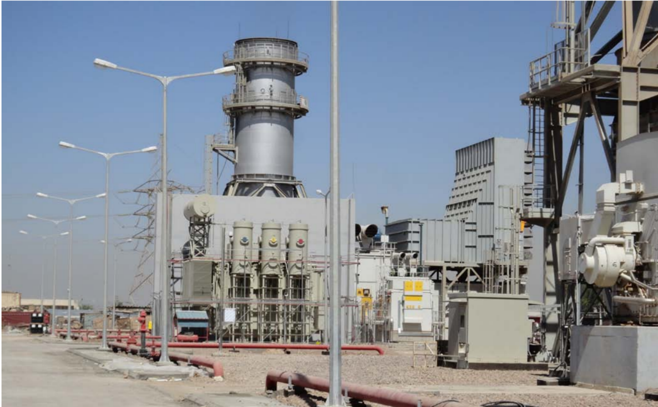
إحدى محطات إنتاج الطاقة الكهربائية في العراق