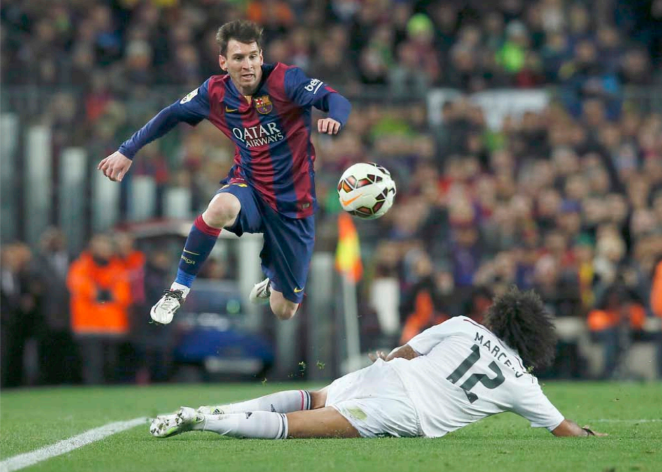
ميسي في مباراة سابقة

وزينت صورته وهو يطارد الكرة وسط الثلوج، الصفحة الرئيسية للموقع الرسمي للاخاد الأفغاني لكرة القدم الذي قام بدوره بمخاطبة الاخاد الأوروبي للعبة ونادي برشلونة الذي يلعب له ميسي. ووفقاً للصفحة الرسمية للاخاد الأفغاني على (فيسبوك)، سيتم اتخاذ القرار خلال الأيام المقبلة حول ما إذا كان سيتم إجراء مقابلة بين اللاعب ومشجعه الصغير في أي مكان سيصدق هذا اللقاء.. وسافر مرضى بقميصه المشهور مع عائلته من مدينتهم غزنة بالمنطقة الشراعية إلى