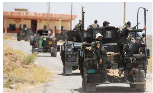
قوات مكافحة الإرهاب في الأنبار

بغداد - مشرق ريسان: استكمالا لعمليات تحرير مدينة الرمادي مركز محافظة الأنبار الغربية، شرعت القوات المسلحة المشتركة، أخيراً، بتنفيذ عملية عسكرية لتحرير منطقة السجارية شرق الرمادي من سيطرة مسلحي تنظيم داعش الإرهابي. تأتي العملية بعد وصول التعزيزات واستكمال الخطط العسكرية الخاصة بتحرير محور الرمادي الشرقي.