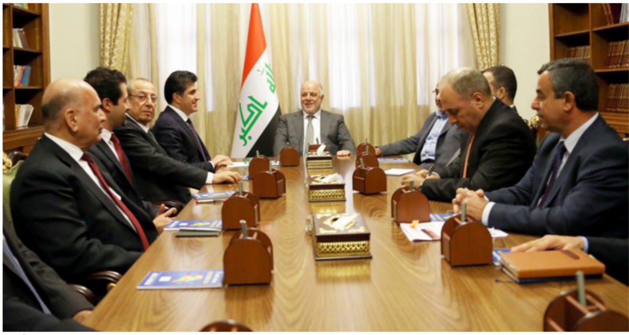
جانب من لقاء وفد الإقليم بالحكومة الاتحادية

رواتب موظفي الإقليم، المخارة منذ خمسة أشهر. تنمية 3