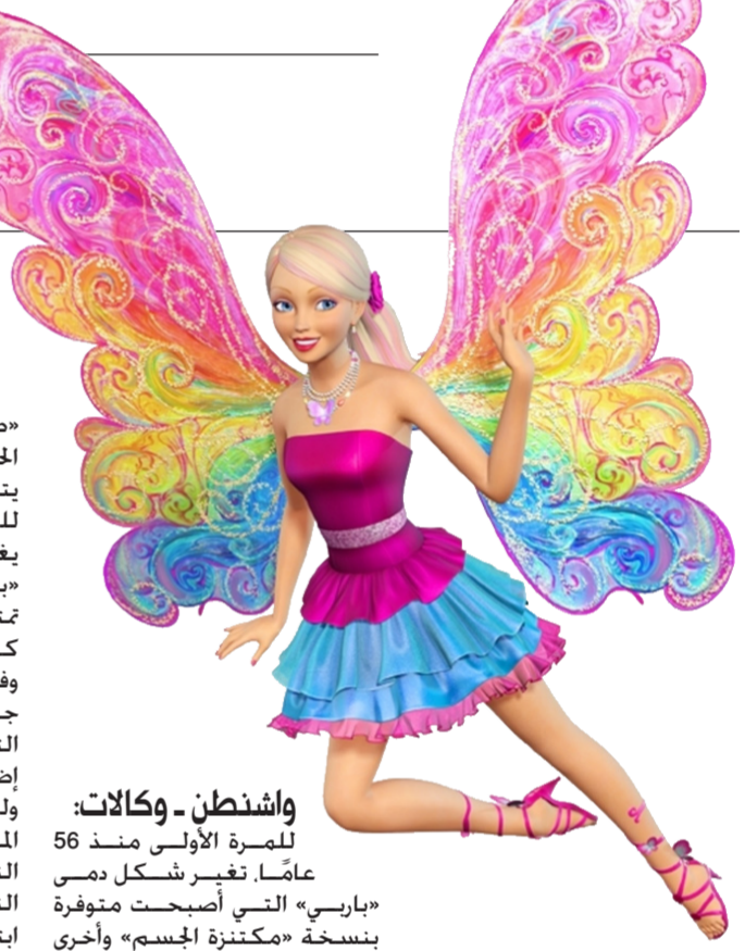
واشنطن - وكالات: للمرة الأولى منذ 56 عاماً، تغير شكل دمي «باربي» التي أصبحت متوفرة بنسخة «مكتنزة الجسم» وأخرى

«طوبلة القامة» وثالثة «صغيرة الحجم». في ما بعد خطوة ثورية يتخذها مصنع الألعاب «ماتل» للحد من تراجع مبيعاته. ولم يغير في السابق شكل جسم «باربي» منذ إطلاقها ولطالما تمتعت بمواصفات مثالية بعيدة كل البعد عن الواقع. وفتحت مجموعة «ماتل» صفحة جديدة مع مجموعة الدمى هذه التي تشمل ثلاثة نماذج جديدة إضافة إلى النموذج الأصلي. ولعل الدمية «المكتنزة الجسم» المعروفة بـ«باربي كورفي» هي النموذج الأكثر تعاضداً مع النسخة الأصلية للدمية التي ابتكرتها الأميركية روث هاندلر