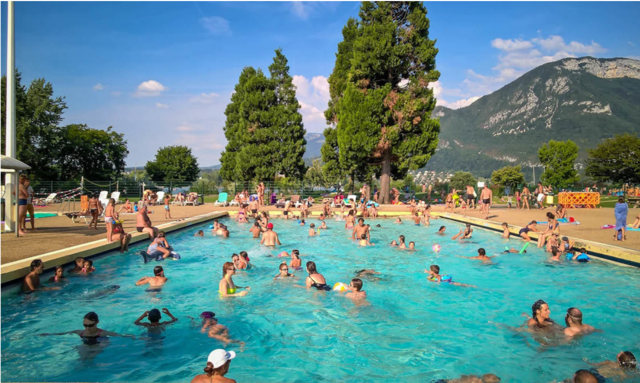
أحد المساح في أوروبا

واستقبلت البلدة مؤخراً 300 من طالبى اللجوء. وقال «في الوقت ذاته سنعلمهم (المهاجرين) أسلوب حياتنا ونشرح قواعد استعمال حمامات السباحة» مضيفاً أن الحظر لن يسري على الأطفال وأمهاتهم. لكن وزير الدولة البلجيكي للهجرة نيو فرانكين نصح بعدم اتخاذ مثل هذه الخطوة. وقال في تغريدة «ليس من الحكمة معاقبة مجموعة بأكملها بسبب تجاوزات فئة. طالبو اللجوء يعيشون في مراكز مفتوحة وهم أحرار في الذهاب للاستحمام. لكن من دون استعمال الأيدي». وحظرت مدينة بورنهام الألمانية الواقعة على بعد 30 كيلومتراً إلى الجنوب من كولونيا دخول طالبى اللجوء من الذكور إلى حمامات السباحة بنحو مؤقت هذا الشهر بعد تلقي شكوى من خريشات جنسية. وقدمت أكثر من 600 امرأة في كولونيا ومدن أخرى شكوى وتراوحت بين خريشات جنسية وسرقات أثناء اعتداءات ليلة رأس السنة الميلادية. وقالت الشرطة إن المحققين ركزوا على مهاجرين غير شرعيين من شمال أفريقيا وطالبى اللجوء.