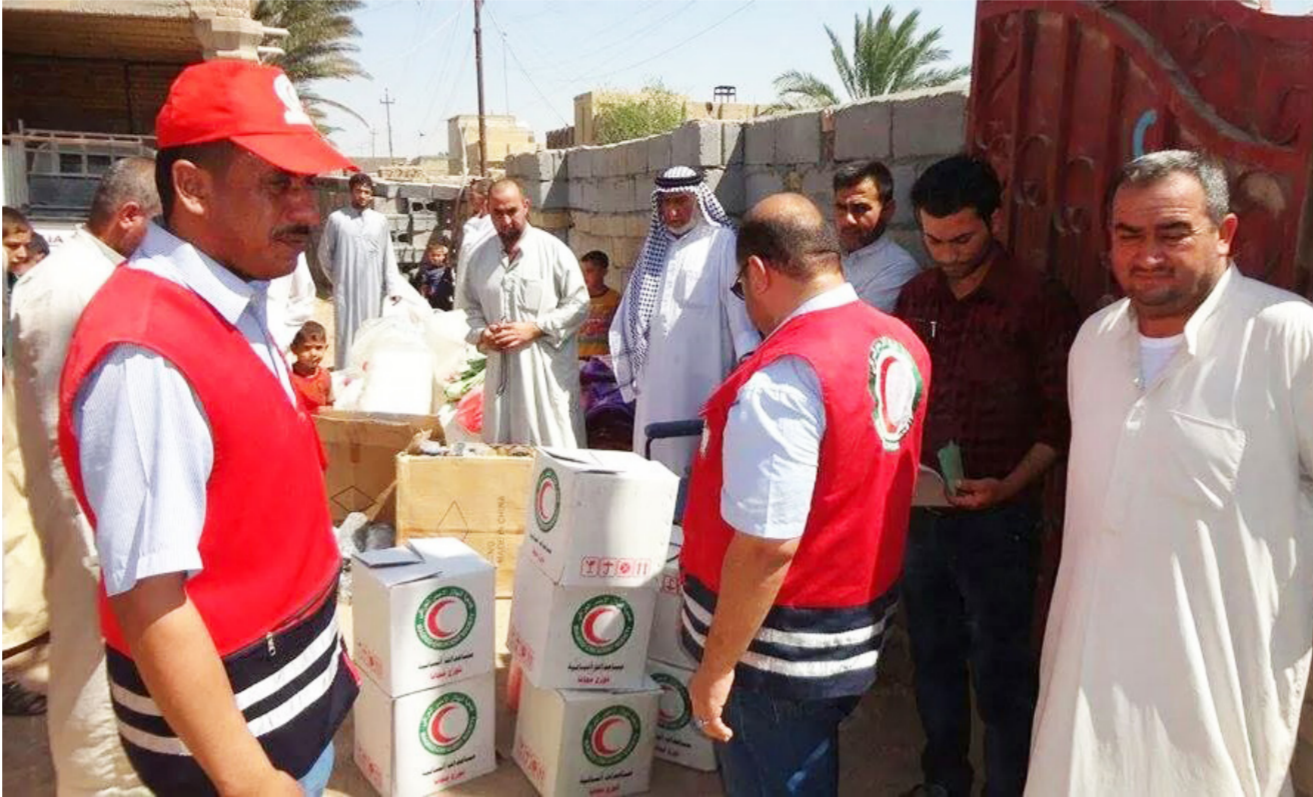
الهلال الأحمر يوزع مساعدات إنسانية

من النازحين العراقيين واللاجئين السوريين. ويرى أن المشكلة الأخرى هي أن الحرب ما زالت مستمرة، وبالتالي فإن هناك المزيد من النازحين يجب الاستعداد لتلبية احتياجاتهم. وخاصة الفلوجة والنجف والموصل. ولدى سؤاله عن استعدادات المنظمة لمواجهة الظروف القاسية في الشتاء، أكد جيد في تصريح صحفي، أنه تم توزيع ثلثي المواد الشتوية على النازحين وتوفير مواد التدفئة، مشيراً إلى أن عملية التوزيع بدأت في تشرين الثاني الماضي وتنتهي في شباط المقبل.