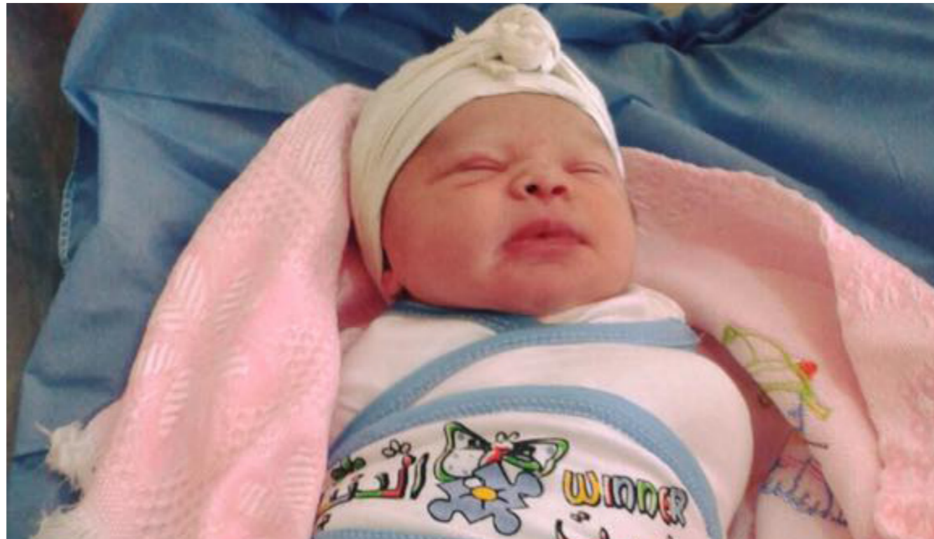
المولودة وهي بصحة جيدة