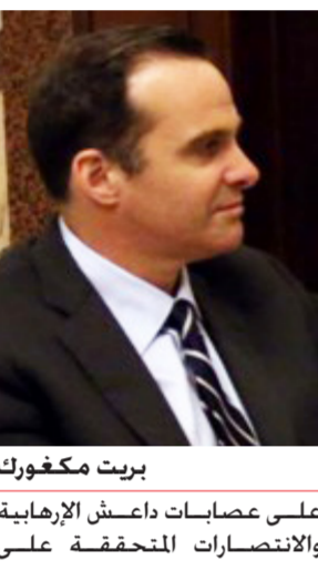
بريت مكغورك على عصابات داعش الإرهابية والانتصارات المحققة على

العراقية". العرو وتسلح وتدريب القوات من جانبه، أكد مكغورك وفقاً للبيان، "دعم بلاده للعراق في حربه ضد الإرهاب والتحديات التي يتعرض لها في مختلف القطاعات وسيادة العراق ووحدة أراضيه". وتبشر محاولات "داعش" لفرض سيطرته على سوريا والعراق قلق المجتمع الدولي، إذ أعربت دول عدة من بينها عربية وأجنبية عن قلقها حيال محاولات التنظيم هذه، كما نفذ التحالف الدولي بقيادة واشنطن ضربات جوية ضد مواقع التنظيم بمناطق متفرقة من البلدين.