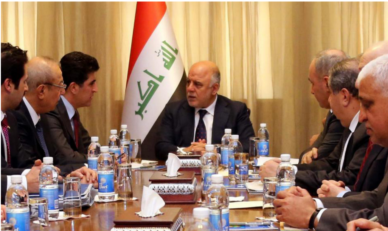
اجتماع سابق بين الحكومة المحلية وحكومة الإقليم