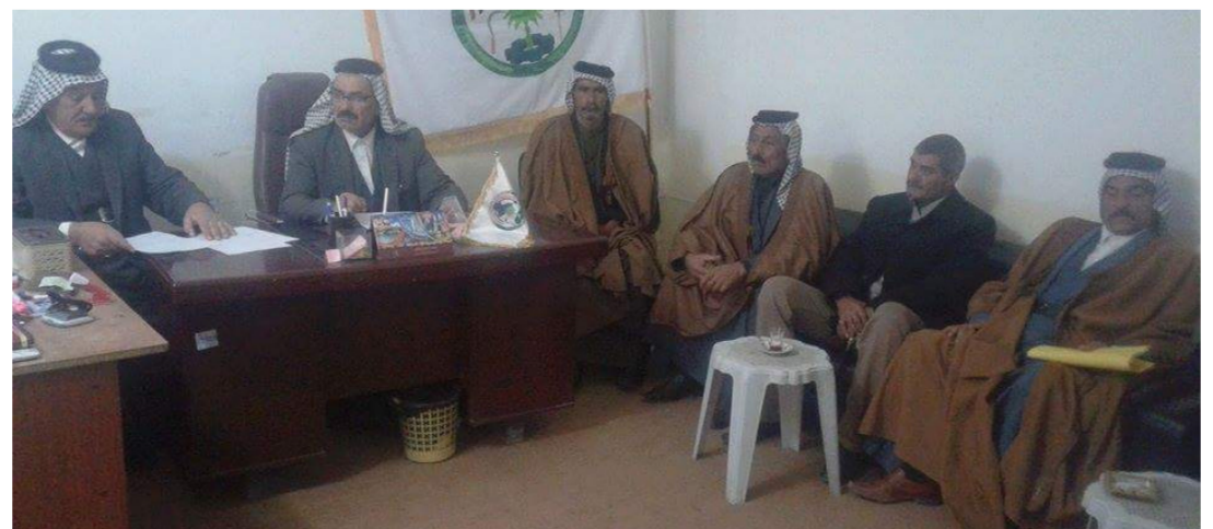
الفلاحين في الكوت