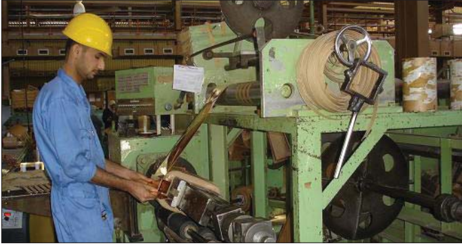
جانين من أحد مصانع الشركة

المشاريع الصناعية المستقبلية في جميع محافظات العراق الشمالية والوسطى والجنوبية. وقد تم تطوير هذه البادرة في محافظة السليمانية لئلا تعانيه من مجاعة عالية كخلايا في العراق الصناعي الذي وارتفع نسب البطالة فيها بلثلها محافظة التي يسكنها ثلثي من سكان البلاد. وبعد معالجة البطالة وتبني سياسة النمو الاقتصادي فيما تبنت المرحلة الثالثة من البادرة في محافظة واسط