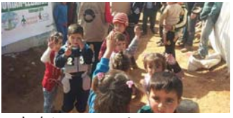
مجموعة من الاطفال النازحين في أحد احياءات

البراسي الجديد. وبين موقع ان وزارة العمل تديره على شبكة التواصل الاجتماعي انها تعمل بالتسويق لاطفال النازحين بالتطلّبات المدرسية المناسبة حلول العام الدراسي الجديد. وقال ان التجميع تأسس من قِبَل اعمار منهم ان الوزارة مستفوز تجهيز الاطفال النازحين دار ابراهيم الوزيرة التابعة لدائرة رعاية ذوي الاحتياجات الخاصة بالمستلزمات المدرسية من ملابس