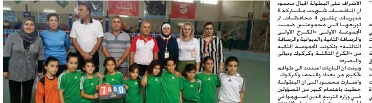
مواهب واعدة افرزتها المنافسات

خُتت بحرا نحو الاندماج انطلقت فعاليات المرحلة الثانية لبطولة الفرق الشعبية في مدينة شباب ورياضة كركوك حيث ناقش مدير