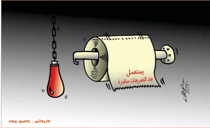
كاريناكثير - عاصم جهاد