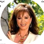
جاكي كولينز التي توفيت بسرطان الثدي اليوم.

لوس انجلس - رويترز: توفيت في لوس انجلس الروائية البريطانية "الرد جاكى كولينز" السبت نائيف زاري وريدة إخراج سفوان مصطفي وعمو إنتاج شركة "لاك تو أمير" لصدرت في 77 عاماً. وقالت أسرة الروائية الراحلة "في بيان" نعني ببالغ الحزن أننا "قد أسقطنا الجميلة الطيبة جاكى كولينز التي توفيت بسرطان الثدي اليوم". وأسقطت ما يزيد على 600 نسخة من أعمالها في 40 دولة. وأصبحت واحدة من أصحاب الروايات الأكثر مبيعا وفقاً لثقافة "نيويورك تايمز". وحسب نقاش فإن من ضمن أفضل رواياتها "هولوبود" و"إفرا" و"الدي بوس" وهي أعمال تلفزيونية. وواجهت