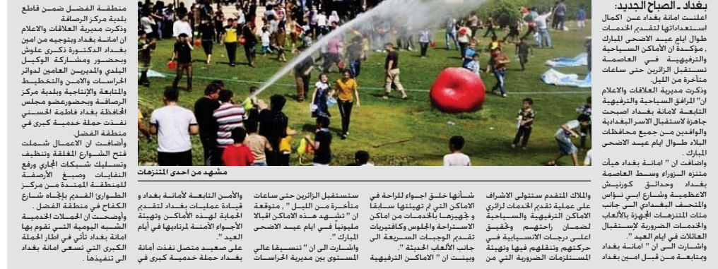
مشهد من إحدى المنزهات