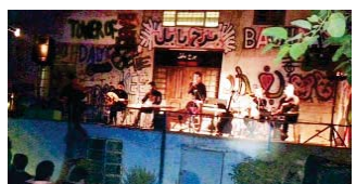
مجموعة أعضاء الفرقة عمر

ونقل الإصرار الوطني العراقي على الضي نحو الحياة برغم الحرب على التطرف والأرهاب. واضاعت سرسرم. تبع المعرض أقيم بالتعاون مع نقابة الموسيقيين قدم من فرق سولو بغداد التي تأسست سنة 2013. وصف الفرقة أعضاء الغنائي التراثية الموسيقي الخاصة للفرقة بطرحه الشمسية فجّج بين الماضي والحاضر ومجموعة أعضاء الفرقة عمر