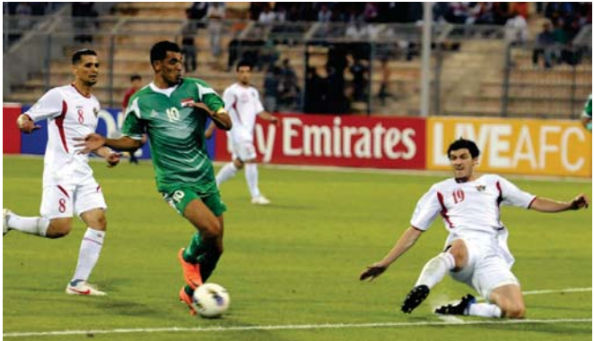
جانب من لقاء سابق للوطنية الجوية أمام الأردن