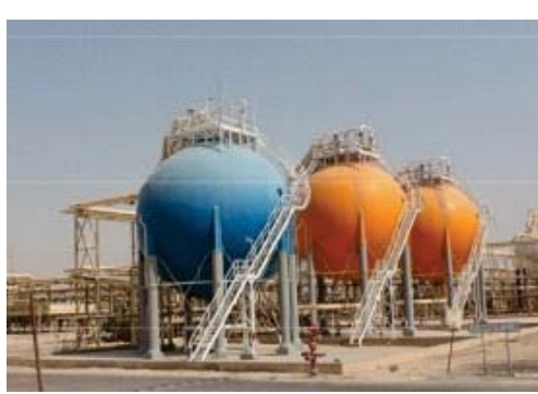
جانب من مواقع شركة غاز البصرة في خور الزبير