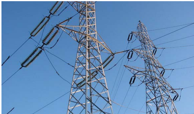
خطوط نقل الطاقة الإيرانية استهدفت أكثر من 7 مرات خلال المئة الماضية