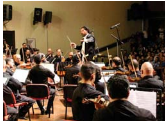
جانب من الحفل

عازفين. وهذه خطوة كبيرة وجارة في تاريخ هذه الفرقة "السمفونية قاعة الفرقة" وقال مساعدا قائد الفرقة السمفونية علي الخصاف إن "ما تقدمه الفرقة والأصمعة من غاية الروعة واللغة والاصمعة من العنصر الذي يعد من اصعب العمل الذي يكتسب في الفن التاسع عشر للولف الأتاني ليوهانس براهم". وأكد الخصاف إن "الفرقة السمفونية مهما عملت من خلال الخلال لا يمكن أن تصل إلى الكبر من الفن الأمريكي عازف في ونيو هامبشير وكذلك في ألمانيا والنمسا والسويد وإيطاليا وفرنسا ومصر.