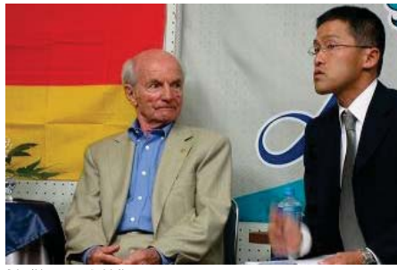
اليابان تمنى نفسها برحيل كرامير

بالقول: «أسرة كرة القدم اليابانية حزينة على رحيل أب الكرة اليابانية ألكسندر كرايمر الذي تعلمنا منه الكثير». والنادي الذي تعلمنا منه الكثير. وأخذت كرايمر يابني بوكالة كيودو عن أيام تواجده الرجل كرامير في اليابان بالقول: «مخيمر أول مدرب أجني يابني لليابان في تلك الفترة كان منتخب اليابان من أضعف المنتخبات في قارة آسيا تلك الظهور. لم نتمكن من زرع ثقافة الفوز والكفاح في عقول يابينا. لتثورات الأجيال المتعاقبة هذه الثقافة. الآن نقول بأعلى صوتنا نشكر لآل الذي جعل كرتها تسير في الطريق الصحيح». بتكر أن منتخب اليابان تأهل إلى كأس العالم. خمسة مرات متتالية بدأت من عام 1998 بفرنسا. في حين نجح منتخب اليابان الأولي في الوصول إلى الدورات الألفية الصيفية تسعة مرات. وصل خلالها دور الأربعة مرتين عامي 1998 بكسيكو و2012 ببرلين البرطانية. من جهة أخرى. صدر حديثاً من دار