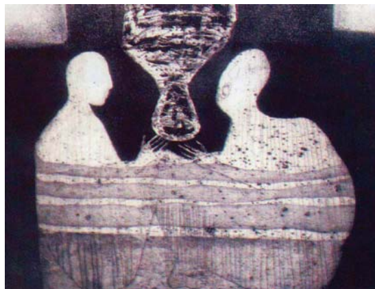
لوحة للفنانة نوال سعدون

صار دأب الباحثين في نوع العلاقة بين السياسي والثقافي مسكونا بهاجس يؤطره متبني القطيعة والتآمر ويأخذ طابع الجمود والتصلب، من دون المكوث والتحقق والجرأة والقراءة الموضوعية التي تكشف عن جوهر هذه العلاقة وتبحث نقاط التلاقي والاختلاف