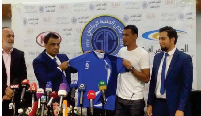
السفاح يعرض قميص الطلبة في المؤتمر الصحفي أمس "عصمة الصباح الجديد"