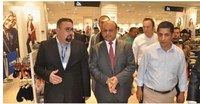
رئيس مجلس محافظة البصرة خلال جولته في مشروع بصرة تايمز سكوير عند افتتاحه