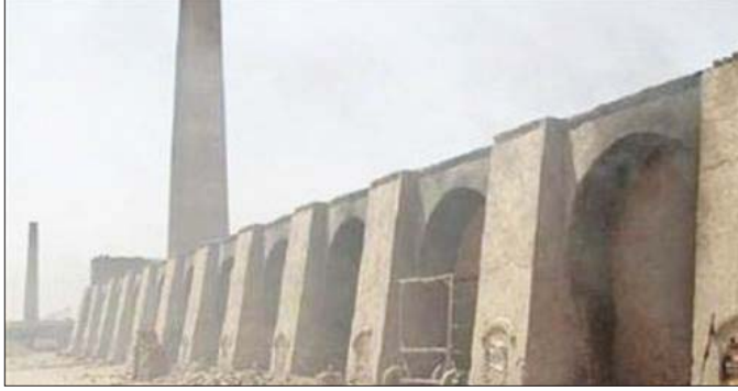
معمل لانحاح الطابوق