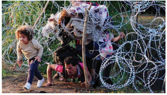
الأطفال الشائكة تم فتح المهاجرين من العصور

وكتفت الشرطة وجودها في القدس وهي نقطة تفتيش رئيسية بين القدس ورام الله وأصبحت نقطة سابعة تشهد مظاهرات تدلح بين الشنجان عندما من لا يخرج بين الشنجان الفلسطينيين والقوات الإسرائيلية. وفي القدس الشرقية قال المتحدث باسم الشرطة إن حالة التحذير للبلدية تعرضت للرشق بالحجارة سار الجلسات على الفرار. وعندما وصلت الشرطة إلى المكان كانت البيران قد نشبت بالحافلة.