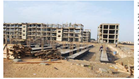
في زيارة الوزير احمد حيدر العبادي لاطرافهم ان خصوصاً مجموعة كي يلتقي بهم مباشرة المتظاهرين والى ساعة اعداد

التقرير ما زال الوجود يتحاور مع رئيس الوزراء العراقي. وتعد هذه الخطوة بمرحلة جديدة في اسلوب التطورات التي انطلقت منذ اسبوعها والتمس والتي لم تشهد خاور مباشر مع شخصيات كبيرة في الحكومة مثل رئيس الوزراء.