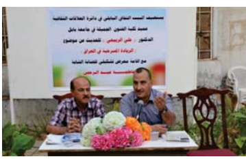
جانب من الجلسة

لاستنتج بعدما ان هذه التصوص خصمت بختم حسا حيش، وأنه الموصول معرجا إلى معلومة مهمة من المسرح العراقي يعود تاريخه إلى 4000 سنة تقريبا. واستلمت المحاضرة على مداخلات والسئلة وأجوبة دارت بين الضيف والخوصر من مسرحيين وباحثين وأساتذة جامعيين.