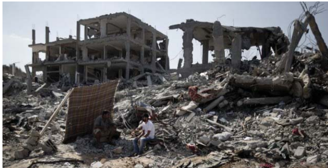
الحرب الذي خلفه القتال في سوريا

العسكري للحكومة السورية. داعياً إلى التصامم دول أخرى إلى روسيا وإرسال دعم عسكري تقني إلى سوريا. وتقول موسكو إنها ستعطي لمضيق معدات عسكرية موجهة لقتال «داعش». تنظيم «الدولة الإسلامية». وحتى أقتل 240 ألف شخص على الأقل واضطر ملايين الآخرون للفرار عن بلادهم جراء الحرب العائرة بين قوات الحكومة السورية وجماعات المعارضة المسلحة العديدة.