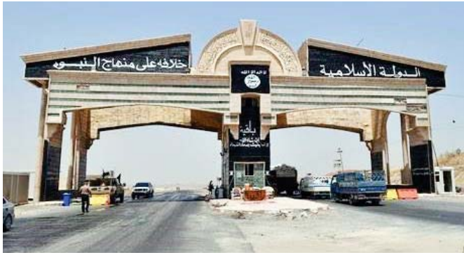
مدخل محافظة نينوى