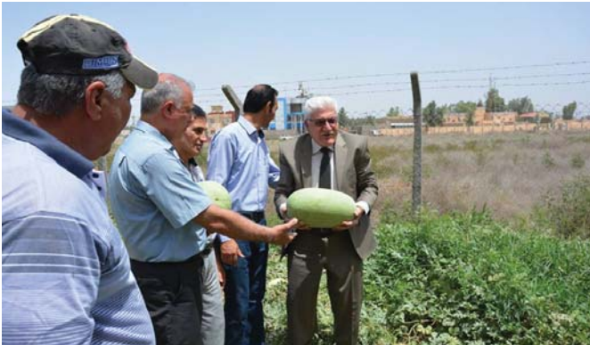
الرقى المطعم في ديالى