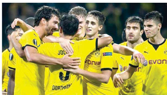
فرحة لاعبي دورتموند بالفوز