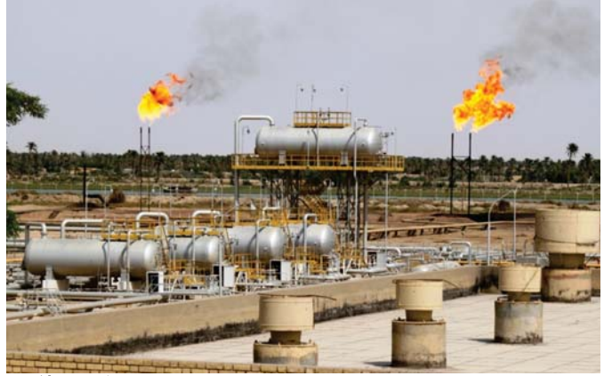
امد الحقول النفطية في البلاد

وارتفع سعر خام برنت 26 سنتاً إلى 48.63 دولار لبرميل بعدما هبط في الاثنين السابقين. هبطت أسعار النفط في السوق العالمية بعد أن أعلنت منظمة أوبك عن خفض الإنتاج في 2017. وقالت منظمة أوبك إن الإنتاج العالمي للنفط سيبلغ 95.5 مليون برميل يومياً بحلول 2020. وأضافت أن الطلب العالمي على النفط سيبلغ 110 مليون برميل يومياً بحلول 2020. وأشارت إلى أن الطلب سيظل يتجاوز العرض حتى عام 2025. وقالت إن الطلب سيبلغ 115 مليون برميل يومياً بحلول 2030. وأشارت إلى أن الطلب سيظل يتجاوز العرض حتى عام 2040. وقالت إن الطلب سيبلغ 120 مليون برميل يومياً بحلول 2050. وأشارت إلى أن الطلب سيظل يتجاوز العرض حتى عام 2060. وقالت إن الطلب سيبلغ 125 مليون برميل يومياً بحلول 2070. وأشارت إلى أن الطلب سيظل يتجاوز العرض حتى عام 2080. وقالت إن الطلب سيبلغ 130 مليون برميل يومياً بحلول 2090. وأشارت إلى أن الطلب سيظل يتجاوز العرض حتى عام 2100.