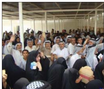
مراجعي الحماية الاجتماعية ضمن مسندو خط الفقر الذي حددته وزارة التخطيط وبموجبه يتم الاستهداف . وبين ان الجزء الاكسر على عاتق الوزارة في مجال الحماية

بغداد - زينب الحسني: أعلن وزير العمل والشؤون الاجتماعية المهندس محمد شجاع السوداني ان الوزارة بدأت بإصلاح نظام الحماية الاجتماعية لخدمة العائلات الفقيرة والضعيفة. وقال السوداني ان الوزارة بدأت بإصلاح نظام الحماية الاجتماعية لخدمة العائلات الفقيرة والضعيفة. وقال السوداني ان الوزارة بدأت بإصلاح نظام الحماية الاجتماعية لخدمة العائلات الفقيرة والضعيفة.