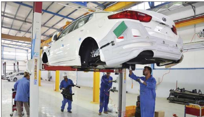
أحد خطوط إنتاج السيارات الكيا

الدراجي افتتحت الشركة العامة للصناعات الخفيفة والصناعات المعدنية في حوالبتيه الجبيل في معسكر الناجي. والشركة العامة للصناعات المعدنية في حوالبتيه الجبيل في معسكر الناجي. والشركة العامة للصناعات المعدنية في حوالبتيه الجبيل في معسكر الناجي. والشركة العامة للصناعات المعدنية في حوالبتيه الجبيل في معسكر الناجي.