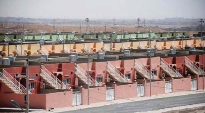
بيوت واطنة الكلفة في ديالى

على دولة مثل العراق ذات الامكانيات المادية الكبيرة مؤكداً أهمية المبادرة بالاعتماد على المواطنين لبناء الاعمار في المناطق الحرة أو ما سألته المفوضية فقال من سكنة شمال المقدادية فقال المنظمات الدولية تعتمد برامج محددة في بناء المنازل واطنة الكلفة ماني اننا سنسحق لاشهر طويلة ننتظر وصولها الى مدينتنا»