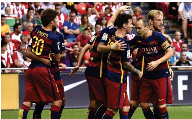
لايبو برشلونة يحتفلون بالفوز

الدوري الفرنسي لكرة القدم يعود كاسم 16 صفر على رأس الأبل في ختام مباريات المرحلة الثالثة من المسابقة فيما وصل ليل بداية للمنافسة في الموسم الحالي للمنافسة وسط فح التبادل السليم مع ضيفه بوردو كما شهدت المرحلة نفسها فوز صافرت أبيان على ضيفه لوريان 1 / 0 وبعد هزيمته أمام كان ورس في مبارياته للخطين بالمسابقة كاشتر مارسيليا عن أبيان وحقق الفوز الأول له في الدوري الفرنسي هذا الموسم لتحتل المركز الثالث عشر فيما حصد صفر ثروا عند تعطلين في المركز السابع عشر وأولى مارسيليا الشوط الأول لصالحه بهدف نظيف سجده عبد العزيز بريدة في الدقيقة 19 ثم انهال فوفان الأهداف في الشوط الثاني عبر ميشي بانتشواي في الدقيقة 56 و90 وأوسو سبارا وتوسكان أوكامبوس ورومان أليستاميرني في الدقائق 87 و89 ورفع أمير رصيده إلى ثغطين بعدما حقق التعادل الثاني على التوالي ليحل المركز السادس عشر في جدول المسابقة بفارق الأهداف المسجلة فقط خلف بوردو ولوريان وفي مباراة أخرى من طرس صدمه حذرة بعد ثلاث شراس مره بانيناسي كيهوت في الدقيقة الأولى للخروج عن مصافها تارو صامتا هاموتو لكن الفريق ظل صامتا أمام بوردو أمام صدمته سانت أبيان في الدقيقة 87 في المباراة هدف الفوز لسانت أبيان الذي سجله رومان هاموما نفسه وحقق سانت أبيان الفوز الأول له في المسابقة هذا الموسم بتفوق رصيده إلى أربع نقاط ويتقدم المركز العاشر مع تولوز