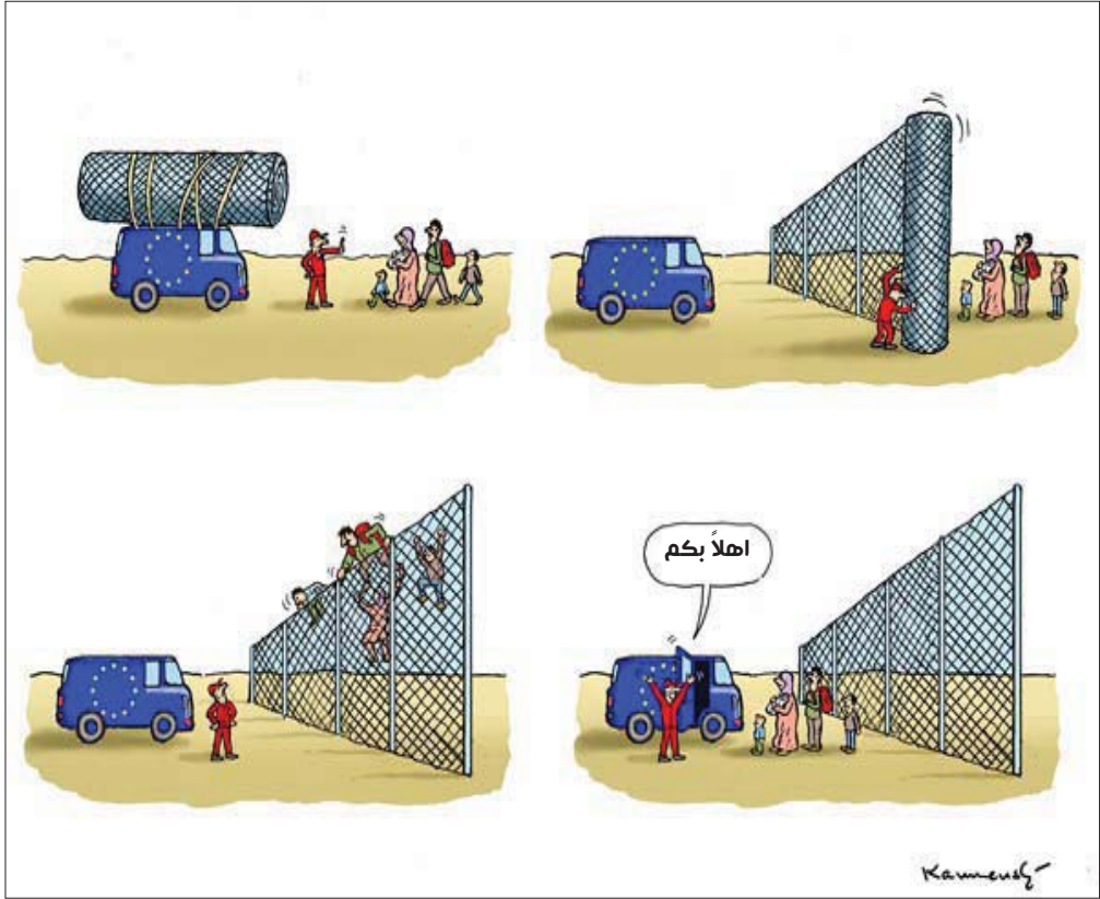
عن موقع «كارتون سياسي»