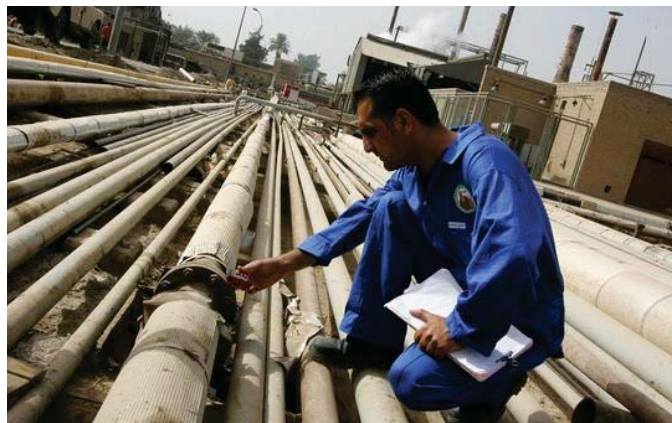
عمل برافق أنابيب المنتجات النفطية

المصاحب. أشار الجواهرى إلى «الحاجة من أن تستثمر الشركات العالمية بالغاز لمصاحبها حيث تربعت شل بإجراء الدراسة الأساسية الأساسية لاستغلال غاز العراق من دون أمر وهذا التسرع غير بؤرهم وخشيت من استغلالها بكميات الغاز الكاملة كاملة. وحسب إنتاج العراق من الكهرواين يمكنه أن يستثمرها إذا سمح لها باستثمار الغاز بالغازية التي طرحت، وهي أنهم يبتغون ويشغلون محطات الغاز ليبيعوها إلى الدولة بعد 25 أو 30 سنة».