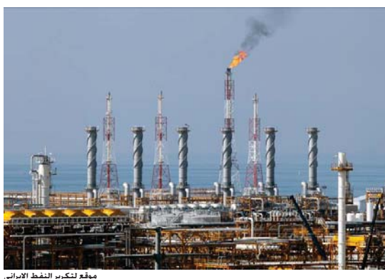
موقع لتكرير النفط الإيراني

في الفاسل برى محللون آخرون أن شركات الطاقة لن تكون قادرة على مقاومة إغراء إيران التي لديها تسعة بالمئة من احتياطات النفط العالمية المؤكدة في الشرق الأوسط و18 بالمئة من احتياطات الغاز. وقد اجتمع مسؤولون من شركات النفط الأوروبية الكبرى مثل «رويال داتش شل» و«نتي» مع مسؤولين إيرانيين في طهران في وقت سابق هذا العام لمناقشة خطط عملهم المستقبلية. ويصر البعض أن المملكة العربية السعودية سوف تحاول النفط على منافستها الإقليمية. إيران من خلال محاولة الحفاظ على أسعار منخفضة للغاية، كما هو واضح الاقتصادي الأمريكي. ديفيد كوتوك، أن «دني أسعار النفط إضافة إلى ارتفاع الإنتاج إلى أعلى معدل في التاريخ هو أفضل سلاح للسعوديين حيث أن لديهم احتياطات مالية كافية للبقاء في القيادة لمدة سنوات مقبلة». على وفق قوله، وفي السياق ذاته، قال مسؤولون في طهران.