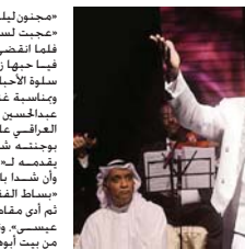
الفنان علي الوردي

«محزون ليلى» أو «التي يقول مقلطها» - «عزبت لسعير العريدي» - «بنيها» - «البراز» - «له آيات رابعة من الشعر العربي» - «فيلما لخص ما بيننا سكن الدهر» - «أخاف أن أفسد أياماً ننادي. علي عاصي الهوي» - «الله أكبر» - ليكر بعدها بأغنية بيك بابك حيث التي تعالج معها رؤس الحاضرين طرباً. ولم يتوقف مجرى الأصالة. التي من مراحل العراق الفولكلورية التي لا تنضب من الإبداع والمبدعين. ومن توهي دجلة بقارة طوال الحرب الأهلية العراقية. بل أرتوضاً وهدفاً حتى عبر البحار والخصب. ولجى ذلك عبر أغنية «علي يا حلو» منين الله جاك». ثم في مقام «قل للمحببة في الخمار الأزرق». تلاه بأغنية فولكلورية ليست من أغاني الغنان علي الوردي في داوين فيس كان قد أداها الوردي أثناء استضافته في تلفزيون الكويت العام 1990.