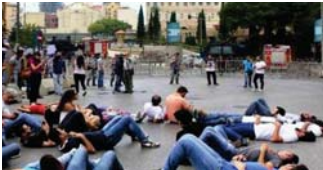
غالبية أنحاء بيروت. واستخدمت عناصر الأمن قنابل الغاز وخراطيم المياه عالية الضغط العنصرات منهم.