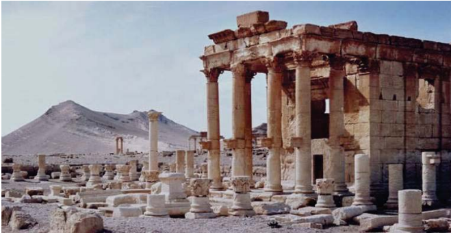
معيد بعد شمين قبل تدميره

نيسان في العراق مدينة النمرود الأثرية مستخدمين جرافات وفضوس ومقتحرات. كما خربوا أيضاً مدينة الحضر الرومانية ومخنف الموصل في شمال العراق وحسب الأثر المتحفة فقد تعرض أكثر من 300 موقع أثري سوري ودمر داعش أيضاً في حلب خلال النزاع في سوريا المتصمر منذ أكثر من أربع سنوات.