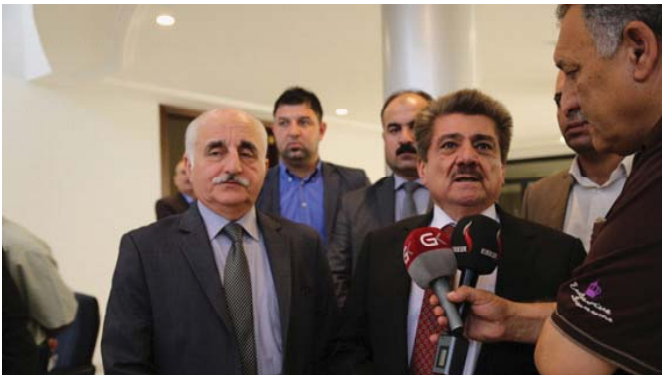
جانب من افتتاح كنيسة الأرمن في كركوك

طوابق وتشمسل غرف سويت عدد 2/ وفرف استقبال هول ومطبخ بحجمه (180) 2م للطابق الواحد المبني العاصم ويوجب عقود تيرم مع الشركات المرافلة الحكومية أو شركات القطاع الخاص ( العراقية والعربية والاجنبية ) وتقوم دائرة المباني ومن خلال دوائر المتخصصين الفنيين القابلة لها بالارشاف وبرافعة وتدقيق تنفيذ الاعمال ومودتها وتوجب الفسوط والمواصفات وجداول الكميات الصاق عليها ومن خلال كوراءا المستندة لعدد دائرة المباني ما يعطينا فاخر اكبر لاجاز المشاريع الكوكلة للدائرة. بتكرن دائرة المباني وهي الجهة الحكومية المسؤولة عن تنفيذ