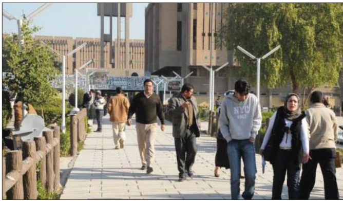
الجامعة المستنصرية "ارشيف"

القبول لأغراض تدقيقه. وأشار الى انه لايجب الطلبية للقبولين تعديل الترشيح في حال كون قبولات صحبها على أساس قبولات القمصنة من فيهم وحسب النسبة المئوية وبخضعون لتضوابط التسمية المعلقة. وأوضح انه لايجب التغير في سن قبول من ترقيم ايده بعد قبوله. مبيناً انه سيتم اعتماد قوائم قبول وقبار اللجنة القضائية الخاصة بعمل في الشهور القادمة للقبولين في مؤسسات التعليم العالي من سنة 2006 ولا يتم مطالبتهم بحجة أو شهادة وفاة الشهيد.