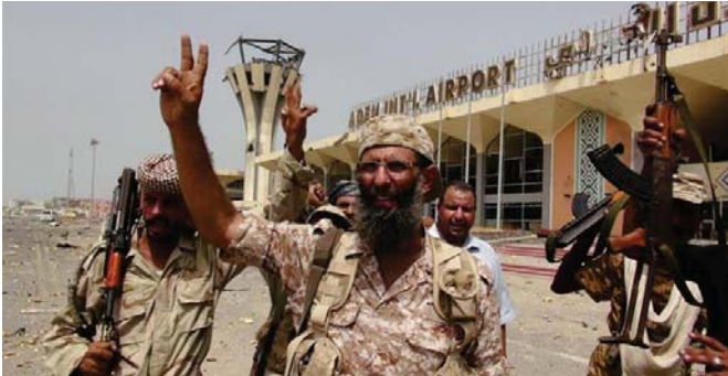
مقاتلون في قاعدة العند الجوية

صن البلاد بعدما عن تدخلات الحوثيين وكان الحوثيون نقدا في وقت سابق تورطوه في السوق السوداء لبيع المشتقات النفطية في المحافظات الشمالية وأخذوا قرار الحوثيين المناصرين بما يسمى به اللجنة الوطنية العليا بفتح أسواق بيع الوقود وبطها بالأسواق العالمية وهو خطوة واسعة آمنت انتقادات شديدة واسعة في مختلف أرجاء الجزيرة الاقتصادية بشكل كبير إلى ارتفاع الأسعار بشكل كبير وسيفوقها بأنها جرعة سعريه جديدة خلفا لما أقرته الحوثيين التي أعطت أسواق النفط من عدم المناصرين في حصارهم لصنعاء تحت راية رفض الجريمة السعريه الحكومية لأسعار الوقود.