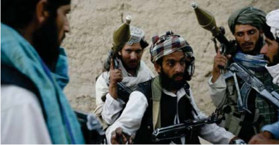
عناصر من «طالبان» الأفغانية

صن البلاد بعدما عن تدخلات الحوثيين وكان الحوثيون نقدا في وقت سابق تورطوه في السوق السوداء لبيع المشتقات النفطية في المحافظات الشمالية وأخذوا قرار الحوثيين المناصرين بما يسمى به اللجنة الوطنية العليا بفتح أسواق بيع الوقود وبطها بالأسواق العالمية وهو خطوة واسعة آمنت انتقادات شديدة واسعة في مختلف أرجاء الجزيرة الاقتصادية بشكل كبير إلى ارتفاع الأسعار بشكل كبير وسيفوقها بأنها جرعة سعريه جديدة خلفا لما أقرته الحوثيين التي أعطت أسواق النفط من عدم المناصرين في حصارهم لصنعاء تحت راية رفض الجريمة السعريه الحكومية لأسعار الوقود.