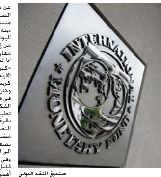
صندوق النقد الدولي

«يسود كل ذلك متسجماً مع قمة (13 حزيران) ومع الجدول الزمني الأوربي» وأضاف «المهم أن يتم إخراج ترقم على الأرض وهذا ما نقوم به مع صندوق النقد الدولي» من جهة. أقر رئيس الوزراء اليوناني الكسيس تسيراس رسمياً الأسبوع الماضي على أعضاء حزب سيريزا عقد مؤتمر استثنائي في أيلول المقبل لتحديد موقف مشترك حول الاتفاق مع داني البلاد الذي طعنت فيه أقلية داخل الحزب. وقال رئيس الوزراء أمام اللجنة المركزية للحزب في أينا «أقترح عقد مؤتمر مفتوح وبيروقراطي في أيلول» أطلقها منذ أيام عدة من جانبه صرح وزير المالية الأناشي فولجاش شوبيليه بأن خطة الإنقاذ المالي الجديدة لليونان هي محاولة الأناشي لتسوية الديون بالمشكلات الاقتصادية.