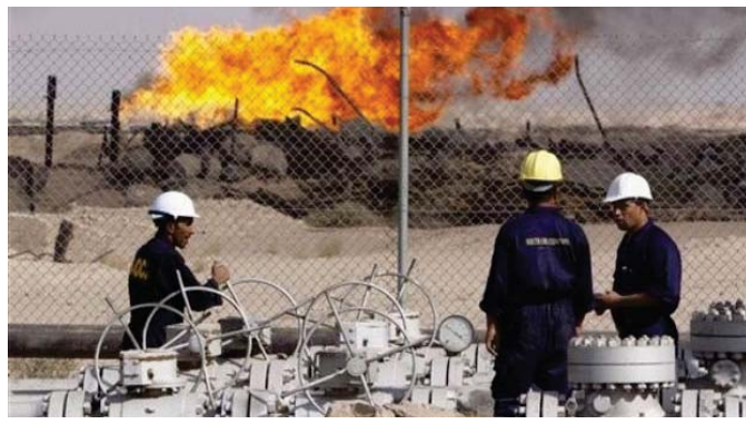
أحد الحقول النفطية

أسعار أقرب شهر استنفاق 20.8 في المئة في تموز وهو أكبر هبوط ظهري منذ تشرين الأول عام 2008. وتوقفت النمو في شركات قطاع الصناعات الحويلية الكبيرة باليمن بشكل مفاجيء في تموز بعد هبوط الطلب في الداخل والخارج ليخسار ذلك إلى مخاوف من هبوط سعره أسواق الأسهم الصينية في الأونة الأخيرة.