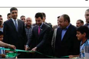
عبطان يقض شريط افتتاح الملعب

بغداد - المكتب الاعلامي: بحث وزير الشباب والرياضة عبد الحسین عبطان الواقع الشناقية والرياضة في الديوانية وسيل الانشاء به لاضلال الشناقيات وتقيم الخدمة لشباب ورياضي المحافظة. واكد عبطان خلال لقائه محافظ الديوانية الدكتور عمار المدني والرياضة واخرين على توجيه الاجراءات المناسبة للشباب الرياضية هواتمهم واقامة مشاريعهم.