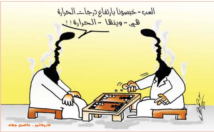
كاريكاتير - عاصم جهاد

متابعة - الصباح الجديد: يصافح الناس من أب تكري وفاة العالم الاسكتلندي المشهور بعد جارب عدة خاضها مع زميله الكهربائي توماس الواتسون تكلفت بالنجاح عام 1867. حين تمكن الواتسون من سماع صوت بيل غير السلك الذي يصل بين جهازَي هاتف في غرفتين مختلفتين. وبعد لا يعرف كثيرون أن فاج غرامام لم يكن من مصاصع الأبحاث بعد جارب عدة خاضها مع زميله الكهربائي توماس الواتسون تكلفت بالنجاح عام 1867. حين تمكن الواتسون من سماع صوت بيل غير السلك الذي يصل بين جهازَي هاتف في غرفتين مختلفتين. وبعد لا يعرف كثيرون أن فاج غرامام لم يكن من مصاصع الأبحاث بعد جارب عدة خاضها مع زميله الكهربائي توماس الواتسون تكلفت بالنجاح عام 1867. حين تمكن الواتسون من سماع صوت بيل غير السلك الذي يصل بين جهازَي هاتف في غرفتين مختلفتين.