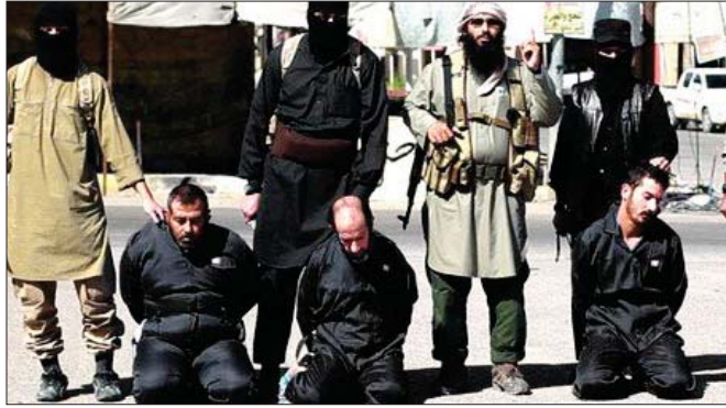
عمليات اعدام لداعش بحق مواطنين "الرشيف"

التنظيم يعدّ العملية الانتخابية عملية كآفة برمتها وتختلف الشرع الذي يفهمه التنظيم، ويعد كل من العملية كآفا ويستحوذ الأعدام