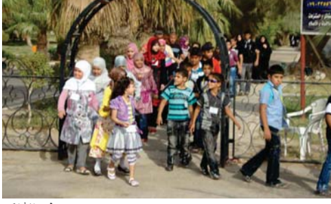
مجموعة من المشاركين في امانة بغداد. ان المبادرة والفكرة كانت من منظمة

وفعاليات تعليمية ومسرحية وتنموية ورفهية وزعت خلاله هدايا والعاب مع وجبة غذائية وجوائز للفائزين بالمسابقات شارك فيه ما يقارب من 100 شعبة تقبل من شتى أنحاء العاصمة بغداد من كلا الجانبين الهدف تنمية ذكاء الأطفال على التعلم والابداع والحفاظ على النظافة من خلال برامج تعليمية تعليمية زيادة الوعي المجتمعي والتضام والاحكام على الاطفال في المدرسة والنظافة وتنشيط انماهم عبر فعاليات الرسم والشعر الذي اقيمت بالكرنفال. وقالت فاطمة الالوسي المبررة الانظمة لمتابعة المنهج التفاني لتوعية المدينة ان القيم بغداد بالتنسيق وعبارة أمن بغداد والربيع والشمس عولم وشركة ألعاب الزوراء شمل كرنفال للعب والشعر