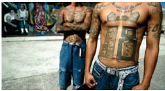
أحرون جنسبدا جيرة من ثقافة فينشيون في تاريخ طويل لهذه الظاهرة

موسكو - وكالات: تخضع موسكو فعاليات أسبوع الوشم الدولي الذي يشترك فيه عشرات الفنانين المميزين في هذا المجال حيث يحظى الزوار بمشاهدة أديارات هذا الفن ووضع الرسم الذي يبرهن على الجسمي فبالأول مرة تجرى في العاصمة الروسية مهرجاناً للوشم أو "التاتو" وعلى هذا النطاق الواسع واستقطب الحدث عشرات الفنانين الغربيين من خطوط الإبرة على المسد رسومات نالت شهرة كبيرة. ويعتبر الزوار هنا على إبداعات الرسامين ليس من روسيا فقط بل من دول أور كاندونيسيا وبولندا