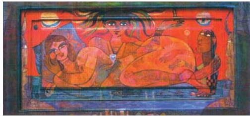
من أعمال الفنان سعد علي