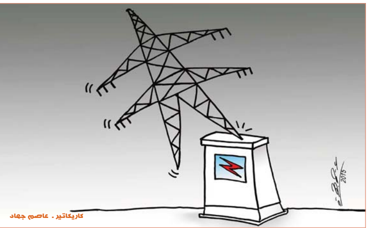
كاريكاتير - عاصم جهاد

نطحة ثور عقاباً على "سيليقي" نيويورك - سكاى نيوز: حاولت امرأة النطاط صورة "سيليقي" مع ثور أمريكي في منزله "بليستون". إلا أن الحيوان الذي بين حنوط لم يعطها الفرصة لذلك وتخطها قبل أن تلفظ الصورة. وقالت المتحمدة باسم لوزا آبي بارثليت. إن المرأة البلقنة بنطح ثوراً ليطيح بها في الهواء من أي إلى إصابتها بجروح طفيفة. وبعد هذا النوع الخائفة من نوعها منذ مايو الماضي رغم خبر السائح الذين ينزويون المتونة كل عام من خلال المنطورات والاندفاع وشفتها. بان بعدها مسافة 25 مترا على الأقل من الثيران والدب الأشهب.