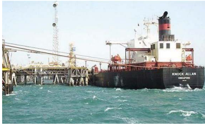
أحد الموانئ النفطية في البصرة