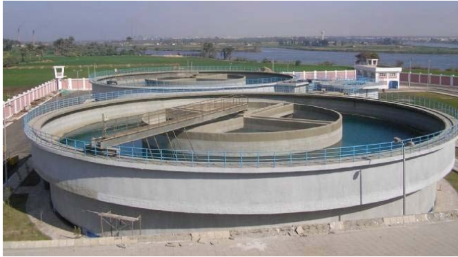
احدى محطات تصفية مياه الشرب