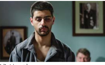
مشهد من فيلم "قطن"

بغداد - الصباح الجديد: يشترك العراق في مهرجان الفيلم العربي في أستراليا، الذي يعقد للقنطرة من (13 و14 وغاية 30 آب) المقبل بثلاثة أفلام. وقال المخرج السينمائي مهدي عباس إن "مشاركة العراق في مهرجان الفيلم العربي الذي يقام في أستراليا، جاءت بواقع ثلاثة أفلام خصصت فيلما وأخرى تطويلاً وفيلمين قصيرين والأفلام هي: "حذت نعال ياسين" للمخرج محمد الدراجي، و"القطن" للمخرج لؤي فاضل، و"حظي في بلاد العجائب" للمخرج علي كركم. وأضاف عباس إن "الأفلام من مصر واليمن والأردن وفلسطين والإمارات العربية تشارك في المهرجان