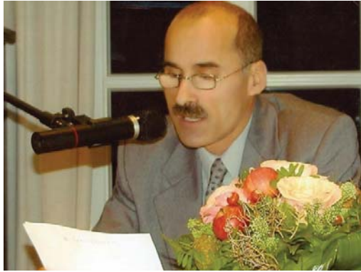
الشاعر شينوار إبراهيم

يرى أن لهذا الجسد كياناً مفسماً تحرب له الهوية والسيادة والوقار كونه الباطن الضامن في حركه مجسسته العاطفية. لم تكن لهية أمانه أو ضغوطات نفسية أو تألمات دائمة تنصله فيها تراكمات الغلوام، ملثما كهدى المعنى الشاعر "زار غيباً" الذي عرف بالإلصاق الذي كتبه عنه. هو جيب أم وعائتي أنا والأبوية التي اعتمتها في الكتابة عن هذا الحب هي أجميتي أنا. إنني أول شاعر رحل إلى عرف الفلك الضيقه وسرع انسيب العشر العاصره بنقه عمنه تصوير وأنا أول من أخذ تفاصيل العشق اليومية في الشعر (الجراند الكيب السلسلت مناهض الرماد أدوات الرينة العاصره القهوي للربيع نهاب الاستجمام العطور الأيلان...الخ) .