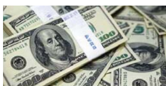
وكان مصدر حكومي قد أشار في تصريح سابق إلى أن 90% من مشروعات البترول من البنك المركزي العراقي في للحالات و10% فقط البيع النقدي.

بغداد - الصباح الجديد: أفضت اللجنة المالية التابعة لوزارة المالية العراقية على بيع 312 مليار دولار من العراق عن طريق مزاد البنك المركزي اليوم لبيع العملة الصعبة مشيرة إلى أن هناك شهادات بان ألقاها نعت لتبييض الأموال.