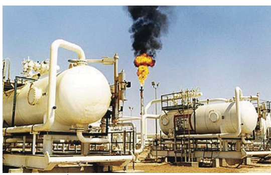
أحد الحقول الغازية في إيران

بين الصفوف الخلية والمستثمرين الأحياء» وأشار في كلمة خلال المؤتمر ذاته إلى أن قطاع التصرف الإيراني «مقدم إلى حد كبير جدا» مشيراً إلى وجود «مجال واسع للتعاون وإنشاء مشاريع مشتركة بين مستثمرين أجانب وشركاء إيرانيين». ولم يغفل أيضاً أن قطاع الخدمات المصرفية الإلكترونية «ما في شكل ملحوظ جداً. لكن لا تزال تواجه فرصة جيدة لبدء نشاطات معا في هذا المجال».