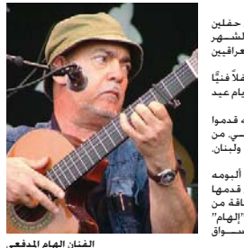
الفنان إيهام المدفعي

متابعة - الصباح الجديد: يُحيي الفنان العراقي إيهام المدفعي حفلين في العاصمة الإيطالية روما خلال الشهر المقبل: وذلك لدعم النازحين العراقيين المهاجرين لروما. يُذكر أن إيهام المدفعي أحد حفلاتها في العاصمة الأردنية عمسان ثلاث أيام عيد الفطر. وحضر الحفل عدد كبير من صحبه قدموا من عدة أقطار من الوطن العربي من الأردن وفلسطين والعراق وسوريا ولبنان والمعمودية. وقدم "إيهام" مجموعة من أغاني ألبومه الجديد الذي اسم يضم بعدد اثني قدمها "المدفعي" لأول مرة بالإضافة إلى بقية من أحمل أغانيه ومن المقرر أن تنتهي "إيهام" من ألبومه ويطلقه في الأسواق قريباً.