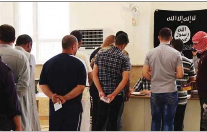
الموصليون مستاءون من حياتهم تحت ظل داعش