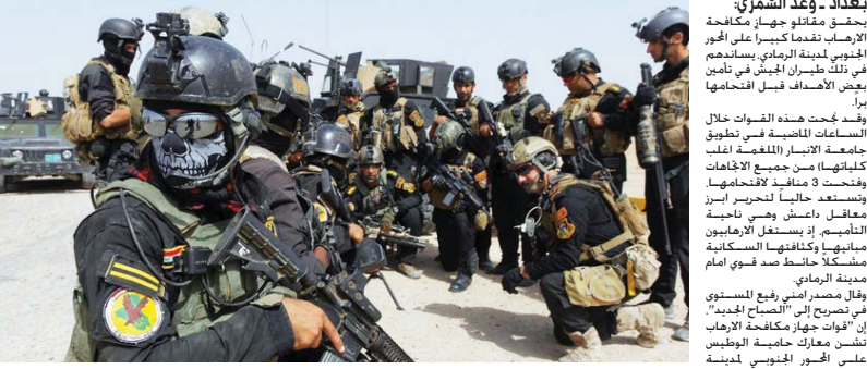
مقاتلو الجهاز يحققون تقدماً على المحور الجنوبي ويطوفون جامعة الأنبار "مكافحة الإرهاب" يتأهب لاحتحام أبرز معاقل "داعش" في الرمادي

بغداد - وعد الشوري: حقق مقاتلو جهاز مكافحة الإرهاب تقدماً كبيراً في محور الجوبي خيمنة الرمادي بسماحهم ببعض الأضرار قبل اقتحامها. وقد جُت هذه القوات خلال الساعات الماضية في تطويق جامعة الأنبار (المسماة أغلب كلياتها) من جميع الاتجاهات وتحتضن 3 أجنحة لتأخرتها واستعدت حالياً لتحرير أبرز معاقل داعش وهي ناحية التأميم، إذ يستغل الإرهابيون مبانها وكثافتها السكانية مشكلاً حائلاً ضد قواي أمام مدينة الرمادي. وقال مصدر أممي رفيع المستوى في تصريح إلى "الصباح الجديد" إن "قوات جهاز مكافحة الإرهاب تتنشر معاً حامية الأجنحة وعلى محور الجوبي لمحاصرة الرمادي". في وقت يوم خسائر كبيرة في الأرواح والجهد" وأضاف أنه "تم تطويق مبنى جامعة الأنبار من جميع الاتجاهات منذ نهاية الأسبوع الماضي وباتت بالنسبة إلى القوا قوات مكافحة الإرهاب تستعد للاحتحام الجامعة في حين تقف القوات الهاجمة على حقيقتها" تتمه 3 ص