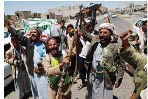
عناصر من الحوثيين في اليمن

فتح مسلح أميركي النار في إحدى دور السينما في ولاية لويريانا الأميركية، قتل اثنين بعشرين آخرين ثم قتل نفسه. وقالت شرطة الولاية في بيان رسمي إن المسلح رجل أبيض يبلغ من العمر 58 سنة وكان يحمل بندقية عاتية. ولم يذكر إيمان مرزدا من المصادر في وزارة الدفاع الأميركية بأن السلطات التركية سمحت للولايات المتحدة بنشر مقاتلات وطائرات من دون طيار في قاعدة "إنجرليك" الواقعة في مدينة أضنة من جانبه مسؤول في الإدارة الأميركية لصحيفة "حرث" التركية أنه من المتوقع فتح القاعدة مطلع آب القادم لاستخدامها في قتال تنظيم "داعش". كما أكد روغان أن السلطات ستواصل عملياتها لمكافحة الإرهاب بحزم عملياً أن الأهداف معروفة جداً وهي "داعش" وحزب العمال الكردستاني وأردف جبهة التحرير الشعبية الثورية وأردف "إنها جماعات إرهابية تهدد أمننا القومي". أشنتها الأمن القومي". وأضاف "الحملة التي جرت الخميس الماضي ليست عملية مفردة بل ستستمر هذه العملية في المستقبل وستمنف بنتهي الخرم". وشهد الرئيس على أن الدولة ستستجبر المنظمات الإرهابية على دفع نصف جرائمها بالكامل. وأشدت مديرية الأمن العامة في تركيا والمنطقة سلسلة مدهات في 16