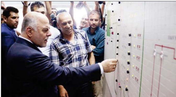
العبادي في حفل الافتتاح

العاصمة بغداد لزراعتها لها من غاية الخصمات الطويلة لها من غاية صحية، وتذاتية، المستعجب الزارين التي باه عمده في السنة نفسها (1,500) لتر بلغت إيرادات دولهم مليوناً و500 ألف دينار، وببيت أن «الانس» قامت أيضاً لتأمين المياه البلدية التابعة للامانة بـ2013 (75) شلثة وأنواع مختلفة لزراعتها في الحدائق العامة والجزرات والسطحة و بيع ما وكلفته (477,500) دينار وكلفته (229) مرة وكلفته (3 ملايين) دينار و435 ألف دينار.