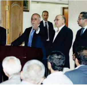
العبادي خلال لقائه بعدد من عوائل الشهداء والسجناء السياسيين

بغداد - رياض عبد الكريم: حيات كليلة رئيس الوزراء العبادي خلال لقائه جموعاً من عائلات الشهداء والسجناء السياسيين في وقت ظهر فيه برحلة مفصلة غيب وضوحها وتوجهاتها سلسلة التصريحات والوقوف السياسية التي طغت عليها مغردات استعجبت للشكك والاعتراض والتهديد بالانفجار. من دون ان تطرح البدائل الأخرى لما يجري على أرض الواقع وهذا ما دفع العبادي لأن يتحدث وربما للمرة الأولى بروح تشخيصية انتقادية كماشفاً عن العديد من المشكلات التي تمارسها بعض الأطراف السياسية من دون ان يسميها مؤكداً ان تلك الأطراف هي من تعمل بالخد من توجهات الحكومة على الرغم من انها داخل الحكومة. بهدف عرقلة