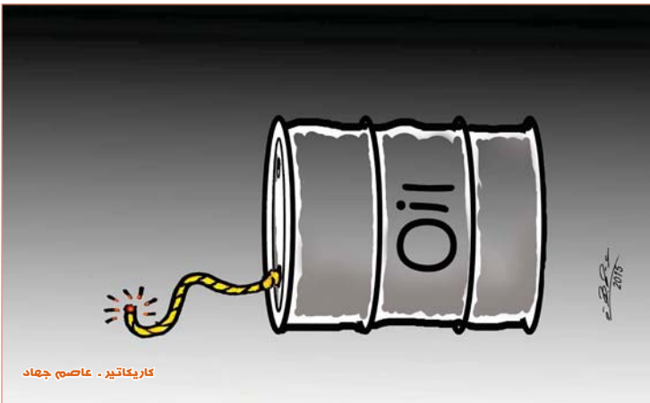
كاركاتير - عاصم جهاد

أوسلو - سكاى نيوز: كشفت الشرطة في النرويج عن إطلاقها رصاصتين فقط خلال العام الماضي لم تستمر في منعهما عن مقتل أو إصابة أي شخص. ووفقا لتقرير بشأن استخدام الشرطة لأسلحتها في الفترة ما بين 2002 وحتى 2014، شهد العام الماضي لتلويح الشرطة الترويجية باستخدام السلاح في 42 مناسبة، وهو أقل عدد خلال الـ 12 عاما الأخيرة. وبحسب تقرير صحيفة محلية. فإن الفترة الزمنية التي يعطها التقرير لم تشهد سوى مقتل شخصين برصاص الشرطة. وكان ذلك عامي 2006 و2009. وحتى خلال عام 2011 شهدته الهجمات الإرهابية على شميم للكتاب في جزيرة أوتيسا ومقر حكومته. لم تطلق الشرطة الرصاص سوى مرة واحدة فقط.