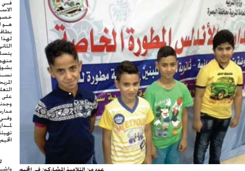
عدد من التلاميذ المشاركين في الخيم

في الخيم مع هذا الدرس مع الاستيعاب للأشكال بشكل مرحح التعامل في دروس الخيم قدم التلاميذ هو لتطوير قائلاتهم والنهوض بطقائهم بصورة تثير فيهم لهذا الدرس وقد دخلنا في الشهر الثاني من هذا الخيم ووجدنا أن تلاميذنا يتسامحون للتحسين ولم يتخلف احد منهم في يوم من الأيام إذ يحضرون بشوق لزيارات الأساتيب خصوصاً وأننا نستعمل كل الأساليب المناسبة لتهيئة الطلبة واستيعابهم للتعلم وبوسائل إصاح وطرائق تبعث على الاهتمام والخوض والتفوق وقد وجدنا كل المعلم والون من منارة مدارس الأندلس للتعلم في القسم الهيئة التعليمية لدراس الأندلس المطورة الكثر في هذا الخيم وشكرنا للهيئة الخاصة والنظلة والتدريس جعفر التلاميذ قدموا مسرحية