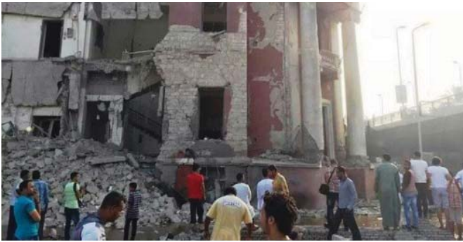
جانب من التفجير

هجمات بتفجيرات قابل مزروعة على الطرق وتفجيرات انتحارية استهدفت إلى الآن رجال أمن ومسؤولين. وفي وقت منات من رجال الجيش والقوات المسلحة في هجمات محافظة شمال سيناء حيث ينشط الإسلاميون المتشددون منذ عزل الرئيس محمد مرسي بعد احتجاجات حاشدة على حكمه في منتصف 2013 وكان النائب العام المصري هشام سركت قد قتل في تفجير في القاهرة في الشهر الماضي.