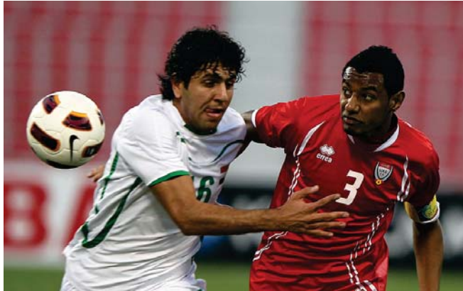
منتخبنا الأولمبي أمام منتخب عمان "أرشيف"

سول من مهمة التعاقد معه". واستطاع "الهرب البوسني جمال حاجي حطبي بواقفة اللجنة الفنية وقبحة التمثيل لدى الاتحاد العراقي لكرة القدم بسبب السيرة الذاتية المخرجة التي يشتمل على المدرب البوسني جمال حاجي وطاقم المدربين للمساعدة في حياجه فاه منتخب قطر للتفويض بقلب بطولة كأس الخليج العربي 22 والتي أقيمت في العاصمة السعودية الرياض أواخر العام الماضي بعد الفطور على البلد