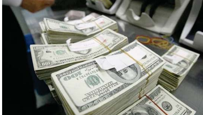
تعاملات مصرفية بومية

ويستمر 1166 ديناراً، نموها إلى 1187 ديناراً دولاراً، بضمنها عمولة البنك المركزي وقدرها 21 ديناراً لكل دولار، فيما بلغ سعر البيع النقدي للدولار 1190 ديناراً، بضمنها عمولة البنك المركزي وقدرها 24 ديناراً لكل دولار.