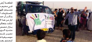
متطوعة أهلنا يوزعون المساعدات بين النازحين

قطعة أرض في بغداد الأيواء النازحين في مخيم سبسي "أهلنا للنازحين" يستم جوهرة من قبل الحملة بكافة المستزمات الضرورية. يذكر أن حملة أهلا بدأت في شهر ايار من هذا العام بعد من الفعاليات تخلت بعاليها للنازحين ومن ثم إقامة بازار خصص ريع لحملة أهلا في مخيم منزهة الزوراء فيما يخص الإيواء نصير شمة. قلند الحملة. حثلا موشيقا في المسرح الوطني ببغداد. لتحتتم بعدها الفعالية وتمس على إنشاء البت الأملاني المتزوج تحت عنوان UNHCR كما ساهمت بعض الشركات والؤسسات بالتعاون للحملة. وحظيت هذه الحملة منذ إنطلاقها برعاية إعلامية كبيرة من شبكة الاعلام العراقي.