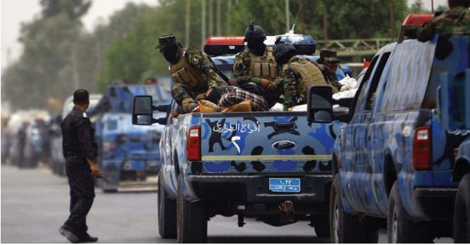
عناصر أمنية في ديالى