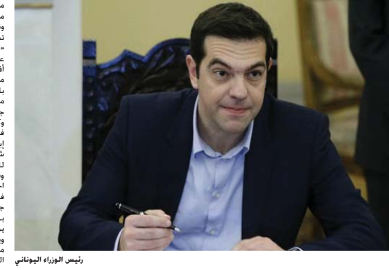
رئيس الوزراء اليوناني

أثينا - وكالات: عرضت اليونان اجراءات جديدة ما في ذلك زيادة في الضريبة على شركات الملاحة البحرية والغاز إغارات ضريبية غيرها ضمن حزمة اجراءات في أحدث اقتراح ارسطه التي الدائنين. من أجل التوصل لاتفاق مع مستثمري ائتمانيات في مقابل اصلاحات مع سياسة ائتمانيات للظفر بتحويل حشد تفادي الافلاس. وتخطط الحكومة ايضا لزيادة ضريبة القيمة المضافة وتعيد اصلاحات لظلم معاشات التقاعد وخديد جدول زمني نهائي لعمليات الخصخصة. وفي المقابل تزد اثينا من الدائنين ان برامجوا المستثمرين المستوفدة للفاصل الاساسي في الازمة العاصمة اليونان على مدى الايام الاربعة المقبلة وتوسع للحصول على تمويل بقيمة 53.5 بليون يورو للوفاء بالتزامات ديونها حتى نهاية