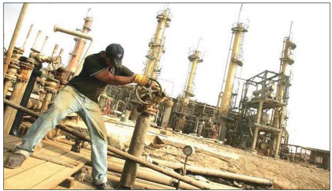
أحد الحقول النفطية في الجنوب