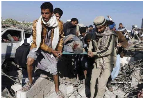
الحرب في اليمن أودت بحياة آلاف الأبرياء

قتل شخصان امس الجمعة بحادث إطلاق نار في بلدة فوندر هاوزن جنوب ألمانيا.