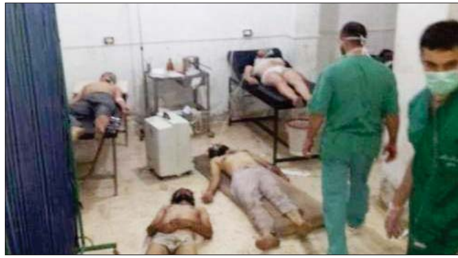
جثث عناصر تنظيم داعش في الطب العدلي بالموصل