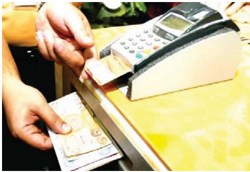
العمل تحدد ضوابط والإيقاف إعانة الحماية الاجتماعية

ومن ثم يتم استرداد المبالغ المستردة بناء على طلب المستفيدة تبين من خلاله عدم استيعابها على التسديد دفعة واحدة ويتم مفاخة هيئة التقاعد أو الدائرة المعنية بعد تحديد مبلغ القسط لإرساله عند نهاية كل شهر بصك مصدق معنون الى الدائرة وفي حال عدم وجود راتب لديها تقدم موظف كفيل لهذا الغرض