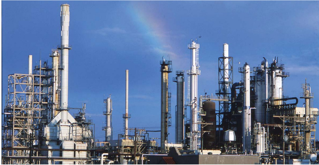
محطة إنتاج النفط في السعودية