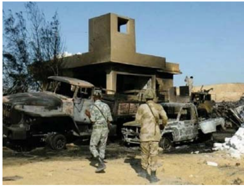
نقطة للجيش تعرضت لهجوم داعشي في سيناء

القائس من كل من الجانبين ومن المدنيين وكثرت الضحايا الأبية قاتلت في وقت سابق يوم الأربعاء 20 من الأمل من قوات الأمن قتلوا وأصيب 40 أسيراً والمحدث العسكري 22 من المتشددين قتلوا وإن عشرة من قوات الجيش سقطوا في قبيل من مصاب، وقالت المصادر الأمنية إن المهاجمين زعموا قنابل بطول طريق يربط بين الشيخ زيد ومعسكر للجيش لمنع وصول إمدادات أو تعزيزات عسكرية. وفي نفس الوقت قصفت طائرات إسرائيلية وطائرات إف 16 أهدافاً في المنطقة. في هذه الأثناء نقل مجلس الوزراء المصري مقر اجتماعه الأسبوعي من وسط القاهرة إلى أكاديمية الشرطة بالتجمع الخامس لأسباب أمنية. وبسبب مجلس الوزراء تسهيلات جديدة لمكافحة ظاهرة الإرهاب وتسريع إجراءات التقاضي في القضايا الجنائية. وشنق متشددين هجمات ضد أهداف الجيش والشرطة في شمال سيناء ومناطق أخرى بالملاذ أسبعت عن مقتل مئات الأشخاص أغلبهم من رجال الجيش والشرطة. ونظف سيناء منذ سنوات نشاطاً مسلحاً لجماعات وعناصر إسلامية، وتصاعدت وبيرة الهجمات منذ إطاحة الجيش بالرئيس الإسلامي محمد مرسي بعد احتجاجات شعبية واسعة على حكمه. وأعلنت القوات المسلحة واسعة النطاق في حملة جوية وسياسية ضد إعلان حالة الطوارئ وفرض حظر التجوال على ذلك في محاولة لتوقيح هجمات المسلحين.