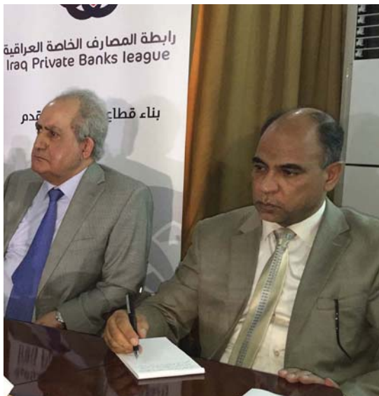
رابطة المصارف الخاصة العراقية Iraq Private Banks league

مصدرًا مهمًا من مصادر العملة الأجنبية. إلا أننا نلاحظ أنها لا تساهم في الاقتصاد الوطني بما يكفي، حيث أن نسبة ضئيلة جدًا، يسبب ضعف الاستثمارات الخارجية والسياحة وحويلات المقيمين في الخارج. بل حتى زعماء المفاعمين الذين يطلقون حويل عليهم إلى أفرخ (بالدولار) في تزايد ملحوظ.