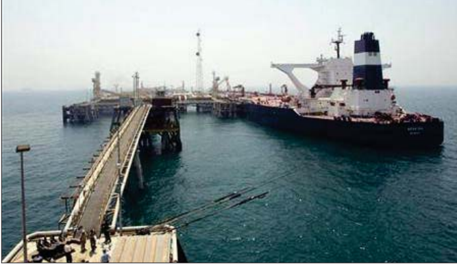
حاملة نفط في أحد موانئ البصرة