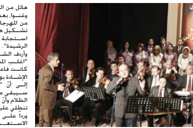
حفل سابق لدائرة الفنون الموسيقية

اهل من الفنانين الذين نشدوا وغنوا، بعضها اقيمت العديد من المهرجانات وخصوصا ما تشكل هيئة الحشد الشعبي استجابة لاجتهاد الرجعية الشبية.