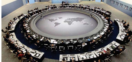
أحدى اجتماعات صندوق النقد الدولي "إم إف إف إم"

الذين يتظنون على اقتراحاتها من أجل الحصول على مساعدة عمدة تعهدوا من سداد استحقاق لصندوق النقد الدولي. ومع نقاد الأموال في خزائنها لم تتصكأ أيها من تسديد 1.5 مليار يورو لصندوق النقد الدولي لتصبح بذلك أول دولة صناعية تتعثر ماليًا خارج المؤسسة التي تخضع من واشنطن مقرها لها.