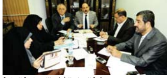
جئة العمل والشؤون الاجتماعية النيابية

تستدعي ما منهم بشكل تفدي أو على دفعات.. مييناً أن اللجنة لوضع صاحب الاستمارة وليس له الحق أن يتكأ أنه يستحق أم غير مشمول بالإعانة، موضحاً أن "الاستمارة تضم ثلاث تصنيفات، أما تحت حد الفقر أو تحت الحد الأدنى من حد الفقر والأخرى تستحق عنه الإعانة".