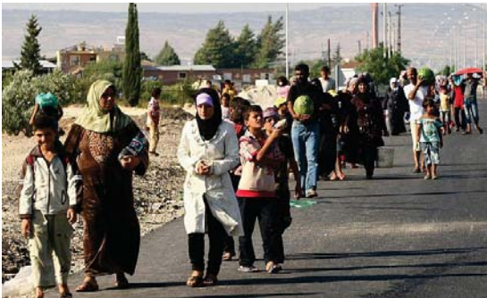
لاجئون سوريون في لبنان

قال برنامج الأغذية العالمي التابع للأمم المتحدة أمس الأربعاء إن نقص الأموال سيكون له أثره على حصول الغذاء الذي تقدمه للاجئين السوريين في لبنان هذا الشهر وربما يؤدي إلى خفض كل المساعدات التي تقدمها إلى 440 ألف سوري في الأون الشهر القادم. وقال مهندس هادي المدير الإقليمي لبرنامج الأغذية العالمي للتشرق الأوسط وشمال أفريقيا ووسط آسيا وشرق أوروبا في بيان إن احتياجاتنا إن الامور لا يمكن أن نتمسوا أكثر اضطرنا مرة أخرى إلى إجراء مزيد من الخفض. وقال «اللاجئين يكافحون بتابعهم للعثور على القليل الذي يمكنهم من البقاء» وقالت وكالات المساعدات الإنسانية في المنطقة إن نقص 4.5 مليار دولار إن المتشددين لتنظيم «داعش» في سوريا في 2015 لم يخفض سوى أقل من ربع ما وضع ملايين الأشخاص الضعفاء عرضة للخطر وأدى بالفعل إلى خفض في المساعدات الدولية للطاقة الذرية إن مديرها العام يوكيا أمانو غادر الأربعاء «أمس» متوجهاً إلى طهران للاختصاص مع الرئيس الإيراني ومسؤولين إيرانيين كبار اليوم الخميس. ويتابع من اللقاء إن تناول المفاوضات الإيرانية الستمر بين الوكالة - وإيران. ومن بين القضايا التي سيجري بحثها «كيفية الاسراع بالتوصل لحل لسك القضايا الملأفة المرتبطة ببرنامح إيران النووي بما في ذلك توضح الأبعاد العسكرية المحتملة».