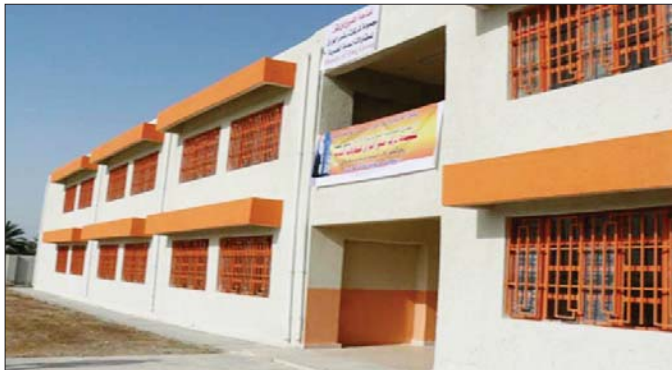
جانب من إحدى المدارس المنشأة حديثاً "أرشيف"

فيما حققت الشركة نسب إنجاز متقدمة تجمع سكني في كربلاء على طريق التحف ويتكون من 66 عمارة سكنية ويحتوي على 522 وحدة سكنية على أرض مساحتها 60 ومسا ويضم جميع مستلزمات الجبورية من مدارس ومستوصفات وغيرها كما حققت الشركة نسب إنجاز متقدمة جهودها السكنية ويضم 54 عمارة سكنية وحققت نسب إنجاز لسكني بنابه مجلس القضاء الأعلى في الخارطة كما استضاف بنابه جديدة للمشروع 5 تضم طوابق .