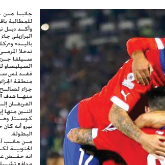
جانب من احتفالات لاعبي تشيلي بالفوز