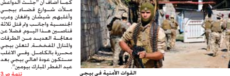
القوات الأمنية في بييجي

صلاح الدين - عمار علي: كشف مصدر أمني في قيادة عمليات صلاح الدين عن وقوع عمليات داخلية في صفوف تنظيم "داعش" يشن رفض أغلق مسلحيه للجويين في فضاءي الشرفاط والحويجة من التوجهه إلى قضاء بييجي ومحاربة القوات العراقية.