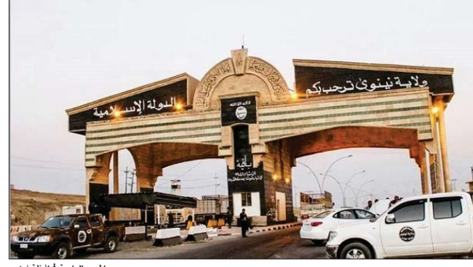
الخود البلدية محافظة نيوى

واضاف المصدر ان تنظيم داعش الارهابي في عملية اصدار عملة بديل للعملة العراقية الخاصة به والتي مسبوقة ان اعاد اية سيولتها للتداول في مطلع شهر رمضان الجاري.