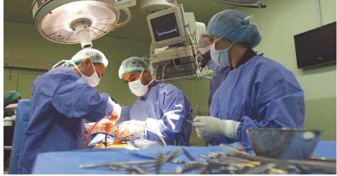
عدد من الأطباء في صالة جراحة

ان رحيل العشرات من الأطباء الاخصائيين كانت لها انعكاسات سلبية في مجال تقديم الخدمات الطبية خاصة في الجراحات التخصصية المعقدة