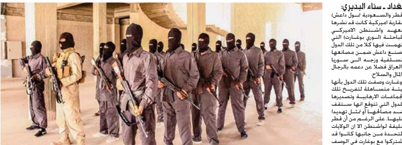
التهجمات تشير إلى دعم مادي وعسكري لتنظيم داعش