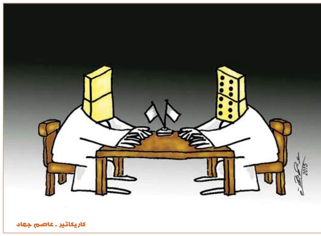
كاريكاتير - عاصم جهاد

تتقدم أسرة "الصباح الجديد" بأحر التهاني والتبريكات الى جريدة "المستقبل العراقي" بمناسبة صدور العدد 1000 من الجريدة، آمليين لها مزيداً من التقدم والازدهار خدمة لمسيرة الصحافة العراقية.