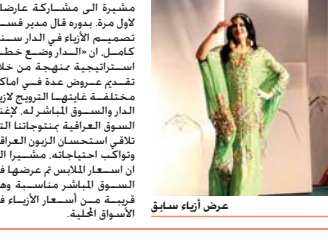
عرض أزياء سابق

بغداد - الصباح الجديد: تقيم دار الأزياء العراقية عرضاً فلكلورياً في قاعة بغداد في نادي الصيد. يوم الجمعة المصاف في الثالث من تموز الجاري وذلك لأجاء أمسية رمضانية. وقالت مديرة قسم العلاقات والأمور لدى جسي أن العرض الفلكلوري، ستضم مجموعة عروض متنوعة تنبئ السار استعدادها ضمن الأمسية الرمضانية، والتي ستعطي الطاقات الإبداعية مضمين دار الأزياء والقائمين على العمل الفني من إنتاج وحياطة وتطريز