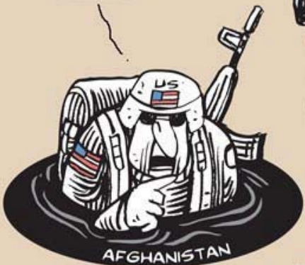
عن موقع «كارتون سياسي»

...I'M WARNING YOU! IT WILL BE A GRAVE MISTAKE IF YOU INTERVENE IN UKRAINE!