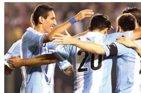
مواجهة ثائرة مرتزة بين الأرجنتين والباراجواي

انتهاء الوقت الأصلي (1-1) وكان في استقبالهم جماهير غاضبة طالبات برجيل كارلوس دوغا المدير الفني للسيلساو. ووصل دوغا إلى مطار سوبر باولو برفاقه مجموعة من اللاعبين بينهم مودراس كوستا وديفيد لوبيز وفيليبس لويس والياس وميرندا وفرميجيو وروينيو. وعرضوا لانفتاح من الجماهير التي كانت في انتظارهم. إذ ودوا هتافات بينها "مرتزة". رددو دوغا الذي طالبته بعض الصحف المحلية بقائلته بتصرحه منصفه من قبل. خلاهاه استبقته من الانفتاحات. وأكد "البرازيل لم تغربكوبا أميركا أربعين عاما. وعندما فاز بها قالوا إنها بل قيمة". مشيريا "الآن الأهم هو التصفيات المؤهلة للمونديال". ومن جانبه. أفر جواو ميراندا بأن المنتخب البرازيلي حزين الامرال لايعين.