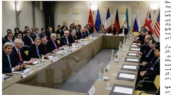
المفاوضات الإيرانية النووية

في أوتديس مع عناصر من تنظيم القاعدة، من ناحية أخرى وحصل وزير الداخلية الفرنسي برنار كازروف برفقة نظرائه من ألمانيا وبريطانيا إلى موقع الهجوم الإرهابي في مدينة «سوسه» التونسية قبل أن شارك في مراسم تكريم ضحايا هجوم باريس الإرهابي في أن يلتقي بعدد من المسؤولين التونسيين.