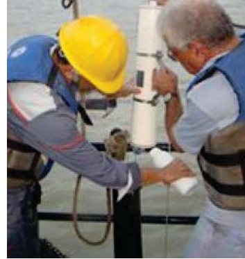
جانب من استعمال تقنية الفحص بجهاز السونار في الغوص البحري

بإسلاف مركز علوم البحار في جامعة البصرة تنفيذ مشروع بحثي وتدريبية العلمية المتعددة والتي تهدف الى دراسة الجوانب المتعددة لتعلم البحار وما يتصل بها من علوم اخرى بواسطة وحدة البحث العلمي التي تأسست في منطقة الخليج العربي وخليج عمان والبحر العربي والبحر الاحمر والى المياه الداخلية للخليج الفراتية والكميائية والجيولوجية والبيولوجية والمتاحية وبإسلاف المركز ايضا القيام بإعداد دراسات وبحوث تتعلق بواقع سبل وتطور السونار المستخدمة في السونار الطبيعية وتطورها من التوليد وخصائص الاستفاداة المثلى لسلك التوراة البحرية وتطور الدراسات الاستراتيجية البحرية لأهميتها لتدفع العام