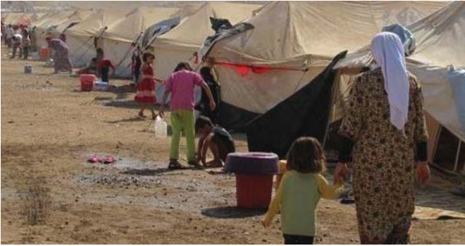
مخيم للنازحين في ديالي

ووضع حجر الأساس لمقر صومعه... ديالي تخطط لإعادة أكثر من 17 ألف أسرة نازحة