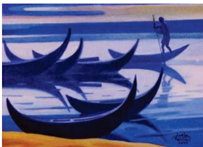
لوحة للفنان مأمود أحمد

المطر الذي ينقرُ صوتي ولا ينهجر البحر الذي يسكن عميقا عميقا هناك عند حافة الورد يوث طيبتنا كاندوش الباردة التي ارتكبتها اظفاري لكني سأحلم بكل العصافير التي بنت لغمرها عشيا في رنتي سأطعمم الذكريات المتهبسة نوايا الماء سأرتكب نبيسي من جديد في أغنيهم لأن البحر الذي يجرف غيمته على قلبك! أكبر من أن ينطقني