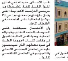
المجموعة الطبية في جامعة واسط

المشكلة لهذا الغرض بالتنسيق مع وزارة التعليم العالي وتسليم برنامج التصحيح الالكتروني والمشراكة في ورش العمل التي تمت التمهيد للوزارة والوقوف الجهد الفخر الثالث مناقشة المقترحات التي قدمها المصداق ومعاونوه الخاصة بآداء الامتحانات في الجامعات الاخرى وجنوبها بالتعاون مع الجهات المعنية لضمان جودة العملية التعليمية والوصول الى أفضل مستويات الامتحان وتنسيق مع قسم الاعلام في جامعتها وتقديم اوصاف للاعمال في مديرية تربية واسط للقيام بحملة إعلامية لتعريف وتأهيل الطلاب