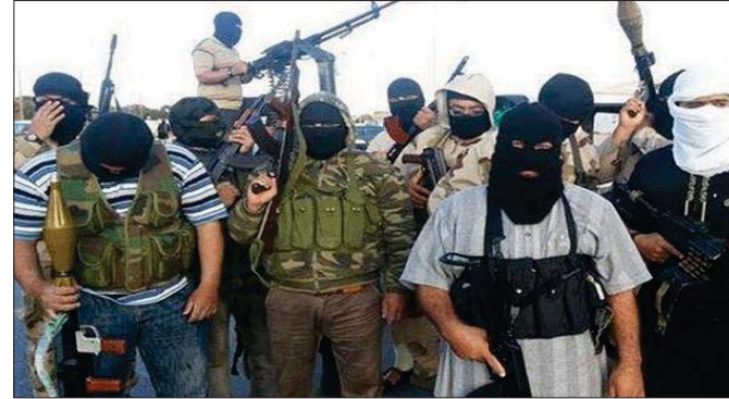
عناصر داعش الإرهابية في الموصل

وقعت اشتباكات بالأسلحة الخفيفة بين عناصر التنظيم القامصين في ناحية بابوش وبين عناصر تنظيم داعش الإرهابي بسبب قصف أحد افرانهم لسبب مجهول فيما تقدم التنظيم على 15 مواطناً من اهالي مناطق جنوبي الموصل وسوسة سوار نقاضة عارمة لعشرات الجيوش على التنظيم خلال أداء الواجب في التعرف عليهم واعتقالهم فيما بعد وقال مصدر اممي عراقي محافظة نينوى ان "الصالح الجديد" ان "فصا" من تنظيم داعش الارهابي اقدم على قصف مواطناً من عشيرة الجيوش في منطقة اسسكان معمل سميت بابوش لسبب مجهول". وأضافت "عقب الحادث جمع العشرات القضاة التابعة للتنظيم والتي كان القصاص يحتمى فيها. وولعت اشتباكات بين التنظيم وقريب عناصر التنظيم وتركيا وتعلمهم.