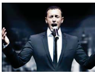
الفتان كاظم الساهر