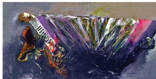
لوحة للفنان جبر علوان

لن يوحى إن عشت طويلاً كمتعزرة ببلانية 117-ل أعاشاً أو صت الأن صبية شاعرة في 29 عاشاً فمن يكرت للأروام الغيبة طللا سيموت الحب بقلبي ككلب عجوز؟ كلهما حياة متعقنة الموت وهودو على سيرر نظيف بعمر السبعين وحوالي الأبناء والأحفاد والموت خبت أنقاض منزل سسقط عليه برميل متفجر فمن يعما لاكسيسوارات الموت طللا سيموت الحب بقلبي ككلب