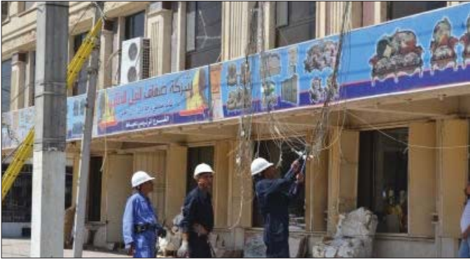
فريق رفع التجاوزات