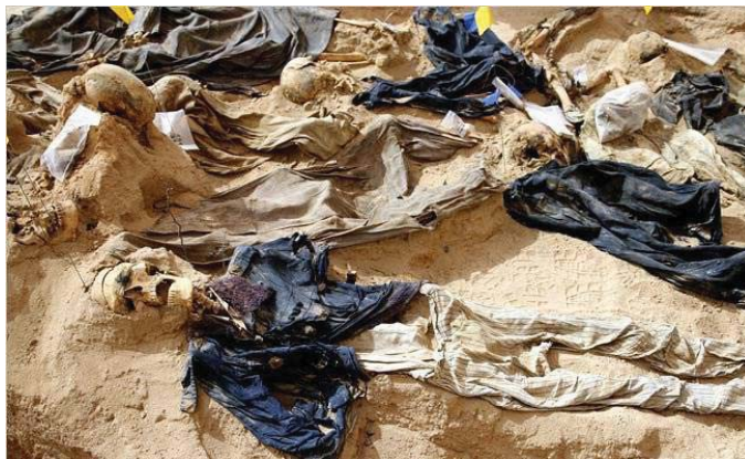
احدى القابر الجماعية المكتشفة بعد 2003

الاختصاصيين. وقد تم اللقاء مع فريق العمل ونوقش البحث ومراميل استخلاص المادة وخلاصة التجارب التي اجريت مع تقييمات مركز البحوث الفنية. 2 يستدل من الرد الشفوي الذي بلغنا به الاختصاصيين ان الرأي النهائي بشأن تقييم استخدام المادة على شكل رذاذ « عن طريق التنفس» يعود لمركز البحوث الفنية لان ذلك يتطلب جارب ميدانية واختبارات معقدة. 3 ولأجل الوقوف على تقييم نهائي حول صلاحية المادة للأغراض المتوخاة نقترح ان يشكل فريق عمل من قبل مركز البحوث الفنية وباختبارنا. لهذا الغرض.. مع التقدير.. مدير الأمن العام 1990/5/2م 7/شوال/1410هـ