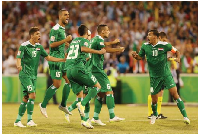
أسود الرافدين بانتظار مدرب جديد