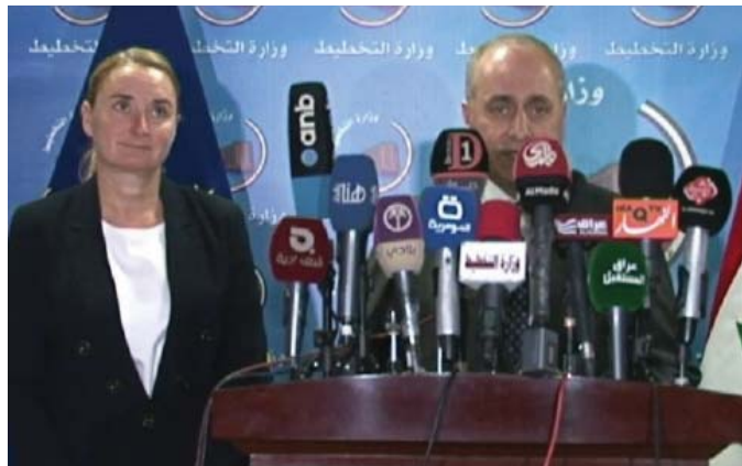
«هيشكوف» في أثناء المؤتمر الصحفي

مشروع المحافظة. ولقد تمت الموافقة مع شركتنا التي ان «التعاقد مع شركتنا لنظام الدفع الأجل هو من صلاحية الحكومة المركزية حصراً ولا بحق الحكومات المحلية» لتسلك «داعيا الحكومة الاتحادية إلى منح المحافظات صلاحيات التوزيع لتنفيذ مشاريع الدفع الأجل لاسيما حقيقة في الخدمات الأساسية والمشاريع الاستراتيجية.