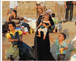
نساء إيزيديات تعرضن للاضطهاد

وتسجل أسماء الناجيات من داعش وإرسالها إلى وزارة العمل والشؤون الاجتماعية الإخبارية لشمولهم بالرواتب». وكانت حكومة إقليم كردستان قد أعلنت في (20 آذار 2015)، ان عدد الخائفات الإيزيديات حاليا لدى