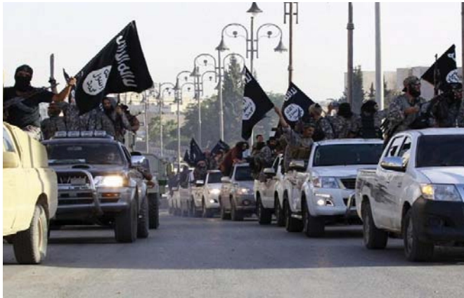
"داعش" يحشد للدفاع عن الرقة

الماضي مع انسحاب "داعش" بعد أن سيطرت على قاعدة الرقة 93 العسكرية وهي موقع استراتيجي الذي التنظيم المتشدد المسيطر عليه العام الماضي من القوات الحكومية. وأصبح مقرها على الحدود مع صافصاف للحملة التي تقودها الجبهة المتحدة على الأرض في سوريا ضد تنظيم الدولة الإسلامية وبثقا بين الطرفين.