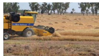
حقل القمح في الموصل

ومدير عام الدائرة القانونية في مكتب رئيس الوزراء. كما استضافت اللجنة المراد المضمين لفنساند (الرشيد) فلسطين عشرًا المنصوص بغداد (بابل). ووافقت اللجنة على توصيات جنتي الامر الديواني (88) و(69) بخصوص آلية استيراد المبالغ المرتبة بتمه تلك الفنادق مع اعطاء خصم من تلك المبالغ لصالح الفئاد دعمًا للقطاع السياحي وتنشيط الحركة الفندقية.