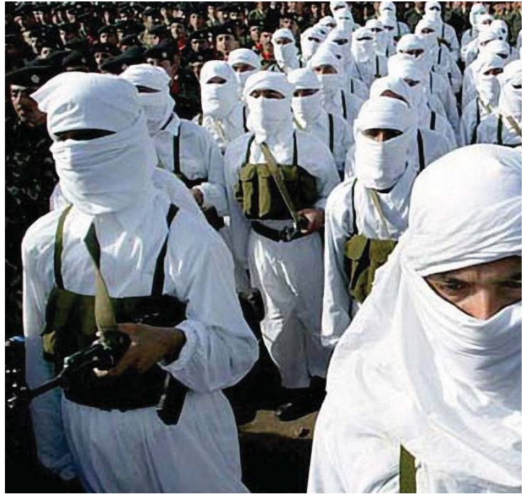
عناصر من فدائيو صدام

11. تكتب الخطة النهائية مع الوقوات والمستلزمات الاساسية للتفسيمة من نسختين نسخة للمراجع العليا ونسخة حفظ لسري فريق العمل لغاية صدور الامر. 12. امر عامة أ. يقلى الامر السابق بالعمل على الساحة الاوروبية. ب. يتم متابعة العناصر العملية (حركتها/اقامتها/فعاليتها) على جميع الساحة خلال هذه الفترة. ج. مناقشة امكانية العمل على الساحة اللبنانية. د. التذكير باستخدام كيبسولة الموت البنافيديين عند وقوع العناصر بالاسر وخاصة على الساحات الاوروبية. ه. اخطار الاوروبيين. 6. هوشتار زيماري الحزب 7. لطيف رشيد الاخاء الوطني