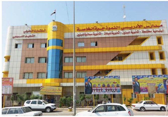
واجهة مدارس الأدرسي إحدى المدارس الأهلية في البصرة