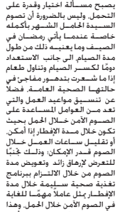
هناك عدة نصائح على الحوامل اتباعها لضمان صيما آمنًا

لذا من أكبر القرام التي ترتكب بحق المرأة وتحتوي على أكبر نسبة لها هي خطأ ارتكبهها وأقضا جعلها تقبل العيش تحت سقف الضغوط اليومية المفروضة عليها من قبل الوالد من بحظون بها وكلها فاضر أو غير قادر على تدبير أمورها وأمور من بحظون بها.