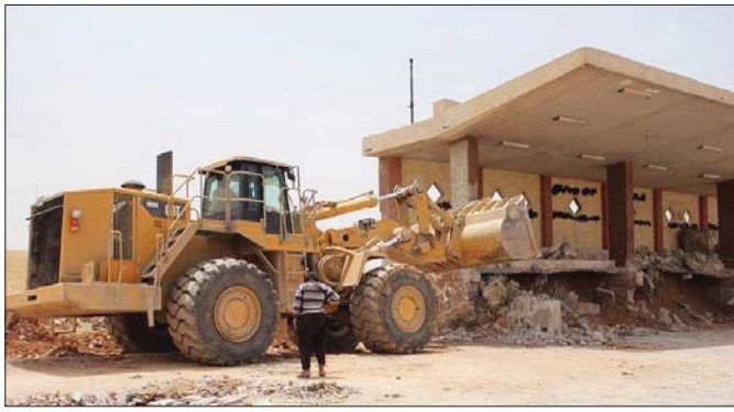
آليات وحفارات داعش في الموصل