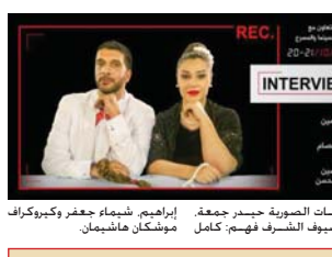
التقنيات الصوتية جدير محفة. أصا ضيوف الصورة فيهم: كامل موشكان هاشيمان.

مفاصل حياتها اليومية. والعرض يجمع بين عناصر متعددة من الميودراما وأساليب المقابلة الشخصية والحوار والرفض المشخصي (الجمبت) إذ استطاع المشران ألام حنس وسعدا الحسة اليومية ومواطني صديها مع العادات والتقاليد والأعراف الاجتماعية والذي يولد صراعا داخلها لأراك الذات الإنسانية. التقنيات الصوتية جدير محفة. أصا ضيوف الصورة فيهم: كامل موشكان هاشيمان.