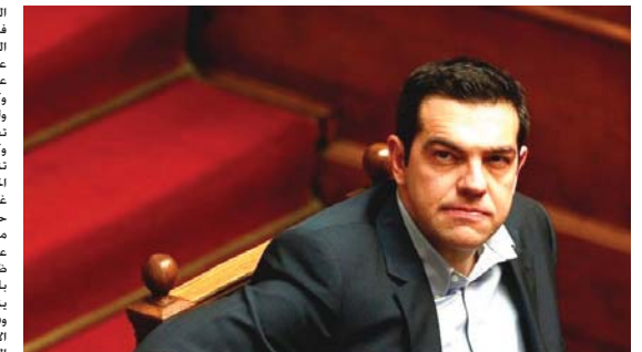
رئيس الوزراء اليوناني الكسيس تسيبراس