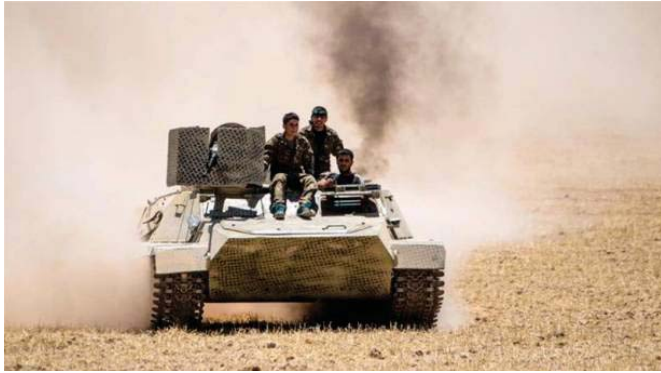
قوات تحرير عين عيسى

الانسان. تمكنت قوات النظام من طرد المسلحين خلال اليومين الماضيين من البيارات واصبحت متواجدة على بعد عشرة كيلومترات من تدمر الواقعة في وسط سوريا.