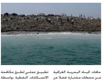
حلفاء المياه البحرية العراقية من محطات مختارة فضلا عن الاستكشابات النفطية بواسطة

زورق نواع لشركة نفط الجنوب والذي رافق باخرة الابحاث... "علوم البحار" ينظم رحلة استكشافية في المياه العراقية