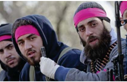
متمردون أوروبيون انضموا إلى التنظيم الإرهابي

دولان بعد نهب البوسنة والممتلكات في جميع الأماكن التي احتلتها والسيطرة على مصادر البترول والنيون بالإضافة إلى "الضرائب والأوتار" التي تحولت إلى مصدر رئيسي للتنظيم.