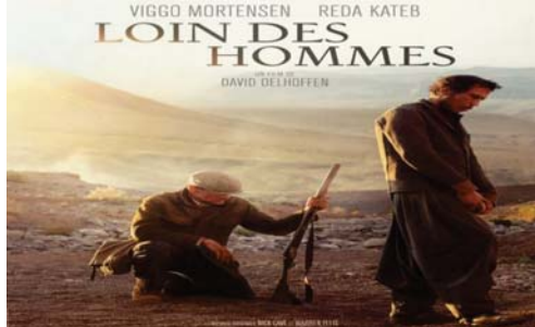
المصق الدعائي للفيلم

الأهم في هذه المعالجة السينمائية هو قدرة أولوهوفن وألوهوفن على التخرج من قصة كامو واتخاذ موقف مغاير وأكثر الفريسي وهو يقتل الأسرى تأييراً في المؤتمر الصحافي الذي أقيم على العرض الفيلم عدّه البعض متحاذياً على الجيش الفرنسي وأنه قد يتسبب في إعادة فتح جراح قديمة