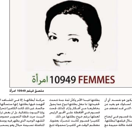
مصق فيلم 10949 امرأة