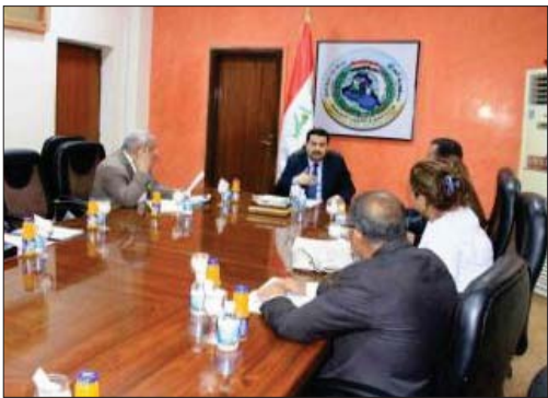
جانب من اجتماع الوزير مع لجنة تنفيذ الخطة الوطنية لصحة العمال

تضمن توفير برامج خاصة بالرعاية والصحة والأمراض المهنية وغيرها... اللجنة الفنية ستكون تتشكل من 15 عضواً