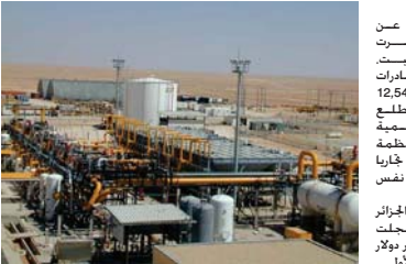
حفل تقصي جزائري

النفط والغاز التي شكلت 93.5 بالمائة من إجمالي الصادرات الجزائرية 42.8 بالمائة إلى 12.54 مليار دولار في المقترة بين كانون الثاني/يناير ويناير/فبراير. وتراجعت قيمة إجمالي الصادرات