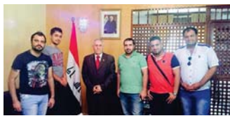
أعضاء الفرقة مع السفير العراقي في المغرب