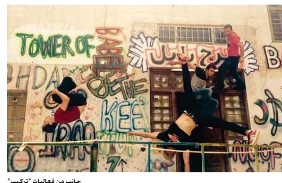
جانب من فعاليات "تركيب"