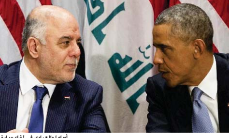
أوباما والعبادي في لقاء سابق

ألفا منظومة صواريخ أميركية خارقة تصل إلى العراق الأسبوع الحالي تغيير استراتيجية الحرب على داعش في اجتماع مرتقب بين العبادي وأوباما