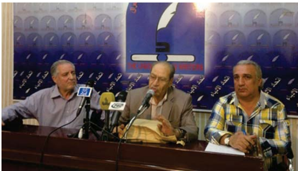
جانب من فعالية سابقة في اتحاد الأدباء