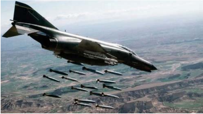
فصخائف السعودية على الحوثيين

تصعيد هجمات المتمردين مع اقتراب محادثات السلام