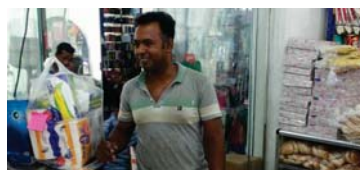
عامل بنفالي في احد الاسواق