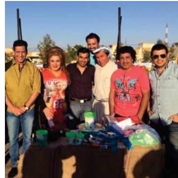
فريق عمل مسلسل " رزق ورق "

مشيرياً إلى أنني أحب جدا العمل مع أخي فقد كتبت له العديد من الاعمال مثل الحكو- صات- ومولة الرئيسة- وقلم هندي- وغيرها.