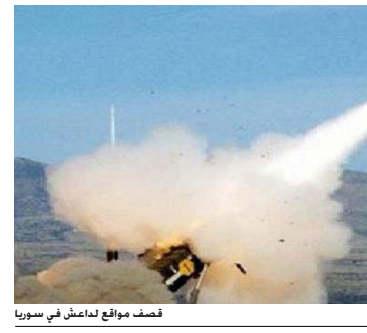
فصخائف السعودية على الحوثيين

بغزة - رويترز: قال مصدر عسكري أول أمس إن تنظيم "داعش" سيطر على مدينة جديدة في ليبيا. وذكرت المصادر أن التنظيم قد تمكن من السيطرة على المدينة بعد معركة شديدة مع القوات الليبية. وأضافت أن المدينة تقع في منطقة الحدود الغربية، وهي منطقة استراتيجية.