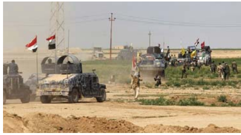
جانب من حشيدات القوات الأمنية قرب الرمادي

صلاح الدين - الأنبار - معار علي: ناضل القوات الأمنية العراقية عملياتها العسكرية لتطهير مدينة الرمادي من تنظيم "داعش". وتعد مدينة الرمادي من أهم معاقل داعش في العراق، حيث أعلنت منظمة "داعش" مقتل القيادي أبو همام البريطاني في مدينة الرمادي. وقالت القوات الأمنية إنها سيطرة على مدينة الرمادي منذ 25 أيار 2015. وتعد مدينة الرمادي من أهم معاقل داعش في العراق، حيث أعلنت منظمة "داعش" مقتل القيادي أبو همام البريطاني في مدينة الرمادي.