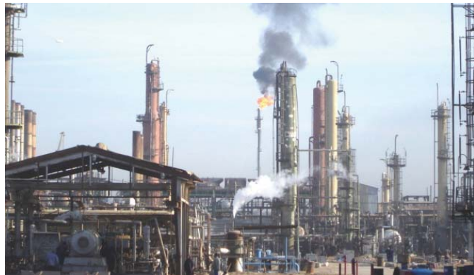
أحدى الوحدات التكريرية في البصرة

الثالث أو الرابع عالمياً» وأضاف عبد المهدي أن «العراق يمتلك احتياطيات مؤكدة من الغاز الطبيعي بمتكليه الخزانات والنفقات والناوية والصفى والشاريع والشركة الكبيرة الأخرى هو أحد الطرق لتطوير اقتصادنا ولاستيعاب الإيدي العاملة الكبيرة الوطنية التي شركات ذات وعلمية بالمستويات والعاير العالمية والتي تسمح لها بالاستثمار في بلدانها.