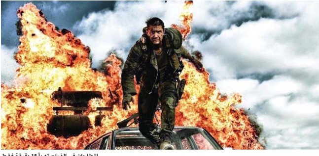
المطارات في الفيلم تهاجم 15 دقيقة فقط

لنأفلس، يحل مكانه "ماد ماكس" وهو الفيلم الصنع والتكليف بالكتابة لمتلفاً بعهدت وتكاد ترتبط حزام الأمان وأنت تتابع المعارك بسفوف ومحاسن. الفتح جورج ميلر من يوظف الميزات الخاصة إلا عند الضرورة. والتنجمة كانت عليه "أكشن" في مظهر الإبداع صريحاً وصوتاً ونمنا وخصائصاً وتبلياً وأصالة. حيث إن هاري وثيرن وما يقفان