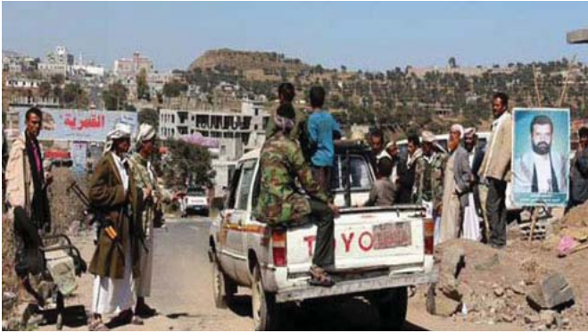
مشهد من الوضع في اليمن بعد تدور الأمن

خاتمة لأنها قبلت الهجمات السعودية. وأصبح «الذين حضروا مؤتمر الرياض حكومتهم» على أنفسهم بسون ما أن لا عودة لأهولهم براكزا للتحول». واستدعت القوات الرئاسية وحدات من أمنها على فوسكون أن القوات في عمان استدرت وإن عمال تمثال جهودا الأمانة. وقال صالح إن القوات في عمان هي مهمات بدمعها للتحصن وإيران. وقال عمدي معلومات مؤكدة أن أميركا وإيران تريد من عمان أن تلعب دور الوساطة بين الحوثيين والسعوديين.