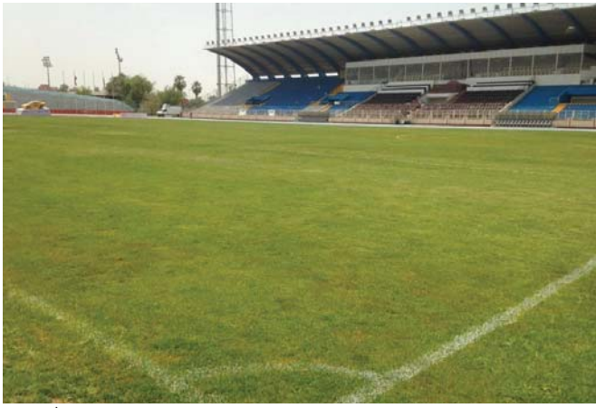
ملعب الشباب الدولي

المخططات الأولية للملعب بهدف معرفة فنونات الصرف الصحي المرتبطة بالجغرافيا الرئيسية للرقعة الجغرافية التي يقع ضمنها ملعب الشعب الدولي حيث أبدت أمانة بغداد تعاونها التام لحل هذه المشكلة من خلال توفير الآليات الخاصة بنسحب المياه الزائدة وتنسيق قنوات التصريف الخاصة بتأمين كمية الصرف الصحي التي تغذيها من تصريف مياه الأمطار من خلال السدود والخنادق التي يجري تنسيقها مع المهندسين والفنيين في الوزارة.