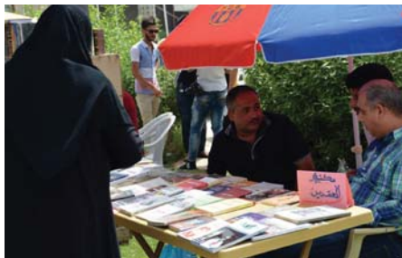
من أجواء افتتاح شارع الفراهيدي في البصرة بعسمة أحمد محمود

مواقع التواصل الاجتماعي، أجزاء من الأرياح والشمس لللمسرة الجديدة التي أسهم فيها عدد من أصحاب المكتبات الذين اقتربوا إرض الشارع بسببهم ندماً للحظة في المحافظة. والفراهيدي، هو الخليل بن أحمد بن عمرو بن تميم الفراهيدي