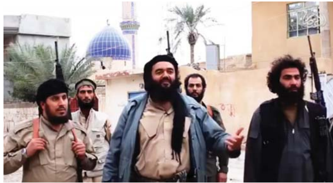
عناصر من داعش في بجبي "أرشيف"