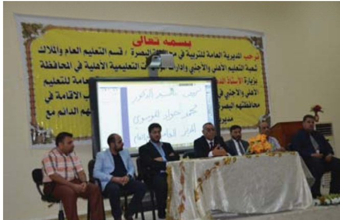
مدير عام التعليم العام والأهلي والأجنبي في وزارة التربية يتحدث في الندوة