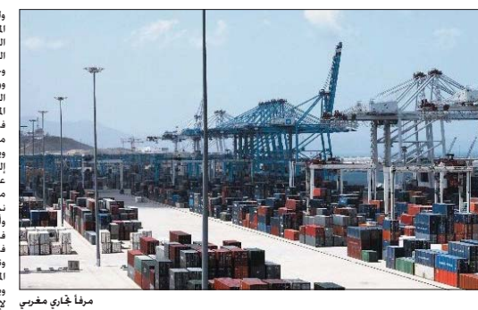
مرفا تجاري مغربي

الثانية. حيث تحطمت الدون إجمالي الناتج المحلي وارت المظلة التي ما فوق 12 في المائة. وأقرب النمو من الصغر في منطقة البورج التي هربت منها والساحة والحيوانات والاستثمارات نحو الضفة الجنوبية للبحر المتوسط. وصادت هذه المرحلة إدخال إصلاحات سياسية واقتصادية وحقوقية وقطاعية كثيرة في المغرب. ساعدت في تحطيم الأزمة وتعافتها التضخمية والاستفادة من الوضع الجديد الذي خرج منه العالم بعد الأزمة. وبات الرباط تطالب بمعد في الأسواق الناشئة. بعدما أصبحت فاعلة اقتصادياً في أفريقيا جنوب الصحراء ولأعيا رئيساً في غرب البحر المتوسط. وساهمت قطاعات الين الجديدة مثل صناعة السيارات وأجزاء الطائرات والتكنولوجيا الحديثة والطائرات الجديدة والأصوات والمصارف والتأمين في تطور الاقتصاد المغربي خلال السنوات العشر الماضية.