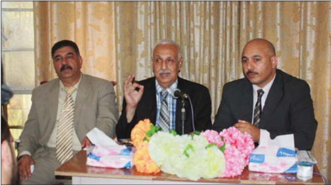
جانب من إحدى الورش المتخصصة بمكافحة الفساد