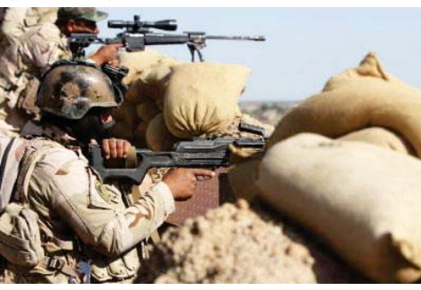
القوات الأمنية في الأنبار

بغداد - الصباح الجديد: أعلنت القيادة المشتركة للقوات العراقية مع منطقة محافظة الأنبار في حين هنا رئيس الوزراء القائد العام للقوات المسلحة جدر العبادي والشعبية بـ"الانتصارات" في بيجي. وقال المكتب الاعلامي لرئيس الوزراء في بيان ورد إلى "الصباح الجديد" ان "القيادة المشتركة للقوات العراقية تعلن بدء عمليات تحرير الأنبار" وشيكا وهاولتا من جيشنا مع استمرار عمليات تطهير المناطق المحيطة بمدينة بيجي". وأعلن عضو مجلس محافظة الأنبار عدال الفهداوي في وقت سابق من يوم امس الثلاثاء (26 أيار 2015)، أن القوات الأمنية قطعت جميع خطوط امداد