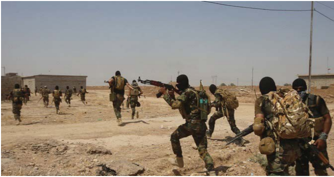
قوات الحشد الشعبي في بييجي