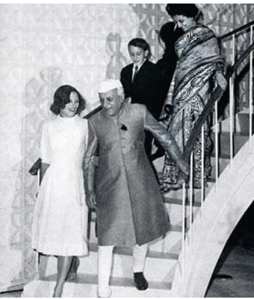
الي اليسار مع والدته بحسبة نهرو والي اليمين في كرواتيا مع مادلين أولبرايت

شخصية معه، ولكن كنت أفراً ماقلته قانونية والديموقراطية لرماتها. لقد كان ذلك مثلاً عاماً قد فهم منه أن حكومة الإقليم الحق فيها وقته وشره وتبع أيضاً من خلال الفضل أن كتابه هو أحد الذين شاركوا في وضع الدستور، وكان لا أستمر في الخطأ - إن كنت مخطئاً - أرسلت له الرسالة التي نشرتها في كانون الثاني 2008 وأجرت به باتي مهندس وسعت بحثنا بالسياسة أو المهندسين وجتة إن يستعد في مؤتمرين إن الخطأ فيما كثرته في الدراسة لأصبح لنفسني وأسبغها إن كان هناك خطأ فأجبت مشكوراً في 2008/7/20 برسالة ضمنها: "بدون لأوجه أية أخطاء في كتابكم وأنا تاني في الأبحاث!" نحن الآن عندما نقول حكومة الإقليم، (أو أي فرد، إن الدستور يسمح لها ما قامت به لا تكون هي ولا غيرها ككف يسمح لها بذلك بوجود المادة (111) منه.