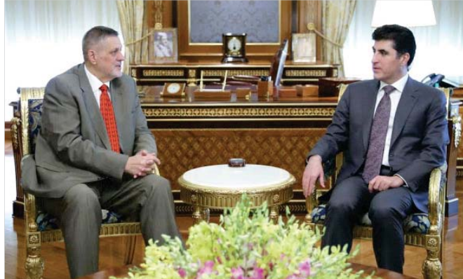
نجيرفان مع الممثل الخاص للأمين العام للأمم المتحدة في العراق يان كويتش

أشار نجيرفان إلى زيارات الوفود الإيطالية الراجعة السنوية إلى إقليم كردستان خلال الأشهر الماضية، مؤكداً أن العلاقات الجيدة بين العراق وإقليم كردستان من شأنها أن تساهم في تحقيق التنمية الاقتصادية والاجتماعية في المنطقة، وحث الجانبين على التعاون في المجالات الاقتصادية والاجتماعية المشتركة.