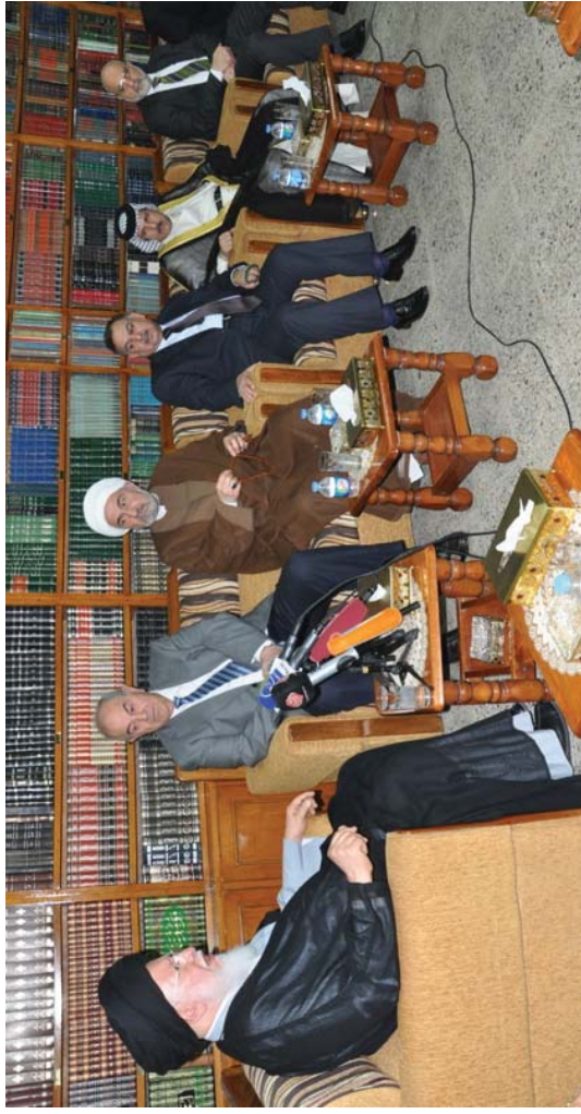
خلال استقبال سماحته الدكتور إيد علاوي رئيس الجمهورية والوفد المرافق له