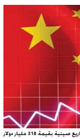
مشاريع صينية بقيمة 318 مليار دولار

بكين - وكالات: أصدرت وكالة التخطيط الحكومية في الصين قائمة تضم أكثر من ألف مشروع مقترح بقيمة 1.97 تريليون يوان (317.75 مليار دولار) تدعو مستثمري القطاع الخاص إلى المساهمة في تمويلها وتنفيذها. والتنمية والإصلاح الوطنية بأن المشاريع البالغ عددها 1043 مشروعا وتشتمل قطاعات النقل والبنية التحتية العامة، مستغفة بالشراكة بين القطاعين العام والخاص. ولم يوضح بيان اللجنة الذي نشر على موقعها الإلكتروني إن كانت الدعوة تشمل شركات أجنبية. ومع تباطؤ الاقتصاد لتجأ الصين في شكل متزايد إلى الشراكة بين القطاعين العام والخاص برغم عدم شيوخ هذا النموذج لسد الفجوة التصنيعية التنموية في وقت تسعى بكين إلى الحد من الطرق التقليدية لتحويل خارج الموازنة التي تستخدمها الحكومات المحلية. وتشمل القائمة مشاريع في 29 منطقة من بينها حيفانغشي وتسعى الصين إلى تقليص ديون الحكومات المحلية التي تقدر بنحو ثلاثة تريليونات دولار، لكن ثمة بوادر