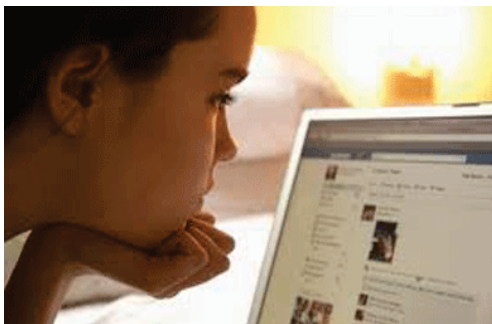
صور وأسماء مستعارة للنساء في التواصل الاجتماعي

حافظت على بنيتها وان صورتها غاب عن تكشيف للفبر بدأت الرجل و اذا يعرف اسمها بعد مصيبة... الاسم المستعار لا اكثر