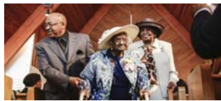
أنت استمتع بحضرتها وحكمتها العريقة بعكسها طريقا طويلا عام 1899. سارت تيريه أميركا منذ ولايتها