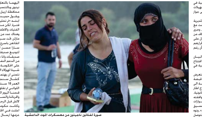
صورة لفتاتين ناجيتين من معسكرات الموت داعش