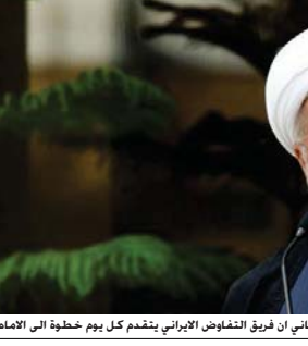
قال روحاني ان فريق التفاوض الإيراني يتقدم كل يوم خطوة الى الامام

اعلم الرئيس الإيراني حسن روحاني يوم أمس الثلاثاء ان غالبية الإيرانيين يريدون السلام مع سائر العالم مادفا جمهورية النوية الجارية حاليا مع القوى الكبرى.