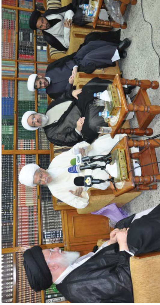
خلال استقبال سماحته الشيخ عفيف النابلسي والوفد المرافق

المرجع الديني آية الله الفقيه السيد حسين اسماعيل الصدر "دام ظلّه":