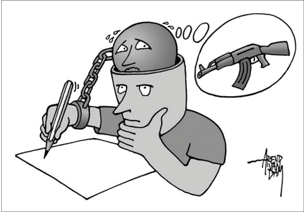
عن موقع «كارتون سياسي»