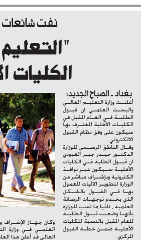
بغداد - الصباح الجديد: أعلنت وزارة التعليم العالي...

وقول حكاية كاميرون انه من المتوق ان توفّر مبادرته 800 ألف جنيهه استرليني في العام بالمجملة 4 ملايين استرليني بمعدل عام 2020 ومن شأن الفشار جيميد زياذة راتبه والقرار حتى نهاية مدة البرلمان الحالي مما جعل التجديد قائما لدة فعد كامل من الزمن كما يشمل ذلك رواتب الوزراء الاعضاء في البرلمان وقال كاميرون ان الفشار باتي ضمن «مبدأ الأمة الواحدة» في التعامل مع جزر المازنة العامة. وبصيح وتوقع «كل من يعملون بحد ان يستفيدوه» على وجه من مقالة «لا يمكن الظهار بان الطريق ليس طويلا لقد قضينا عجز المازنة إلى النصف. وما زال لدينا نصف آخر نستثمر في اتخاذ القرارات الصعبة التي من شأنها ختم فعد منذ خمس سنوات وأريد ان أطمئن الناس ان ذلك ولم يتغير هذا الأمر الآن». كما سدد كاميرون في مقالة علم على ان ابرته الجديدة ستسهم بأكثر من مجرد تحقيق توازن في الميزانية «ولقد «بعد إعادة الانتخاب وبعد خمس سنوات من الخطط الانتخابية وتنصيحنا البريطانييين نحن على وشك ان ننشهد شيئا مختلفا ومبرزا».