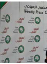
الناطق الاعلامي لوزارة الشباب والرياضة