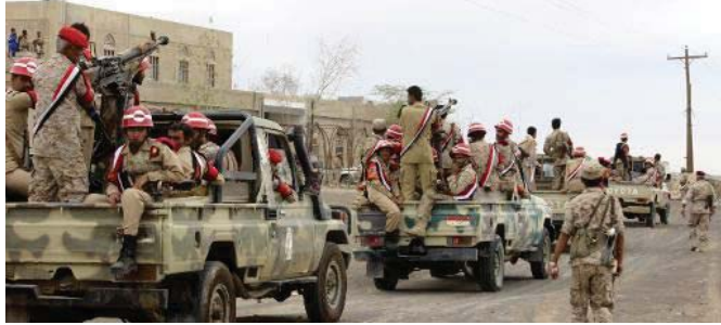
جنود الموالين للريثيس اليمني عمده يه منصور هادي في عرض عسكري في مأرب

لوبيًا الحوثيين بمقتل عدد من الصحفيين مع معتقلين آخرين مستخدمين باصطحابهم دعوى بشرية في مخزن أسلحة تابعة للحوثيين في جبل هزان بمدينة نامل. لكن حامد قاسم القيادي في الحركة الحوثية، نفى في تصريح لسي بي سي تلك الاتهامات واعتبرها «تجبر الحوثيين في مستمعنا لتهرب الحوثيين في استخدام صحفيين دعوى بشرية لغارات الميلاتارات السعودية». وقال إن العدوان السعودي لا يفرق بين أهداف مدينة أو عسكريه، ولا بين صحفيين أو مقاتلين أو مدنيين.