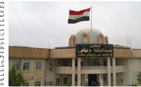
مبنى مجلس محافظة ديالى

من مجلس النواب علما انها غير شنت غنسة الثقافة والاعمال النيابية حجوماً على هيئة الاعلام والاتصالات. وفيما تقدمت عملها في «الراضي» التهمت المستشار القانوني مجلس النواب بدعم الاعلام العراقي بشيء.