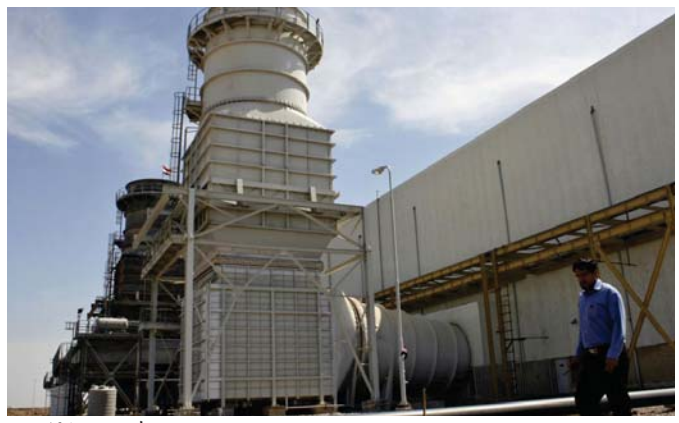
احدى المحطات الكهربائية في العراق

ذلك القرار المستشفيات على أن تتسدد ما بذمتها من فواتير خلال ثلاثة أشهر وإزالة التجاوزات، وعلى من يلغى استئصال التعادف مع وزارة الكهرباء لغرض تزويده بكهرباء مستمرة مقابل سعر جاري و غير مدموم.