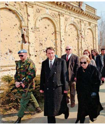
الي اليسار مع والدته بحسبة نهرو والي اليمين في كرواتيا مع مادلين أولبرايت

منه)، وعقد طق طق مع شركة جنينل إنرجي الكندية، وهي أثناء نشأتها الدستور، بالمسح (ويحتل ما أراه المادة الأكرار في حجة الجود، هو ضمان ملكية الإقليم للنفط الموجود في كردستان، لم يتحقق أمداً، وإما جاء الدستور بصيغة عاكسة لما أتراه كالتالي وذلك في المادة (111) منه إن أقرته كالتالي لا بحق مصالح الأكرار قبل العرب وإن المادة (111) جاءت متوازنة وبصياغة الإجماع (4) مستخدماً ما أورده في نهاية الفقرة الثانية) (السابقة حول محاولة فهم خليفة طلب حكومة الإقليم من شركة DNO استبعاد كالتالي عن عقد قبل طواقي أرى عقود أخرى لشركة DNO في العراق، وتلك عند إعادة هيكلة العقد وتعديله في 2008/9/10 وهو أمر مخرجاً من حساب ظاهر الآجور "يتمسح" بالمشكلة حتى صيغة "القبالة" التي قدمها للكر في صياغة مواد الدستور، الأقرت بحيث إن كل جهة أهدت تسير وقفاً! كندت قد نشرت في 2007/5/9 دراستي "سرة لثالثة - ملاحظات حول مسودة الدستور"، حيث أوردت أن المادة (111) لا تسمح بالإقليم للنفط الموجود في كردستان، بل يجب أن يملكه الإقليم 5%