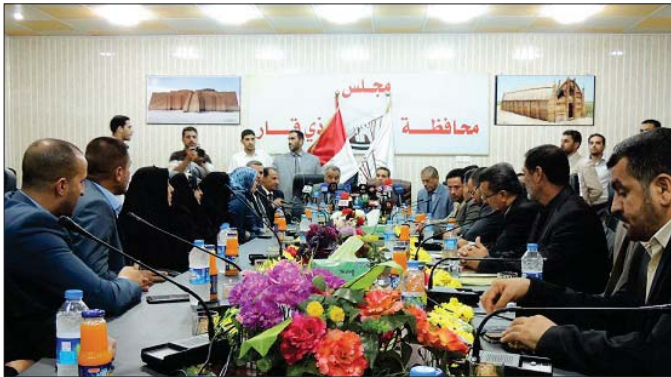
مجلس محافظة ذي قار