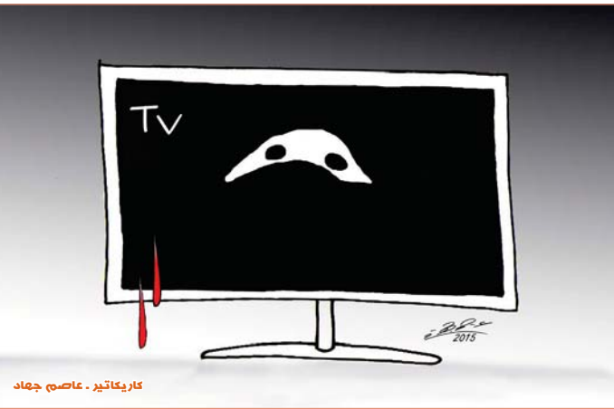
كاريكاتير - عصام جهاد

نيويورك - أ ف ب: بينت نتائج دراسة علمية أن الذين يتناولون المأكولات البحرية بصورة منتظمة يعيشون أطول من الآخرين، نادراً ما يعانون من أمراض القلب والأوعية الدموية. هذا الاستنتاج توصل إليه علماء جامعة هارفرد الأميركية، الذين درسوا المعلومات الطبية عن حالة القلب والأوعية الدموية الخاصة بـ14 ألفاً من أشخاص من مواطني الولايات المتحدة. أعمرهم 65 سنة وأكثر. تضمنت هذه الدراسة التي استمرت 16 سنة قياس ضغط الدم بصورة دورية منتظمة وتقييم الدم وتسجيل حالات الإصابة بأمراض القلب والأوعية الدموية وإسباب الوفاة. قسم الخبراء المشتركين في الدراسة إلى مجموعتين: المجموعة الأولى ضمت "محبو المأكولات البحرية"، والمجموعة الثانية ضمت "محبو المأكولات غير البحرية". بيّنت الإحصائيات الخاصة بأمراض المشتركين وطول أعمارهم، أن "محبو المأكولات البحرية" يعانون من مشاكل القلب والأوعية الدموية أقل من أفراد المجموعة الثانية بنسبة 30 بالمائة، وكذلك بالنسبة إلى عدد الإصابات بالجلطات الدماغية واحتشاء عضلة القلب وفقر الدم. الشريان التاجي (الرجة الصدرية) يقول الباحثون في نتائج الدراسة التي نشرتها في مجلة "Annals of Internal Medicine"، أن تناول الأسماك البحرية بصورة منتظمة وديرة يعتبر من الحمايات الغذائية الصحية.