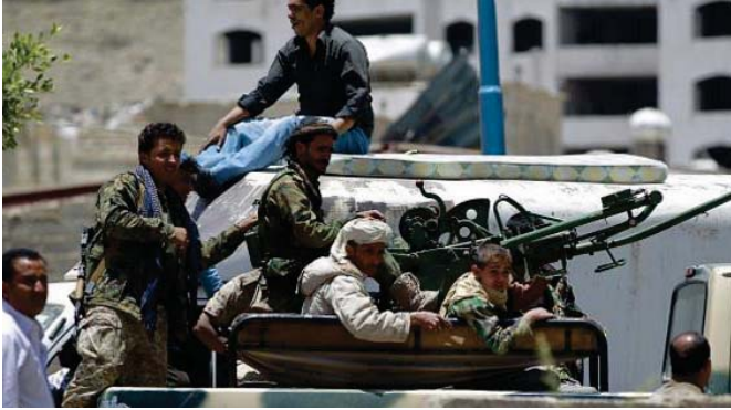
مسلمون حوثيون قرب مطار صنعاء

تعرّضوا لاستهداف الشاحنة والقالت إنها تعرضت لبرائن مجهولة أثناء الاشتباكات التي نشهها اليمنى وكانت الحكومة اليمنية اهتمت بيمن أصدرته الأحدث الحوثيون ومن وصفهم بميليشيات على بعد الله صالح بارئلك ما سمعته برحمن إفادة حثه مسكان عمينة تعز وهيات مجلس الأمن اليمني تقز وهيات لجنة التخل الجنديين في تعز وعن وجهة اللن التي تعترض لتصف الحوثيين وحلفائهم.