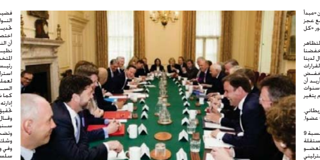
اجتماع للحكومة البريطانية برئاسة ديفيد كاميرون

وفي قلب هذه الإجراءات خطط جديدة جعل العمل غير الشريعي جريمة جنائية متهمة إذ انها تعد حاليا جنحا في القانون البريطاني ويستوجب عليه مصادرة المبروفة مصادرة وحظر أمور العاملين الشريعيين. وقال كاميرون أنه بات من السهول جدا على المهاجرين غير الشريعيين استغلال الفجرات في النظام وأضاف كاميرون أنه مستغرب تغيرات في نظام الرعاية الاجتماعية للحد من أعداد القادمين من بلدان الإخاء الأوروبي الأخرى.