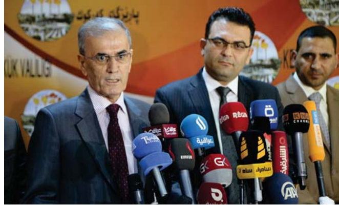
وزير الهجرة يدعو الحكومة الاتحادية لدعم كركوك

وقد توفير سوية فنية، فإجراءاتنا هي مستمرة. وقال وزير الهجرة، كركوك وهي ثاني وفق المستور. وقال وزير الهجرة كركوك وهو ثاني وفق المستور. وقال وزير الهجرة كركوك وهو ثاني وفق المستور.