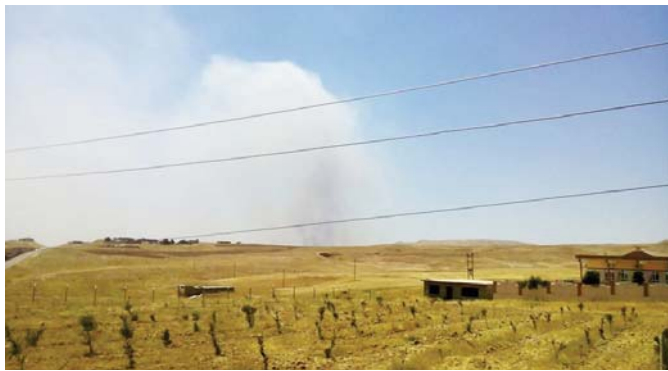
حقل التوتهمها النيران في سهل نينوى