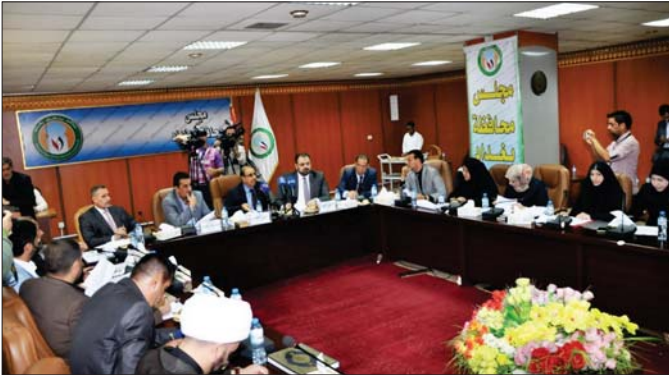
أحد اجتماعات مجلس محافظة بغداد "ارشيف"

والعمال الحريية لكي يكون مليا لتفويض... وأشار الباسري الى أن جُنان التعويضات ركزت على الموضوع تخفيض الكرتية التي التوجهها القانون اجه الحجاب العراقية... الكرتية اصغر للملابس... تعويضات الاصطرار للملابس اصافة... المحاطات وفق الآيات صرف جديدة... الشهوده البرنامية الاسراع بإقرار القانون المعدل