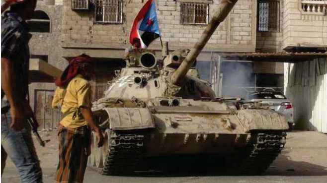
الجنان الشيعية تقاثل ميليشيات الحوثي وحاصل

من أنه لم يتأكد حتى الآن من حصول كل الأطراف. وقال الأمين العام للأمم المتحدة بان كي مون إن لقاء 28 من أعضاء الجمعية العامة للأمم المتحدة في صنعاء سيبدأ يوم 23 أيار. وأضاف الأمين العام للأمم المتحدة بان كي مون إن لقاء 28 من أعضاء الجمعية العامة للأمم المتحدة في صنعاء سيبدأ يوم 23 أيار. وأضاف الأمين العام للأمم المتحدة بان كي مون إن لقاء 28 من أعضاء الجمعية العامة للأمم المتحدة في صنعاء سيبدأ يوم 23 أيار.