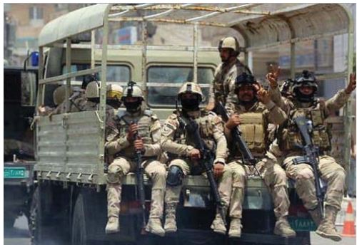
عناصر من الجيش العراقي في بيجي

القوات الأمنية حققت تقدماً ملحوظاً في هذه العملية وتمكنت من إزال علم التنظيم المسلح الذي كان مرفوعاً على برج للاتصالات وسط منطقة الحجاج ورفعتم العلم العراقي بدلاً منه