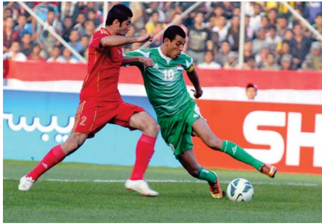
جانب من مباراة سابقة للعراق وسوريا