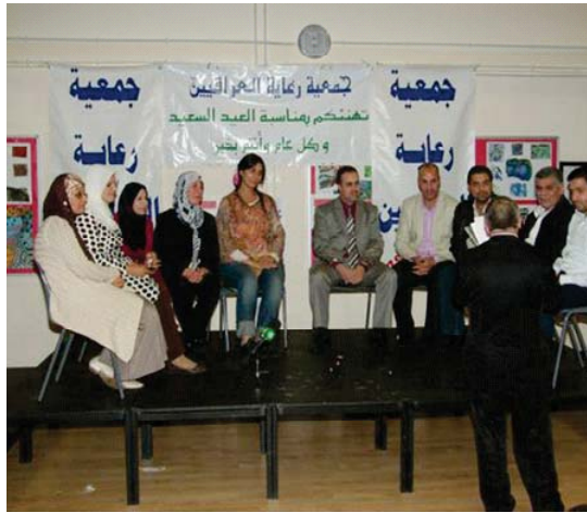
جانب من لقاءات أعضاء جمعية رعاية العراقيين في المملكة المتحدة