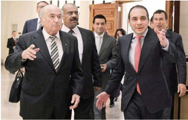
بلاتر في لقاء مع سق بن الحسين

الإمبراطورية بشرط إعلان المصمم الكامل من الإحداث العربية للوقوف بجوار الأبرع على في هذه الموقعة التي بات فيها وجهها لوجه أمام بلاتر. وقال فيجو في صفحته بـتويتر: «أنا فخور بما فعلنا معاً، لم يكن هناك أي نقاشات أو مفاوضات». وأضاف: «جئت تفكر في شخصي ومشاركة الأبرع مع اثنين من المهنيين الآخرين في هذه العملية. أعتقد أن ما سيحدث يوم 29 الجاري في زيورخ ليس عملية انتخابية طبيعية، لأنها لن تكون حرة فأن خارج الحسابات». وبعد انساب فيجو أصبح الأمير الأجنبي على بن الحسين هو المرشح الوحيد في مواجهة السويسري السيد بلاتر الرئيس الحالي للفيفا. وقال فيجو: «أنا سعيد بما فعلنا معاً، لم يكن هناك أي نقاشات أو مفاوضات». وأضاف: «جئت تفكر في شخصي ومشاركة الأبرع مع اثنين من المهنيين الآخرين في هذه العملية. أعتقد أن ما سيحدث يوم 29 الجاري في زيورخ ليس عملية انتخابية طبيعية، لأنها لن تكون حرة فأن خارج الحسابات». وبعد انساب فيجو أصبح الأمير الأجنبي على بن الحسين هو المرشح الوحيد في مواجهة السويسري السيد بلاتر الرئيس الحالي للفيفا. وقال فيجو: «أنا سعيد بما فعلنا معاً، لم يكن هناك أي نقاشات أو مفاوضات». وأضاف: «جئت تفكر في شخصي ومشاركة الأبرع مع اثنين من المهنيين الآخرين في هذه العملية. أعتقد أن ما سيحدث يوم 29 الجاري في زيورخ ليس عملية انتخابية طبيعية، لأنها لن تكون حرة فأن خارج الحسابات».