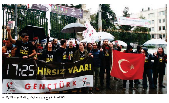
تظاهرة جموع من معارضي الحكومة التركية

أكدت وكالة دوجان للأخبار أن الشرطة التركية شنت عملية يوم الجمعة لتفكيك 80 معتقلا نحو 80 رجل أعمال في إطار تحقيق يستهدف أعضاء حزب الله الذين انتمى في الولايات المتحدة فتح الله غولن الذي كان حليفاً للرئيس جيب بوش. وركزت قوات الشرطة على اعتقال 20 شخصا بينهم قائد سابق.