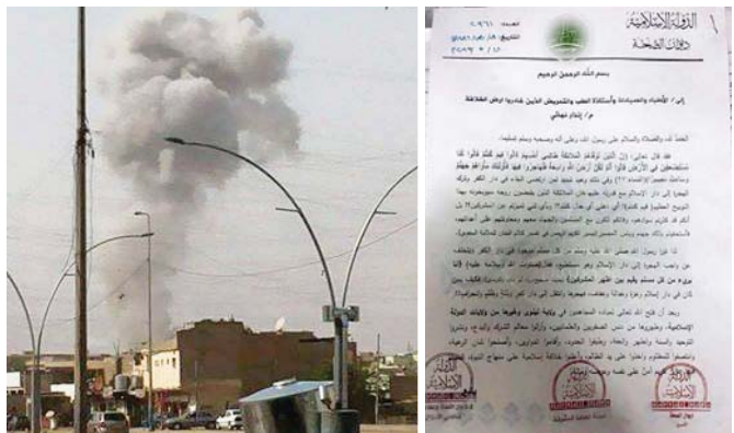
جانب من الضربة الجوية ثخان داعش في الموصل

بغداد - الصباح الجديد: تفقد وزير الدفاع خالد العبيدي قاعدة الحبيانية وناحية الخالدية في محافظة الأنبار على رأس وفد عسكري رفيع فيما التقى بالمتنسين ومحتوحي المعدات الشعبي المتواجدين في "ساحات القتال" وقالت وزارة الدفاع في بيان ورد إلى "الصباح الجديد" إن "وزير الدفاع خالد متعب العبيدي تفقد قاعدة الحبيانية وناحية الخالدية في محافظة الأنبار على رأس وفد ضم محافظ الأنبار ومصطفى وهيب العبيدي، قائد الجيش وبعثون يترأس (أركان الدفاع) لمقاتلي الجبهة الإسلامية وكبار ضباط وزارة الدفاع" وأضافته الوزير في تعقيبته "التقى بالمتنسين والمواطنين في ساحة القتال ومتطوعي الحشد الشعبي المتواجدين في قاعدة الحبيانية" وكتبت وزارة الدفاع أعلنت في 18 أيار 2015، وصول أرتال من العيادات والدمرات إلى معسكر الحبيانية شرق الرمادي استعداداً لخبر المدينة من تنظيم "داعش".