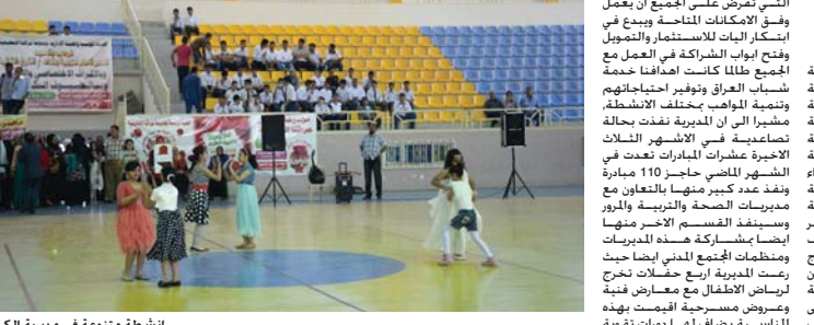
تنشيط متنوعة في مديرية الكرخ