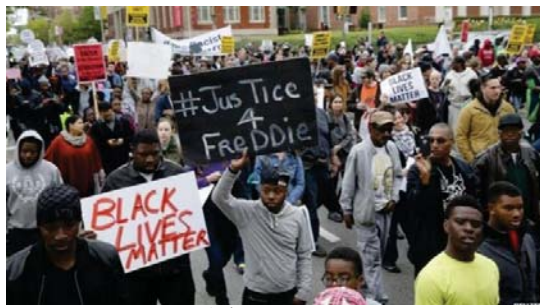
دب المحتجون على التظاهرة كل يوم منذ وفاة غراي

وجهت للمحاكمة ووصفها بأنها تدخل غير مقبول في شؤون مصر الخالية بعد وتمم أحكام المرسي القضاء المصري.