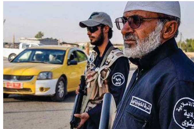
شرطة داعش في نينوى "ارشيف"

نينوى - خدر خلافة: استطاع تنظيم داعش الارهابي لاطلاق قناة ارشيف اسمها "الخلافة" من مركزه في مدينة الموصل، وفيما يستعرض قواته للمرة الثالثة بضعون اسبوعين فيباب الطيران العراقي والبولي صعد التنظيم من حمله انتقامه لاهل نينوى فتهجم على الاضام لصفوه. وقال مصدر امثي العراقي محافظة نينوى ان الصباح الجديد ان "تنظيم داعش الارهابي استعرض العشرات من عجلاته المسلحة برفقة العشرات من مقاتليه الملتزمين في مركز ناحية حمام العليل (30 كلم جنوب الموصل في خطوة تعد الثالثة من نوعها خلال اسبوعين".