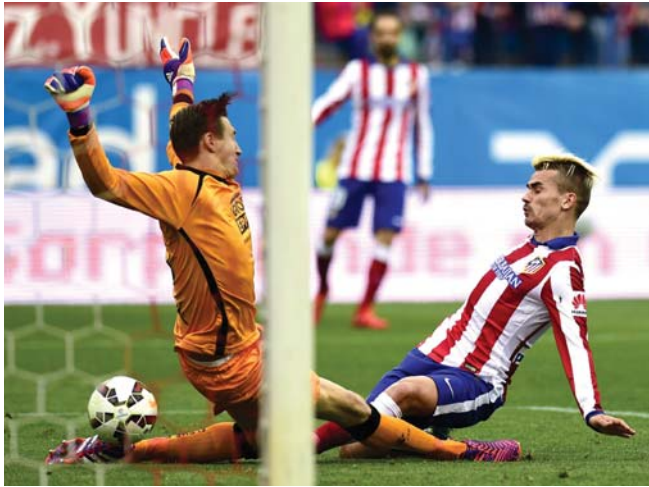
لحظة من مباراة أتليتيكو مدريد أمام أتليتيكو