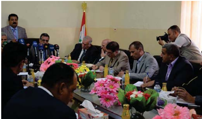
أحدى اجتماعات وزير الكهرباء بعدد من مسؤولي الوزارة