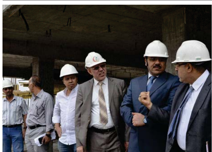
مدير عام دائرة صحة البصرة أثناء زيارته لمشروع الجراحي بمستشفى البصرة العام

في رفع مستنويات الازاء للاقتصاد الوطني من خلال انتاجها الذي تعدد شركة الصمود العامة للصناعات الفولاذية احدي شركات وزارة الصناعة والمعادن وشركات وزارة الطاقة والبراقات الحديسية ومعامل الهياكل وانشاء وتصنيع الفولاذ بشتى انواعه وبوسائل السبائك الحديثة والصب المستمر والرفرفة للمقاطع ذات المقاسات الخفيفة ودرجعة الصفايح والخطرق الدوار ومعامل الخطرق الحر والخطرق الانزاح الطرورق وتلك سببتم استيراد خطوط انتاج جديدة لعمول الكريستال خاص بانتاج الاعمدة المبركورة حيث ان اعمدة المناطق الابرية مختلفة عن اعمدة المناطق السبائية و