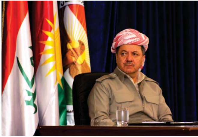
رئيس اقليم كردستان مسعود بارزاني

اريل - الصباح الجديد: قال رئيس اقليم كردستان مسعود بارزاني السبت إن داعش يهاجم الاقليم لوقف تقدمه العمراني ومع حسم المادة الدستورية المتعلقة بشأن المناطق المتنازع عليها مشيراً الى ان العمل جار لتحويل سنجار محافظة وتوجه الجميع نحو البناء. واوضح بارزاني خلال لقائه بوجهاء وجهاء وجمعيه صوك اسه بعد عام 1991 وخاصة بعد عام 2003 كان الهدف ان لا تطلق اطلاقاً واحدة في كردستان بل ان ينجز الجميع الى اعادة اعمار كردستان. واضاف ان «اهداف ايرهابي داعش من هجومهم على كردستان من إيقاف عجلة التطور والقدم في إقليم كردستان والوقوف بوجه تطبيق المادة 140 من الدستور العراقي». وأشار الى ان «الفصحة الكردية حققت تقدماً وتطوراً كبيراً وسيبقى ذلك ينسحق أعناق الكرد وبكل السبل الى إيقاف عجلة التطور هذه لكن مسألة وطولت وصموده وبشمركة كردستان وماء وتضحيات وفاق قوات البشمركة وهذا الدم الوطني اقليم كردستان اجوش أهداف ومسامي ايرهابيين واعاد كردستان». واكد ان «الحظر على الاقليم مازال قائماً واصفاً بقاء داعش بالوقود» لافتاً الى ان «داعش اعلن كلفه له اعلان للحضور انه على اطلاع اعطاهم والهمهم بشاكرنا مؤكداً أنهم في الوقت المناسب سيؤكفوا من ايرهابهم». وتنصت ريسين ومها ايقاف عجلة التطور والقدم في إقليم كردستان والوقوف بوجه تطبيق المادة 140 من الدستور العراقي. ويشان الكرد الايزيديين اكد بارزاني ان الايزيديين كره اضاء وافحاح ويجب مراعاة خصوصيتهم الدينية. ويجب ان يقرروا ما يفتنهم مبرهه» كما وأشار الى «ان العمل جار على جعل في البرنامج العمل على جعل سنجار محافظة». وكان بارزاني قد اجتمع الخميس