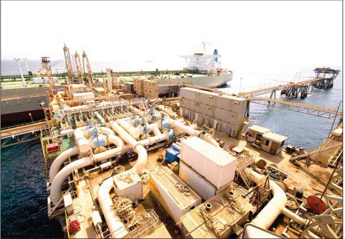
منصة بحرية لتصدير الخام العراقي

ونقل التقرير عن مصدر ملاحى لم يذكر اسمه. إن "معدل تدفق النفط العراقي عبر الخط بلغ 650 ألف برميل يومياً، ممينا ما "بيانات التحميل أظهرت أن معدل الإمدادات بلغ نحو 450 ألف برميل يومياً في وقت سابق من هذا العام لكنه ارتفع بقوة في الأيام القليلة الماضية".