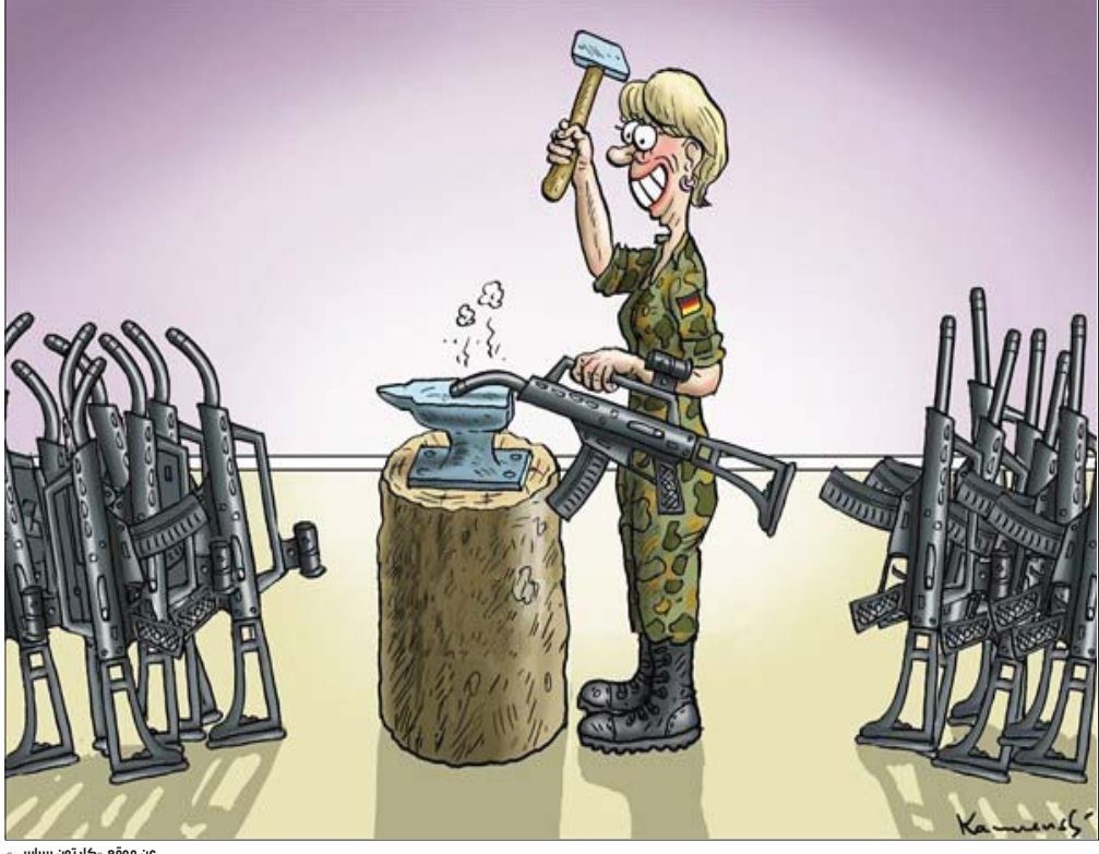
عن موقع «كارتون سياسي»