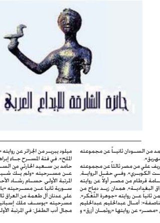
جائزة الشارقة للإبداع العربي