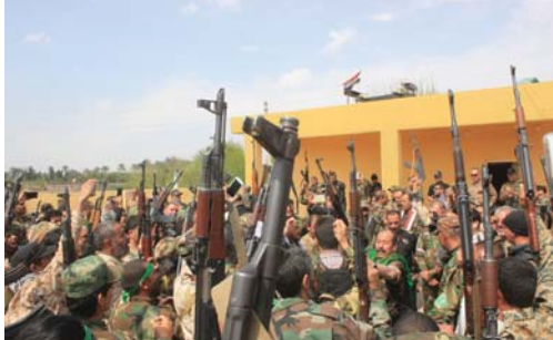
عناصر من الحشد الشعبي

ديالى في محاولة بالتمسك رغم انه دفع أكثر من 500 شهيد وضعف هذه العمد من الجرحى لنحير محافظنا من سطوة داعش وأمين عوننا اليها. مبيانا ان «هناك آلاف من شباب المناطق المحررة يسعون للانضمام في صفوف الحشد لحماية مناطقهم...»