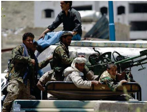
مسلحون حوثيون خلال واجب عسكري في صنعاء

وقالت مصادر عسكرية وشهود عيان لهيئة الأتاع البريطانية إن المارمق قد خزن للأسلحة في بين جبال خمتصة في منطقة سنخان التي تبعد 25 كيلومترا من العاصمة صنعاء.