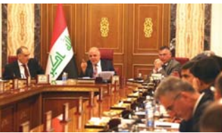
اجتماع سابق لمجلس الوزراء

بغداد - الصباح الجديد: أعلن محافظ البنك المركزي وكالة علي العلقان ان مشروع قانون مكافحة غسيل الأموال في مجلس شورى الدولة حالياً. بعد اجازته من قبل المجلس المركزي على أمل طرحه في مجلس الوزراء وتم إلى المجلس النواب للتشريع. وحذر العلقان في تصريح صحفي من أن العراق يتوقع في القادة السوريين إن تم طرح مشروع مكافحة غسيل الأموال، مؤكداً أن «البنك المركزي سعد بإمكاناته في مكافحة غسيل الأموال».