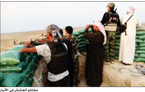
مقاتلو العشائر في الأنبار

بغداد - وعد الشري: أعلن مجلس القوى العراقية، أمس الأحد، عن موافقة رئيس الوزراء حيدر العبادي على تطوع 10 آلاف من مقاتلي عشائر الأنبار ضمن تشكيلات الحشد الشعبي، مؤكداً خبيرهم بالسلاح الخفيفة والأسلحة والتوسيع والتفجئة، لأننا في تشكيل لجنة لهذا الغرض في غضون يومين، فالتفجئة من قبل الفئات العمرية والشبابية، والخطط مهيأة لتحويل عناصر العشائر المقاتلين بجانب القوات الامنية، إلى مؤسسات رسمية ضمن القيادة العامة للقوات المسلحة، بدلاً من حالة الفوضى التي يعانون منها حالياً".